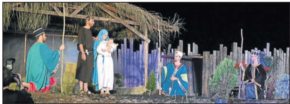
A sexta edição do espetáculo Natal Iluminado aconteceu no sábado, dia 17