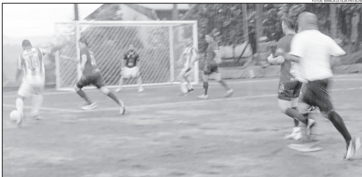
Chuva marcou as decisões de sábado

A maior goleada da tarde foi no jogo entre Anjos da Noite e Xernobyl, que disputaram o título da 1ª Divisão sob chuva. No primeiro confronto, o Anjos da Noite venceu por 1