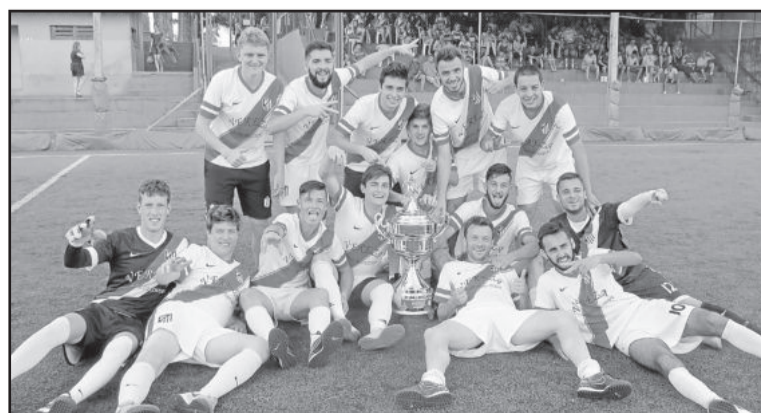
Brocadores venceu a partida e conquistou a 3ª Divisão