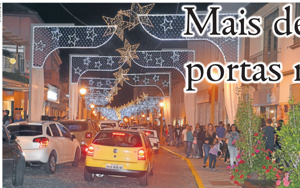
3ª Noite Branca de Garibaldi reuniu um expressivo público

A 3ª Noite Branca de Garibaldi superou todas as expectativas dos organizadores, com mais de cem lojas abertas, na noite de 15 de dezembro, quinta-feira. Os estabelecimentos permaneceram abertos até às 22h30min. Os lojistas ofereceram brindes aos clientes, além de surpresas como atrações musicais, teatro, dança do ventre,