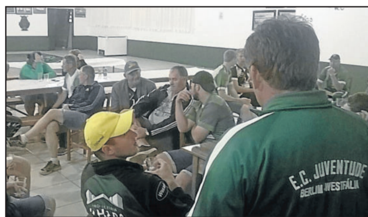
Na quarta-feira, dia 14, galinhada