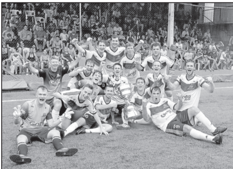
Bud FC ficou campeão na 2ª Divisão após vitória por 3 a 1