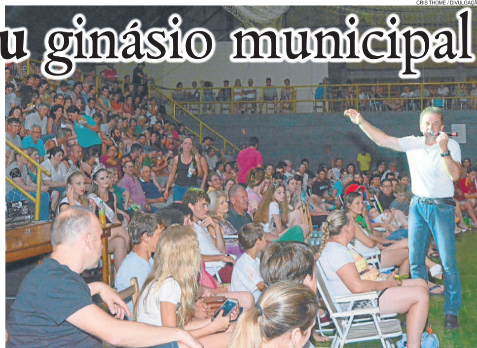
Público compareceu e prestigiou as atrações