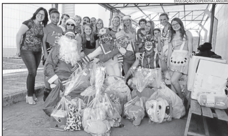
Além da doação de roupas, alimentos e cestas de Natal, colaboradores ofereceram atenção e carinho às crianças