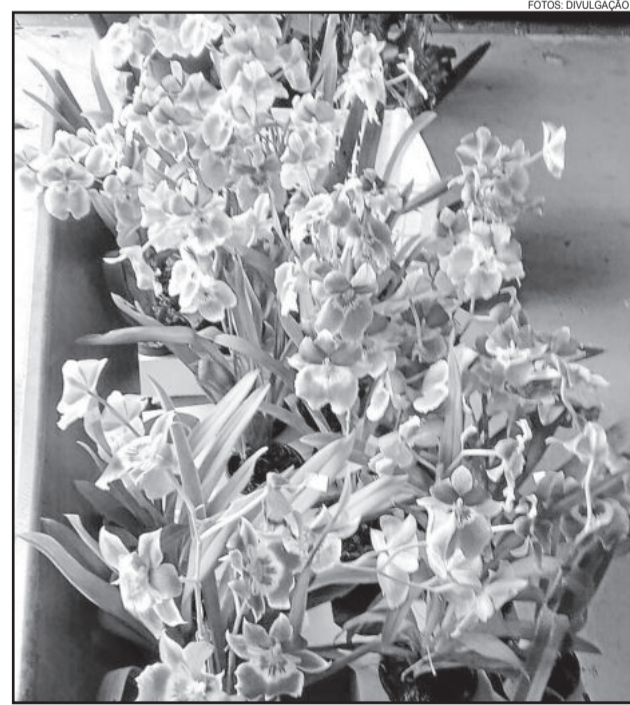
Orquídeas foram a atração do fim de semana no Centro Administrativo de Teutônia