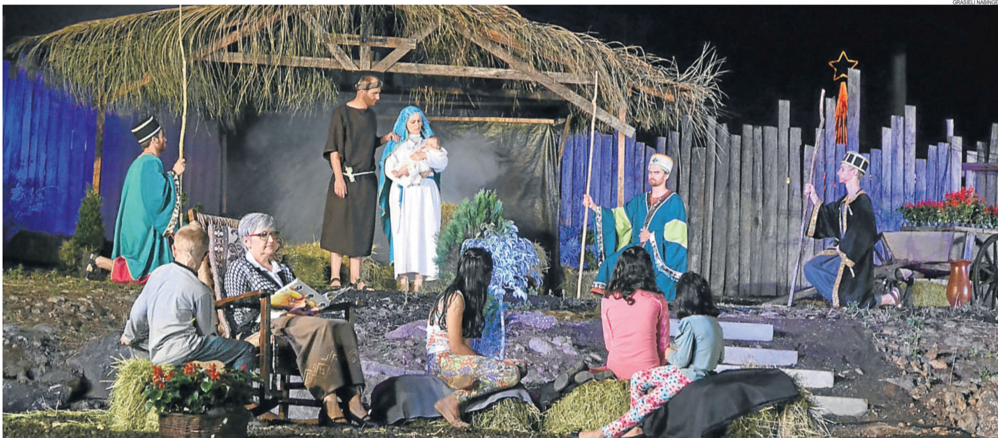
Espectáculo teatral "Esperança", que teve a direção de Marcelo Brentano, contou a história do nascimento do Menino Jesus. WESTFÁLIA > 4 E 5