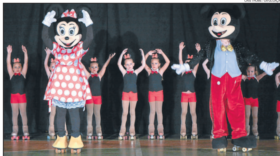
Show de patinação "A Magia da Disney" foi apresentado pelo grupo Delizart

As aulas de patinação ocorrem aos sábados pela manhã e são oferecidas pela Associação Cultural de Imigrante.