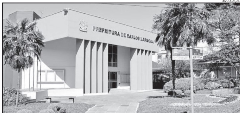
Alterações de horários são na Tesouraria e na Tributação