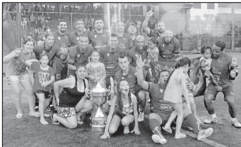
Anjos da Noite comemorou o título da 1ª Divisão

Ao final dos jogos, os destaques receberam sua premiação em tradicional cerimônia realizada pela Soges.