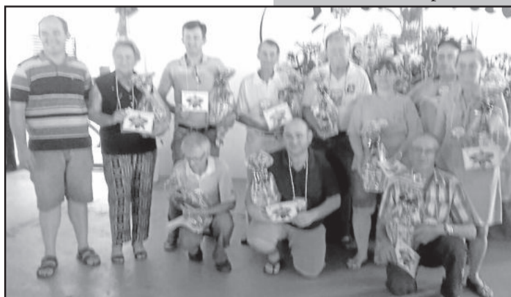
Premiados na exposição

Teutônia e do Polo dos Vales da Federação Gaúcha de Orquidófilos (FGO).