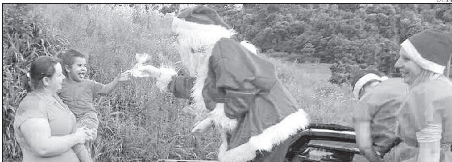
Papai Noel voluntário já visitou crianças de Westfália em duas oportunidades