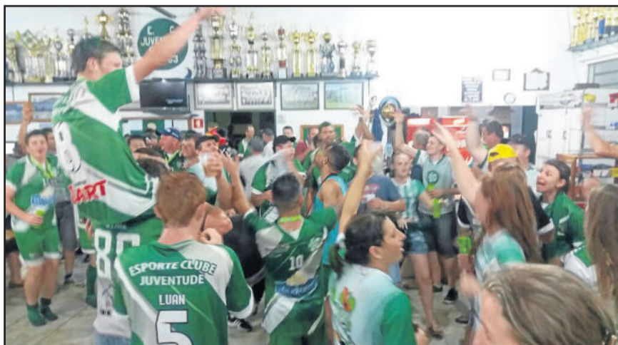
Na segunda-feira, dia 12, carreata e festa