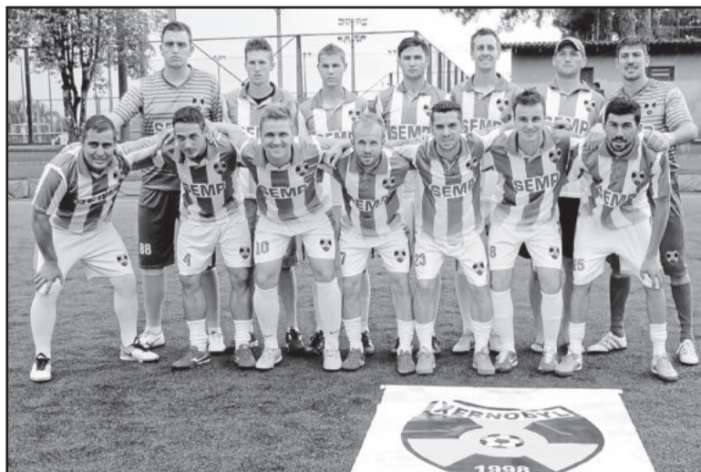
Campeão da 1ª Divisão em 2015, Xernobyl foi goleado na final