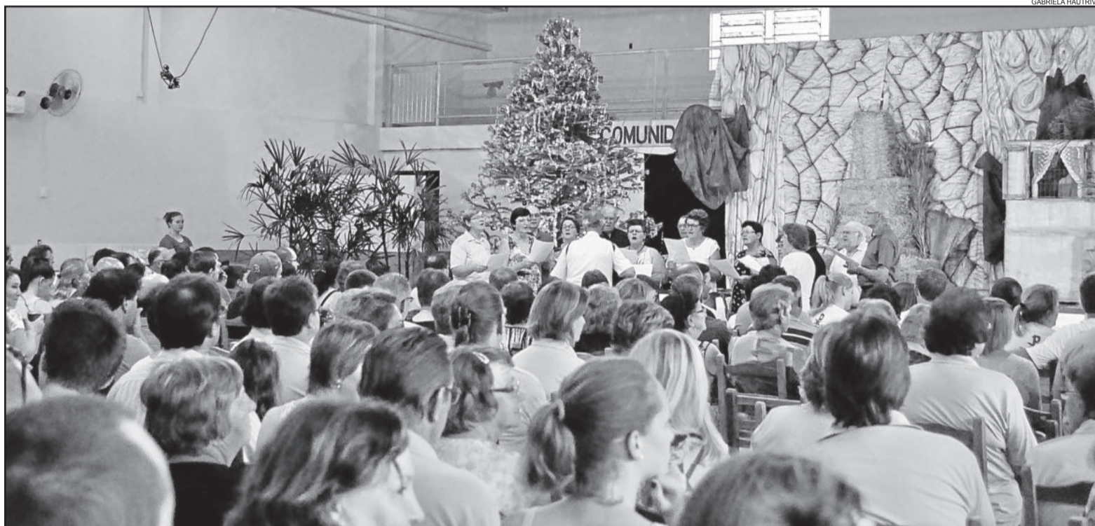
Bom público compareceu ao evento