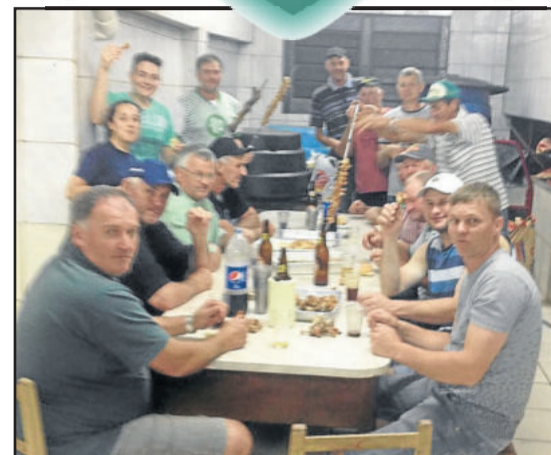
Na terça, enquanto alguns foram a Lajeado, outros festejaram na Berlim