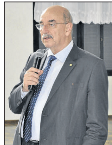
Ministro Osmar Terra

Terra também falou da importância do Criança Feliz e de os municípios aderirem a este novo programa. “Não existe nenhum programa na área social que tenha maior impacto que os cuidados com a primeira infância. É nos primeiros anos de vida que se organizam as competências e habilidades humanas. Se a criança não for adequadamente estimulada, não vai desenvolver muitas de suas competências. O programa pega como exemplo o Primeira Infância Melhor, que existe aqui no Rio Grande do Sul, que ajudei a organizar quando era secretário de Saúde, e é focalizado nas crianças do Bolsa Família, para que elas no futuro tenham perspectivas melhores”, expôs.