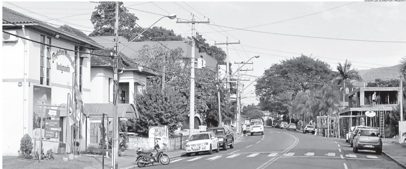
Município de Imigrante é destaque no Vale do Taquari e está entre os melhores do estado