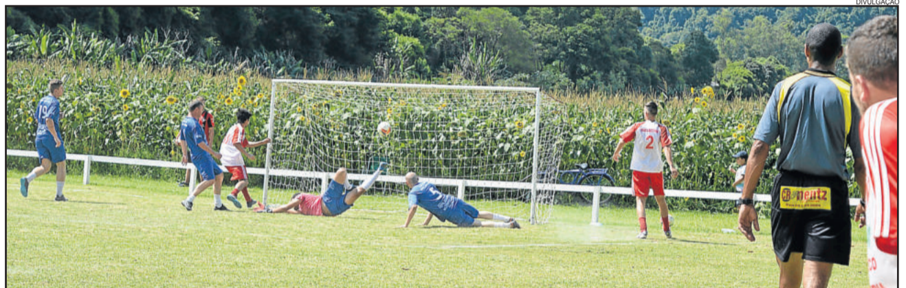
Gol da equipe Bom Fim contra o Cruzeiroinho