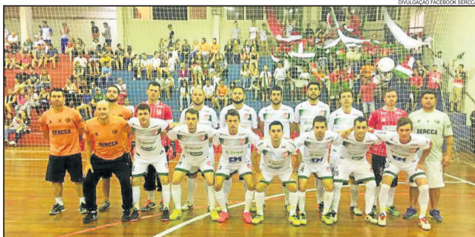
SERCCA venceu em casa e perdeu fora