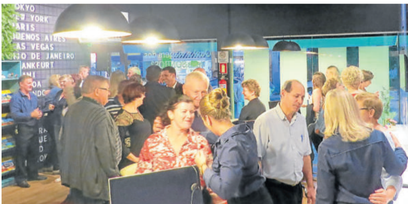
Mais de 300 pessoas marcaram presença

Neste mês de abril a empresa comemora seus 13 anos de existência e assim passa a oferecer aos