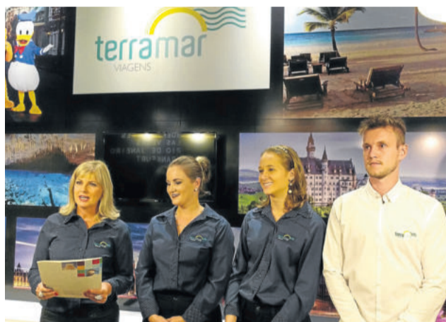
Solenidade ocorreu no novo espaço da empresa