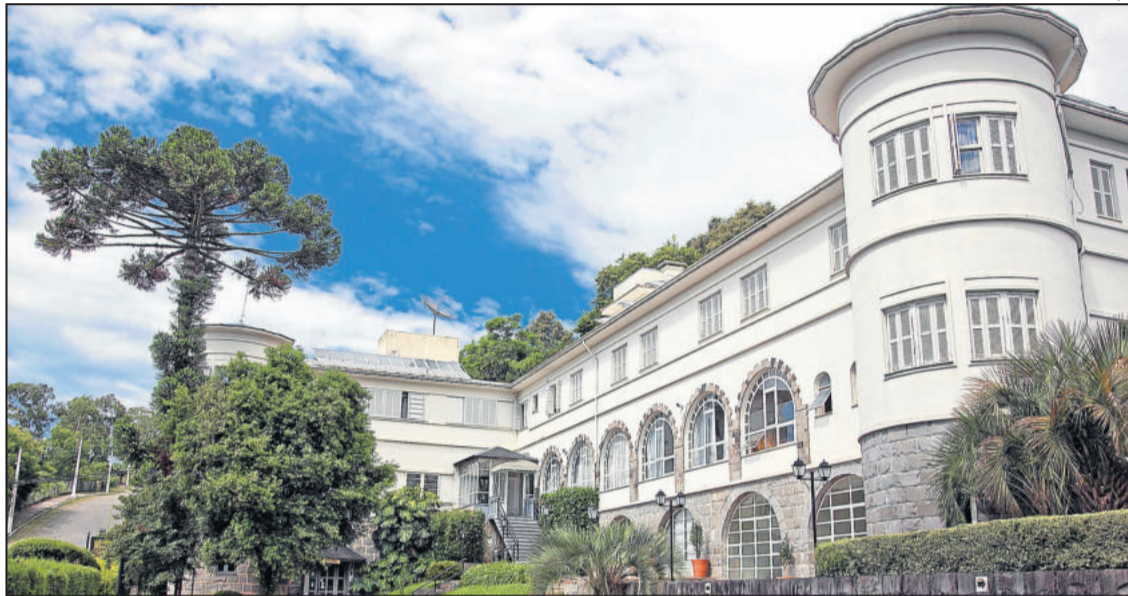
KAIS ISMAIL / DIVULGAÇÃO