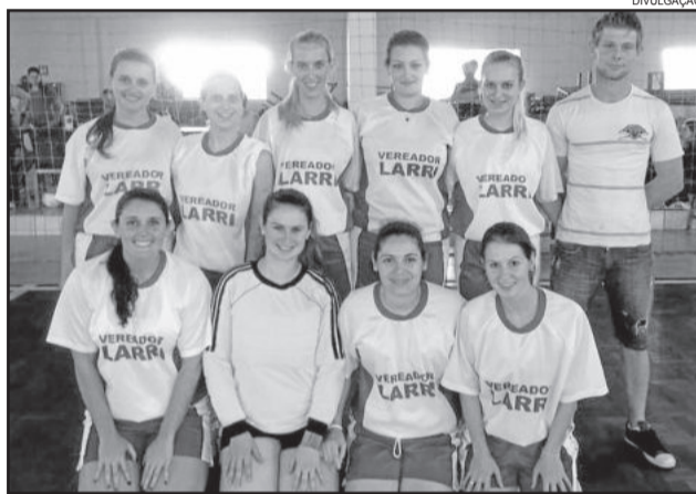
Equipe do futsal da Linha Lenz, do ano passado. Comunidade é a com maior número de inscritos

Ao todo serão mais de 700 atletas participantes, e se contabilizados aqueles que disputarão mais de uma modalidade, a competição superará os mil participantes de dez comunidades: São Luiz, São José, São Jacó, Lenz, Arroio do Ouro, Glória, Delfina, Costão, Linha Geraldo Alta e Novo Paraíso Baixo. De acordo com a Smel, ficou acertada a realização da canastra, vôlei misto, futebol de campo e futsal. A baixa foi a bocha, que não teve inscritos suficientes. O mesmo se registrou nas categorias in-