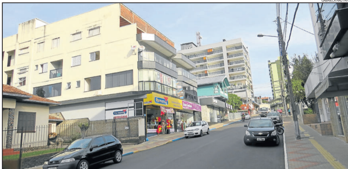
Concentração de lojas, comércio e agências bancárias deixam Languiru com cara de Centro Comercial