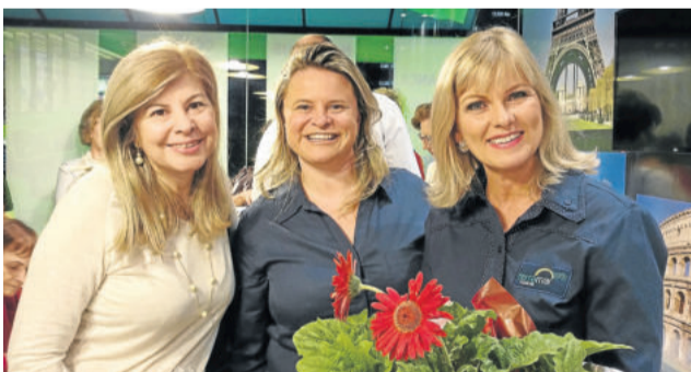
Parceria forte com a CVC