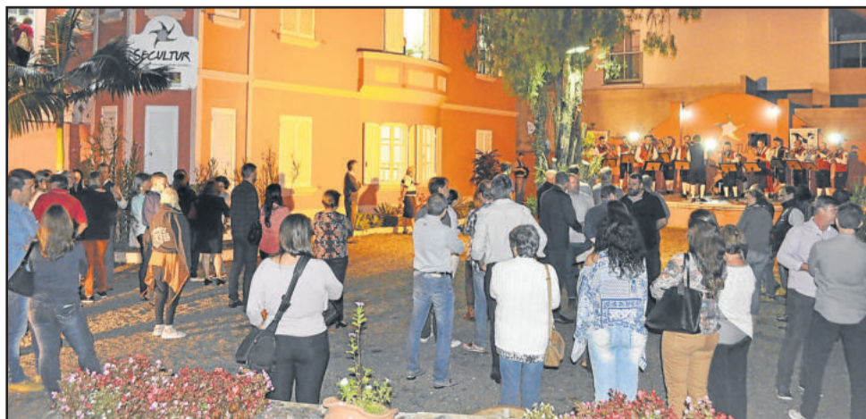
Comemoração foi realizada no Centro de Cultura e Turismo Bertholdo Gausmann

O roteiro tem início em Estrela e, por isto, normalmente é feito um tour pela cidade, a pontos como o calçadão da Rua Fernando Abott, Parque Princesa do Vale e escadaria do Rio Taquari. Depois ocorre o deslocamento para os demais atrativos. A maioria dos visitantes vem da Região Metropolitana, Vale do Taquari e da Serra.