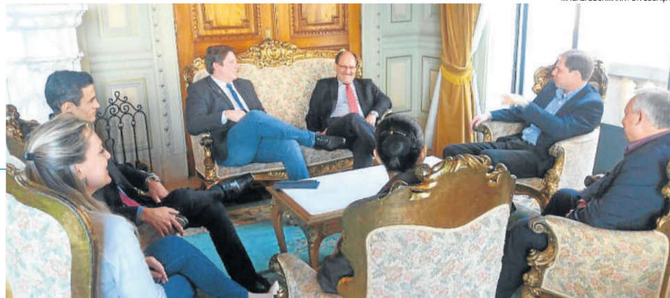
Governador Sartori confirmou presença na inauguração