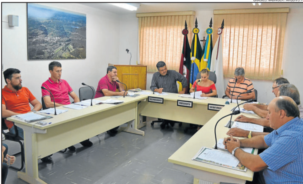
Sessão ordinária aconteceu na terça-feira, dia 18

A próxima sessão ordinária da Câmara de Vereadores de Boa Vista do Sul está agendada para a terça-feira, 2 de maio, e terá início às 18h.