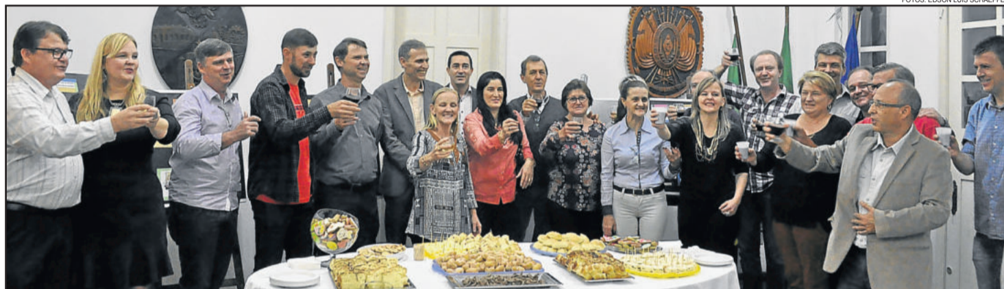
Empreendedores e autoridades brindaram o sucesso do roteiro Delícias da Colônia

Dois novos empreendedores turísticos de Imigrante passaram a integrar, recentemente, o Roteiro Delícias da Colônia: a Cascata das Orquídeas e a Bella Cantina Restaurante e Vinhos.