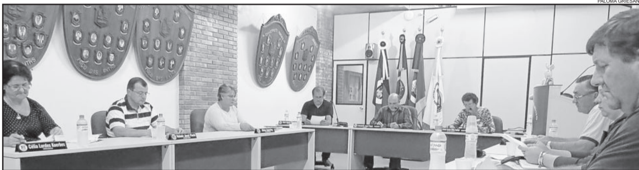
Vereadores se reuniram em sessão na segunda-feira, dia 17

Munícipes que possuem rebanho bovino devem fazer a declaração anual obrigatória, durante os meses de março e abril, junto ao Posto da Inspetoria Veterinária do Município, evitando assim transtornos posteriores.