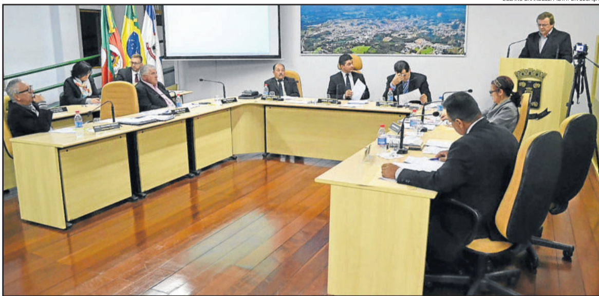
Sessão ordinária realizada na segunda-feira, dia 17

07/2017 que altera os artigos 1º e 2º da Lei Municipal nº 3.157, de 16 de outubro de 2003. Este projeto visa alterar o mapa anexo à Lei Municipal nº 3.157, de 16 de outubro de 2003, que “Denomina de Rua das Hortências o logradouro público localizado no bairro Tamandaré”.