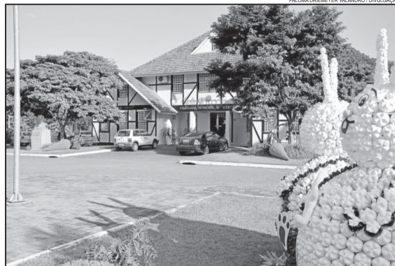
Atividades da Oustefest acontecerão em frente à Prefeitura Municipal

A Oustefest Westfália é uma realização da Administração Municipal e conta com o apoio de Hollmann e Bagio - Móveis e Esquadrias, Metalúrgica Rambo, Florestal - Balas e Pirulitos, Marasca Confeções Ltda., Suprivale, Zoom Vídeo Produções, Fogos Giordani, Câmara de Vereadores e secretários municipais.