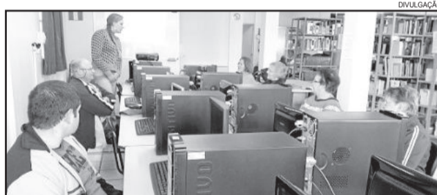
Aulas acontecerão na Biblioteca Municipal, nas tardes de sextas-feiras

Para os PcD's e iniciantes, as aulas iniciarão no dia 28 de abril. Já para os avançados, as aulas terão início no dia 5 de maio. As aulas são quinzenais, sendo que, por sexta-feira, serão atendidas duas turmas.