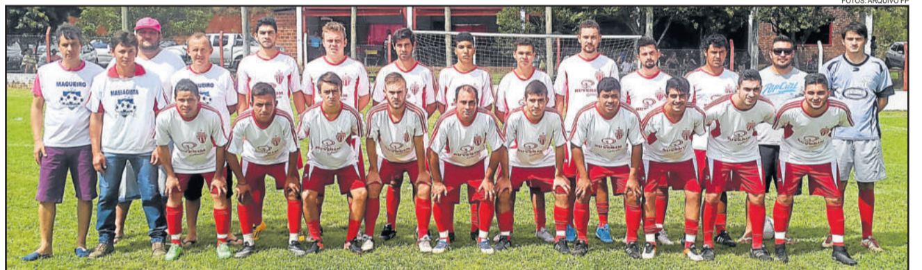
Atlético Gaúcho (aspirantes), com vitória, pode garantir a primeira colocação no Municipal

Com a folga durante o feriado de Tiradentes, tanto a Copa Soges quanto a Copa CTC, voltam a ter jogos apenas no sábado, dia 29 de abril. A 31ª Copa Sete/STR/CBM de Minifutebol, que não terá folga, tem jogos neste dia 21, sexta-feira, e dia 23, domingo.