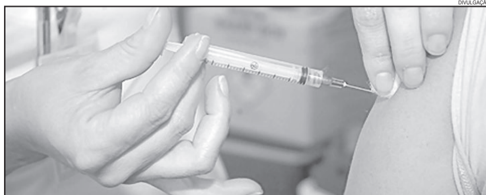
Vacinação contra a Influenza iniciou na segunda-feira

A estimativa é vacinar 122 crianças de 6 meses a menores de 2 anos, 273 crianças dos 2 aos 4 anos, 55 trabalhadores da saúde, 61 gestantes, 10 puérperas, 1.392 idosos, além de 141 pessoas com alguma comorbidade (ocorrência simultânea de dois ou mais problemas de saúde em um mesmo indivíduo), totalizando 2054 pessoas a serem vacinadas.