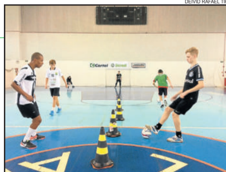
Treinos acontecem de segunda a sexta no Ginásio da Associação da Água