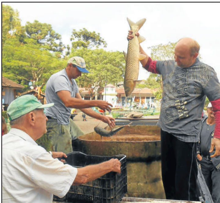
Procura pelo pescado foi intensa na quinta-feira santa

A Feira de Peixe Vivo foi uma promoção do município de Colinas, através da Secretaria Municipal da Agricultura, escritório municipal da Emater-RS/Ascar e produtores rurais locais.