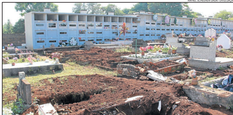
Obras antecedem fase de exumação de 126 corpos

ser realizado, sendo que há, inclusive, a lei municipal nº 10.007, de 24/12/2015, que proíbe o enterro de uma segunda pessoa em túmulos já construídos no referido cemitério. Os familiares que desejam saber onde serão dispostos os restos mortais de seus entes devem entrar em contato com a Sthas através do telefone (51) 3982-1093.