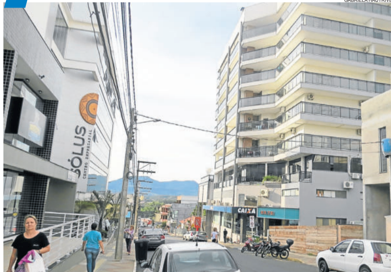
Canabarro tem maior concentração de indústrias, enquanto o Bairro Teutônia fica com o ramo madeireiro. Secretário do Planejamento compara município como um corpo humano, com diferentes funções. TEUTÔNIA > 3