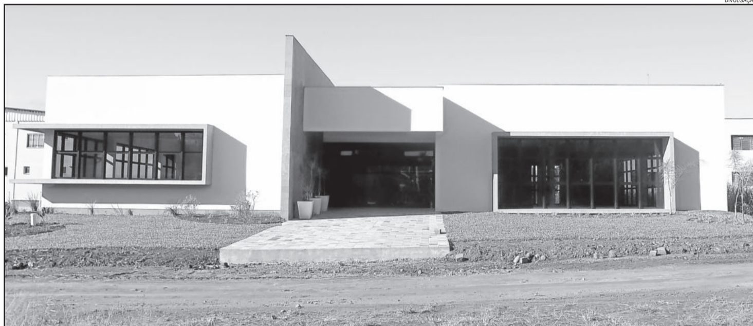
Estruturalmente, a edificação está pronta, faltando apenas as divisórias

O local do novo Centro Administrativo foi escolhido com foco na expansão e desenvolvimento da cidade. A fachada do novo centro