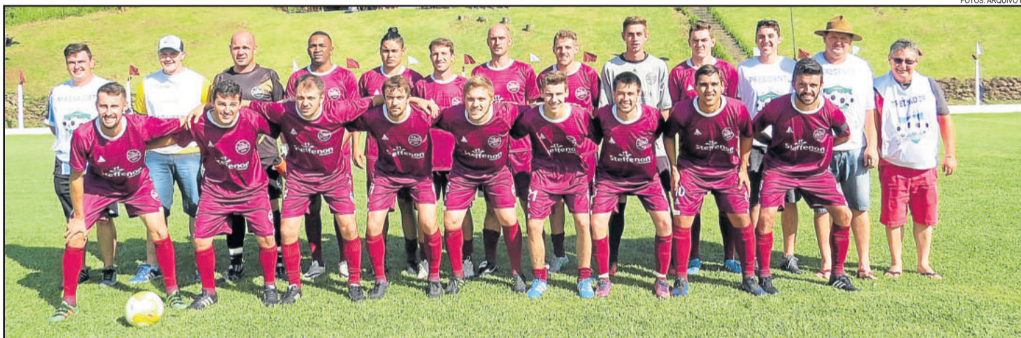
Já classificado em primeiro, Boavistense enfrenta o Juventude de Brochier domingo