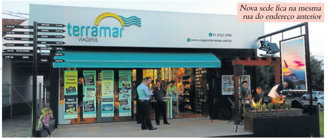
Nova sede fica na mesma rua do endereço anterior