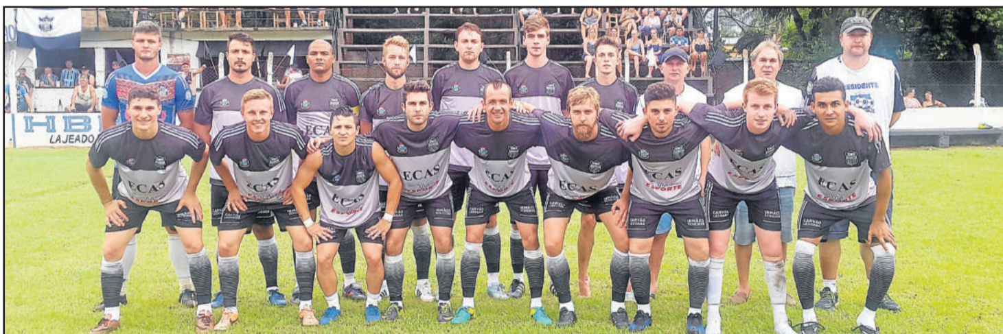
ECAS pode assumir a liderança da Chave B se ganhar do Poço das Antas em casa