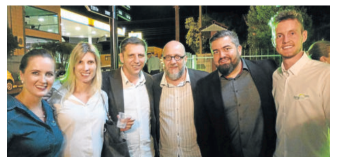
Parceria especial com a operadora Prime Consolidadora e Soul Traveler