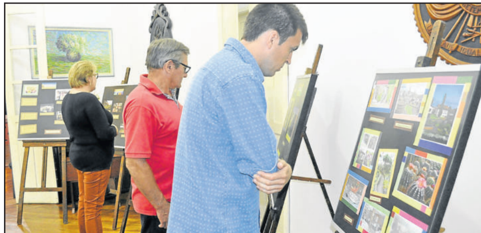
Mostra fotográfica conta a história e a evolução do roteiro