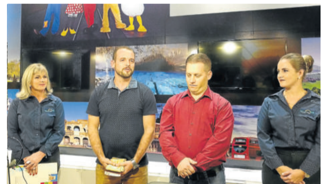
Padre e Pastor fizeram bênção