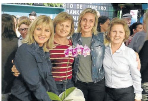
Familiares prestigiaram a conquista