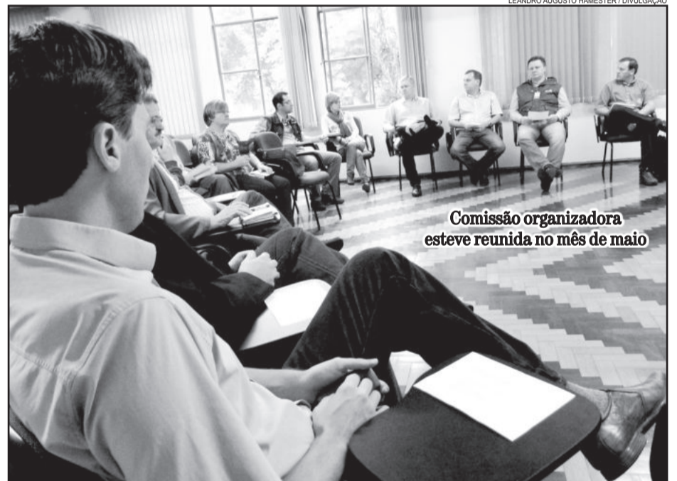
Comissão organizadora esteve reunida no mês de maio