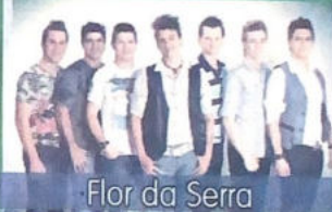
Flor da Serra