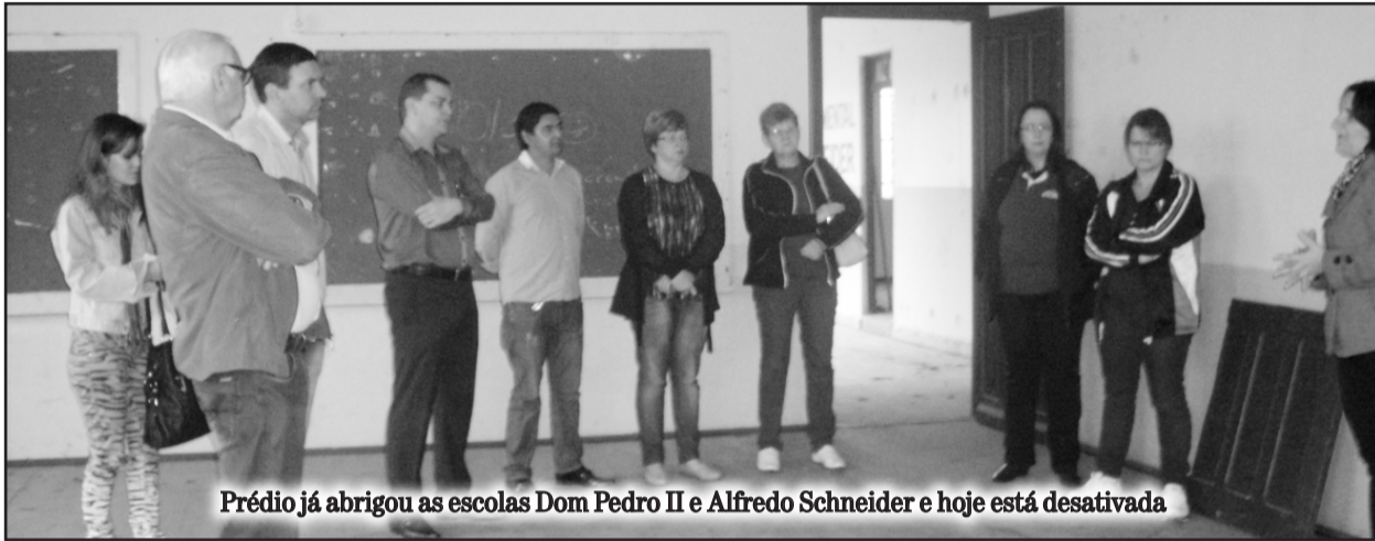
Prédio já abrigou as escolas Dom Pedro II e Alfredo Schneider e hoje está desativada

O antigo prédio da Escola Dom Pedro II, que anos depois abrigou a Escola Professor Alfredo Schneider, e que hoje encontra-se desativado, pode passar despercebido para quem passa pela Rua Maurício Cardoso, no Bairro Teutônia, em Teutônia. Recentemente, o prédio sofreu com atos de vandalismo e teve parte de sua estrutura depredada.