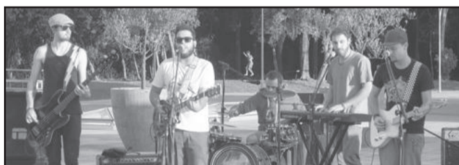
Banda La Roots animou o Dia sem Carro da Univates