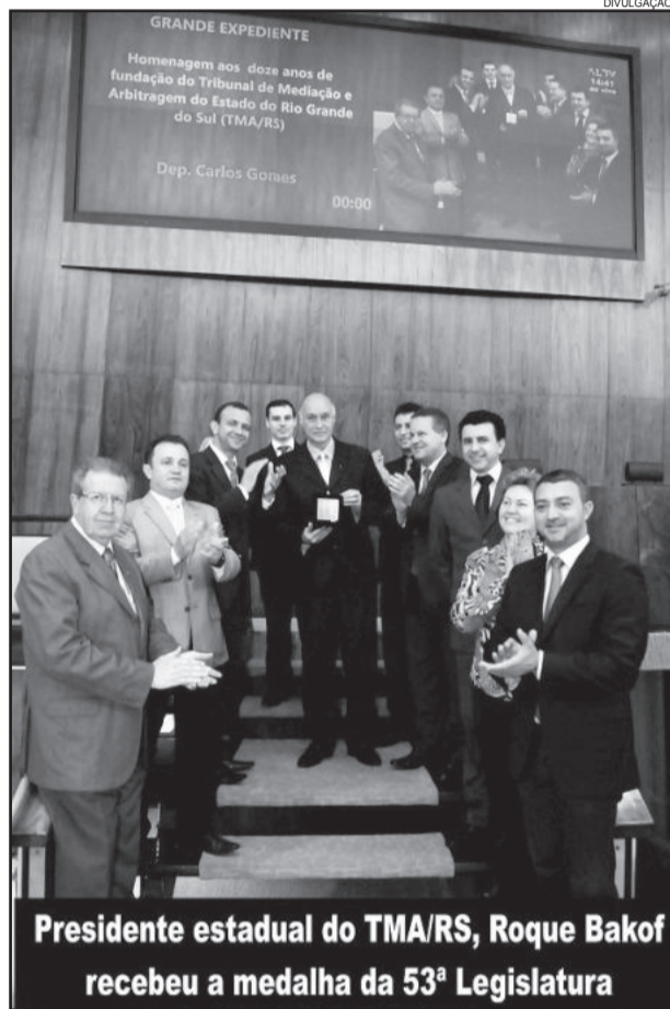
Homenagem ao TMA