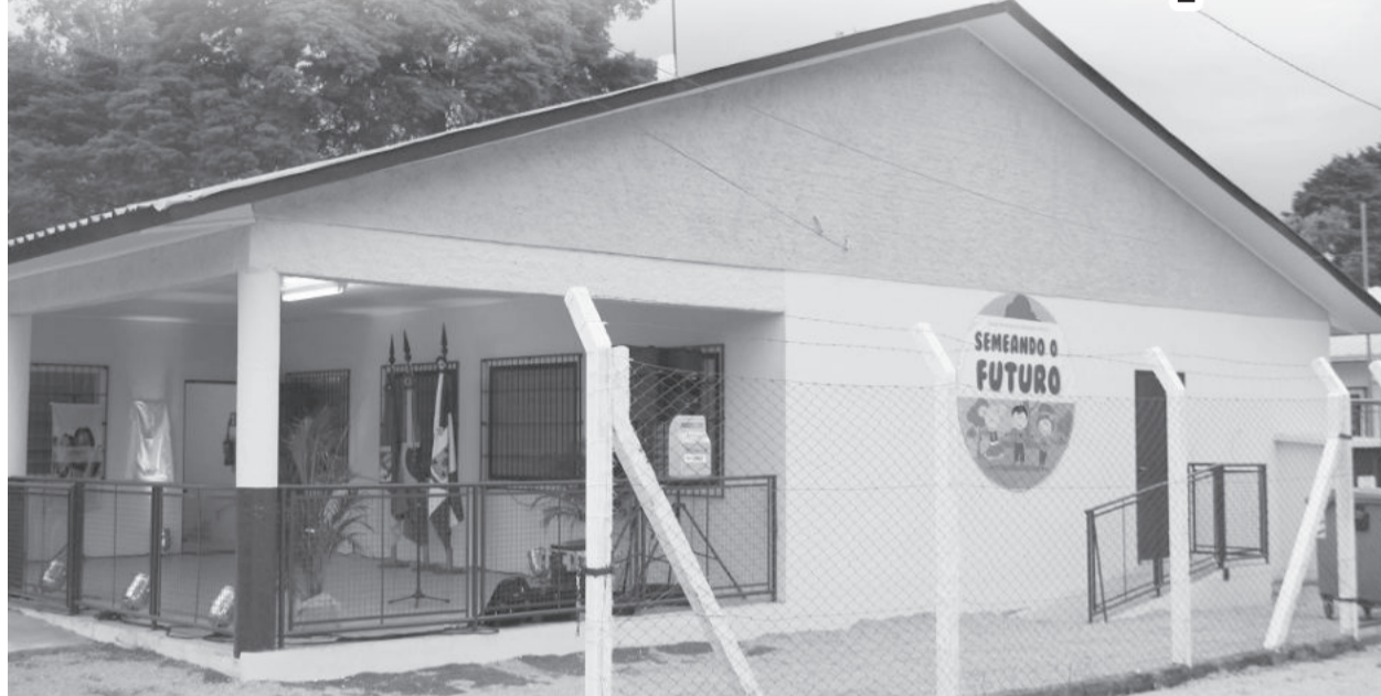
Escola de Educação Infantil foi inaugurada no fim da tarde de quinta-feira, dia 15

No dia que em a Administração Municipal completou 500 dias de governo, a comunidade do bairro Fenachamp, ganhou uma nova Escola de Educação Infantil. A inauguração da EMEI Semeando o Futuro, foi realizada no final da tarde desta quinta-feira, dia 15 de maio, e reuniu autoridades, representantes de entidades, profissionais da educação e comunidade do bairro.