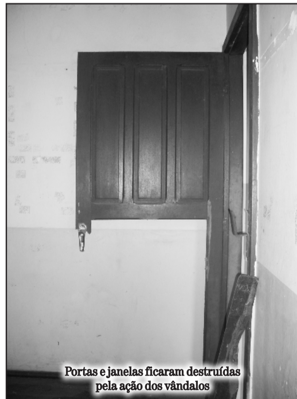
Portas e janelas ficaram destruídas pela ação dos vândalos