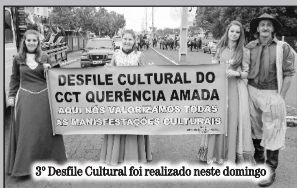
3º Desfile Cultural foi realizado neste domingo