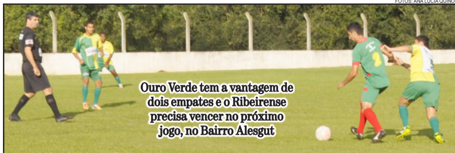
Ouro Verde tem a vantagem de dois empates e o Ribeirense precisa vencer no próximo jogo, no Bairro Alesgut