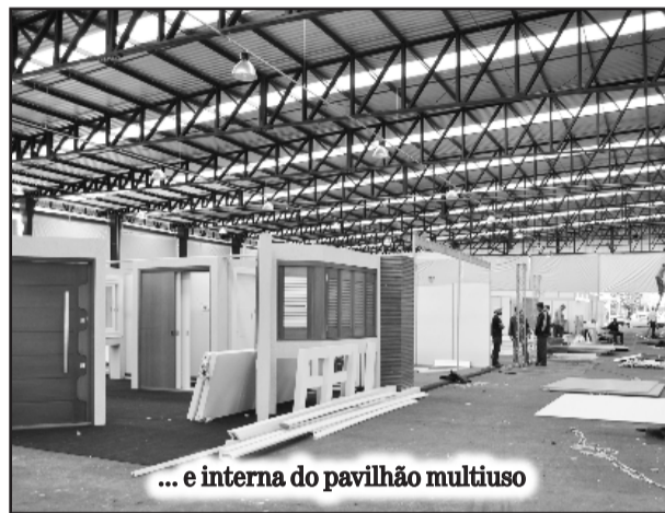
... e interna do pavilhão multiuso

O ritmo de trabalho continuou acelerado durante o fim de semana e nestes dias que antecedem a Festa de Maio 2014. Tudo para deixar o Parque de Eventos do Centro Administrativo de Teutônia preparado para receber milhares de visitantes a partir de quinta-feira, dia 22, até domingo, dia 25.