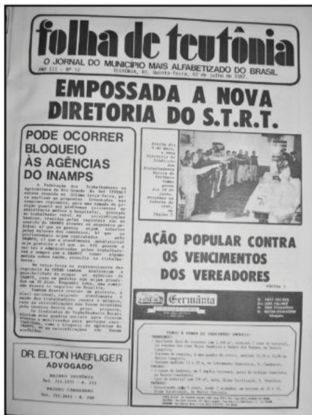
Ortografia mantida conforme edição da época

Pode ocorrer bloqueio às agências do INAMPS