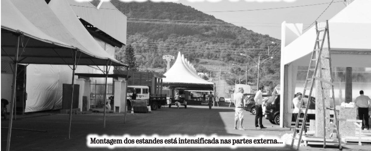
Montagem dos estandes está intensificada nas partes externa...