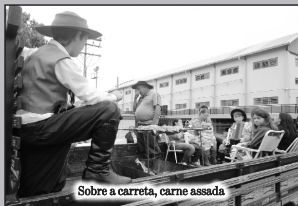
Sobre a carreta, carne assada