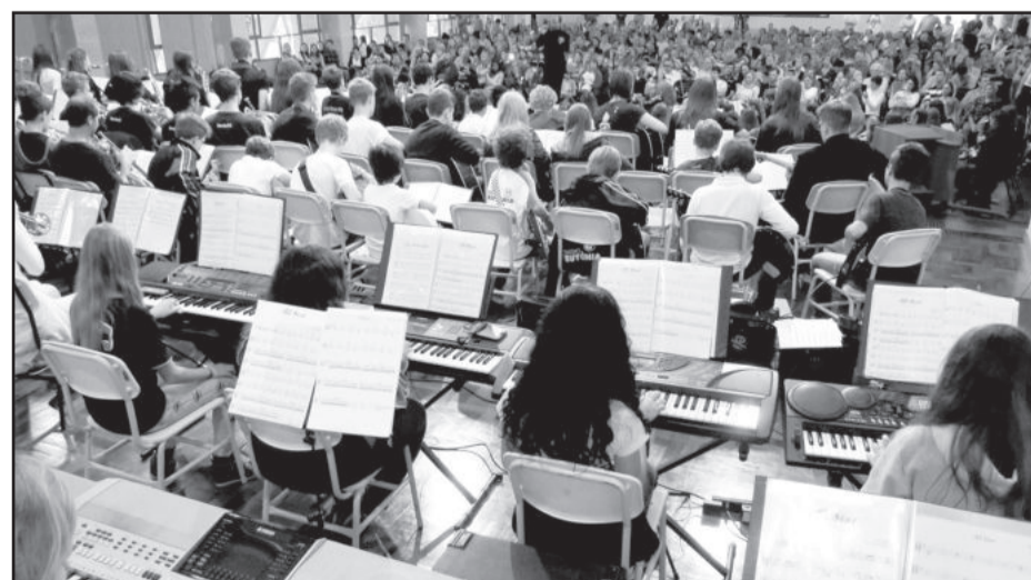
Auditório do Colégio Teutônia lotado para o evento realizado no sábado, dia 17 de maio