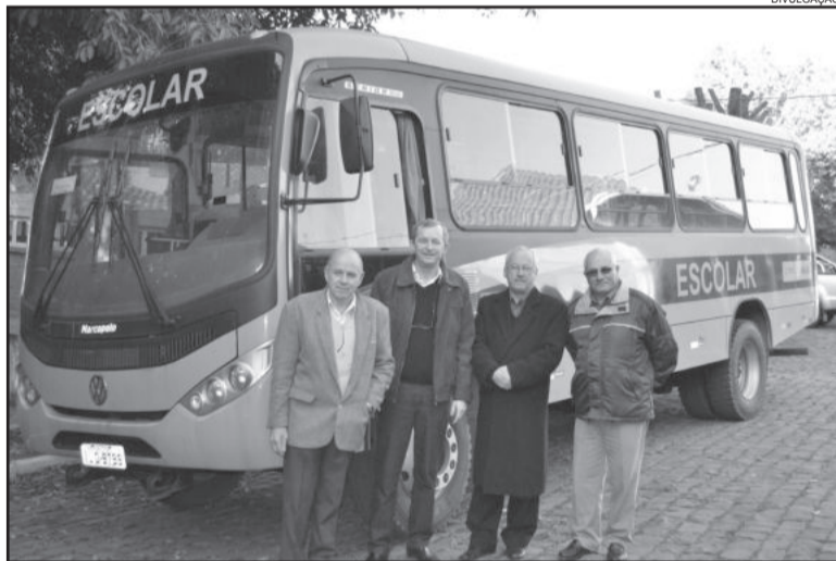
Poço das Antas recebeu o ônibus na manhã do dia 15

O programa Caminho da Escola tem como objetivo renovar e padronizar a frota dos veículos, assegurando mais qualidade e segurança ao transporte dos estudantes, o acesso e a permanência na escola dos estudantes matriculados na educação básica.