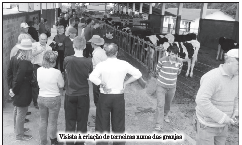
Visita à criação de terneiras numa das granjas