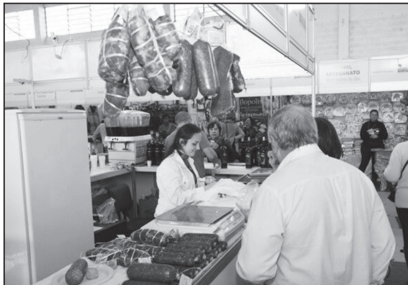
As agroindústrias tiveram o seu espaço no evento

O Turisvales foi promovido pela Associação dos Municípios de Turismo da Região dos Vales (Amurvaes) e pela Associação de Turismo da Região do Vale do Rio Pardo (Aturvarp). A realização do Salão foi da Lume Organização de Eventos e contou com as parcerias da Secretaria Estadual de Turismo do RS (Setur-RS), Secretaria Estadual de Esporte e Lazer, Prefeitura de Lajeado, Câmara de Indústria, Comércio e Serviços do Vale do Taquari (CIC-VT), Emater/RS-Ascar, Associação Brasileira de Turismólogos e Profissionais de Turismo no RS (ABBTUR-RS), Ministério do Turismo, Ministério do Desenvolvimento Agrário, Associação Gaúcha de Municípios (AGM), Federação das Associações de Municípios do Rio Grande do Sul (Famurs), Studio Produtora, Vigilância Mühl, Associação dos Municípios do Vale do Taquari (Amvat), Associação dos Municípios do Vale do Rio Pardo (Amvarp) e Associação Comercial e Industrial de Lajeado (ACIL) e Sebrae. O patrocínio foi da Corsan, Banrisul e Banco Regional de Desenvolvimento do Extremo Sul (BRDE).