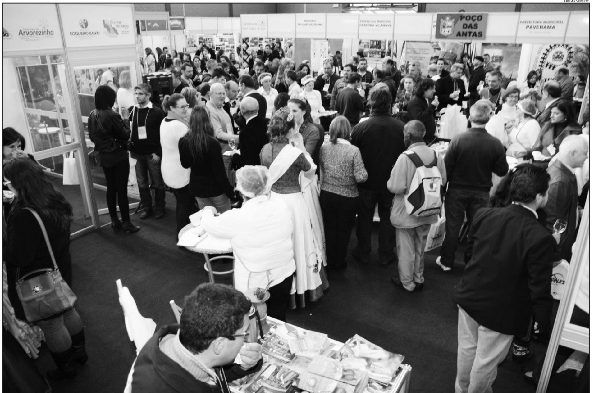
Turisvales mostrou o potencial turístico dos Vales do Rio Pardo e Taquari

Música, dança, orquestras, fotografias, entre outras atividades, também integraram a programação do Turisvales. Mais de 20 atrações se apresentaram no Festival de