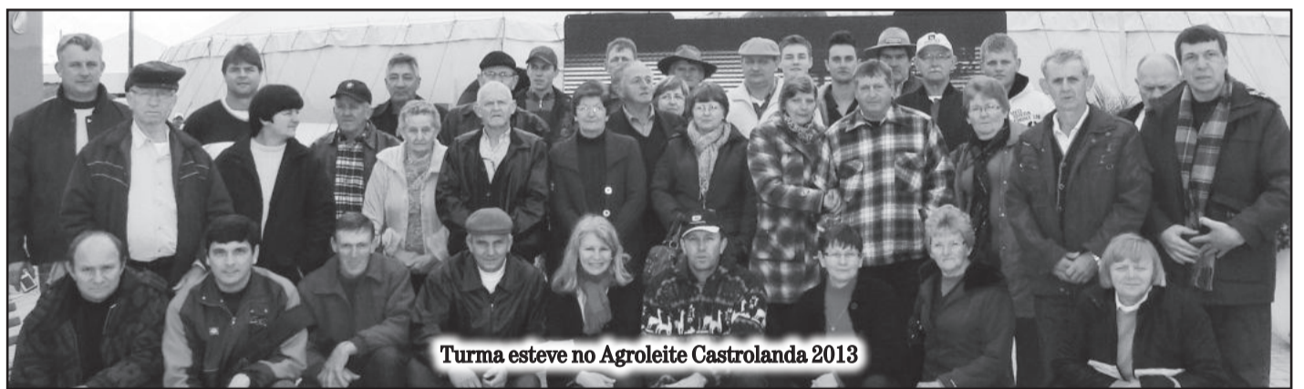
Turma esteve no Agroleite Castrolanda 2013