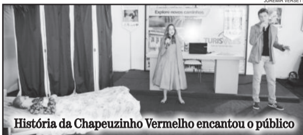
História da Chapeuzinho Vermelho encantou o público

Na programação, dia 21 de setembro, ocorrerá o festival de danças folclóricas alemãs. Participarão grupos de todo o Estado. O mais belo jardim de Colinas também será escolhido no mesmo dia. Os visitantes poderão realizar um roteiro com o Blumenwagen, o carro das flores. As escolas que quiserem realizar visitas durante a semana podem reservar a vaga ao passeio pelos telefones (51) 3760-1158 ou 9901-9088. Aos fins de semana, a festa estará aberta para toda a comunidade. O passaporte para entrada é R$ 5,00.