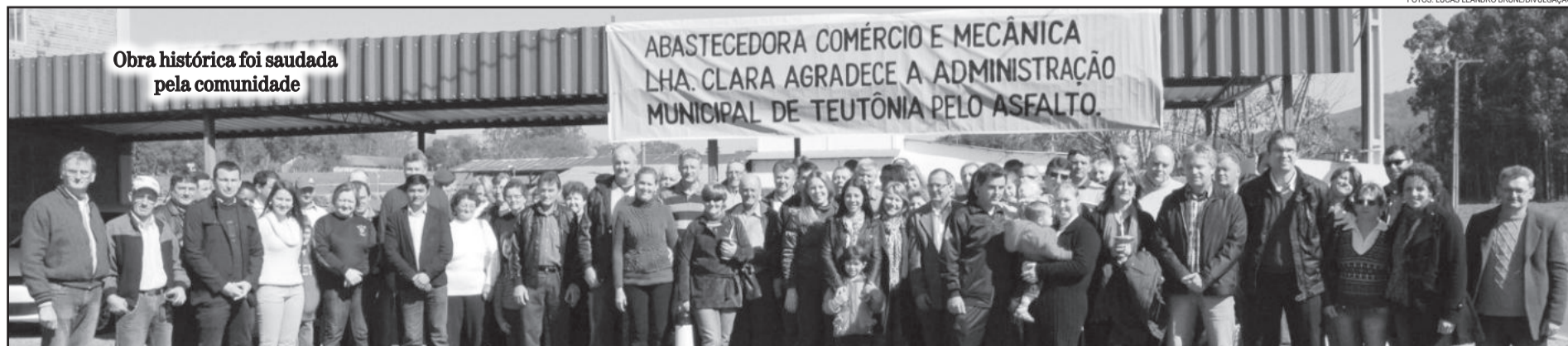
Obra histórica foi saudada pela comunidade