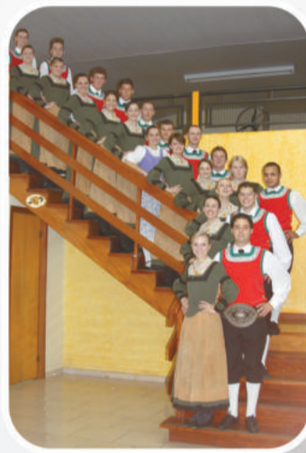
Grupo de Danças Folclóricas ORIGENS