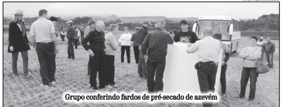
Grupo conferindo fardos de pré-secado de azevém

A visita ao Paraná encerrou com passeio de trem entre Curitiba e Morretes, cidade histórica e turística do Litoral paranaense, fundada em 1721. O trem atravessa a Mata Atlântica num trajeto centenário (a ferrovia foi construída por ordem do último imperador do Brasil, Dom Pedro II, há 128 anos) passando por diversos túneis, pontes e viadutos, num percurso de 68 quilômetros até Morretes. Inaugurada em 1885, a obra é considerada até hoje um desafio da engenharia.