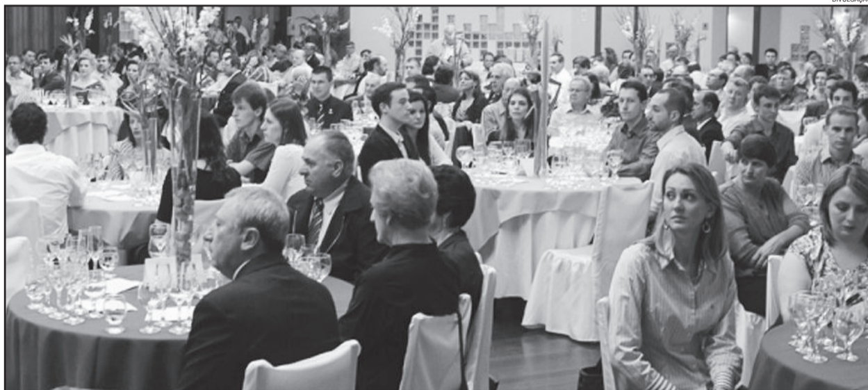
Jantar que apresenta os melhores vinhos e espumantes acontece anualmente em Garibaldi

A Seleção dos Melhores Vinhos e Espumantes de Garibaldi é realizada anualmente pela AVIGA e conta com o apoio da Prefeitura Municipal, APEME - Associação de Pequenas e Médias Empresas de Garibaldi, Ibravin e SEBRAE/RS.