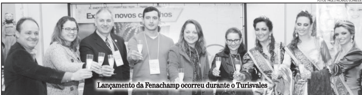
Lançamento da Fenachamp ocorreu durante o Turisvales

A 12ª Festa do Espumante Brasileiro - Fenachamp - ocorre de 3 a 27 de outubro. Entre as atrações estão a Banda Nenhum de Nós, Os Daltons, João Chagas Leite, Chimarruts, Demônios da Garoa, Tangos e Tragédias e o Grupo Ragazzi Dei Monti Trio. Mais informações podem ser conferidas no site www.fenachamp.com .