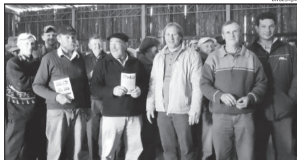
Agricultores receberam os incentivos na semana passada