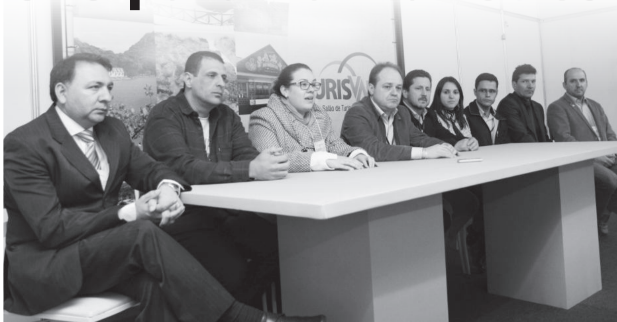
Comissão organizadora avalia positivamente o evento

Cultura durante os três dias. Na sexta-feira, dia 16, uma das atrações do Festival de Cultura foi o Westfälische Tanzgruppe, de Westfália.