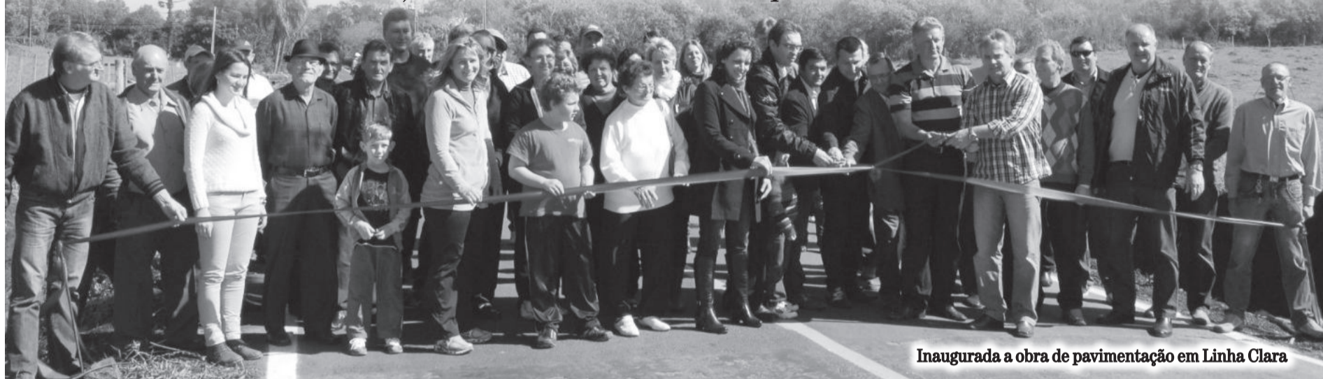
Inaugurada a obra de pavimentação em Linha Clara

São 1,7 Km e um investimento de quase R$ 1 milhão