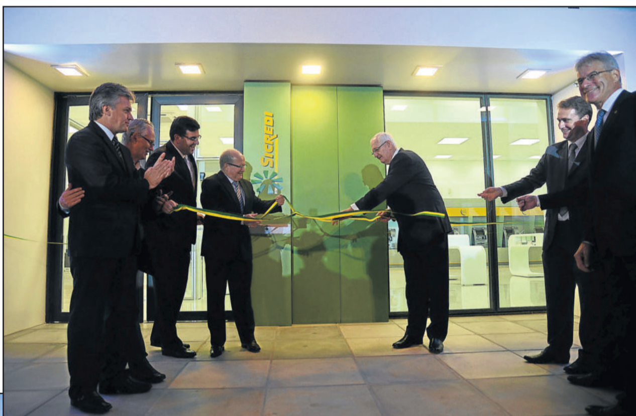
Inauguração da atual sede