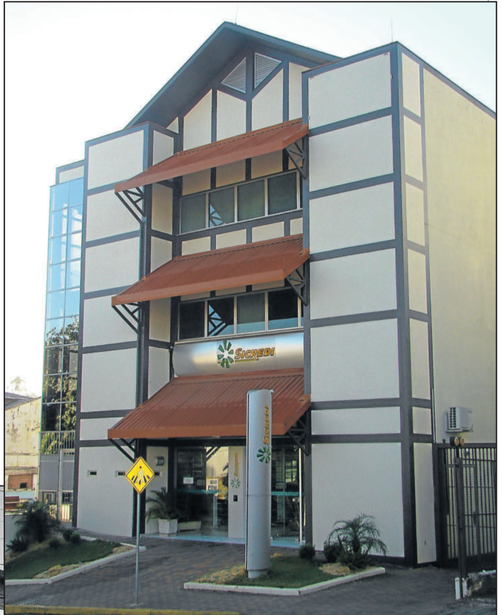
Sede da Sicredi Ouro Branco entre 2003 e 2014

Na década de 90, ao ingressar no Sistema de Crédito Cooperativo, a instituição passa a se chamar Cooperativa de Crédito Rural Ouro Branco - Sicredi Ouro Branco. Ao final de 1999, o quadro social já era composto por 2.679 associados.