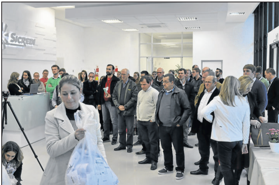
Associados e colaboradores participaram do ato

realmente aderiu. Percebemos um aumento nos nossos serviços e isto nos deixa feliz. Com a campanha, o associado passou a conhecer um pouco mais dos serviços e produtos que oferecemos a ele”, expôs.