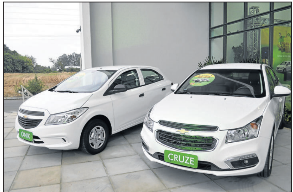
Foram sorteados um Ônix e um Cruze