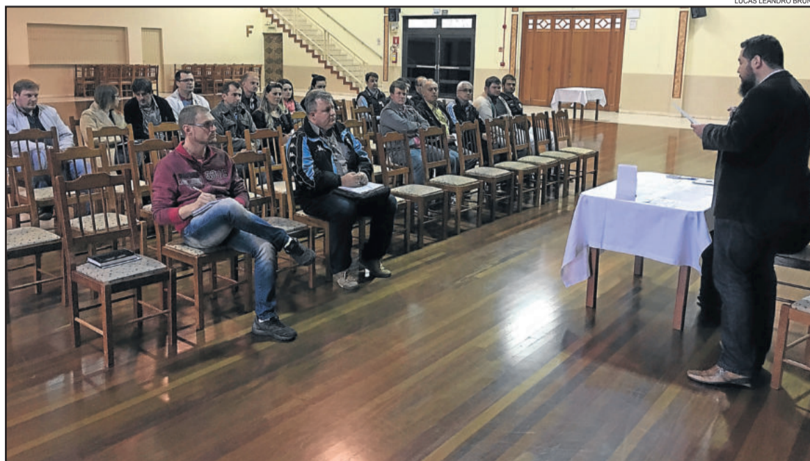
Justiça Eleitoral reuniu coligações e emissoras de Teutônia e Paverama ontem à tarde

Os programas em bloco (7h até 7h10 e 12h até 12h10) serão apenas para os candidatos a prefeito e a vice-prefeito. O sorteio da ordem de apresentação também foi realizado. Em Teutônia, no primeiro dia seguirá a seguinte ordem: Juntos por Teutônia, Por uma Teutônia Melhor e depois Teutônia Somos Todos Nós. Nos demais dias, haverá um rodízio dessa sequência. Em Paverama, o programa inaugural terá União Inovadora por Paverama, O Progresso Continua e Paverama Legal.