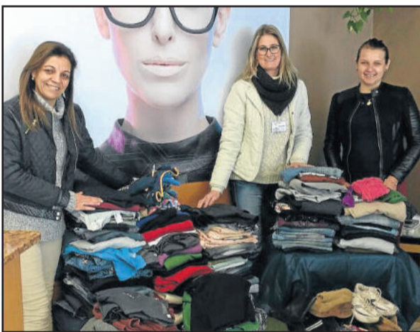
Equipe de Languiru fez suas doações para a Primeira Infância Melhor

No mês de Julho a Ótica Lauro realizou a promoção “Doe Carinho, Ganhe Descontos”, em que cada cliente poderia ganhar até 35% de desconto na compra dos óculos novos. Cada peça doada concedia 5% de desconto, mas a solidariedade da comunidade de Teutônia superou as expectativas. Com duas lojas, uma em Languiru e outra em Canabarro, foram arrecadadas mil peças de agasalhos que puderam, e ainda podem, aquecer muitas crianças e famílias neste inverno. As doações foram feitas para a Primeira Infância Melhor de Languiru e para o CRAS de Teutônia, responsáveis por distribuir as doações entre famílias carentes da cidade.