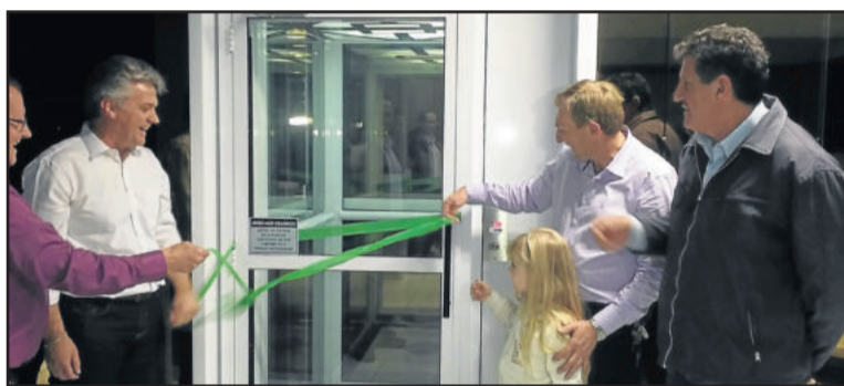
Na oportunidade, também foi inaugurado o elevador panorâmico

O presidente também lembrou que o investimento foi feito com o dinheiro da categoria, em prol da mesma. “Um dia deixarei de ser presidente, mas as pessoas irão lembrar do crescimento do sindicato nesses últimos anos”, acrescenta. Segundo ele, o auditório passa a ser também utilizado como fonte de renda,