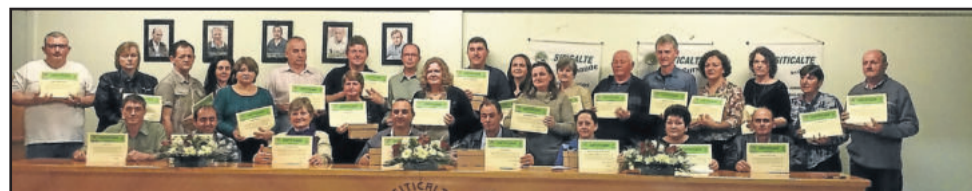
Homenageados com 28 anos de filiação