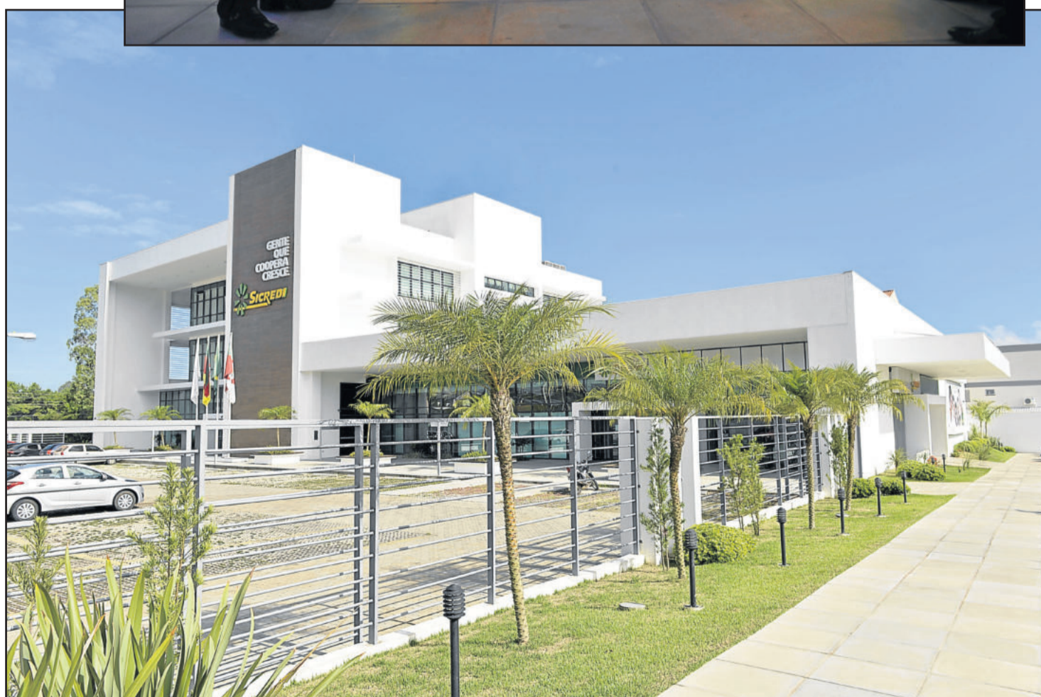
Atual sede da Sicredi Ouro Branco