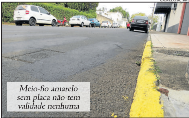
Meio-fio amarelo sem placa não tem validade nenhuma

A chefe do Departamento de Trânsito ainda acrescenta que a placa de "exclusivo para cliente" vale apenas em terreno ou área de estacionamento particular, como por exemplo, recuo de calçadas que muitos prédios fazem já para contemplar seus clientes. "A rua é competência do município, pois é pública. A placa de "Exclusivo Cliente" nem é contemplada no CTB. Os estacionamentos específicos que podem ser implementados em ruas seguem a Portaria