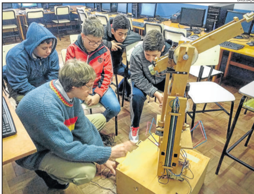
Equipamento foi doado pela Univates

vorece o desenvolvimento da criatividade, do raciocínio lógico e da aprendizagem contínua. Ele destacam que a atividade desperta nas crianças a curiosidade, a autoria e a imaginação, além de contribuir para uma evolução significativa do desempenho escolar.