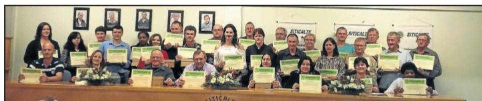
Homenageados com 30 anos de filiação