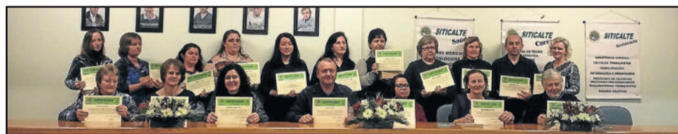
Homenageados com 29 anos de filiação