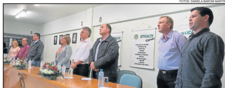
Diversas autoridades e representantes de outros sindicatos prestigiaram a solenidade

atendendo a quase todas as cidades do Vale do Taquari. Depois, cada cidade fundou a sua própria entidade”, conta.