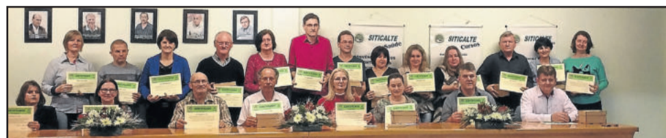
Homenageados com 27 anos de filiação