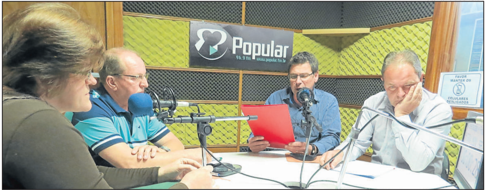
Candidatos de Poço das Antas abrem série de debates na Popular FM

De início, os candidatos a prefeito e vice-prefeito tiveram um minuto (cada) para sua autoapresentação. Posteriormente, permaneceram no estúdio ape-