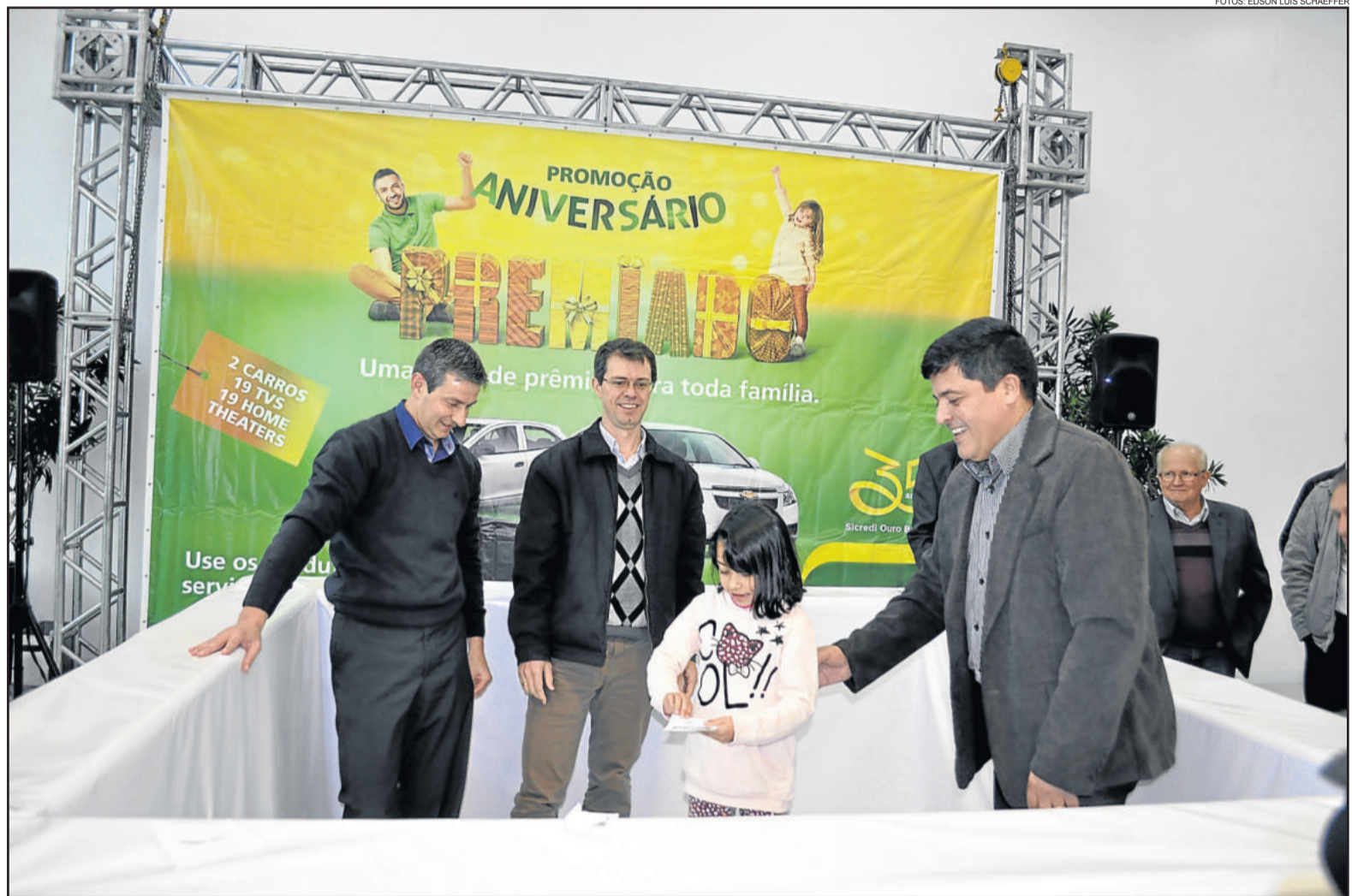
Sorteio foi alusivo aos 35 anos da Sicredi Ouro Branco

A campanha “Aniversário Premiado – uma festa de prêmios para toda a família”, teve início no dia 14 de março e encerrou ontem. Associados, pessoa física ou jurídica, participaram da pro-