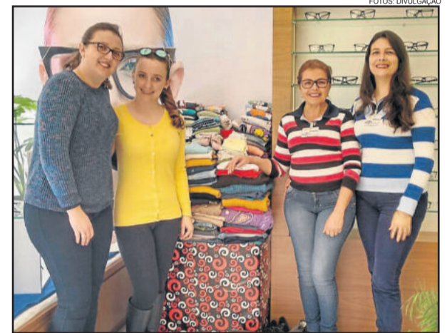
Equipe de Canabarro doou as peças para o CRAS de Teutônia