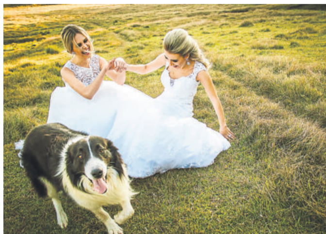
Confira alguns clicks de Tati Itat

“A fotografia acaba sendo uma forma física de fazer eternizar momentos. Ela tem esse poder: faz lembrar, reviver, conta histórias! Por isso a sua importância. É o que fica de um evento ou de uma fase da vida.” conclui.