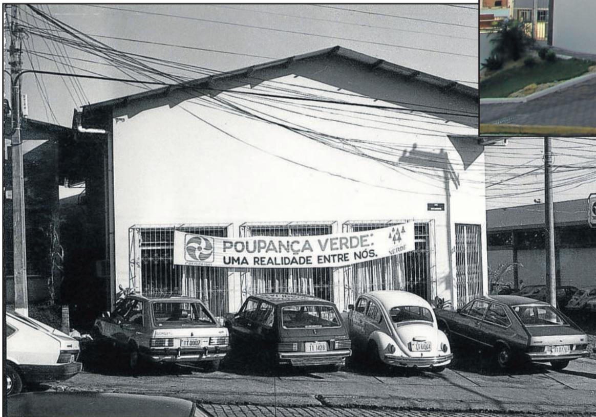
Sede da Crediouro na década de 80

Em fevereiro de 2014, a então Sicredi Ouro Branco RS inaugurou sua sede própria, entre as ruas Senhor dos Passos e João Lavrinenco, também no Bairro Languiru. O novo e atual espaço contempla a Sede Administrativa, a Superintendência Regional e a Unidade de Atendimento do Bairro Languiru. Trata-se de uma ampla estrutura projetada para atender ainda melhor os associados, a comunidade e