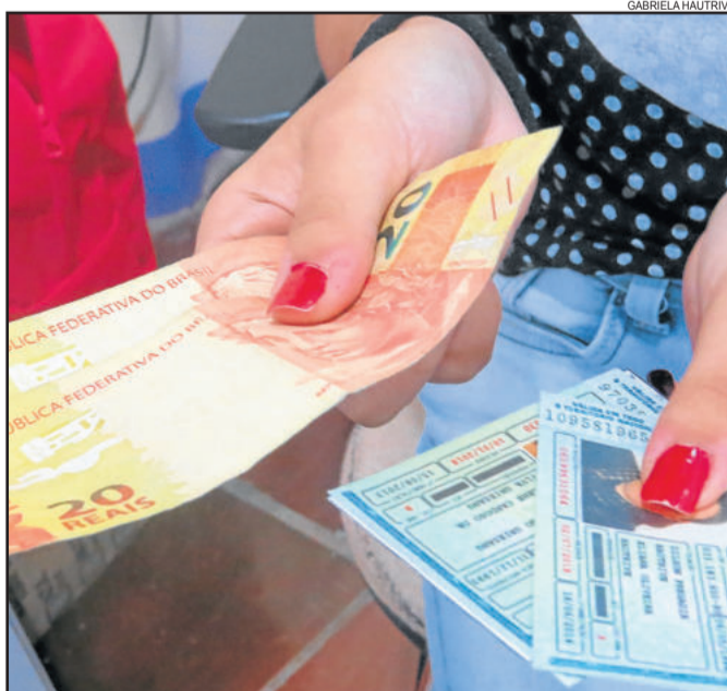
O não pagamento de tal taxa acarretaria a inclusão em dívida ativa e o cancelamento do documento

O Ministério das Cidades/Denatran também emitiu nota na quarta-feira, dia 18, esclarecendo a questão. “Portadores da Carteira Nacional de Habilitação não pagam anuidade. Contamos com a colaboração de todos os veículos de comunicação para desmentir a informação, a fim de prevenir todos os cidadãos contra golpes que possam ser aplicados em nome da instituição”. O Detran/RS orienta que o usuário busque informações nos canais oficiais antes de compartilhar alertas desse tipo, e em caso de dúvida, procure os canais de atendimento dos órgãos públicos.