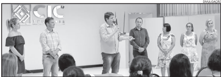
Prefeito Jonatan Brønstrup e equipe da Educação realizaram a abertura do ano letivo da educação infantil

Hoje Teutônia tem três Escolas de Educação Infantil: Sonho de Criança (Canabarro), Meu Cantinho (Loteamento Popular) e a Caminhos do Saber (Alesgut), nove escolas comunitárias, com idades de zero a seis anos, além das turmas de quatro e cinco anos nas escolas regulares.