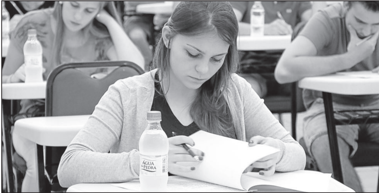
Prova única de redação será aplicada no dia 29 de janeiro

A s inscrições para o Vestibular Complementar da Univates se encerram na próxima segunda-feira, dia 23 de janeiro. A prova única de redação está marcada para o dia 29 de janeiro, das 13h30min às 16h, para 42 cursos de graduação e tecnológicos.