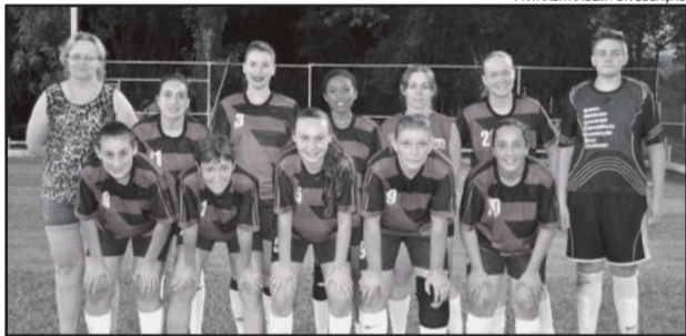
Após estreiar com derrota, meninas do Flamengo venceram o segundo jogo