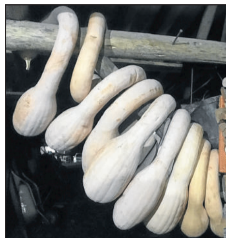
Na propriedade, abóbora não falta