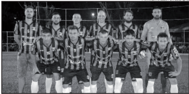
Os Parças/Tomazelli/Concretos Brandão empatou na estreia e busca vitória na próxima quarta