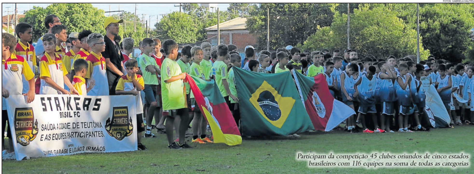
Participam da competição 45 clubes oriundos de cinco estados brasileiros com 116 equipes na soma de todas as categorias