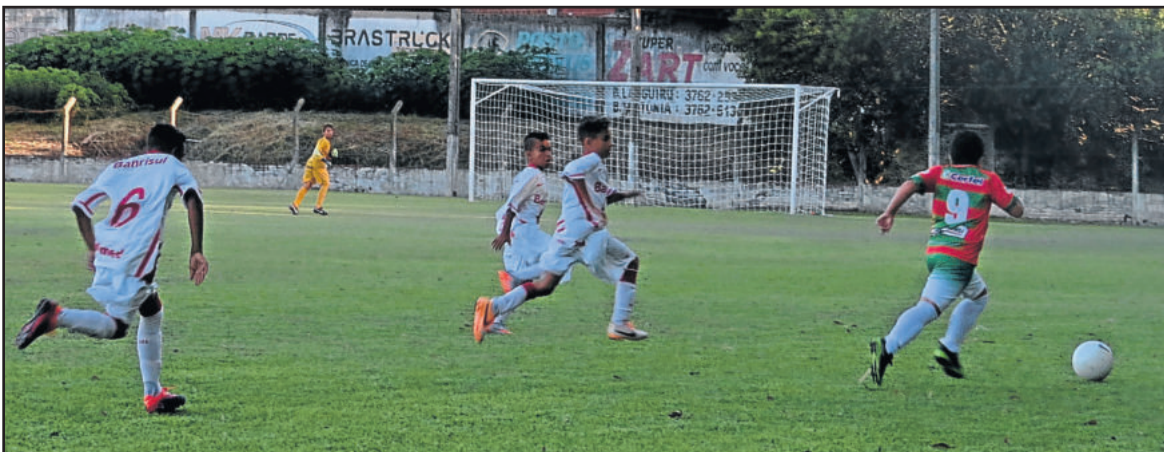
Juventus x Internacional fizeram o jogo de abertura da competição e ficaram no 0x0 pela Sub-11

Os demais jogos podem ser conferidos no site www.planetabolaeventos.com.br no decorrer do campeonato. Além disso, haverá informações e conteúdo fotográfico no site folhapopular.info e também dados repassados através da Rádio Popular FM e jornal Folha Popular.