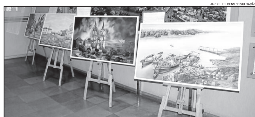
Quadros do pintor Silvio Farias estarão expostos no hall de entrada

tecimentos históricos de Lajeado, como o tufão de 1967, o incêndio na Igreja da Matriz em 1953, além de outros momentos marcantes. O horário de atendimento