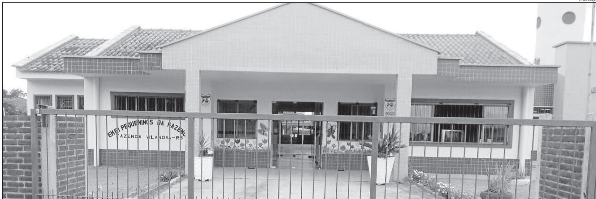
Foram criadas mais 25 vagas na educação infantil para atender a demanda da comunidade