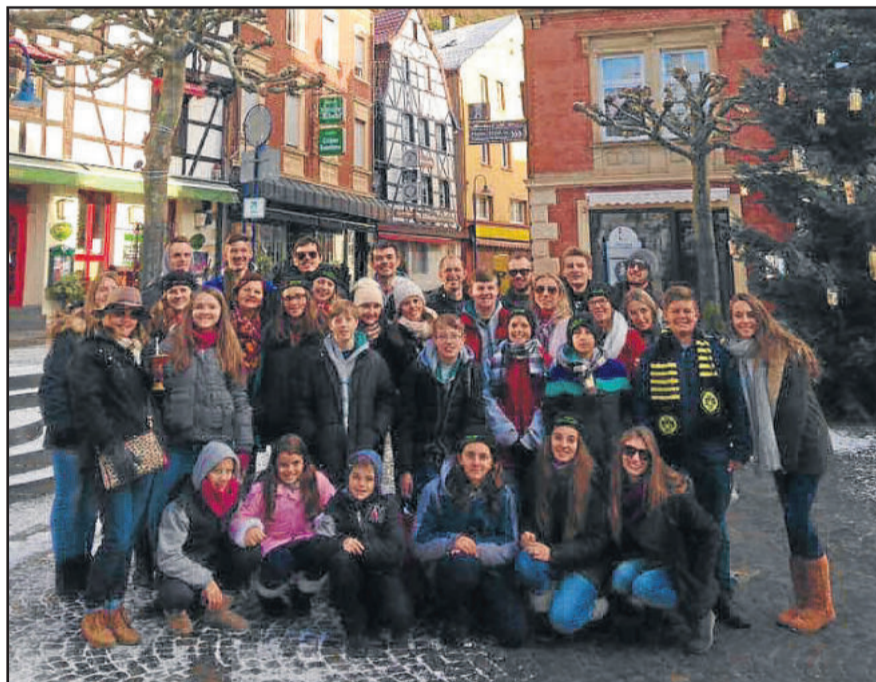
Grupo durante visita a Felsenkirche