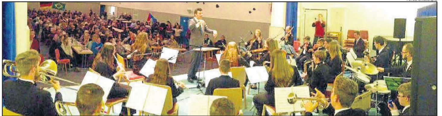
Conjunto em apresentação em Hettenrodt

O Conjunto Instrumental do Colégio Teutônia completou sua primeira semana de turnê na Europa. A turma viajou no dia 12 de janeiro. O grupo de pais e alunos chegou no aeroporto de Frankfurt na sexta-feira, dia 13. As apresentações iniciaram no sábado, dia 14, na cidade de Ruschberg, na Alemanha. O grupo apresentou seu repertório, incluindo canções tradicionalistas como "Guri" e encantou os alemães. No domingo, dia 15, foi dia de conhecer mais algumas belezas germânicas. Os instrumentistas e familiares visitaram Idar-Oberstein e sua famosa Felsenkirche (Igreja na Rocha). No domingo também foi dia de realizar a segunda apresentação. O concerto ocorreu em Hettenrodt, na Alemanha. Eles agradeceram a acolhida da localidade, onde se apresentaram pela segunda vez. O grupo continua sua turnê por mais dois países: França e Áustria. Eles chegaram a Paris na terça-feira, dia 17. O momento foi descrito como inesquecível.