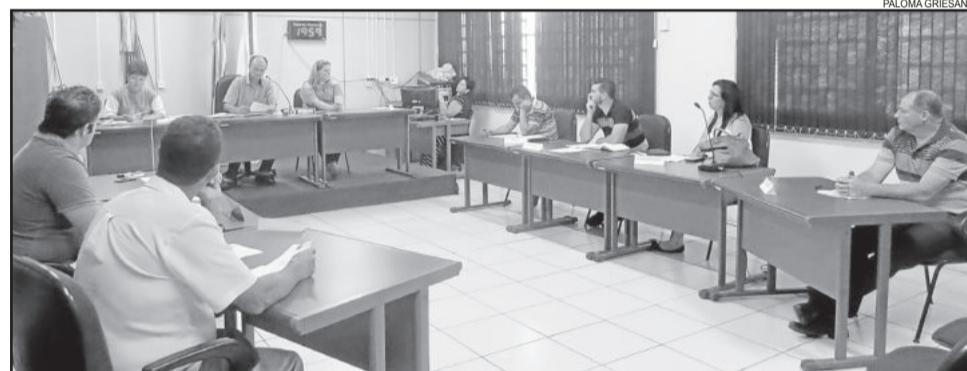
Quatro projetos foram aprovados na sessão desta quinta-feira