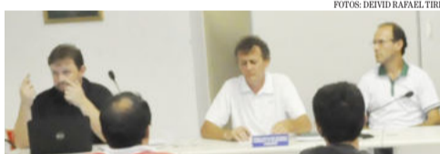
Clubes debateram vários aspectos

Durante a reunião, foi posto em votação se os clubes participantes do certame gostariam de realizar, em parceria com a ACAT, novamente o baile para a arrecadação de fundos. Entre os 12 clubes participantes, seis clubes votaram a favor e seis votaram contra a realização do baile. Com isso, a definição oficial ficou adiada para a próxima reunião.