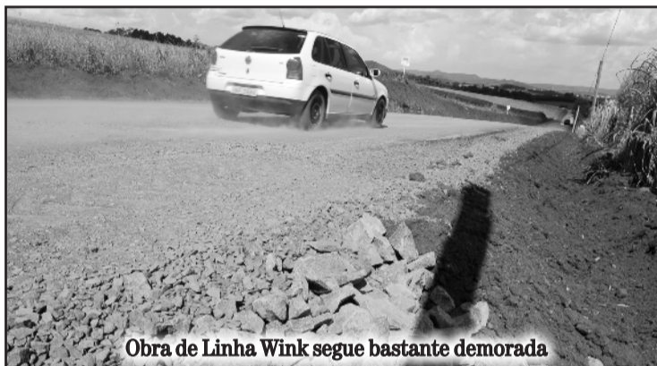
Obra de Linha Wink segue bastante demorada