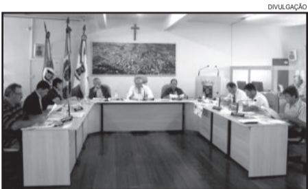
Vereadores garibaldenses foram unânimes ao rejeitar contribuição

A Sessão ainda contou com a leitura de doze novos Projetos de Lei Executivos, os projetos visam o repasse de auxílio financeiro à Associação de Pais e Amigos dos Excepcionais de Garibaldi, Associação dos Canarinhos Cantores de Garibaldi, Associação Combat de Artes Marciais, ao Fraterno Auxílio Cristão (FAC), ao Conselho Comunitário Pró-Segurança para manutenção e apoio das Polícias Civil e Militar de Garibaldi, dentre outros Projetos.