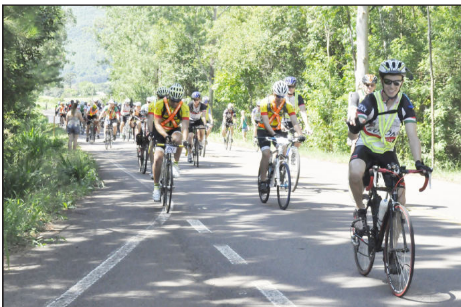
Largada ocorreu na ERS-419, em frente à antiga sede esportiva do Guarani, em Linha Capivara, Teutônia

Dahlke também destaca que o Audax propicia conhecer outros lugares. “A gente tem a oportunidade de pedalar em cidades que talvez nunca fosse visitar. O ciclismo, mais especificamente o Audax, só tem benefícios. Em 2014 quero participar de, pelo menos, seis Audax e completar as provas sem me preocupar com o tempo”, revela.