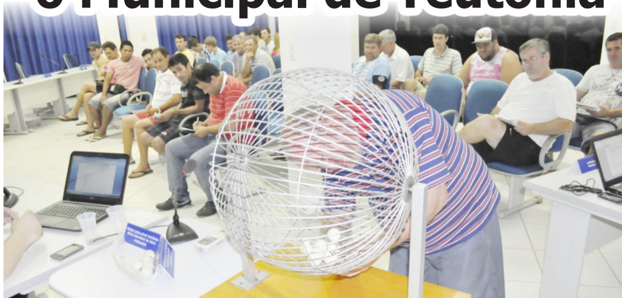
Reunião que definiu o campeonato transcorreu das 20 às 22 horas, na Câmara de Vereadores de Teutônia

Na noite de ontem (segunda-feira), dia 20, a Associação de Clubes Amadores de Teutônia – ACAT apresentou o regulamento do Campeonato Municipal de Teutônia 2014 e realizou o sorteio das chaves do certame. A reunião iniciou às 20 horas e contou com a participação, inicialmente, de representantes de 12 clubes do município.