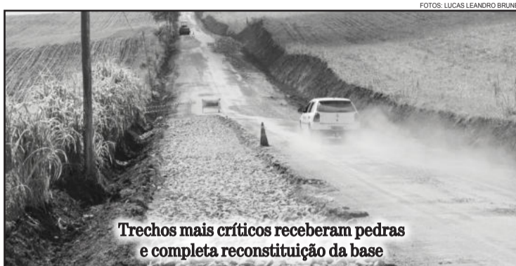
Trechos mais críticos receberam pedras e completa reconstituição da base

A Secretaria Municipal de Obras pede a compreensão e atenção de todos, especialmente dos motoristas, pois esta via está interrompida em determinados trechos e desvios foram providenciados para dar vazão ao trânsito. Também recomenda-se evitar o uso da via durante o período de obras, e para quem necessita passar pelo trecho redobrar a atenção em função dos desníveis na pista, escavações e máquinas trabalhando no local.