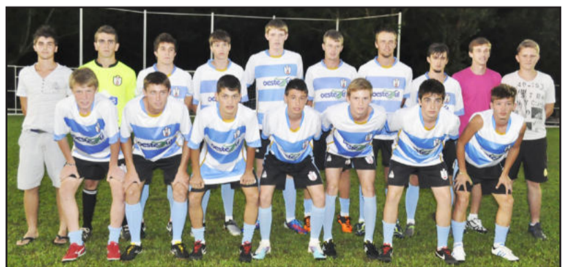
Saidera / Só Alegria - Sub-20