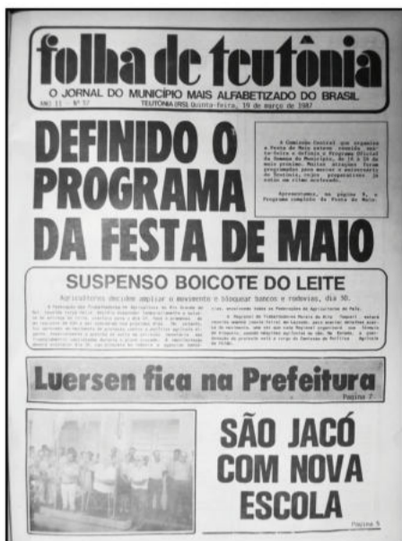
Ortografia mantida conforme edição da época