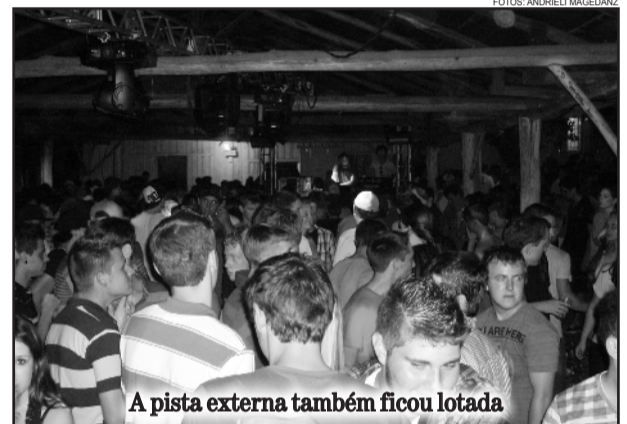
A pista externa também ficou lotada