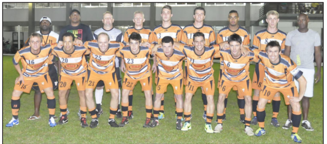
Força Jovem - Força Livre