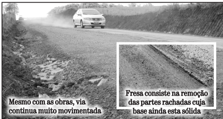
Mesmo com as obras, via continua muito movimentada