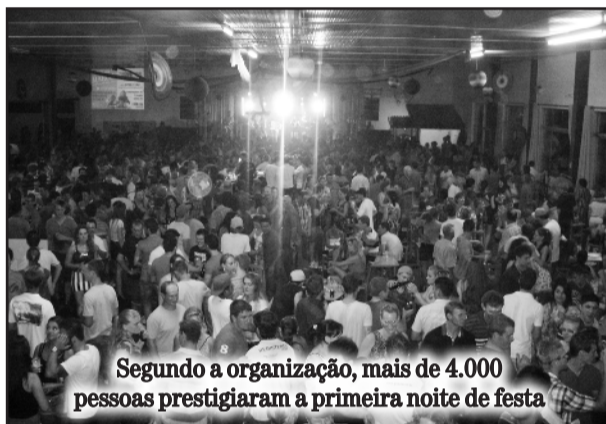
Segundo a organização, mais de 4.000 pessoas prestigiaram a primeira noite de festa

O evento foi organizado pela Sascpa, com apoio de Flach Eventos e demais patrocinadores.