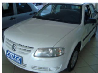
Gol G4 1.0 4P AQ R$ 23.900,00

Aberto de segunda a sexta das 8h às 18h30min. Sem fechar ao meio dia e nos sábados das 8h às 16h.