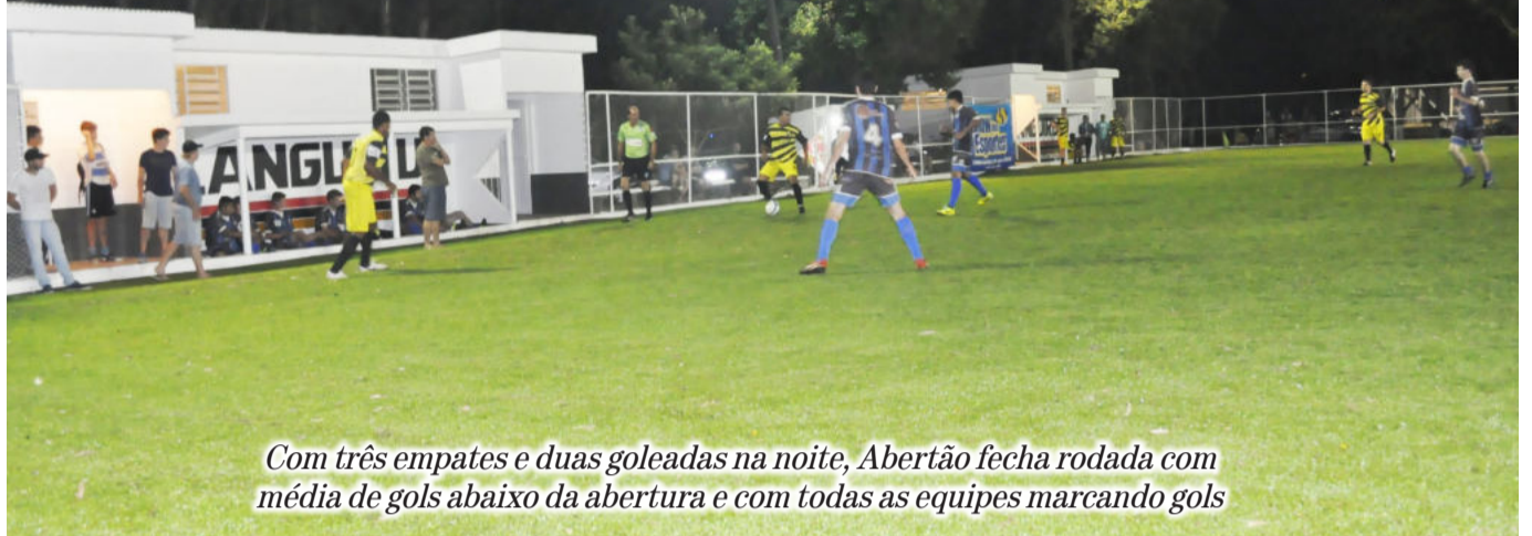
Com três empates e duas goleadas na noite, Abertão fecha rodada com média de gols abaixo da abertura e com todas as equipes marcando gols