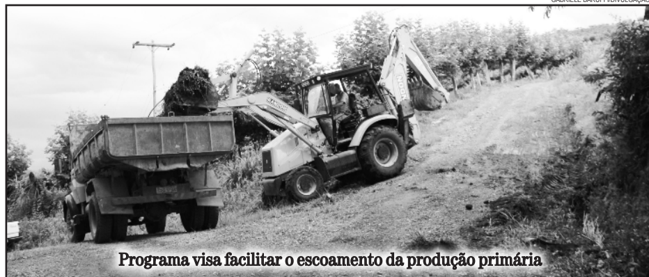
Programa visa facilitar o escoamento da produção primária

Informações e dúvidas podem ser obtidas na secretaria de Agricultura e Pecuária pelo telefone 3462.8222.