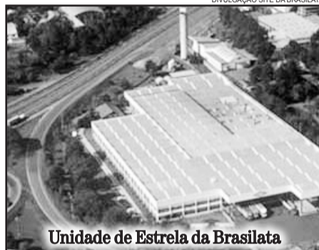
Unidade de Estrela da Brasilata