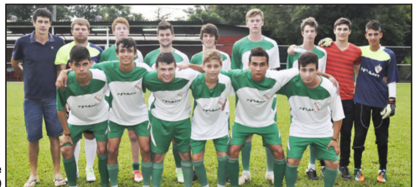
Imigrante - Sub-20