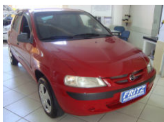
Celta 1.0, 4P R$ 14.900,00