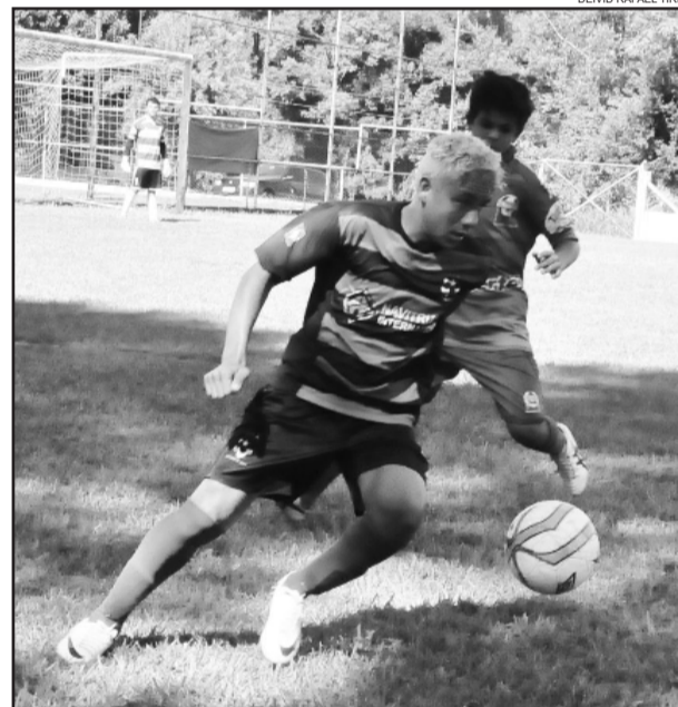
Garotada entra em campo para jogos eliminatórios a partir de hoje, em cinco campos de Teutônia

Dois categorias da escolinha Juventus (1998 e 1999) conseguiram bons resultados nas rodadas de sábado e domingo e encaminham suas vagas à próxima fase (mata-mata). Outras categorias (2002, 2001 e 2000) dependiam dos jogos de ontem para passar de fase.