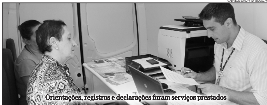
Orientações, registros e declarações foram serviços prestados

A iniciativa foi da Prefeitura de Garibaldi, através da Secretaria Municipal de Planejamento, Indústria e Comércio, com apoio da Associação de Pequenas e Médias Empresas de Garibaldi - Apeme, CDL e CIC Garibaldi.