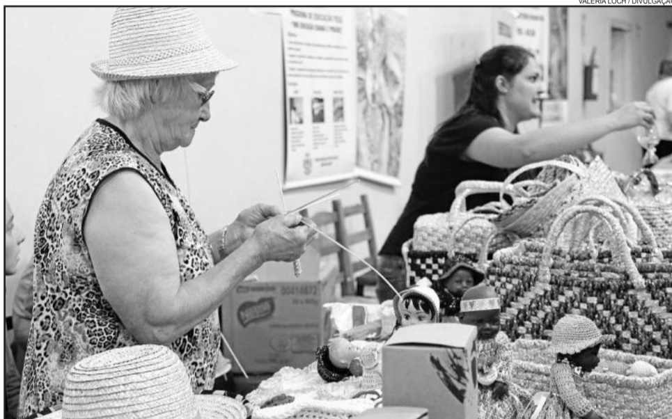
Evento alusivo ao Dia Mundial da Alimentação foi sediado em Garibaldi, no dia 16

te ao trabalho que fazemos desde 1987, quando tiveram início os encontros intermunicipais voltados à alimentação. Ele tem uma