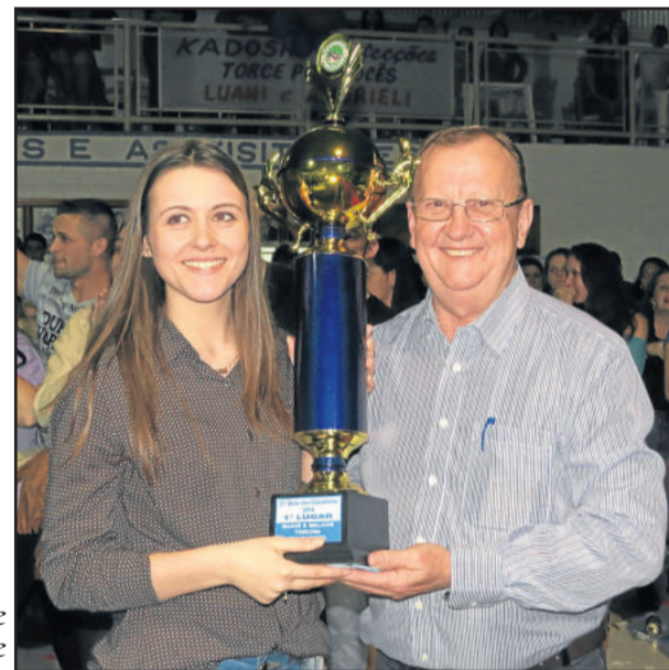
Título de melhor e maior torcida da noite

Também foram premiadas as maiores e melhores torcidas da noite, que receberam troféu e vale cervejas. O 5º lugar ficou para a Calçados Klepker, 4º para Piccadilly Boa Vista, 3º para Coqueiro Bordados e Confeccões, 2º para Beira Rio e o 1º lugar, a maior e melhor torcida da noite, foi para a Piccadilly Canabarro.