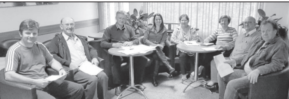
Comissão organizadora de Teutônia prepara 1ª Olimpíada Esportiva Microrregional para a Terceira Idade

A Administração Municipal de Teutônia, através das Secretarias de Cultura e Turismo e da Juventude Esporte e Lazer, com apoio da Federação Estadual dos Clubes da Terceira Idade do RS, organiza uma atividade pioneira no município de Teutônia. Trata-se da 1ª edição de jogos direcionados para a terceira idade.