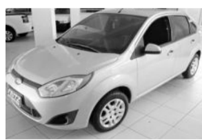
Fiesta Sedan 1.6 R$ 31.800,00

Aberto de segunda a sexta das 8h às 18h30min. Sem fechar ao meio dia e nos sábados das 8h às 16h.