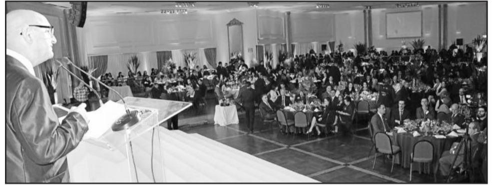
Kubaski (c) salientou importância do reconhecimento

Uma solução criativa encontrada pela Certel para agilizar o envio de documentos e informações ao Ministério do Trabalho e Emprego - atendendo ao eSocial, que deve vigorar a partir da metade do ano que vem - foi uma das iniciativas que rendeu à cooperativa o Prêmio Top Ser Humano 2014, concedido pela seccional gaúcha da Associação Brasileira de Recursos Humanos (ABRH-RS). A Certel concorreu ao prêmio com o projeto "Para o eSocial, assuntos burocráticos e funcionais ainda são dever do RH: mas a gestão pode ser diferente, com estratégia e criatividade". A entrega da distinção ocorreu na noite de quarta-feira, 1º de outubro, na sede do Grêmio Náutico União, em Porto Alegre.