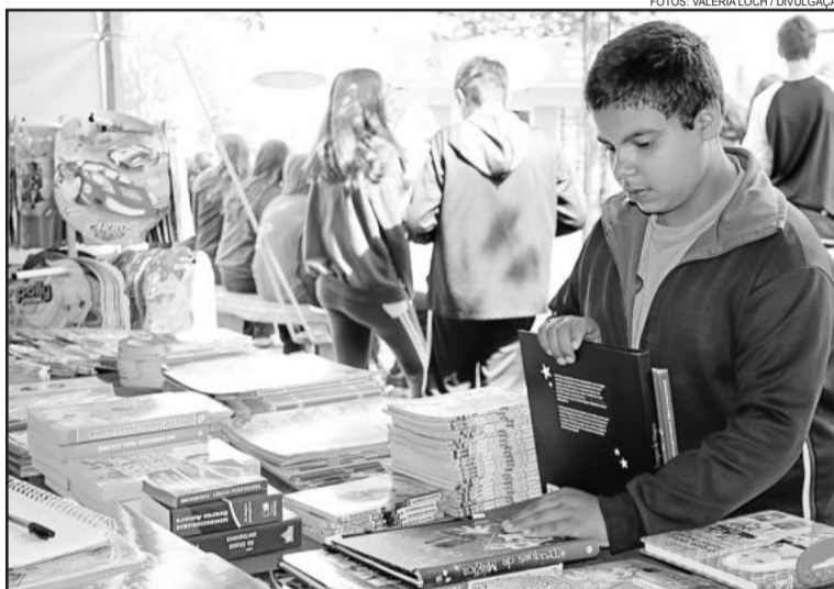
Feira do Livro de Garibaldi inicia hoje e segue até o próximo sábado, na Praça Loureiro da Silva