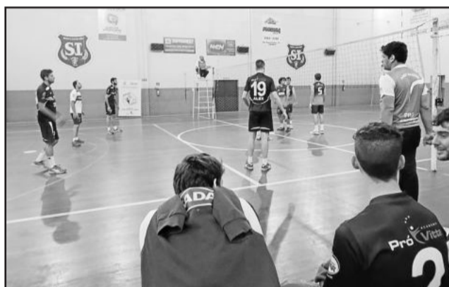
Campeonato reuniu equipes de Garibaldi, Roca Sales, Porto Alegre, Bento Gonçalves e Carlos Barbosa