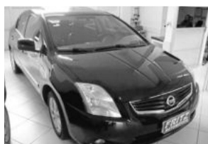
Sentra SL 2.0 Consulte