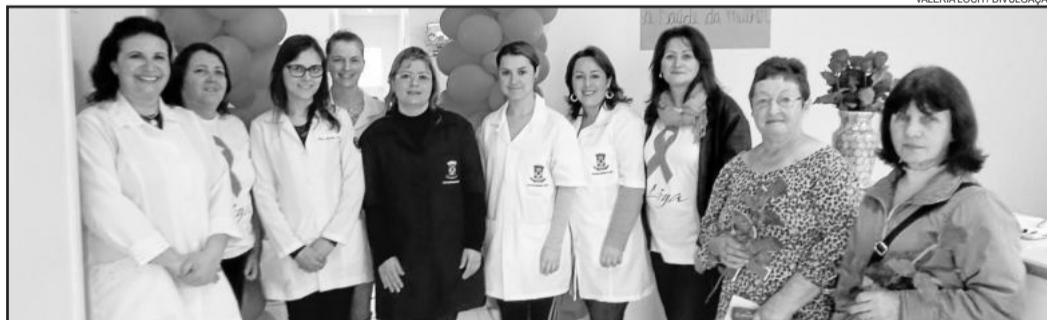
Mulheres foram atendidas no Posto Chácaras no dia 11

Conforme a secretária de Saúde, Simone Agostini de Moraes, foram atendidas mais de 85 mulheres apenas nos sábados, além dos atendimentos habituais durante a semana. No sábado, dia 4, o plantão foi realizado no Posto Central, no dia 11, no Posto Chácaras, e no dia 18, no Posto Santa Terezinha.