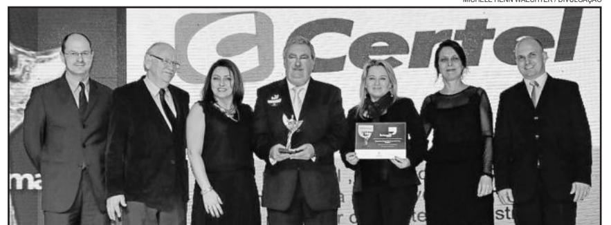
Representantes da cooperativa no ato da premiação