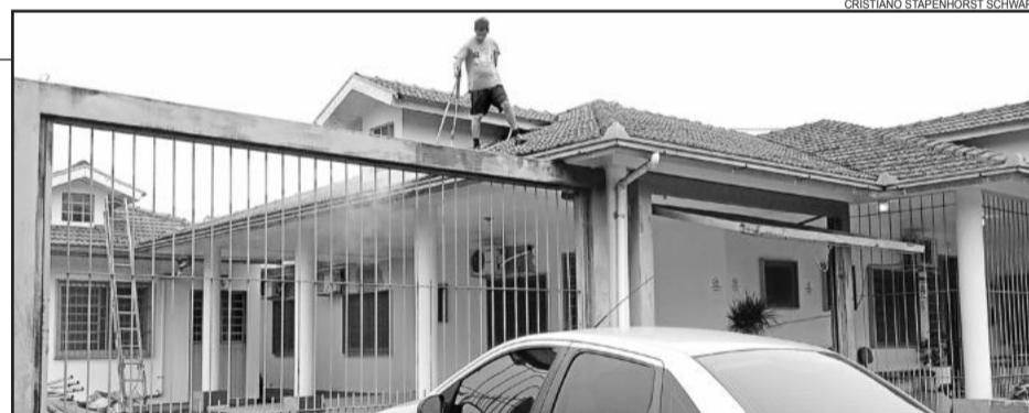
Lavagem do telhado é a primeira etapa

infraestrutura necessária são fundamentais. Outra atenção é com os veículos. Contamos aqui em Westfália com a van mais moderna da Região para remoção de pacientes, adaptada para cadeirantes. Investir em Saúde é atenção para a comunidade", finalizou o Prefeito Sérgio Marasca.