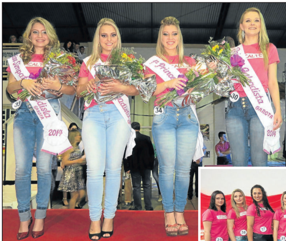
Vencedoras na categoria Garota Calçadista