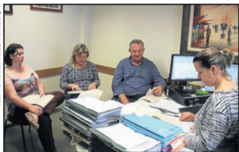
Encontro para articular ações ocorreu no Ministério Público

A implementação da logística reversa no município de Estrela, principalmente em relação ao destino correto de lâmpadas, pautou encontro