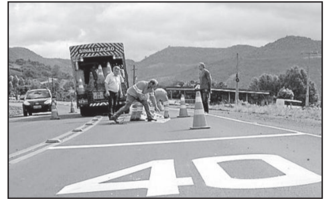
Velocidade máxima no trecho é de 40 km/h