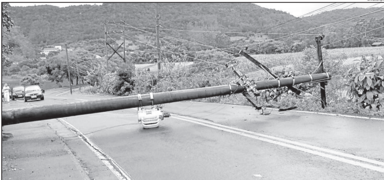
Queda de poste entre os municípios de Colinas e Imigrante resultou em falta de energia

Colinas e Imigrante permaneceram durante toda sexta-feira sem energia elétrica