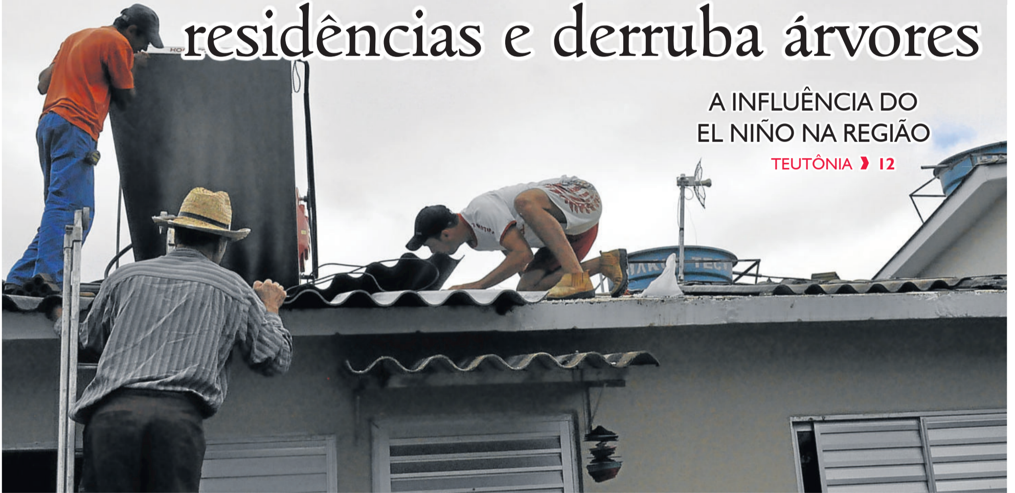
Temporal atingiu a região no final da tarde de quinta-feira, dia 19, e causou prejuízos. Em Teutônia (foto), casas foram destelhadas. VALE DO TAQUARI > 4 E 6