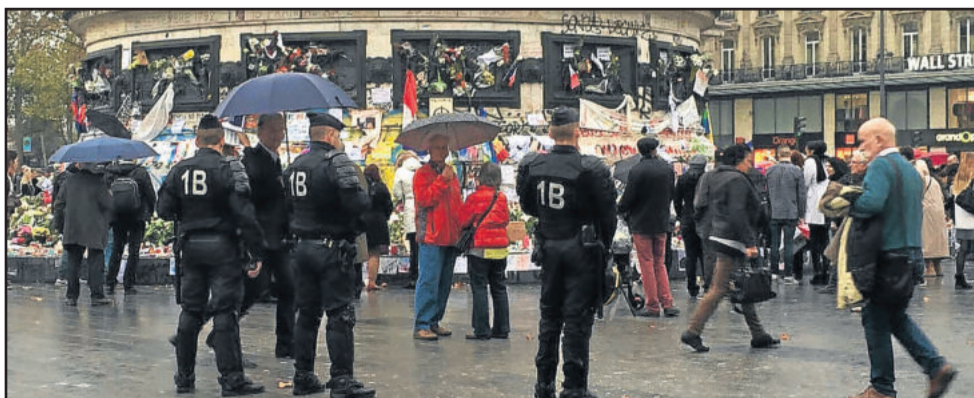
Clima ainda é de tensão