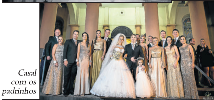
Casal com os padrinhos