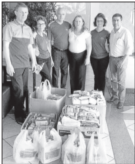
Doações alimentares recebidas no Teutônia Fashion Day