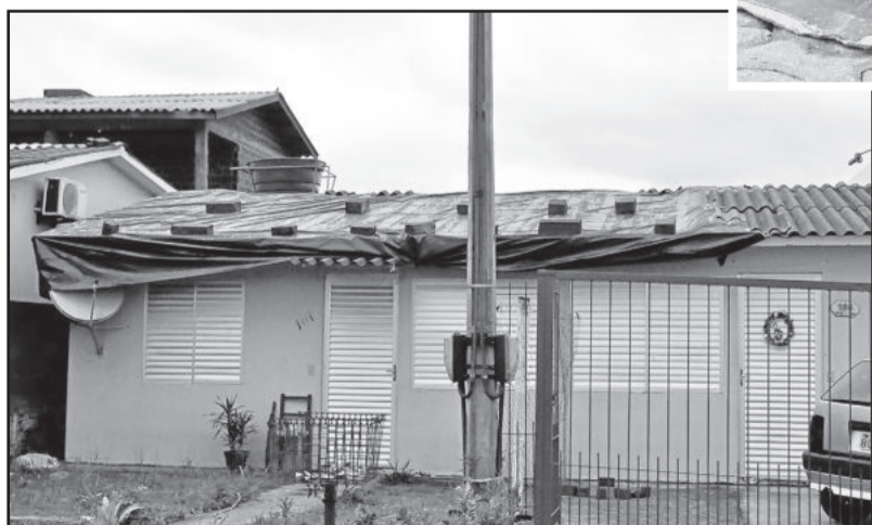
Residência ficou completamente destelhada

O trabalho da sexta-feira foi para reconstruir os estragos