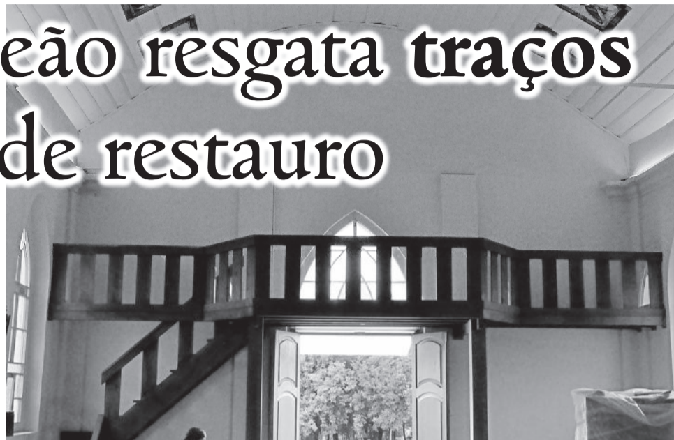
Cantoria da capela foi reformada, lembrando a original

Imagens de santos e quadros da via sacra também passaram por restauração, assim como o teto, o mobiliário e os bancos foram recuperados. A imagem de São Pantaleão instalada na Igreja é do ano de 1851 e feita de madeira. De igual forma, a réplica passou por restauração. Ainda foi reformada a cantoria da Igreja, ao fundo do prédio, que foi afetada com o passar do tempo. As obras de