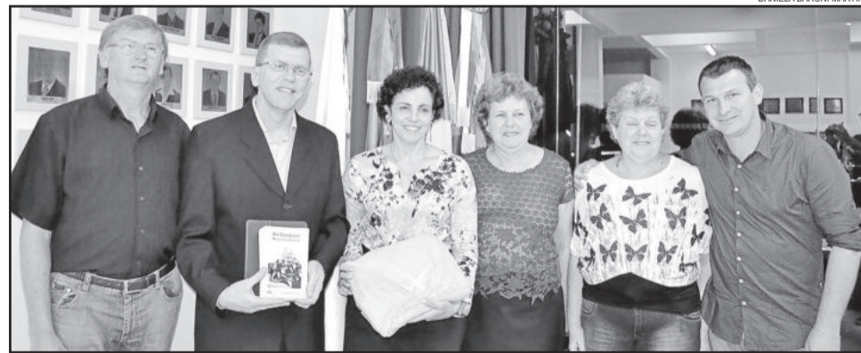
Familiares entregaram documentos aos vereadores

A próxima sessão ordinária da Câmara de Vereadores de Teutônia ocorrerá no dia 26 de novembro, a partir das 18h30min.