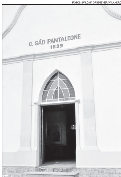
Pintura externa foi uma das melhorias no local

O restauro representou investimento total de R$ 883.176,37, captado através da LIC.