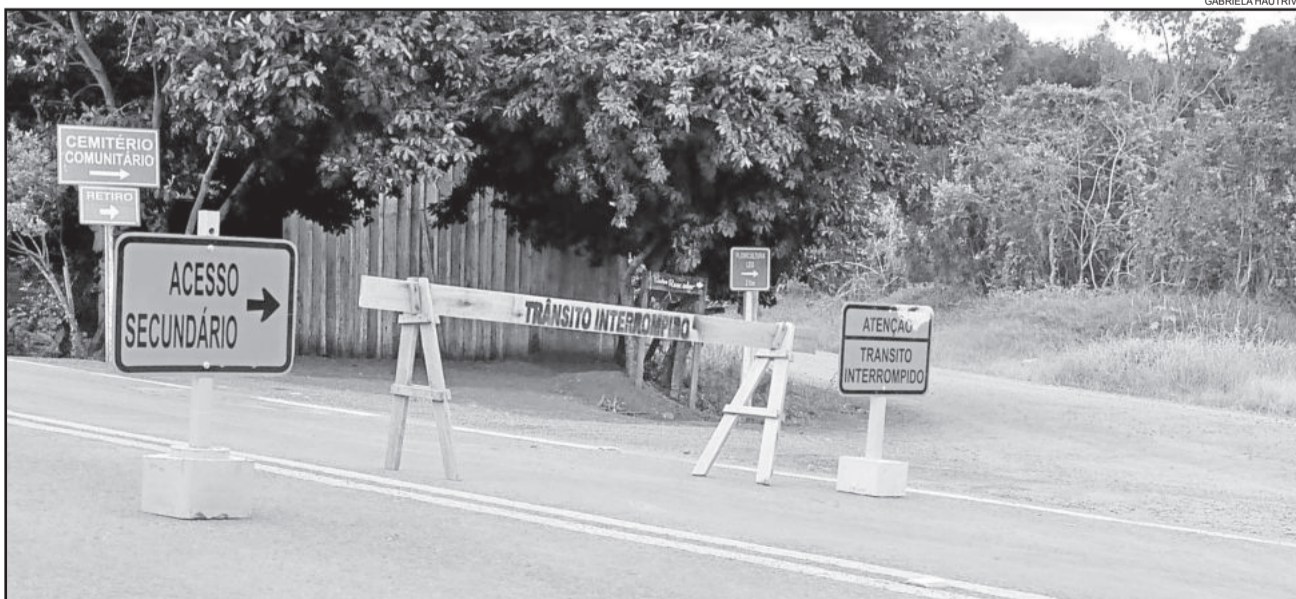
Em Colinas diversas ruas foram interditadas