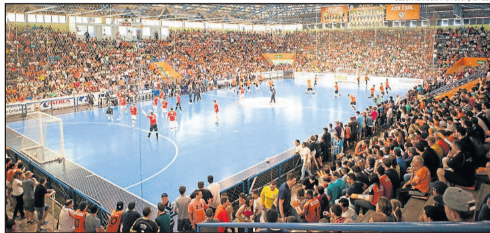
O jogo de volta ocorrerá no dia 29, em Carlos Barbosa

O segundo lote será vendido pela internet pelo valor de R$ 30,00 + taxas de conveniência. A venda online também começará na segunda-feira. Será permitido apenas três ingressos por pessoa. Sócio Ouro terá entrada franca. Menores de 11 anos não pagam ingresso.