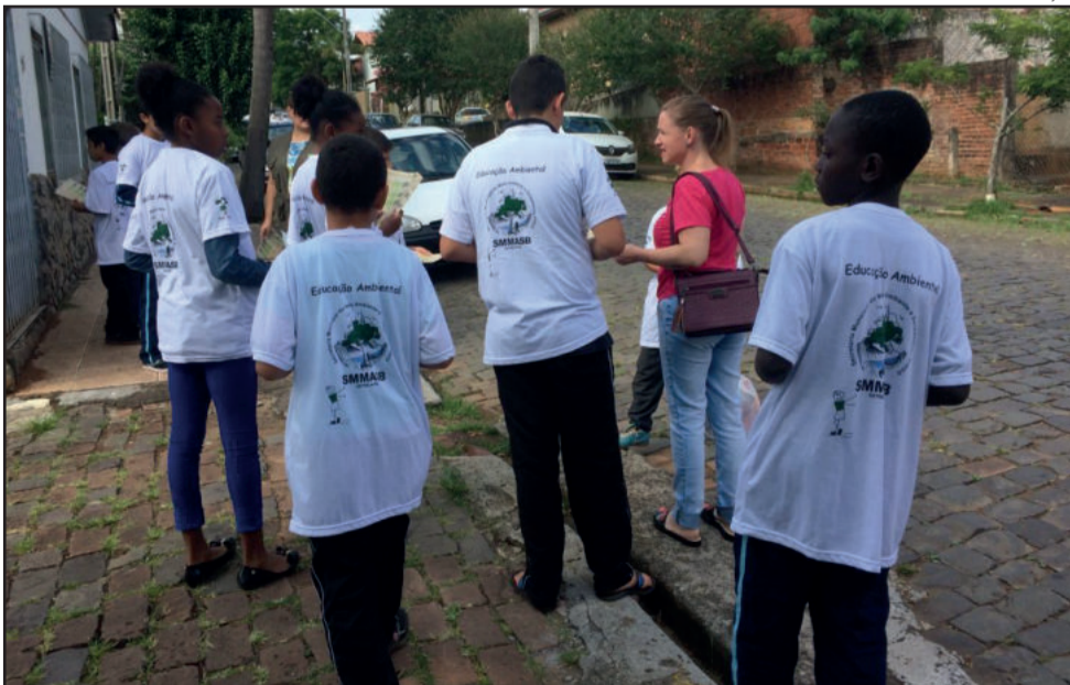
Agentes mirins percorreram Bairro Alto da Bronze para divulgar a coleta seletiva de lixo

Grupo visitou moradores do Bairro Alto da Bronze, ressaltando importância da separação do lixo