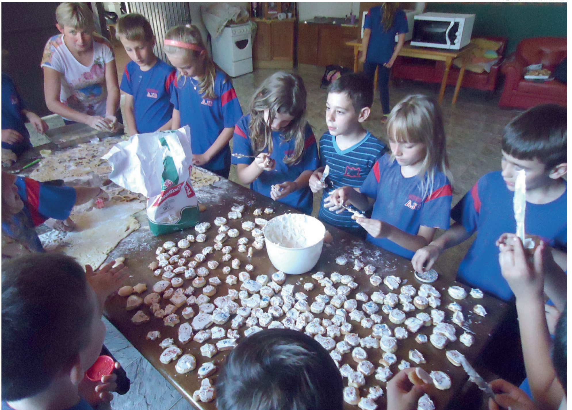
Receitas de bolachas foram ensinadas a mais de 60 alunos