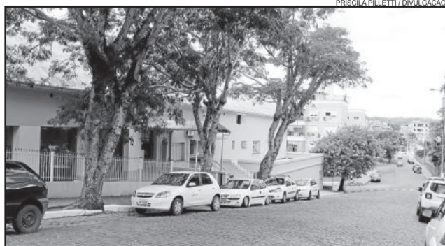
Novo endereço do Sine, na rua Irmão José Sion

O Sine é o órgão responsável pela confecção de carteiras de trabalho, encaminhamento do Seguro Desemprego, captação de vagas de trabalho e encaminhamento de candidatas em Garibaldi. O número de telefone será mantido o mesmo: 3462-8171.