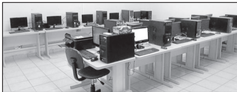
Laboratório conta com lousa digital

Os investimentos são feitos em parceria entre a Administração Municipal e o Círculo de Pais e Mestres (CPM) do educandário. Conforme a administração municipal, o objetivo é qualificar o ambiente para atender melhor os alunos.