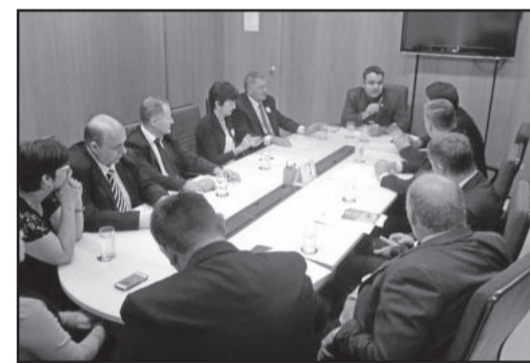
Audiência no MAPA

O prefeito também esteve com os deputados