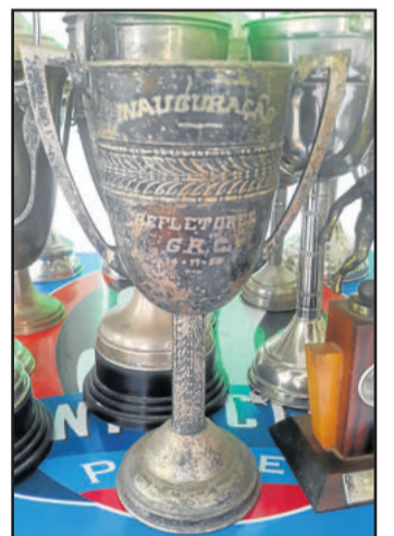
Troféu mais antigo é de 1954, na inauguração dos refletores do Canabarense

Em novembro de 1979, retratado através do livro de atas do ACE Esperança, a diretoria do clube mostrava preocupação quanto à conscientização da torcida e dos jogadores sobre a disciplina, para que não agredissem verbalmente nem fisicamente os juizes e os adversários. Na época, combinaram de usar os alto falantes nos dias de jogos para fazer a campanha de conscientização.