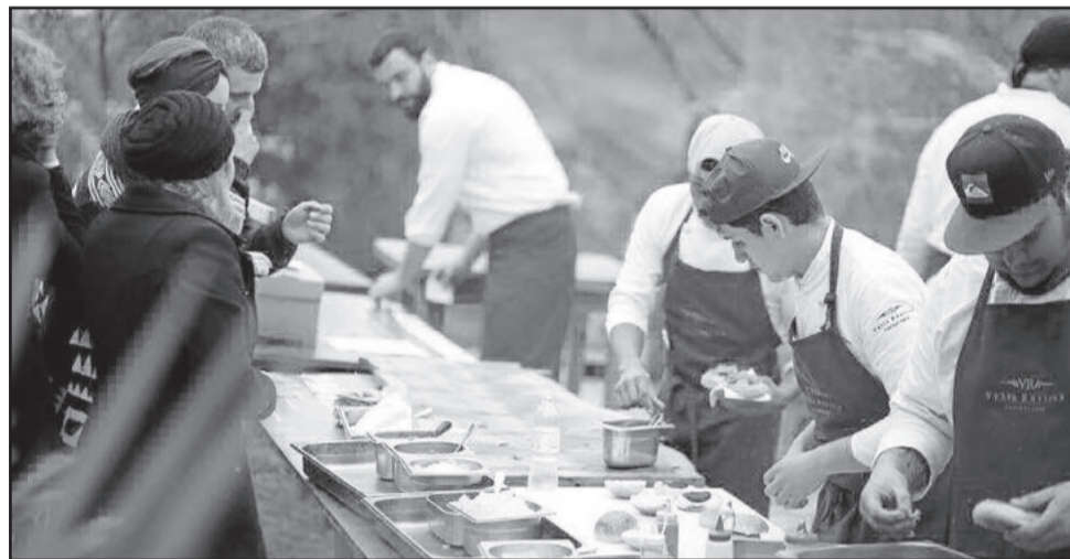
Burger e Beer

No blog do roteiro é possível ter acesso à programação completa de Carnaval e também aos horários de atendimento dos atrativos. Todos atenderão normalmente no período: www.valedosvinhedos.wordpress.com/carnavalvalledosvinhedos