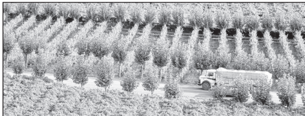
Safra segue a pleno vapor no Vale dos Vinhedos