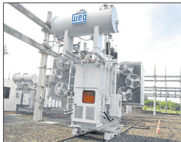
Acionamento simbólico do transformador ocorreu na quinta-feira