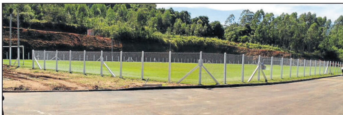
Ontem, dia 20, foi dia de dar andamento à colocação da cerca em torno do campo

O convite para participar da programação é para todas as famílias, com objetivo de comemorar esta obra tão aguardada e que estará beneficiando todo o município.