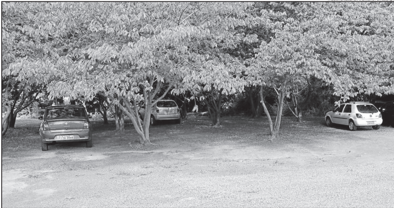
Estacionamento dentro do pátio da UBS oferece mais segurança aos munícipes