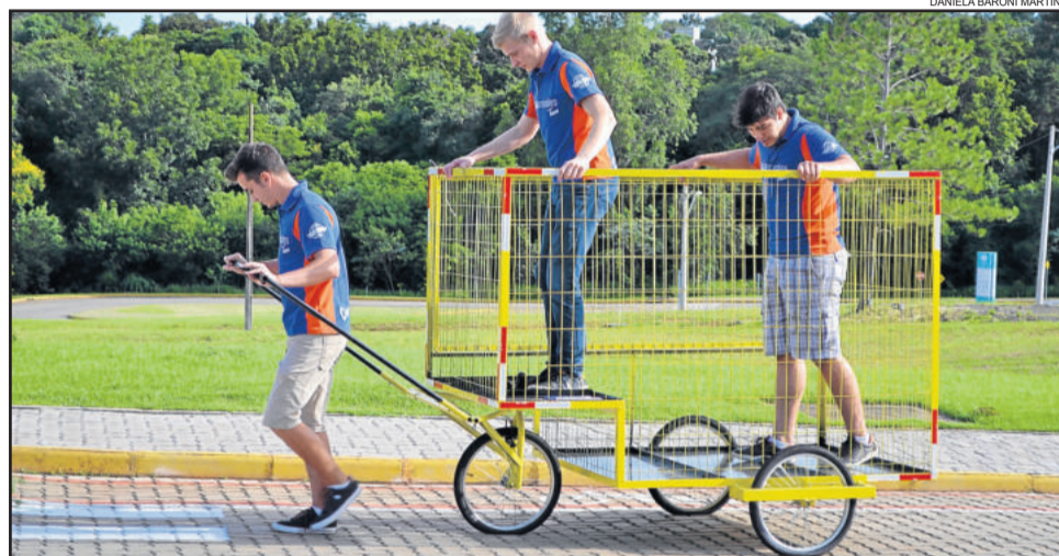
Os alunos demonstraram a utilização do carrinho

O protótipo que foi construído pelos alunos da Univates será doado para a Associação