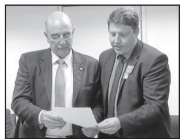
Prefeito entregou ofício para o ministro Osmar Terra

Para a senadora Ana Amélia Lemos (PP), o prefeito teutoniense solicitou recursos para a pavimentação e a recuperação de estradas vicinais do interior. Ele também foi recebido ou entregou ofícios para nove deputados federais: Elvino Bohn Gass (PT), Jerônimo Goergen (PP), Covatti Filho (PP), Yeda Crusius (PSDB), Danrlei de Deus Hinterholz (PSD), Onyx Lorenzoni (DEM), Darci Pompeo de Mattos (PDT), José Afonso Hamm (PP) e Renato Molling (PP). Para o deputado Onyx Lorenzoni foram solicitados recursos para a construção de postos de saúde e também verba para uma escola de Ensino Fundamental no Bairro Canabarro. Para o deputado Covatti filho foi solicitada verba para construção de uma creche em Canabarro.