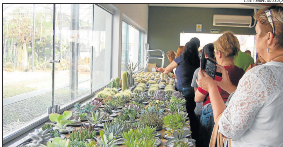
Cactário Horst foi um dos locais visitados

Os turistas que chegam ao cactário Horst se surpreendem pela imensidão de cactos e suculentas que encontram. Ele é o maior da América Latina, em termos de variedades. O empreendimento teve início na década de 1960, quando Leopoldo Horst, já falecido, começou a colecionar plantas exóticas, que eram os cactos. Ele viajou a diversos países em busca de outras variedades da planta, e inclusive encontrou novos gêneros, que inclusive, levaram seu sobrenome. Entre colecionadores e especialistas, Leopoldo tornou-se