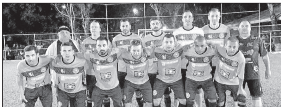
Beija Flor de Montenegro, categoria Veterano