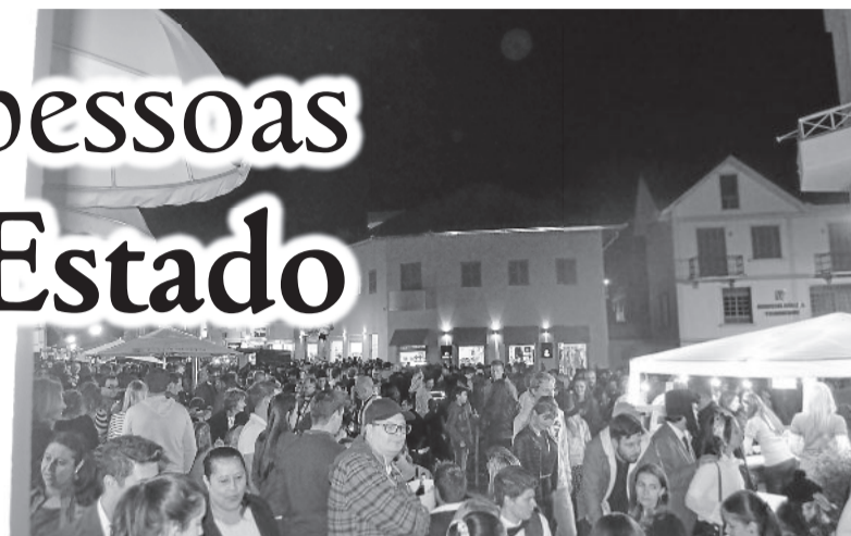
Público lotou a Rua Buarque de Macedo

O Garibaldi Vintage é uma realização da Prefeitura de Garibaldi, por meio da Secretaria de Turismo e Cultura. O evento contou com o apoio das secretarias de Obras, de Segurança, Mobilidade Urbana, da Saúde e do Sindicato de Hotéis, Restaurantes, Bares e Similares (SHRBS) de Garibaldi. A realização do Encontro de Carros Antigos do Vintage foi promovida pelo AntiGar - Carros Antigos de Garibaldi e o Veteran Car Club dos Vinhedos.