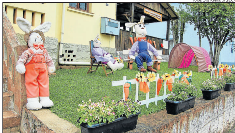
Secretaria de Educação é um dos locais que recebeu a decoração