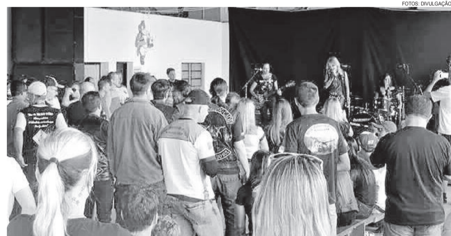
Shows animaram a tarde do evento