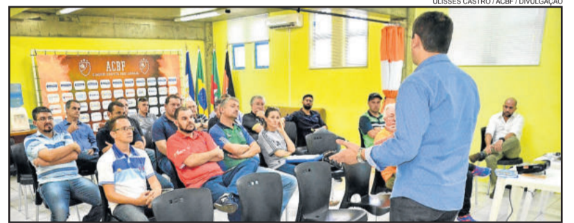
Representantes de 12 clubes estiveram em Carlos Barbosa