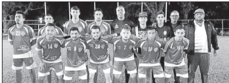
Kaxa-Baxa / Vida e Saúde, categoria Força Livre