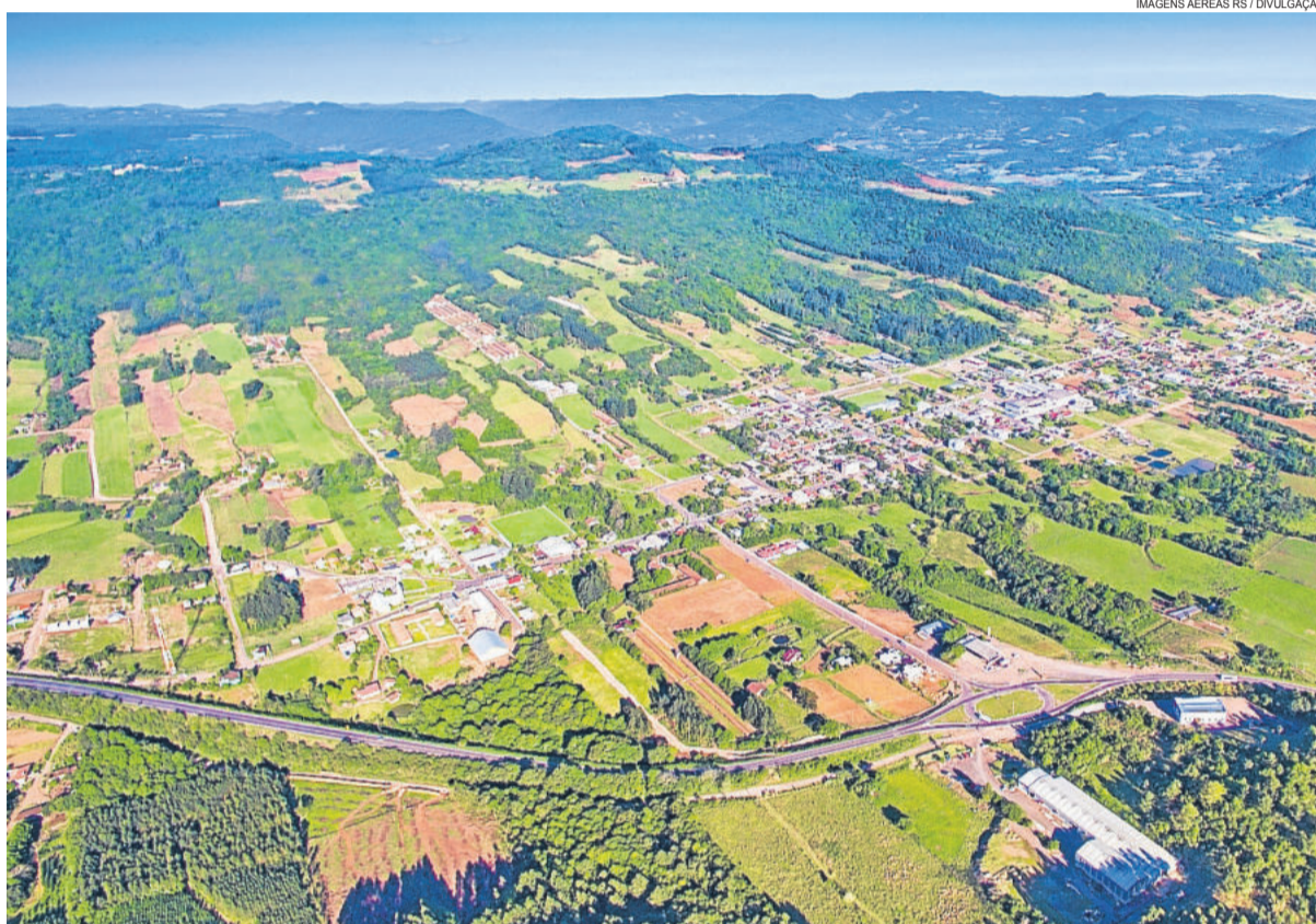
Westfália tem se destacado em diversas áreas e pelo seu crescimento ao longo destes 21 anos de emancipação e 17 de instalação

90% dos acessos. Tanto para a propriedade quanto para a indústria, há a necessidade diária de um bom acesso, por causa da grande movimentação de cargas. Por isso, nós somos parceiros destes empreendedores”, sublinha.