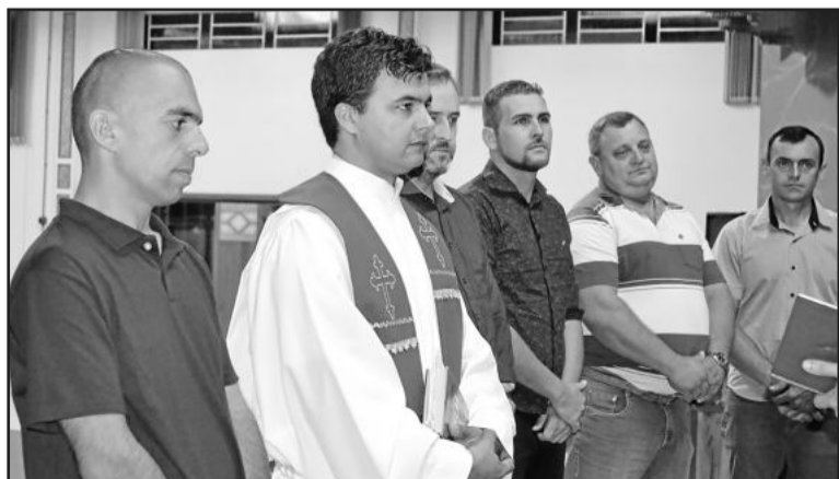
Diretoria e líderes da Igreja participaram da cerimônia

Vargas, nº 711, no Bairro Languiru, onde ocorre um culto por final de semana, com revezamento em sábados e domingos para poder receber todos os membros da comunidade. Além disso, existem dois grupos, um em Canabarro e outro em Languiru, que se reúnem mensalmente.