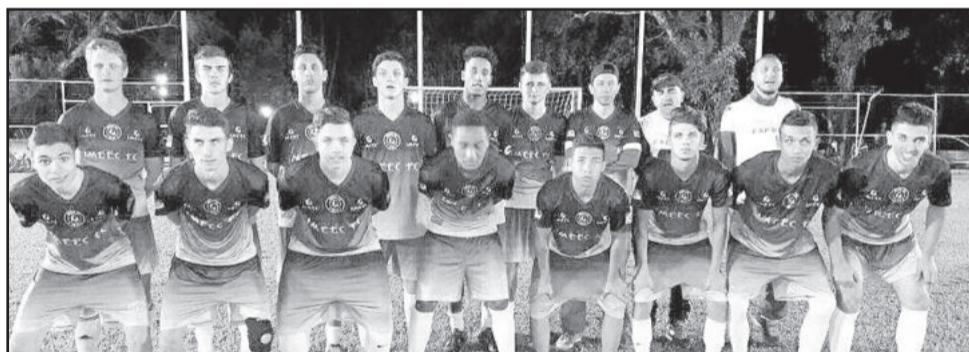
Imeec, categoria Sub-20