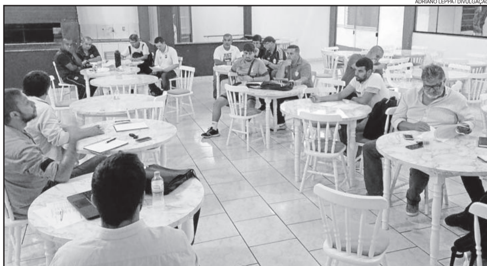
Reunião em Porto Alegre definiu formato do Gauchão Noligafi 2017

Os clubes que disputarão principal divisão do Gauchão NOLIGAFI para categorias de base deste ano, reuniram-se no estádio do São José, em Porto Alegre, na quinta-feira, dia 16. Entre os assuntos discutidos ficaram acertados os critérios de participação e a tabela de jogos para a fase classificatória do certame deste ano.