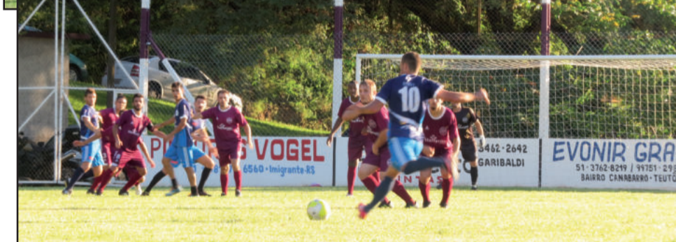
Jogo começou equilibrado e com chances claras para os dois times

Em lance de ataque do Boavistense, Kochaki cabeceou, mas a defesa do Rui Barbosa conseguiu evitar o gol