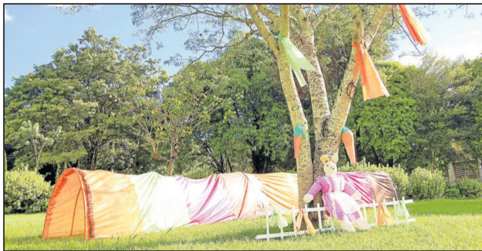
Espaços públicos de Imigrante receberam decoração de Páscoa

Imigrante será realizada nos dias 07 e 08 de abril, às 20 horas. Na sexta-feira, a recepção será com a Orquestra Jovem de Imigrante a partir das 19h15min e no sábado com a Orquestra Municipal de Imigrante, a partir das 19 horas. Não haverá cobrança de ingresso.