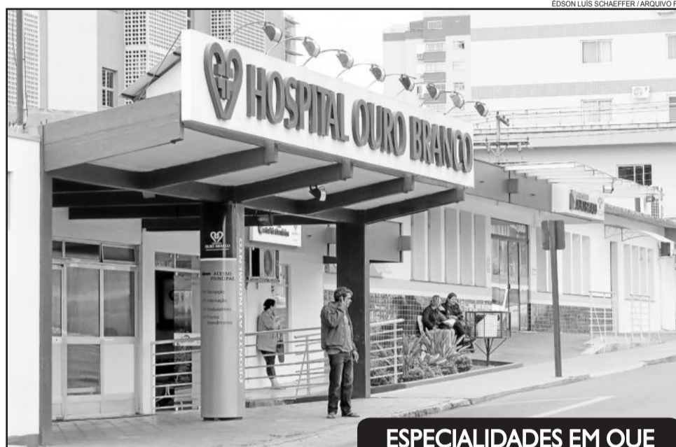
Recursos federais para o HOB virão direto para o município

Vale destacar que estes R$ 10 milhões não são recursos novos, mas de um recurso já existente que passa a ser gerenciado e repassado pelo município. "O que acontece agora é que realmente teremos mais agilidade e proximidade com as necessidades onde esse recurso precisa ser investido", explica o prefeito. Brønstrup avalia que a Gestão Plena da Saúde vai melhorar a aplicação dos recursos. "Nós estamos muito mais perto do hospital do que o governo do Estado. Sabemos muito melhor qual a realidade da cidade e da região para que possamos concentrar este recurso naquilo que realmente precisa ser implementado", pondera.