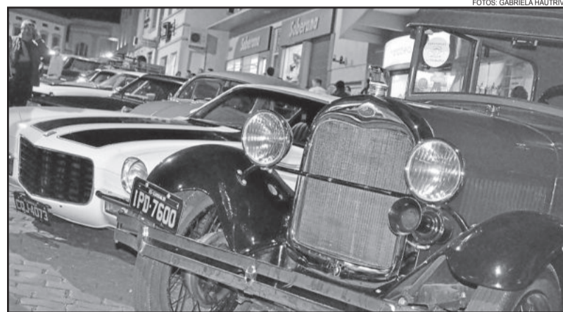
Exposição de carros antigos foi um dos atrativos da festa