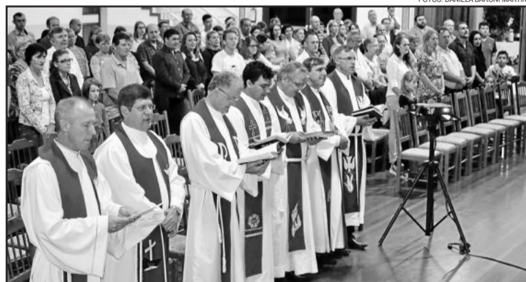
Membros prestigiaram a solenidade