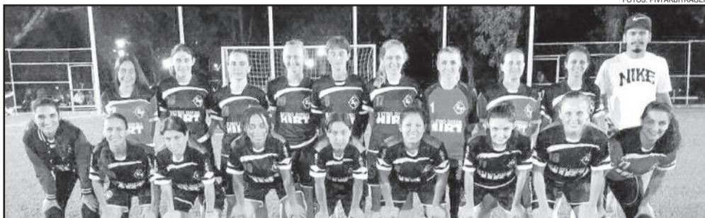
Eletro Hirt/Kipoder, categoria Feminino