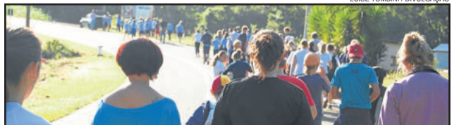
Caminhada reflexiva relembra o Calvário de Cristo

Para tanto, solicita-se que os participantes levem uma vela.