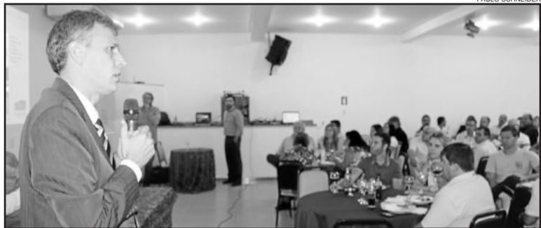
Reunião-almoço ocorreu ontem, dia 20

Ao final de sua palestra o prefeito Rafael Mallmann assinou convênio com a Cacis e com a Faculdade La Salle para a elaboração do planejamento estratégico do município para os próximos anos. O plano é um instrumento de planejamento de políticas públicas e gestão. "Temos que ter um norte, saber onde queremos chegar. Estamos felizes em fazer esta parceria", afirmou o presidente da Cacis, Verno Arend.