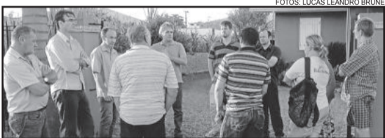
Audiência Pública definiu pavimentação de trecho da Rua Carlos Krüger