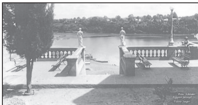
Antiga escadaria era porta de entrada da cidade

Esta é a primeira etapa de revitalização da Escadaria. Foram investidos perto de R$ 100 mil. A escada estava aterrada, então foi feita a escavação para deixá-la no nível original. Colocados os muros laterais, os balaústres e devem ainda ser transferidas as duas estátuas que representam a indústria e o comércio do município. Segundo a Central de Projetos de Estrela, a revitalização total projeta um investimento de R$ 400 mil: prevê sanitários, café, uma pequena área verde e de lazer.