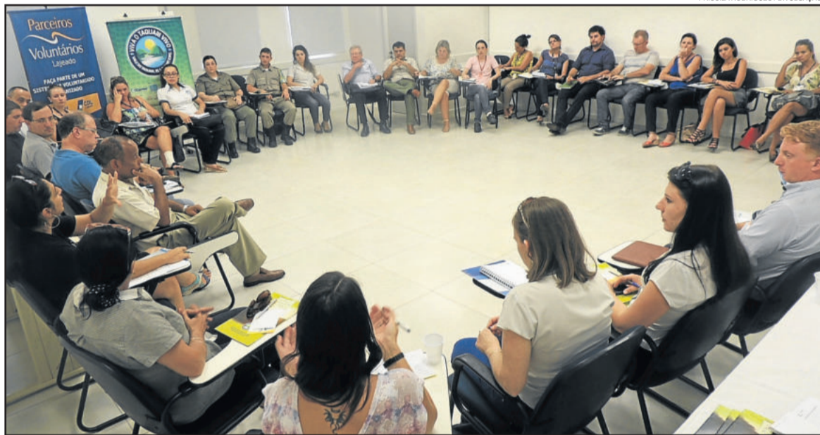
Representantes dos municípios, empresas e instituições apoiadores do projeto participaram de reunião na Acil

Entidades, empresas, organizações, proprietários de embarcações e cidadãos interessados em aderir à mobilização voluntária devem entrar em contato com a coordenadora da UPV Lajeado na sede da Acil, rua Silva Jardim, 96, Centro, Lajeado, pelo fone 3011-6900 ou e-mail parceirosvoluntarios@acilajeado.org.br.