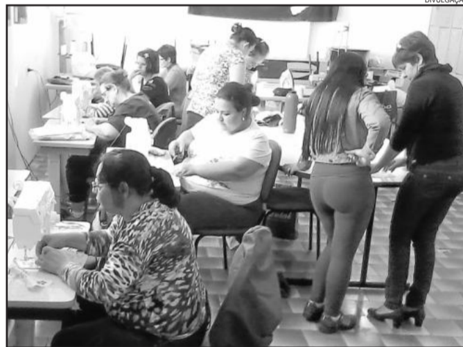
Curso de corte e costura é concorrido pela demanda no mercado

- Sexta-feira: 14h às 16h no Cras Imigrantes