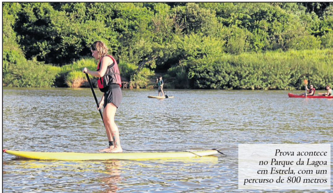
Prova acontece no Parque da Lagoa em Estrela, com um percurso de 800 metros

A participação na disputa tem inscrição de R$ 20,00, que serão feitas na hora. Parte da renda será doada a Liga Feminina de Combate ao Câncer. As categorias que disputam são livre (até 45 anos)