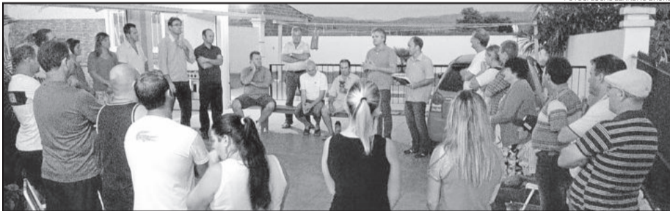
Audiência pública para pavimentação da Rua Erni Huckriede

Deste conjunto de 17 ruas, 10 receberão pavimento novo, outras 5 ruas serão beneficiadas com capa asfáltica e mais duas vias receberão uma perfilagem com remoção. Antes de iniciar a execução das obras, o Município realizará audiência pública com os moradores das ruas que receberão pavimento novo. As demais, são obras de melhorias.