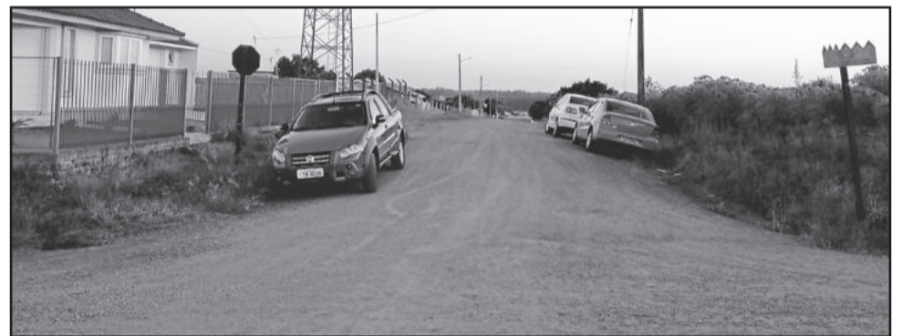
Rua Erni Huckriede será pavimentada no lote de novas ruas