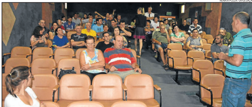
Audiência Pública foi realizada na noite de quinta-feira

Os trâmites para ampliação do perímetro urbano iniciaram em meados de 2014,