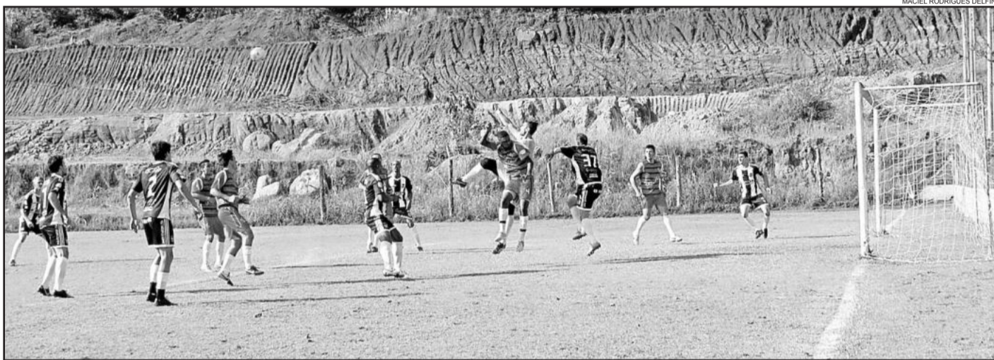
Na Chave B, as equipes classificadas já são conhecidas nos Aspirantes e Titulares

Nos Aspirantes, pela Chave A, o 11 Amigos está garantido, enquanto que Flamengo, Riograndense e Palmeiras almejam as duas vagas restantes. O Palmeiras tem a missão mais difícil, pois além de vencer terá que torcer por tropeços de seus adversários. Caso Flamengo e Riograndense vençam, estarão garantidos.