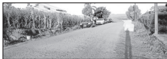
Trecho da Rua Carlos Krüger será pavimentado com blocos de concreto