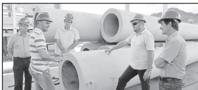
Visita à Certel Artefatos de Cimento