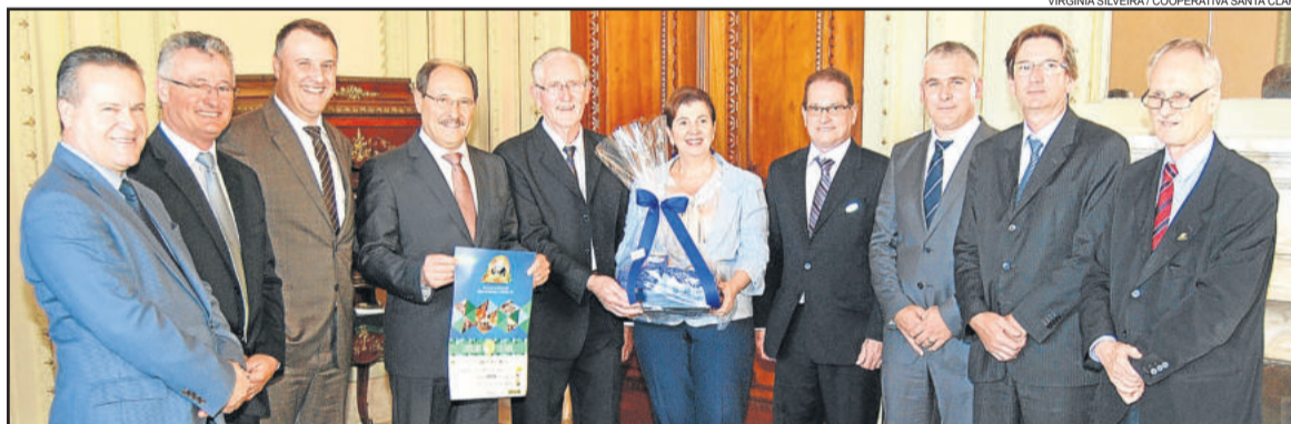
Comitiva convidou para a abertura da feira, que acontece no dia 23 de abril