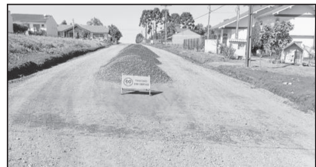
Pavimentação Rua Osvaldo Dienstmann

O trecho a ser pavimentado na Rua Carlos Krüger está compreendido entre as ruas Osvaldo Dienstmann e 24 de Maio, totalizando 2.278,40 m². O trecho que receberá pavimento asfáltico na Rua Osvaldo Dienstmann está compreendido entre as ruas 16 de Abril e Afonso Carlos Augustin, totalizando 3.006,00 m².