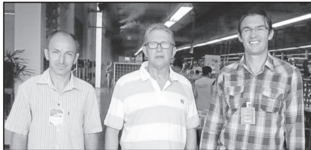
Visita à unidade da Calçados Piccadilly em Teutônia