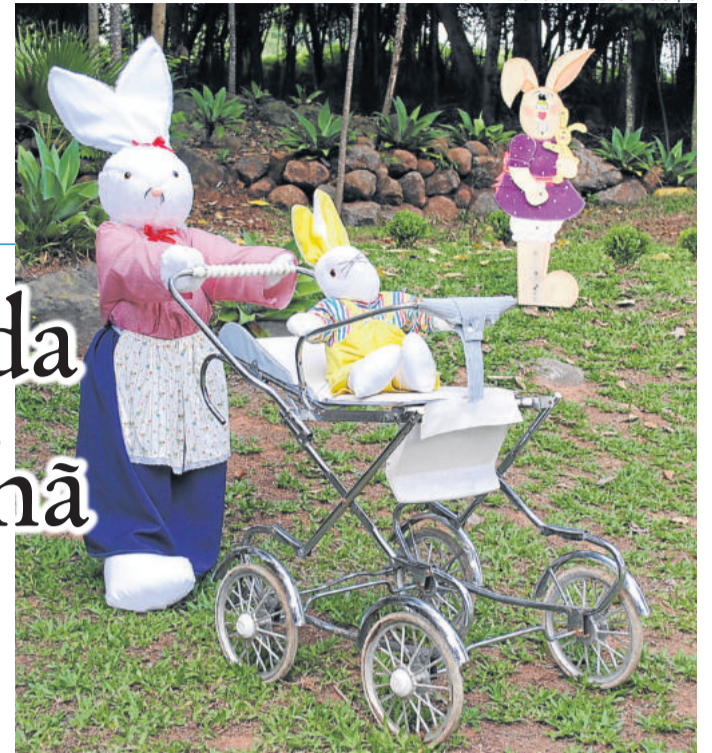
Magia da Páscoa deixa a cidade ainda mais especial

Os visitantes se surpreenderão com a alegria, a beleza, a descontração e a criatividade da cidade. Traga a sua cadeira, seu chimarrão, sente-se na praça e compartilhe com seus filhos as belas lembranças da sua infância.