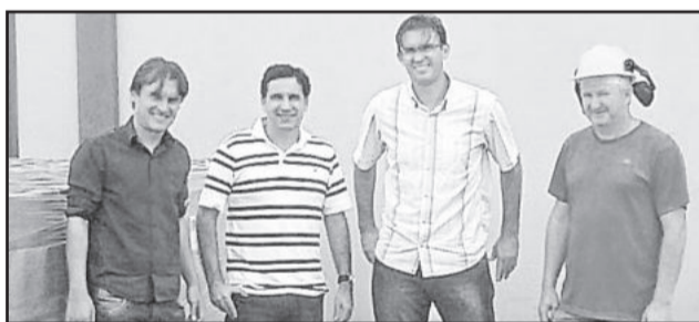
Visita à Strada Concretos