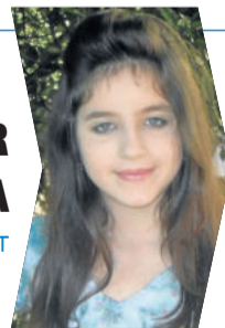
imagem refletida no espelho. E todos os amigos foram até o salão de beleza de Maria e lá a encontraram degolada. A festa parou e a tristeza se abateu sobre a cidade. Maria, tão bondosa, estava morta e agora a beleza se fora com ela.

Alguns dizem até hoje que se você disser três vezes na frente do espelho: - Maria degolada, ela aparece para você. Uns morrem de medo. Alguns não acreditam, mas ela aparece mesmo, mas não é para assombrar, é só para dar dicas de beleza. E ela é linda, a marca do pescoço ela cobriu com base, não quer assustar ninguém. Como eu sei? - Como é que vocês acham que aprendi tantas dicas de beleza? Com a Maria Degolada.