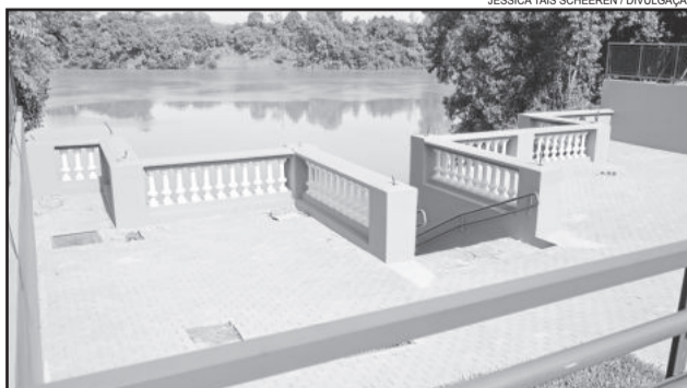
41 anos depois de desativada, volta a ser destaque