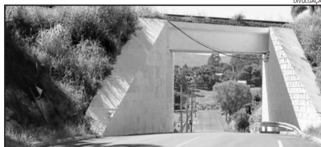
Viaduto da Cidade Baixa recebeu a pintura. Última etapa que faltava para a conclusão total da obra

do Viaduto da via férrea que está localizado no início do trecho concluído. A pintura toda em branco tem recebido vários elogios de todos que passam diariamente, pois ressalta e sinaliza o viaduto.