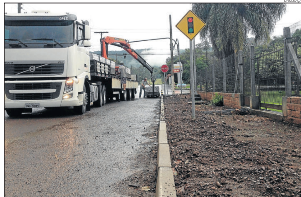
Calçada dará acesso ao Posto de Saúde