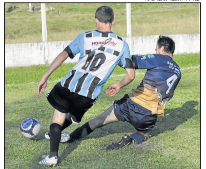
Catarinense, de Joel (10), não superou o Juventude

Com a vaga assegurada, o Juventude disputará a semifinal diante do Ouro Verde do Bairro Alesgut, atual campeão municipal. Ao final do jogo de domingo, um dirigente do Juventude foi citado em súmula e perdeu pontos importantes na disciplina, que impactaram na primeira partida em Linha Frank.