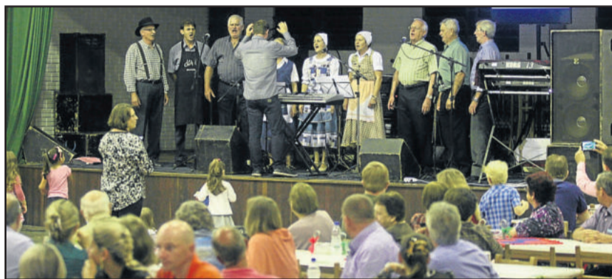
Coral fez apresentação com trajes que lembraram os antepassados