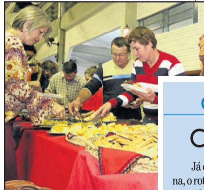
Comida esteve liberada a noite toda