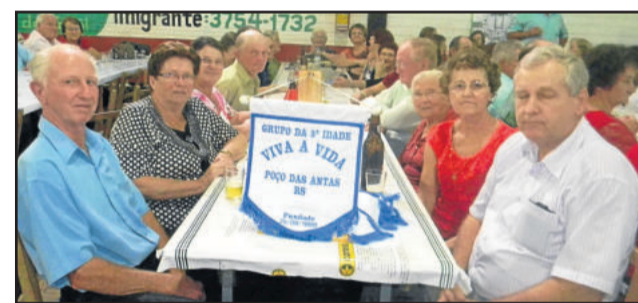
Grupo da 3ª Idade Viva a Vida