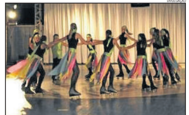
Festival reúne patinadores de várias cidades da região