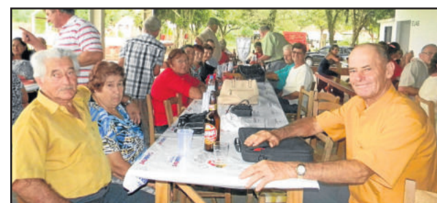
Grupo da 3ª Idade Sempre Unidos