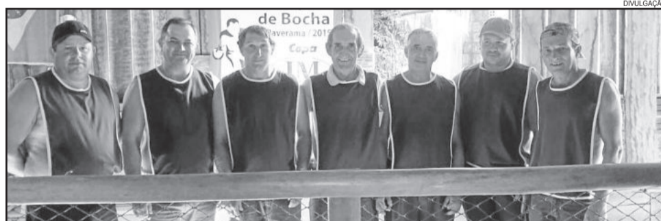
Equipe de Cabriúva assumiu a ponta do municipal