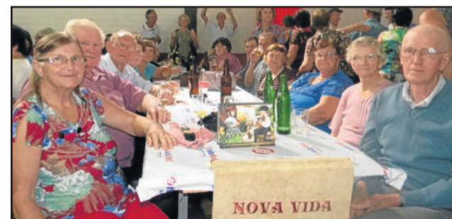
Grupo Nova Vida