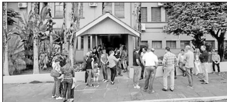
Alunos foram recepcionados no Colégio Teutônia