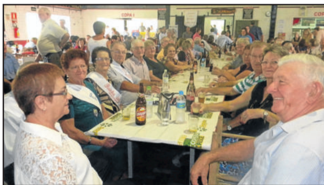
Grupo de Idosos Vergissmeinicht, o anfitrião