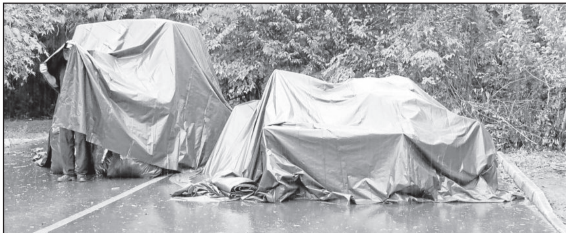
Móveis foram colocados na rua, embaixo de lona, em virtude da chuva

Vizinhos do casal estão dando um auxílio inicial, mas não escondem a revolta, pois, conforme eles, há outras residências próximas que se encontram na área verde. Uma residência, inclusive, estaria sendo ampliada para cima do arroio desta área verde, na Vila Esperança.