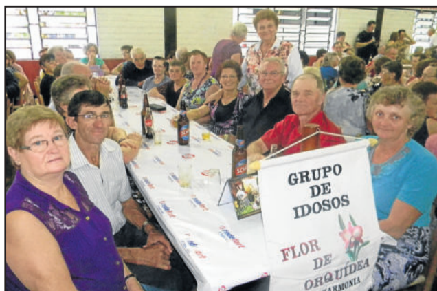
Grupo de Idosos Flor de Orquidea