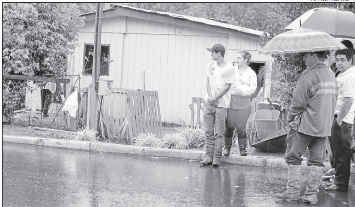
Incrédulo, o casal (sem guarda-chuva) viu-se obrigado a deixar a casa onde viveu por mais de 5 anos

Depois desta notificação em janeiro, a família constituiu advogado e recorreu ao Tribunal de Justiça (TJ/RS), porém o recurso foi apresentado fora de prazo. Por este motivo, o TJ/RS negou o recurso na quinta-feira, dia 16 de abril, e manteve a decisão de primeira instância, ou seja, pela retirada da família da área.