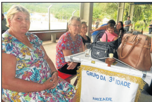
Grupo da 3ª Idade Amizade