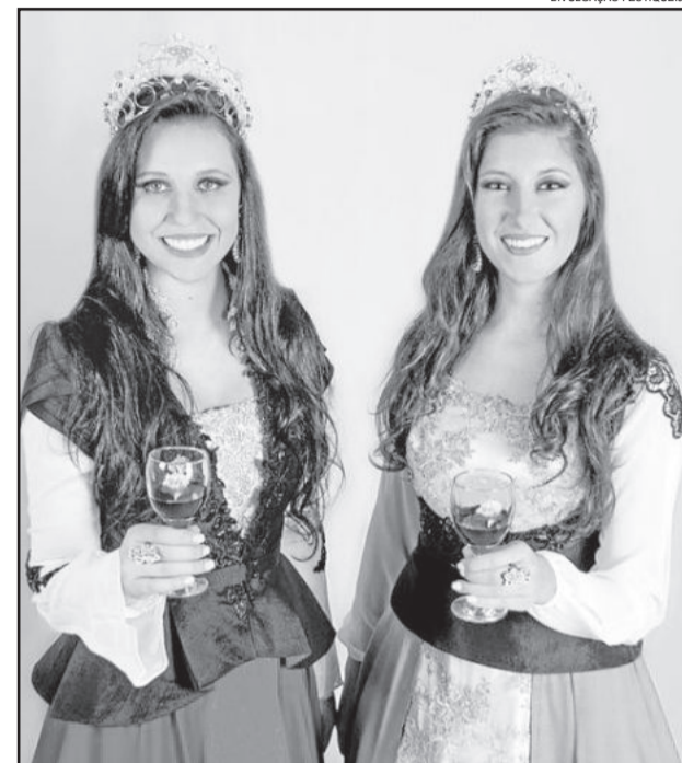
Vestidos são inspirados nos 140 anos da Imigração Italiana

O Festiqueijo é um dos mais consagrados festivais gastronômicos do Rio Grande do Sul. Anualmente, o evento recebe milhares de visitantes que chegam ao município atraídos pelas dezenas de queijarias e vinícolas premiadas nacional e internacionalmente, além da farta culinária típica italiana e eventos culturais.