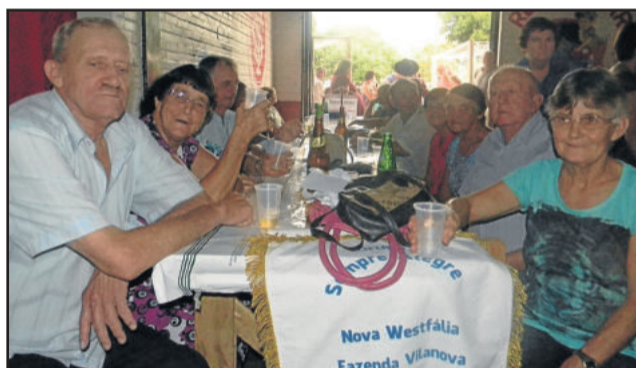
Grupo Sempre Alegre