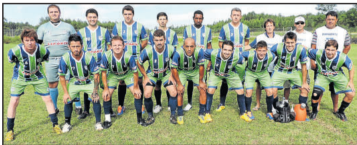
Guaíba fez o papel de casa e tem vantagem