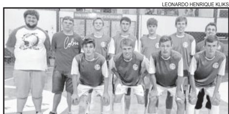
Morro do Alemão/Juventude/Boavistense categoria Sub-21

Mais uma noite de equilíbrio e de muitos gols foi registrada na 5ª Copa Juventude/Só Alegria de Futsal, em Linha Berlim - Westfália. O ginásio do Juventude recebeu quatro jogos na noite de sexta-feira, dia 17 de abril. E na próxima sexta-feira, dia 24, a competição prossegue com mais quatro confrontos.