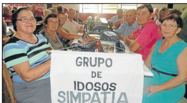
Grupo de Idosos Simpatia