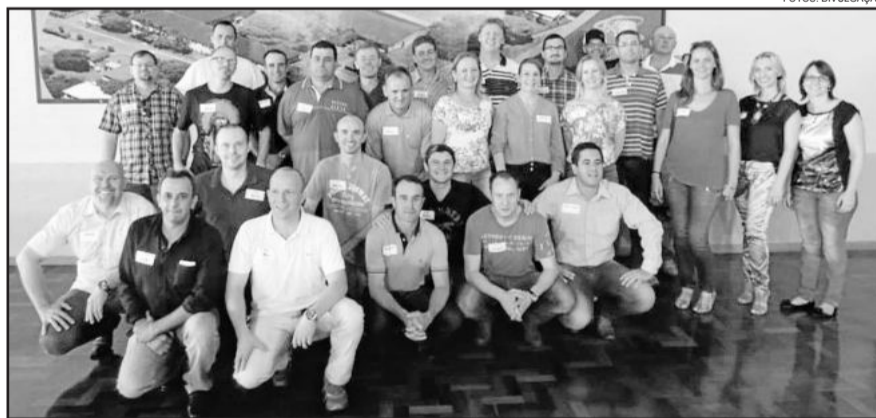
Grupo de ex-alunos teve encontro no sábado

Depois do almoço, os ex-alunos foram até a Lagoa da Harmonia, em Linha Harmonia, onde relembrou histórias dos tempos de escola.