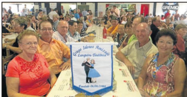
Grupo de Idosos Amizade, de Languiru - Teutônia