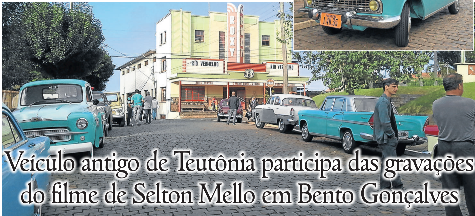
Carro figurando nas cenas das gravações