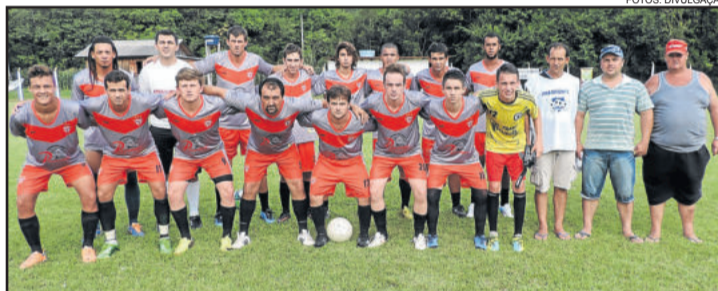
Internacional de Santa Manoela recebeu o União e venceu