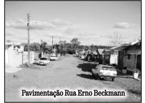
Pavimentação Rua Erno Beckmann

Rua 7 de Setembro - 176,33 metros de exten-