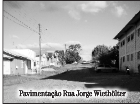
Pavimentação Rua Jorge Wiethölter

Rua Jorge Wiethölter - 117 metros de exten-