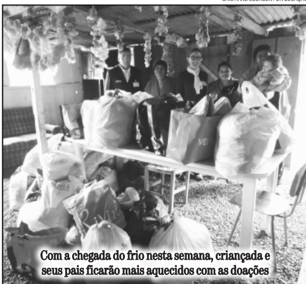
Com a chegada do frio nesta semana, criançada e seus pais ficarão mais aquecidos com as doações