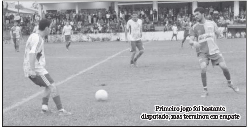
Primeiro jogo foi bastante disputado, mas terminou em empate

A disputa dos Aspirantes entre Atlético Gaúcho e Alto Taquari iniciou com a vitória da equipe do Loteamento Oito, que teve que reverter uma vantagem de dois gols, pois o