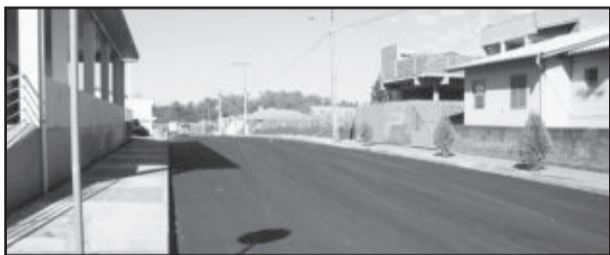
Pavimentação da Rua Esmilo Schneider