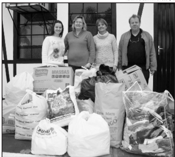
Evento Domingo Quentinho entregou agasalhos para a Assistência Social