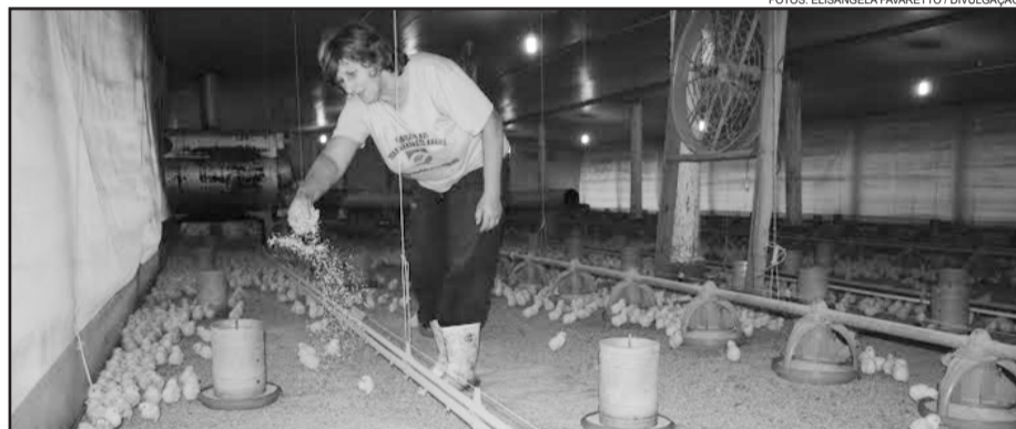
Família Haefliger investe na avicultura e produção leiteira