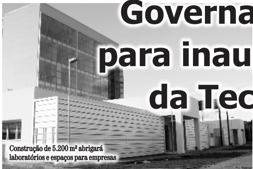
Construção de 5.200 m 2 abrigará laboratórios e espaços para empresas