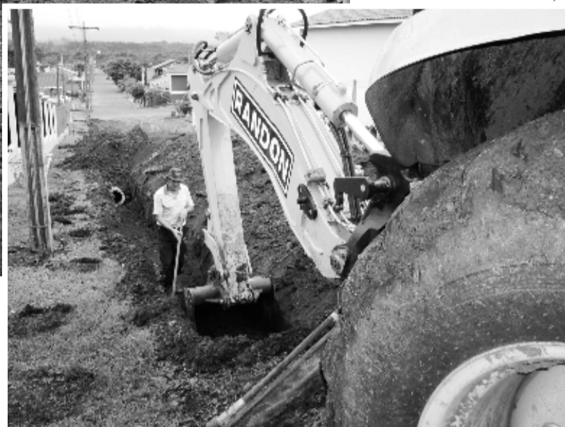
Começaram as obras de pavimentação com blocos da Rua Lauro Dickel

I nciaram nesta semana as obras para a pavimentação da Rua Lauro Dickel, no Bairro Languiru. A primeira equipe começou a fazer a colocação da tubulação pluvial para a posterior implantação dos blocos intertravados de concreto, tipo paviesse. A definição da obra ocorreu em audiência pública no início de abril, e a execução é com a empresa LED Construtora e Urbanizadora Ltda ME, que apresentou a melhor proposta na licitação.