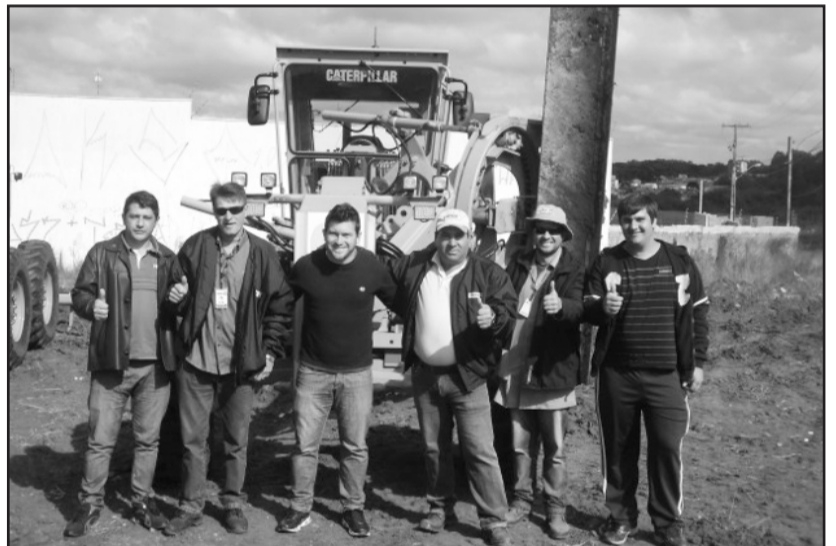
Operadores tiveram curso teórico e prático em Curitiba