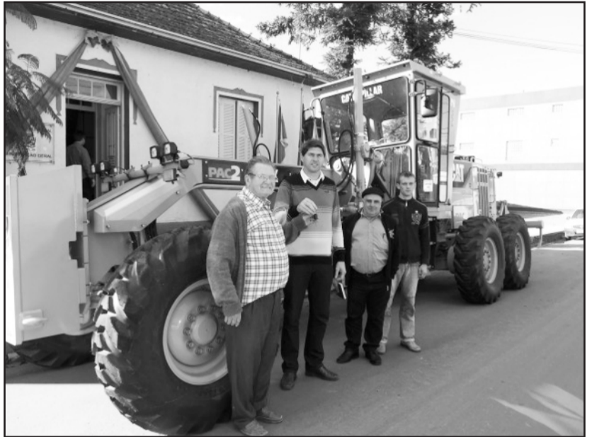
Motoniveladora foi entregue no início da semana

O PAC 2 Equipamentos destina máquinas e equipamentos para as prefeituras melhorarem a infraestrutura e recuperarem estradas vicinais para escoamento da produção e circulação de bens em municípios com até 50 mil habitantes.