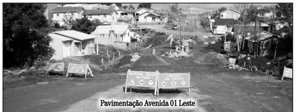
Pavimentação Avenida 01 Leste