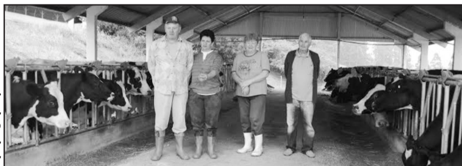
Família Fröder aposta na produção leiteira e na suinocultura