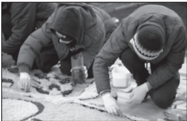
Trabalhos em Garibaldi iniciaram ainda no escuro, cheios de detalhes

Foram 415 metros de tapetes confeccionados por 11 grupos: Movimento Cursilho, Catequese, Escola Armand Peterlongo, Carismáticos, Canarinhos, Equipe Administrativa da Paróquia, Escola Dante Grossi, Instituto Irmã Teofânia, Colégio Sagrado Coração de Jesus, LEO Clube e Movimento Emaús. A coordenação dos trabalhos foi do Movimento de Cursilho com apoio da Paróquia São Pedro, Prefeitura de Garibaldi, através da Secretaria de Turismo e Cultura.