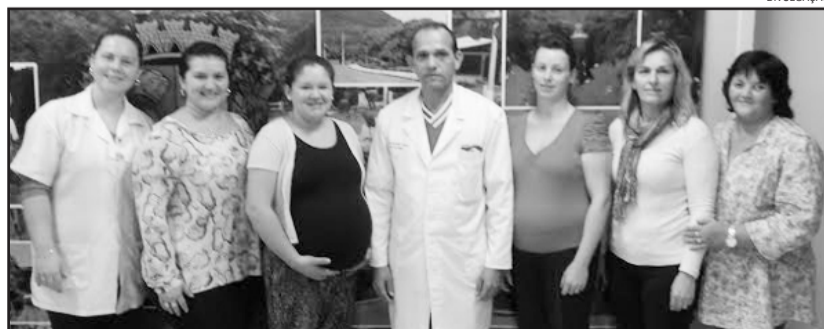
No último encontro, as gestantes aprenderam um pouco mais sobre parto