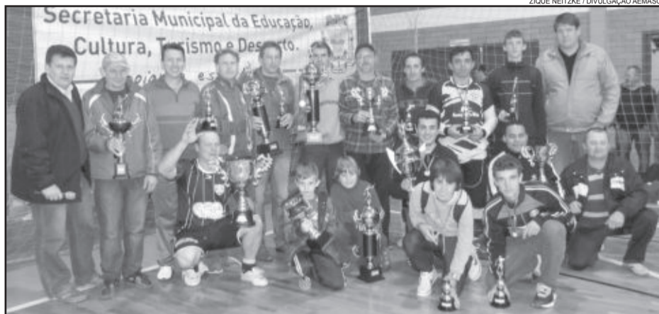
Todos os premiados mostraram que, além de adversários, são amigos fora de quadra