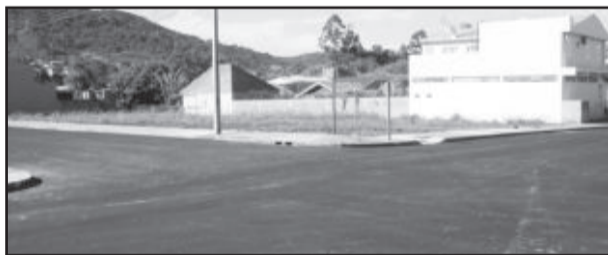
Cruzamento entre as ruas Esmilo Schneider e Santa Rosa