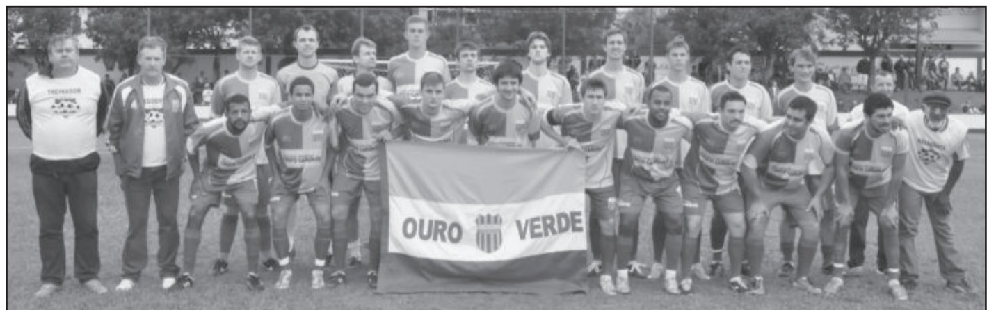
Com o empate, Ouro Verde leva o título