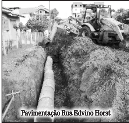
Pavimentação Rua Edvino Horst

Avenida 1 Leste - 123,68 metros de extensão por 15 metros de largura, no trecho entre as