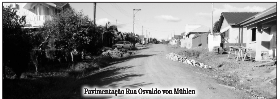
Pavimentação Rua Osvaldo von Mühlen