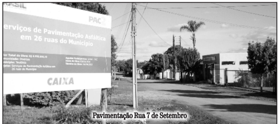
Pavimentação Rua 7 de Setembro