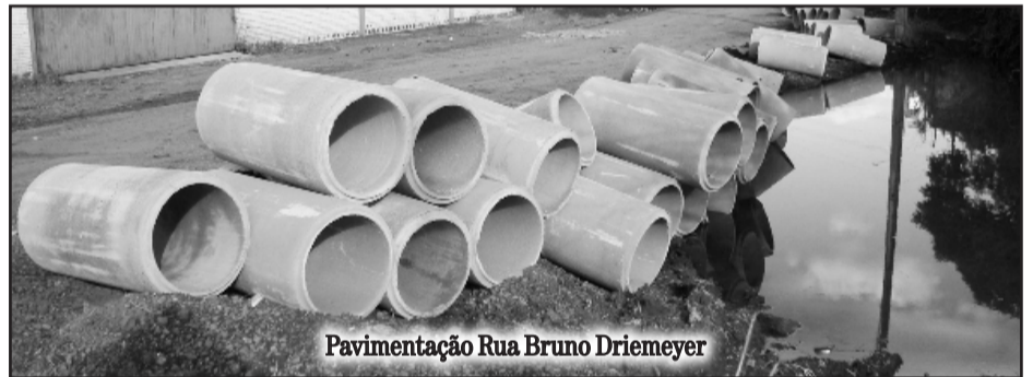
Pavimentação Rua Bruno Driemeyer