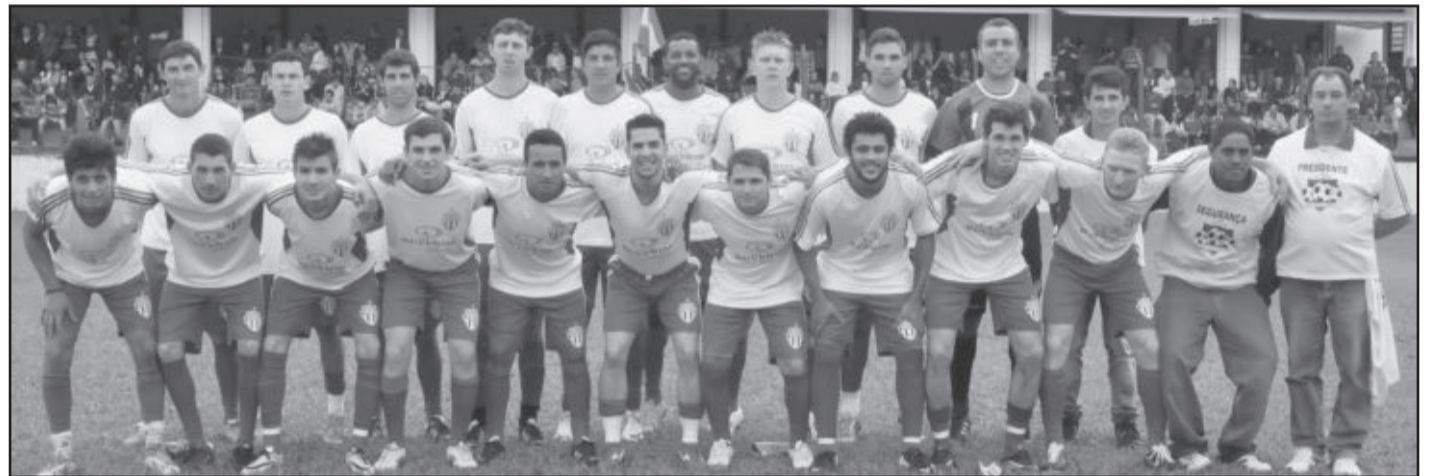
Equipe do Atlético Gaúcho precisa ganhar para faturar o título

Chave 1 – Juventude 30; União 21; Garra 19; Passo Sobradense 15; Expresso 10; Panela 6; APF 0. Chave 2 – ABELC 17; Tupan 14; Horizontina 11; América 10; Independente 9; Salto do Jacuí 7. Chave 3 – APEO 19; Soc. Atlético 14; Guarani 12; Guarany 11; AFCS David C. 6; Muitos Capões 3. * Já somados os pontos dos WO's contra a APF.