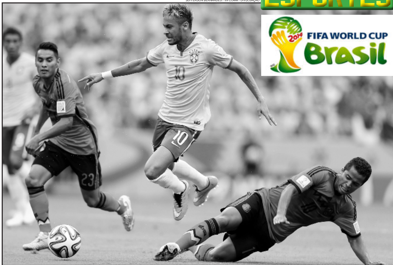
Brasil empata em 0 x 0 com o México

avisado pelo relógio que a bola entrou e validou o gol. O gol anterior em que aconteceu o uso da tecnologia foi no jogo entre França e Honduras, domingo, em Porto Alegre.