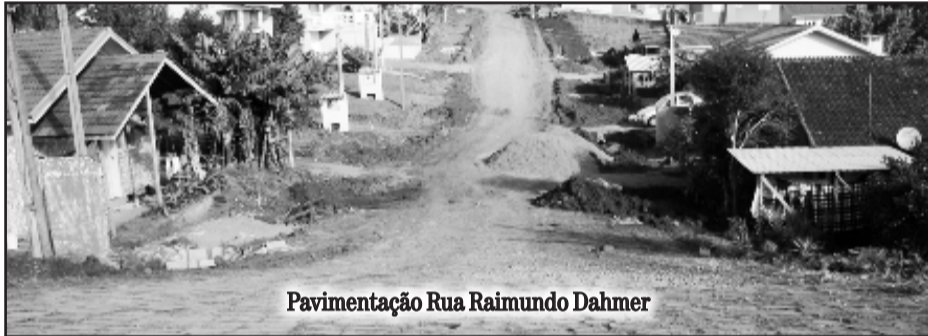
Pavimentação Rua Raimundo Dahmer

As oito vias integram o conjunto de obras do PAC2, que prevê a pavimentação asfáltica da pista de rolamento e a construção da calçada de passeio onde não existe em 26 ruas do Município. Na licitação, o valor final ficou em R$ 8,9 milhões (R$ 8.998.850,10), e a empresa Conpasul apresentou a melhor proposta.