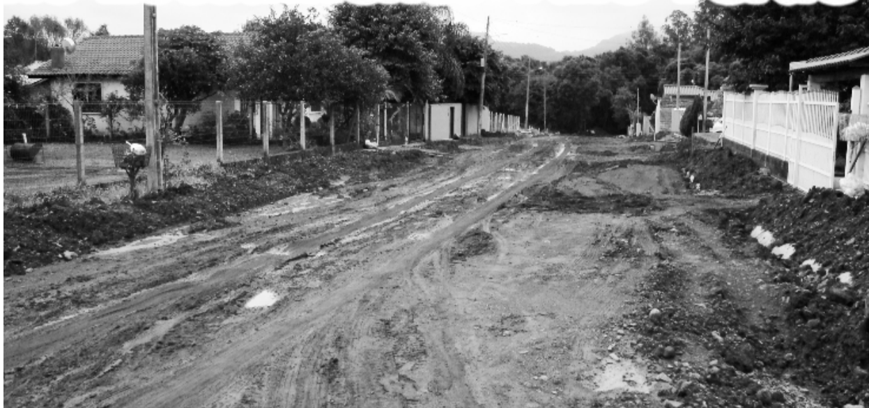
Pavimentação Rua Cristiano Ahlert

A Rua Cristiano Ahlert receberá pavimentação em 90,20 metros de extensão, por 9 metros de largura, totalizando 811,80 metros quadrados mais 39,30 metros quadrados de esquinas.