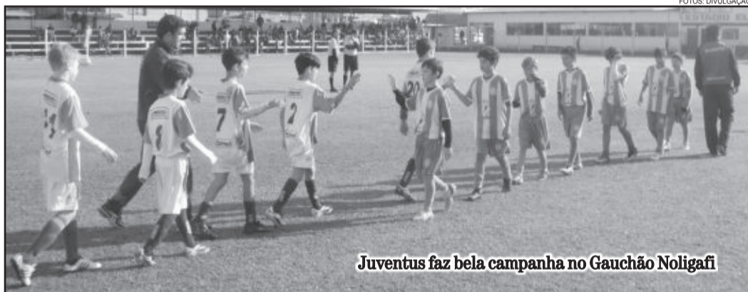
Juventus faz bela campanha no Gauchão Noligafi