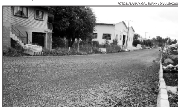
Pavimentação da Rua Carlos Frederico Guilherme Ahlert