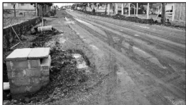
Pavimentação da Rua Friedholdo Heilmann