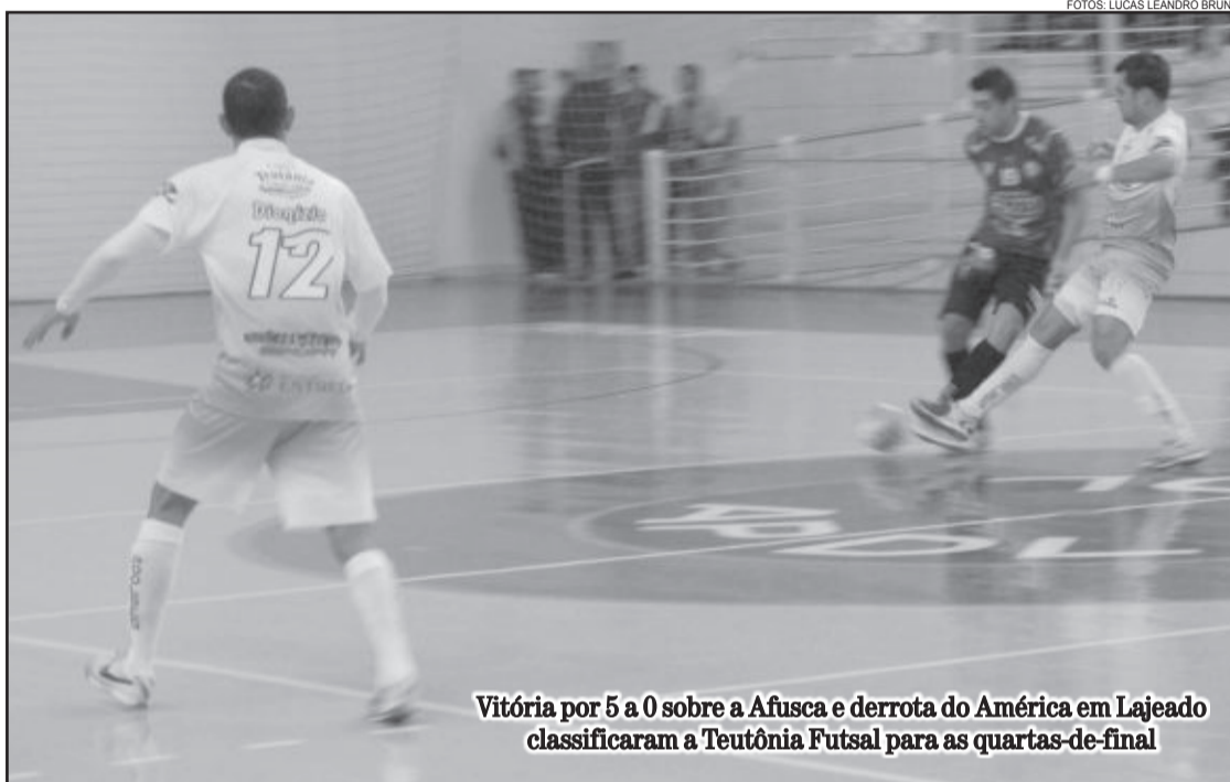
Vitória por 5 a 0 sobre a Afusca e derrota do América em Lajeado classificaram a Teutônia Futsal para as quartas-de-final