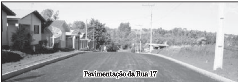
Pavimentação da Rua 17

As três vias integram o conjunto de obras do PAC2, que além da pavimentação asfáltica da pista de rolamento preveem a construção da calçada de passeio nos locais onde esta não existe. Na licitação, o valor final ficou em R$ 8,9 milhões (R$ 8.998.850,10), e a empresa Conpasul apresentou a melhor proposta.