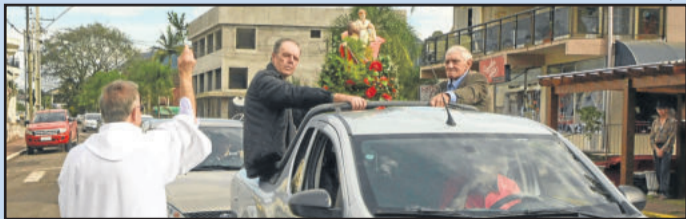
Programação contou com procissão motorizada e bênção dos veículos e motoristas