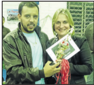
Ligeiros ficou em 3º lugar