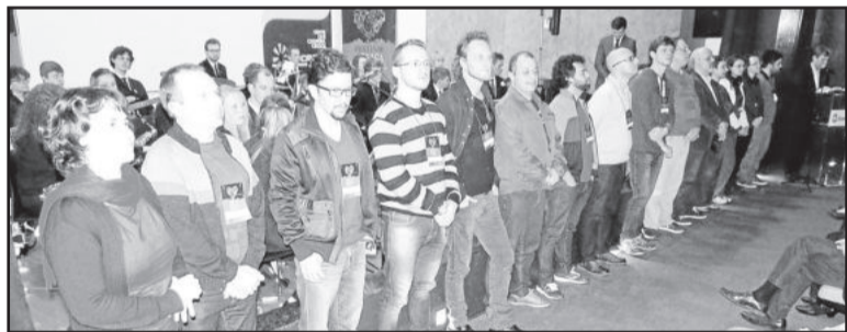
Profissionais renomados orientam 16 cursos de instrumentos musicais e três oficinas até quinta-feira no Colégio Teutônia

local o Auditório Central do CT, atividades essas abertas ao público e com entrada franca. Ontem à noite, show com as Meninas Cantoras de Nova Petrópolis, às 20 horas. Hoje, terça-feira (21), John Maland High School Jazz Band, do Canadá, também às 20 horas. Amanhã, quarta-feira (22), Recital de Professores e Estudantes. E na quinta-feira (23), Concerto da Orquestra do Festival. Todos os concertos são às 20 horas, no auditório do Colégio Teutônia.