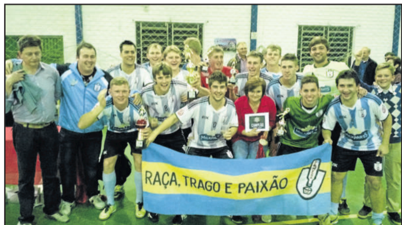
Saidera ficou campeão