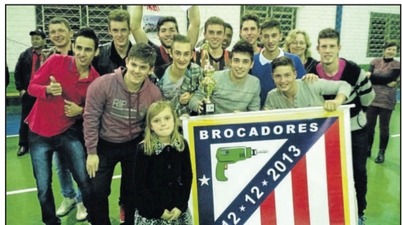
Brocadores ficou com o título