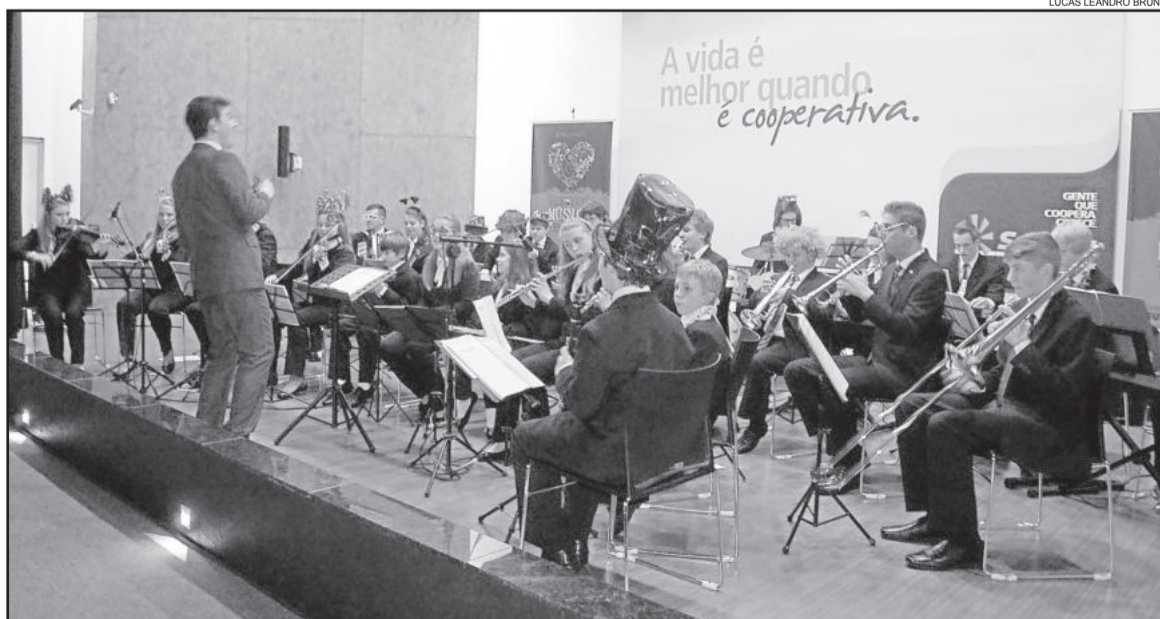
Ao ritmo do samba, Conjunto Instrumental também mexeu com a plateia