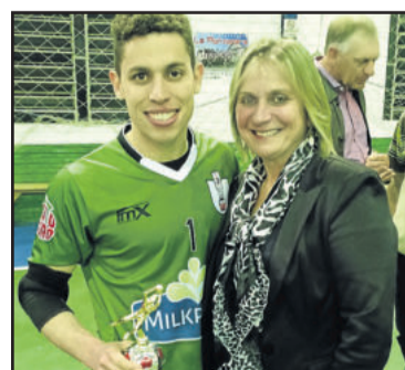
Baiano do Saidera foi o goleiro menos vazado