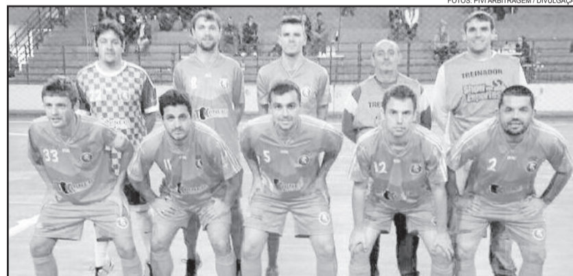
Real Madruga / DMF - Força Livre