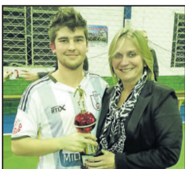
Saidera ficou com a melhor disciplina