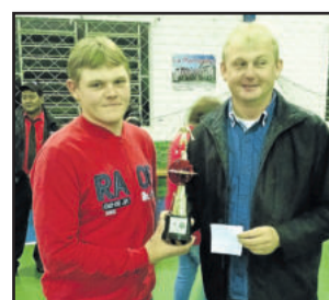
Morro do Alemão ficou com a melhor disciplina