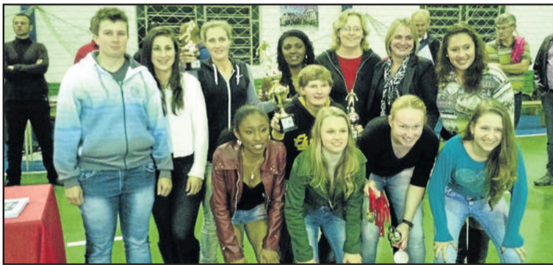
Flamengo ficou campeão