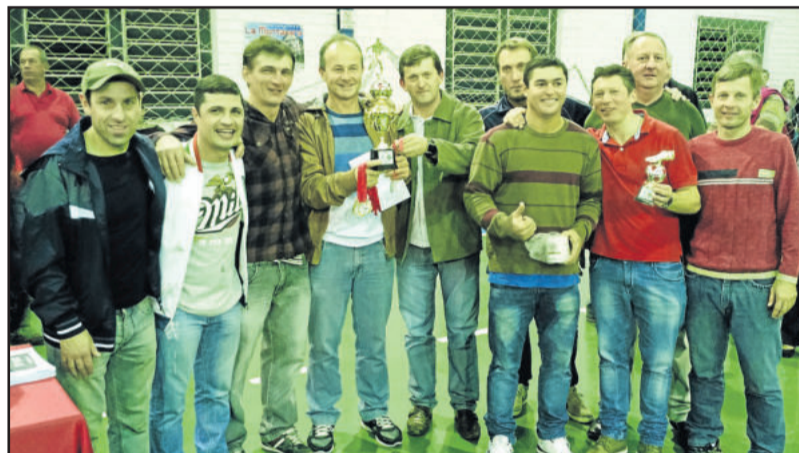
Juventude/Viévi Automóveis ficou campeão