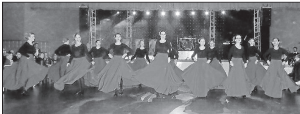
Apresentação das professoras