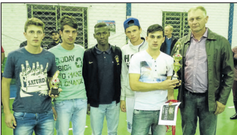
Sakolé ficou em 2º lugar