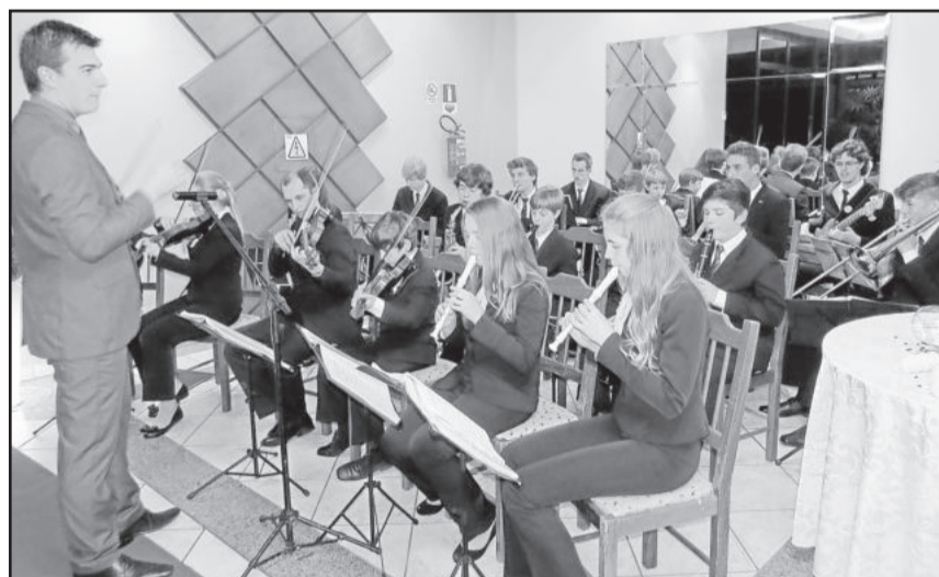
Conjunto Instrumental recepcionou participantes