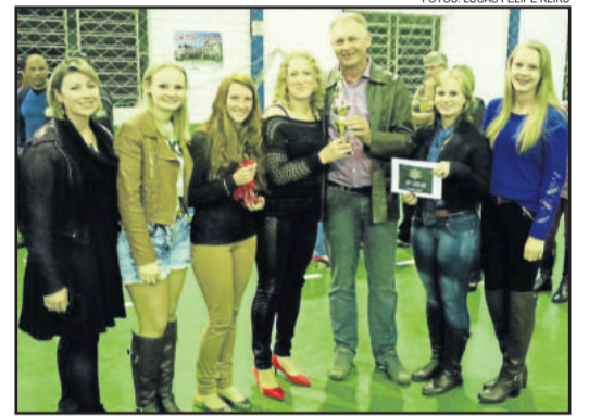
Morro das Aletmoas, 3º colocado