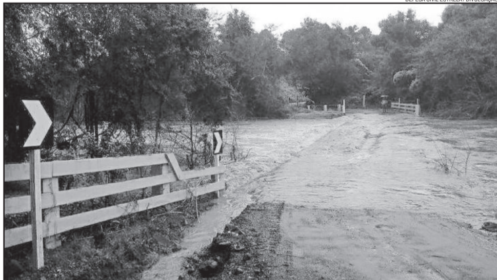
Em Estrela, Rua Nicolau Hoss, que liga Novo Paraíso a São José, foi interrompida