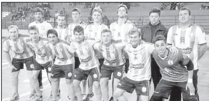
Saidera - Força Livre