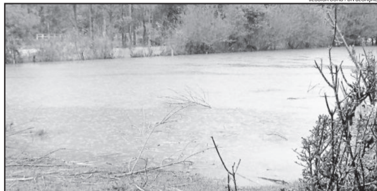
Em Paverama, arroio transbordou na Cidade Baixa