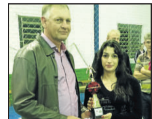
Garibaldi ficou com a melhor disciplina