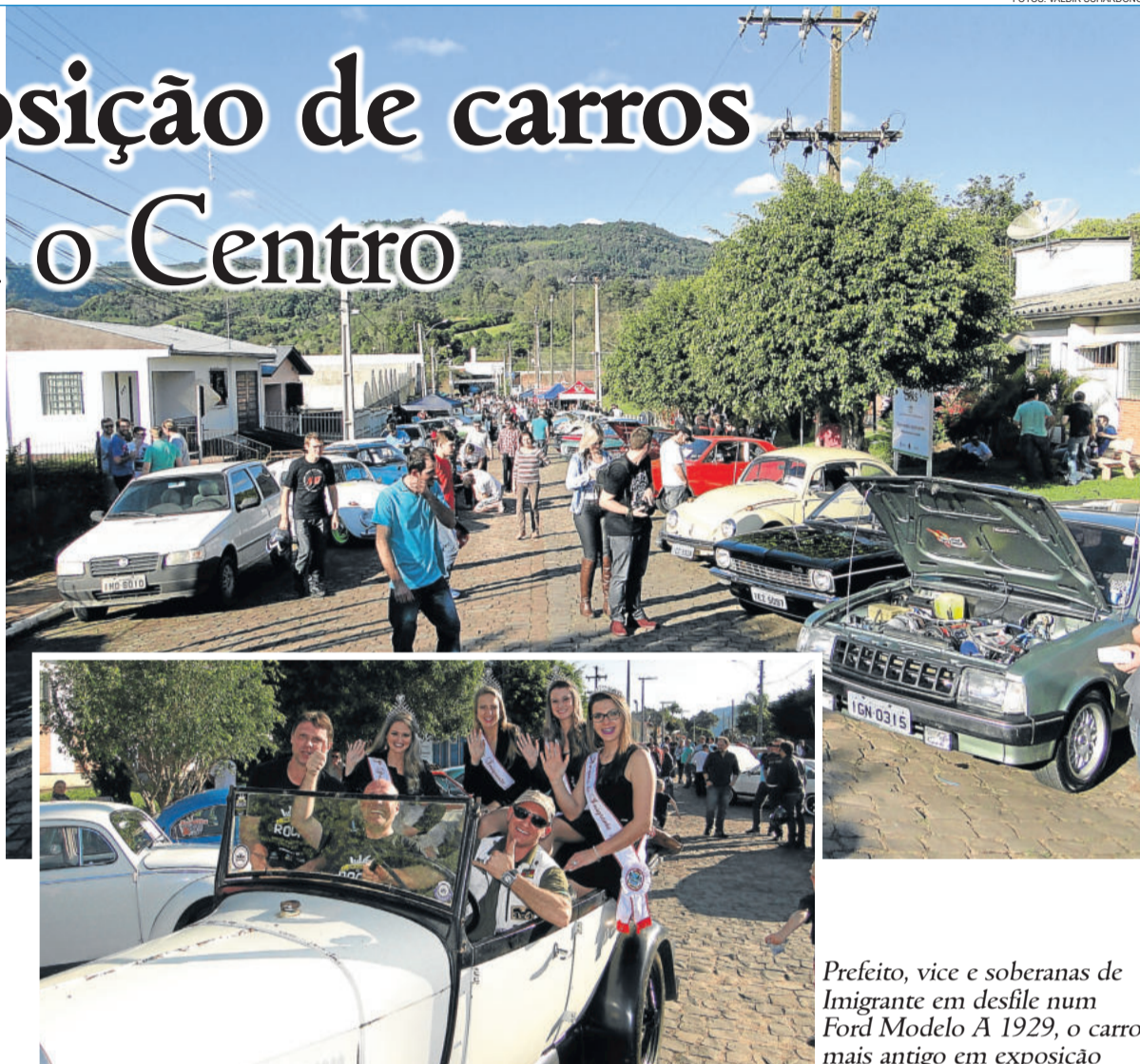
Prefeito, vice e soberanas de Imigrante em desfile num Ford Modelo A 1929, o carro mais antigo em exposição

Os garotos imigrantenses da banda Alpha Rock impressionaram ao público com sua apresentação. Com idades entre 10 e 12 anos, a turminha interpretou clássicos de Creedence, Pink Floyd e Bealtes, levando o gênero musical para sua geração.