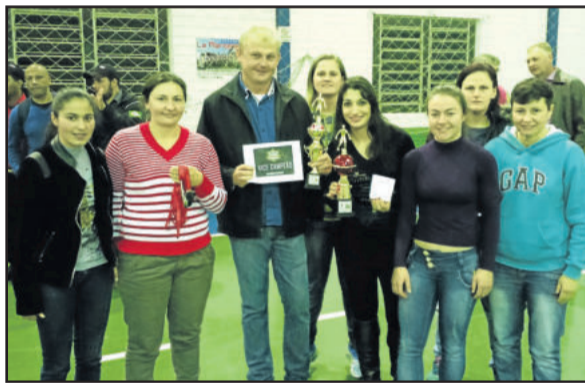
Garibaldi ficou com a 2ª colocação