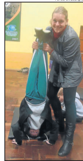
Invertida sobre a cabeça em dupla