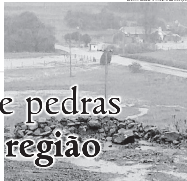
Em Linha São Jacó, Teutônia água do arroio chegou a passar por cima do asfalto

Durante a madrugada e início da manhã desta segunda-feira, uma pedra caiu sobre a pista, a 500 metros da Igreja Missouri, em Linha Harmonia. O trânsito seguiu em meia pista.