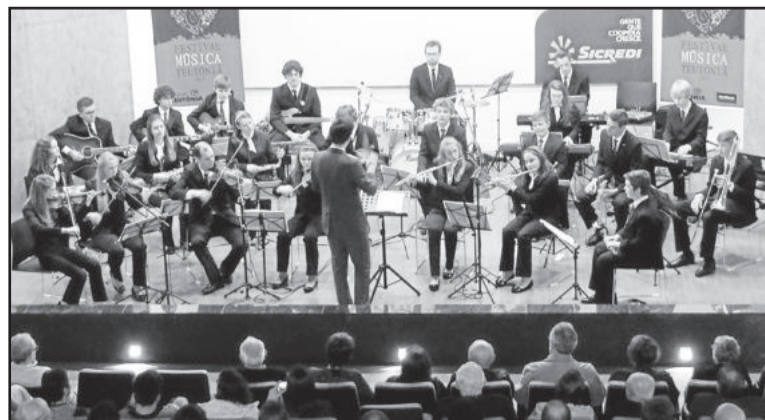
Conjunto Instrumental do Colégio Teutônia apresentou repertório da Turnê Europa 2015