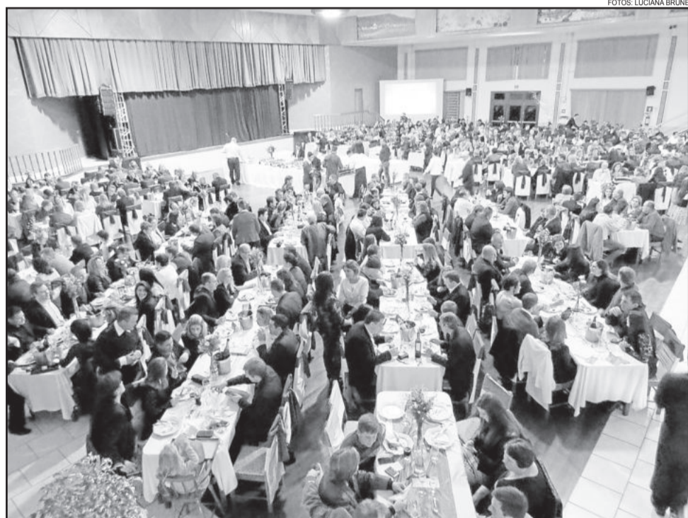
Disposição diferenciada das mesas proporcionou boa visibilidade do público na hora das apresentações