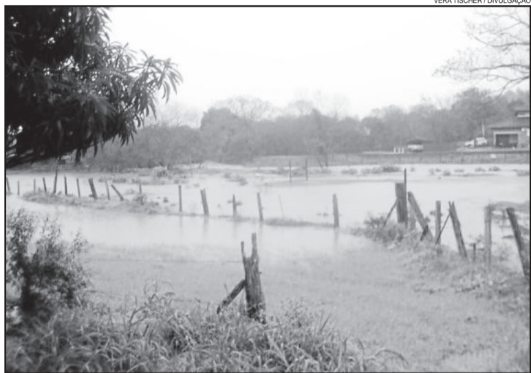
Na Cuba, em Teutônia, também houve alagamentos

alagamentos foram observados na Cidade Baixa, proximidades da via que liga o bairro ao Centro. Em Brochier, o arroio transbordou e alagou parte das ruas centrais.