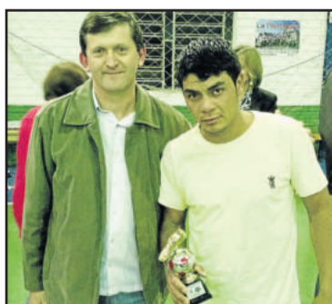
Dari do Kaxa Baxa foi o goleador