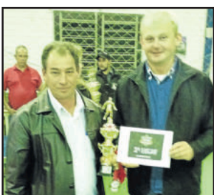
Amigos do Queiroz ficou com a 3ª colocação