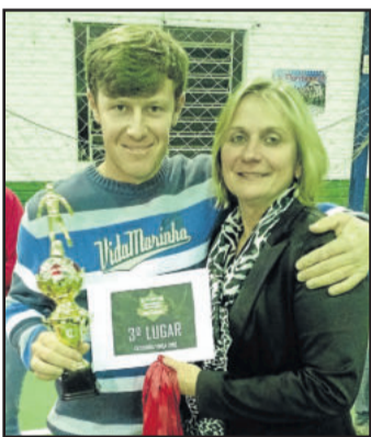
Morro do Alemão/Juventude ficou em 3º lugar