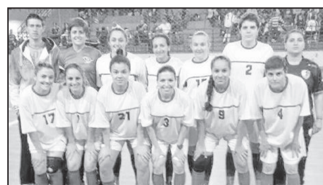
Divas de Bom Retiro