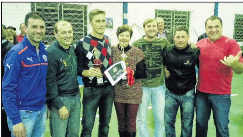
Representações Francesquet e Neca ficou em 2º lugar