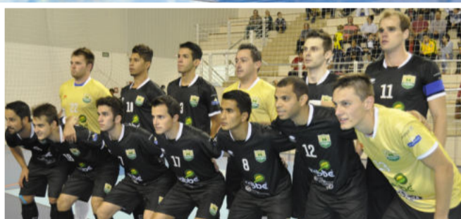
Teutônia Futsal tenta melhorar posição

No quadro geral, o primeiro turno tinha quatro equipes com duas vitórias (100%): ACBF, ASSOEVA, BGF e ASIF. Neste segundo turno, até agora nenhuma delas repetiu a performance; apenas ALAF e o surpreendente Cachoeira Futsal aparecem com 6 pontos.