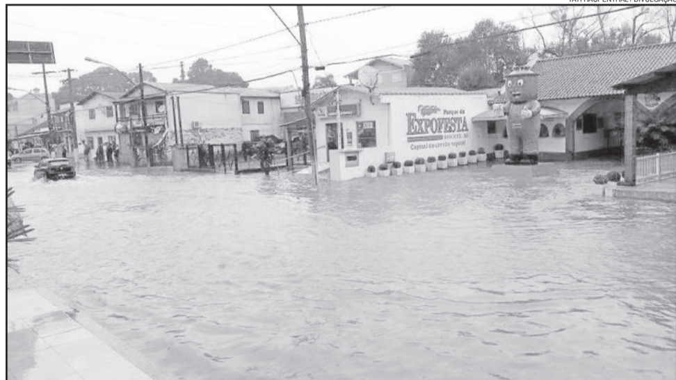
Em Brochier, vias centrais foram alagadas