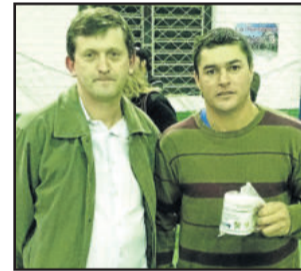
Sandro da Costa do Juventude/Viévi Automóveis foi o destaque da final