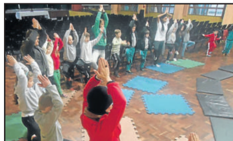
Ásanas em roda

Oferecemos aulas para crianças nas terças-feiras às 18 horas no Centro de Yoga em Canabarro. Para maiores informações, é só acessar as nossas páginas na web.