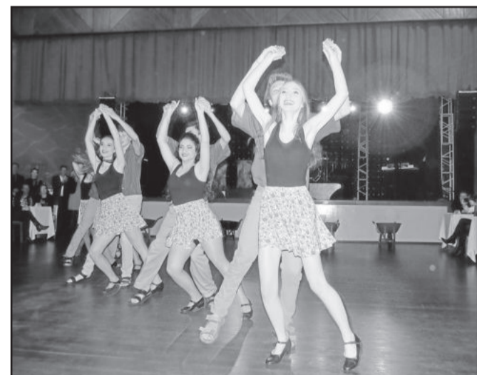
9º ano iniciou o ciclo das apresentações