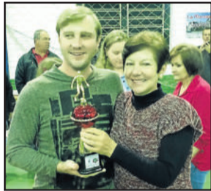
Representações Francesquet e Neca ficou com a melhor disciplina