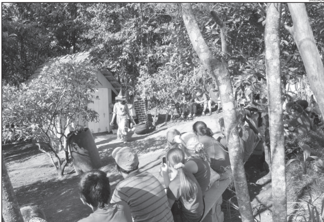
No Caminho das Lendas

Neste ano, o Blumentanzfest teve um novo ingrediente, com O caminho das Lendas, que virou um novo atrativo turístico. Desde o dia 8 até 29 de setembro, acontece a conhecer a magia das mais belas lendas que as avós contavam na infância. Crianças, famílias e escolas estão visitando as 6 estações temáticas: Chapeuzinho Vermelho, Branca de Neve, A Bela Adormecida, Os Músicos de Bremen, João e Maria e Menina-Flor.