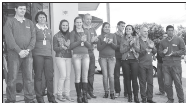
Equipe de colaboradores da Agrocenter do Bairro Canabarro

Ele ainda agradeceu à cooperativa pelos recentes investimentos no município e parabenizou a Languiru pela unidade Agrocenter inaugurada. "Este novo estabelecimento é muito significativo para o Bairro Canabarro, o maior bairro do Vale do Taquari e o segundo maior do Rio Grande do Sul em número de habitantes. Nesse contexto a Languiru possui grande importância e oferece algo novo para a comunidade teutoniense e de municípios vizinhos", concluiu, elogiando a força do cooperativismo, a quem creditou como o segredo do sucesso econômico e social de Teutônia.