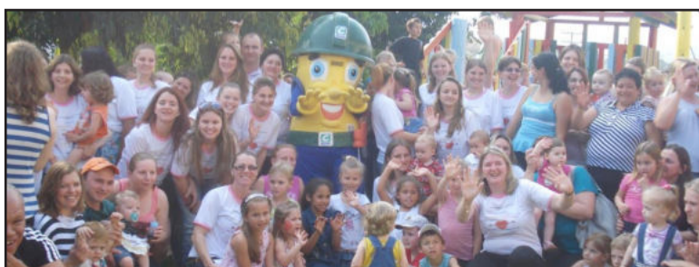
Festa da Família foi sucesso