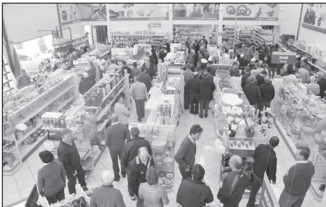
Comunidade pôde conferir as instalações da Agrocenter