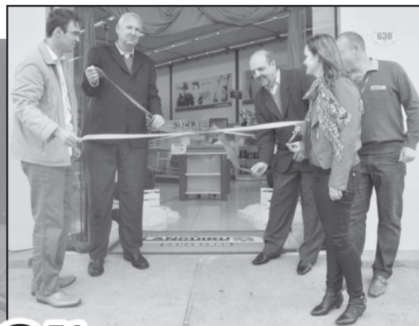
Inauguração da Agrocenter ocorreu na manhã de terça-feira, reunindo autoridades, associados e clientes