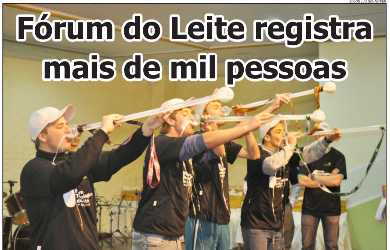
7º Fórum Tecnológico do Leite aconteceu na quarta-feira, dia 18, no Colégio Teutônia. Concurso de Leite em Metro (foto) foi um dos pontos altos da programação. Página 17

Reportagem Especial Hidroginástica, sinônimo de saúde Página 3