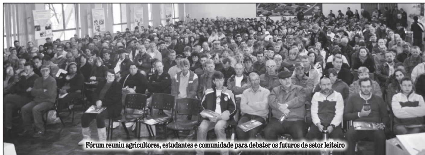
Fórum reuniu agricultores, estudantes e comunidade para debater os futuros de setor leiteiro