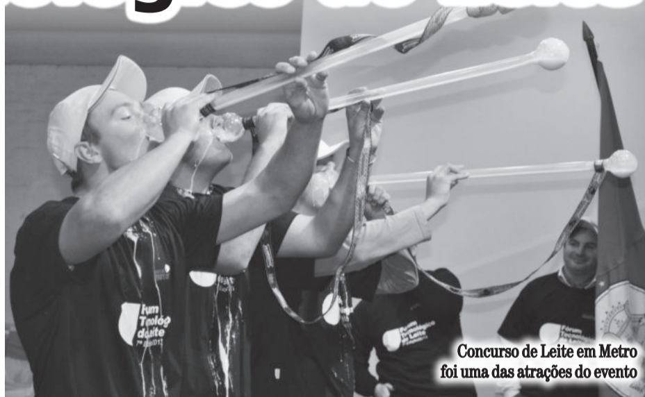
Concurso de Leite em Metro foi uma das atrações do evento