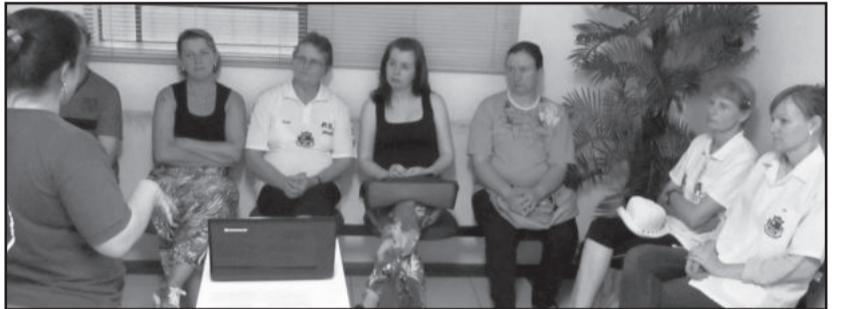
Tema da fisioterapia foi implantado semana passada