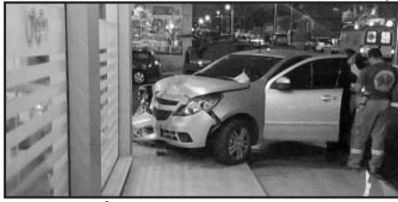
Ágile bateu na porta de acesso à Pastelaria Twister

Com o impacto, o Ágile subiu a calçada e bateu na porta de acesso à Pastelaria Twister, no Bairro Languiru. Com o impacto, uma das portas de vidro estilhaçou. O condutor do Gol foi encaminhado ao Hospital Ouro Branco com lesões leves. A condutora do Ágile nada sofreu.