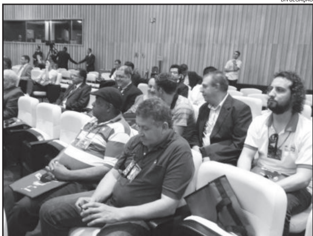
Sindicato comemorou a boa notícia de que o Projeto foi retirado da pauta por tempo indeterminado ao participar da abertura do II Seminário Nacional de Prevenção de Acidentes de Trabalho

Todson divulgou na última quarta-feira, dia 18, imagem da participação no seminário. Na oportunidade lembrou também da retirada da Projeto de Lei 4330, sobre terceirização, da pauta da Câmara dos Deputados.