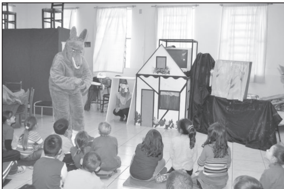
Contação de histórias foi uma das atividades