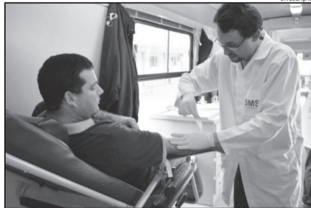
Comunidade ajudou na campanha de doação de sangue