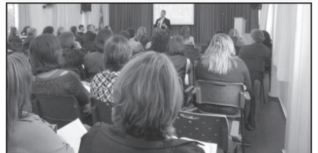
Cidades ligadas à Comarca estiveram reunidas no Instituto Estadual de Educação de Estrela