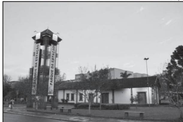
Barbosenses terão shows artísticos e celebração religiosa no dia de seu aniversário de emancipação