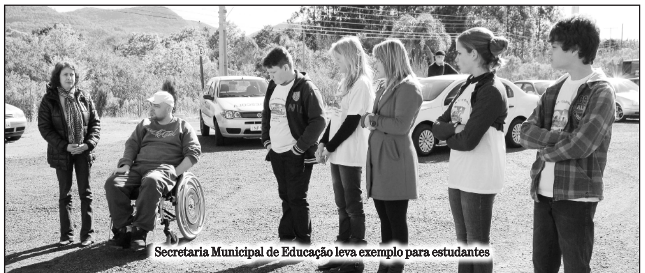
Secretaria Municipal de Educação leva exemplo para estudantes