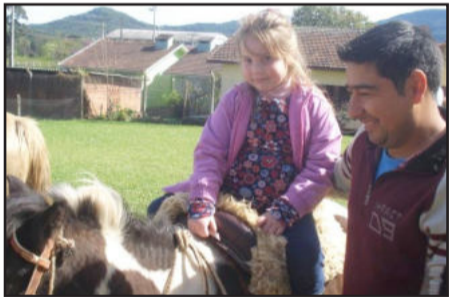
Festejos da Semana Farroupilha aconteceram na quarta-feira, dia 18

sábado, dia 14, reuniu um grande número de pessoas, entre elas alunos e pais, familiares e amigos. As atividades foram as mais diversas: apresentação de trabalhos; sorteio de rifa; mostra de brinquedos adquiridos com recursos da rifa; brincadeiras, brinquedos infláveis e chamarreada. O evento também contou com a presença do “Xoquinho”, que trouxe brindes e alegria para a criança.