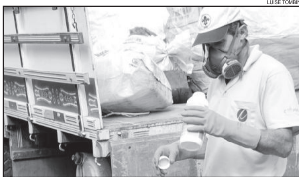
Agrotóxicos é um dos principais poluentes do modelo de agricultura atual