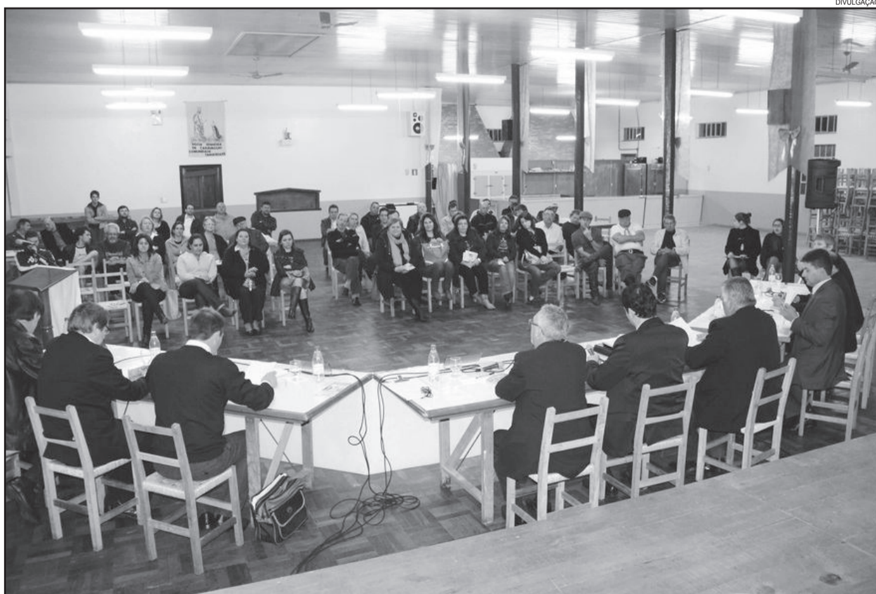
Sessão plenária da Câmara de Vereadores aconteceu na comunidade de Tamandaré com intuito de aproximar a comunidade e seus moradores, para que estes saibam como são as atividades parlamentares