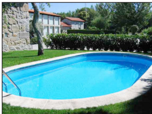
Há quem não troca a comodidade da piscina neste verão