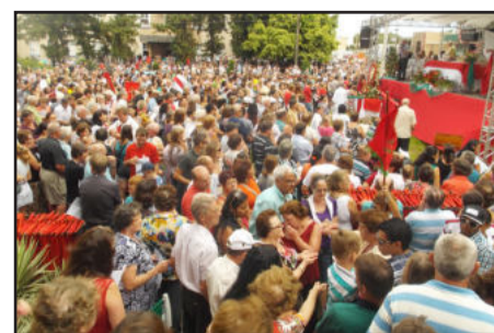
Cerca de 15 mil pessoas participaram da missa e procissão