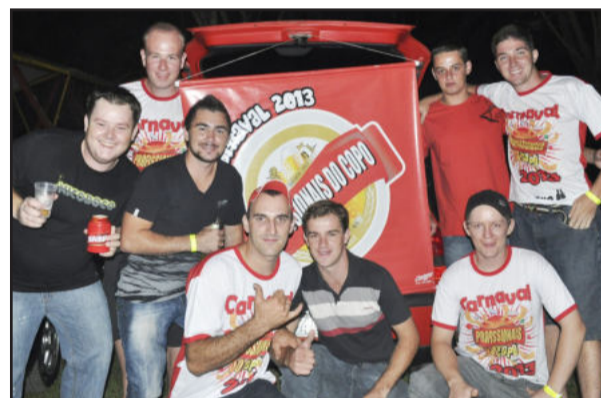
A galera do bloco Profissionais do Copo também prestigiou os jogos já em clima de Carnaval