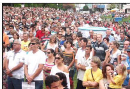
Festa de São Sebastião Mártir é a quarta maior do Estado