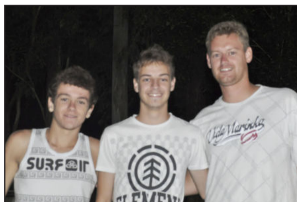
Gurizada de Canabarro marcou presença em mais uma rodada do Abertão