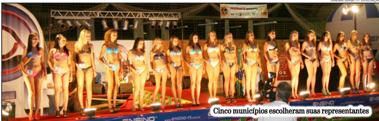
Cinco municípios escolheram suas representantes