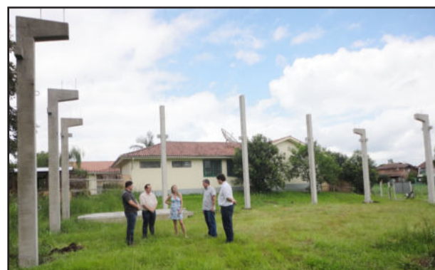
Pilares já estão erguidos