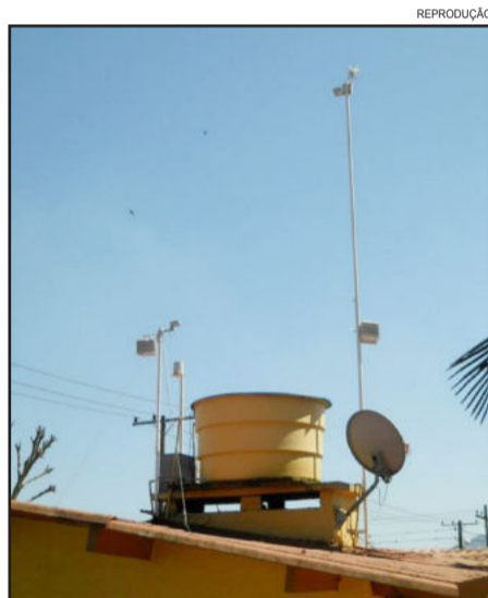
Estação localizada no telhado da residência de Wessel