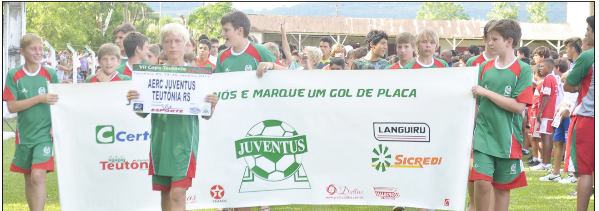
AERC Juventus está disputando a competição em seis categorias

No sábado, dia 19, foi realizada a abertura da VII Copa Teutônia Via Esporte, no campo da SER Gaúcho, no Bairro Teutônia, com a apresentação das equipes e jogo de abertura. A competição é considerada uma das maiores da América do Sul, e a maior realizada em território brasileiro.