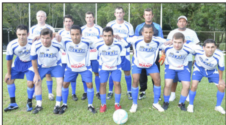
A equipe do Amigos do Neni-Fretes André saiu atrás no placar, mas se recuperou na partida e conseguiu um empate