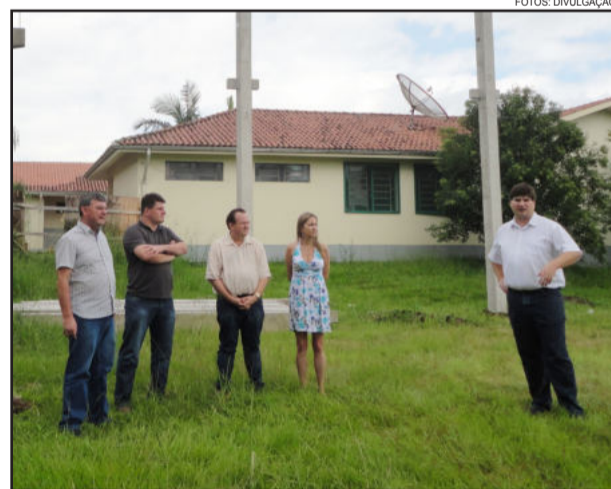
Representantes da administração municipal fiscalizam a obra junto à diretora da escola