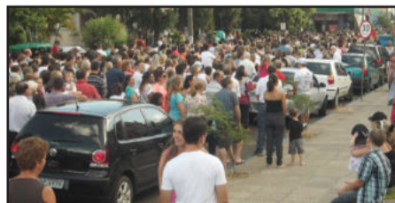
Procissão foi após a missa campal

fiéis também puderam levar água benta para casa, que estava à disposição dos fiéis em grandes barris em pontos estratégicos da igreja. Após as pessoas se dirigiram ao salão paroquial onde puderam se divertir com as várias atrações da festa, como baile, compra de artesanato e parque de diversões. E, é claro, quem vai à Festa do Bastião não pode deixar de experimentar a tradicional galinhada e o pastel do Bastião. Às 22h30min aconteceu o sorteio dos prêmios da Ação Entre Amigos. Foram sorteados 40 prêmios, sendo os cinco primeiros em dinheiro, totalizando R$ 28 mil.