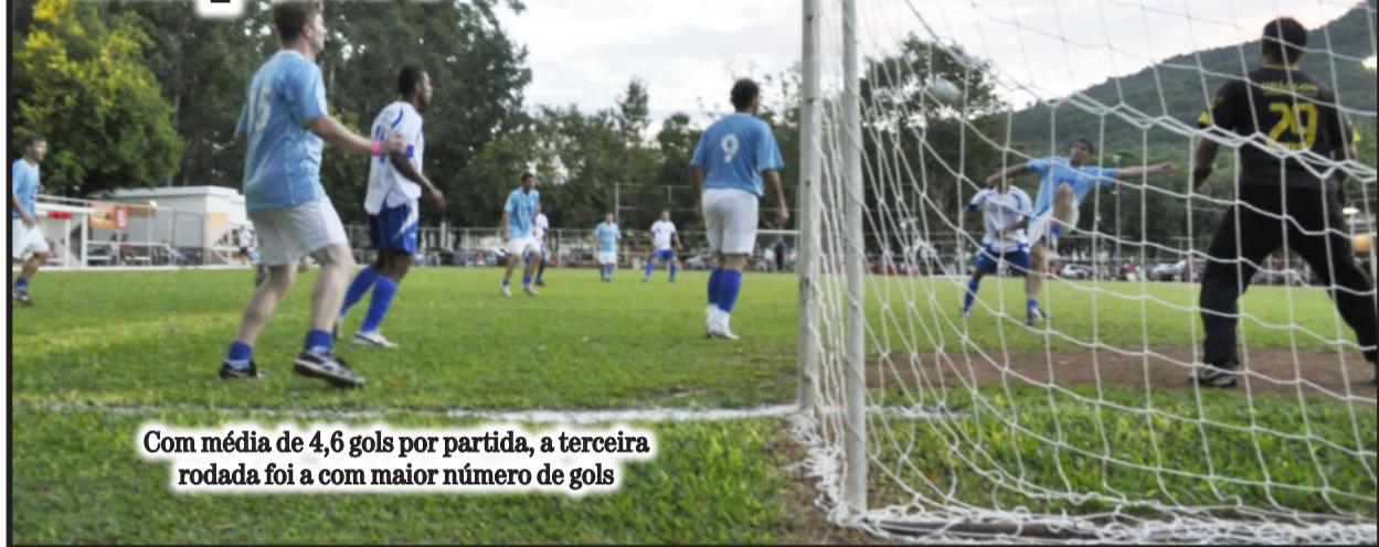
Com média de 4,6 gols por partida, a terceira rodada foi a com maior número de gols

Na sexta-feira, dia 19, a Associação dos Funcionários da Languiru sediou a terceira rodada do 33º Campeonato Aberto de Verão da Languiru.