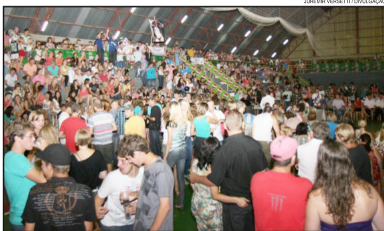
Comunidade e torcidas organizadas prestigiaram o concurso