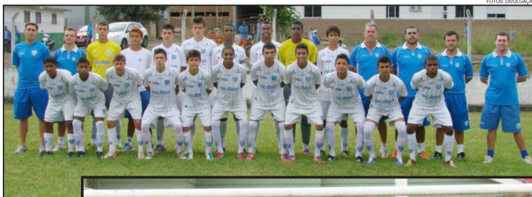
EC Avai, de Florianópolis, foi campeão na categoria 97, vencendo na final por 2 a zero