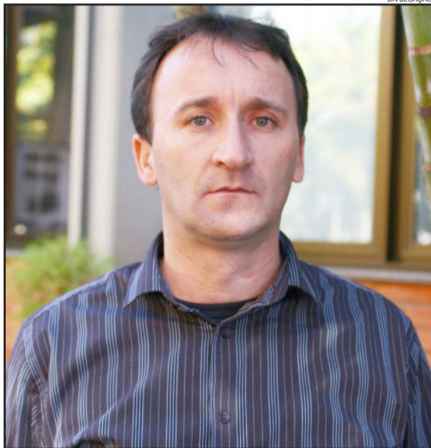
Bruxel ressalta que algumas câmaras de vereadores deveriam rever o período de recesso para não criar um mal-estar com a população