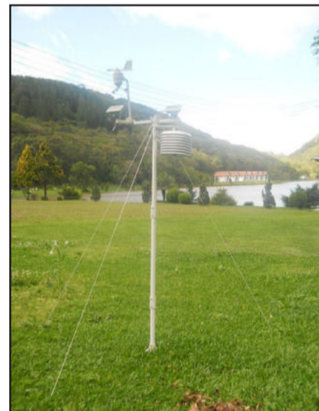
A estação, localizada na Lagoa da Harmonia, em breve também remeterá dados para o site