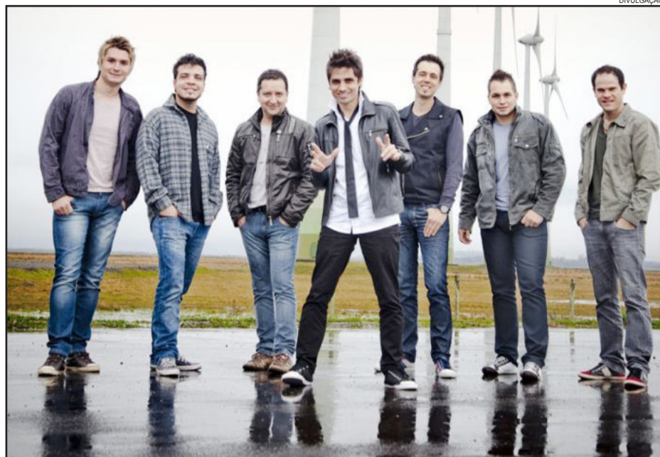
Banda Porto do Som anima o baile de hoje à noite

Hoje acontece a segunda noite do KerbFest, a do encerramento, com baile animado pela Orquestra Os Montanari, Banda Porto do Som, comunicadores da Popular FM, Digital Dance e DJs convidados. O evento promete. Para hoje mais uma vez são esperadas milhares de simpatizantes do “Maior e Melhor Kerb do Estado”.