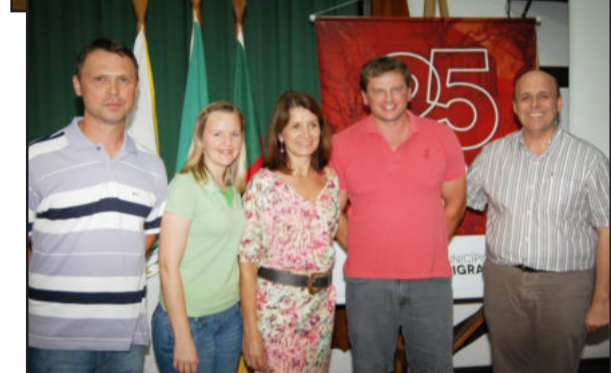
Prefeito (d) com participantes da reunião