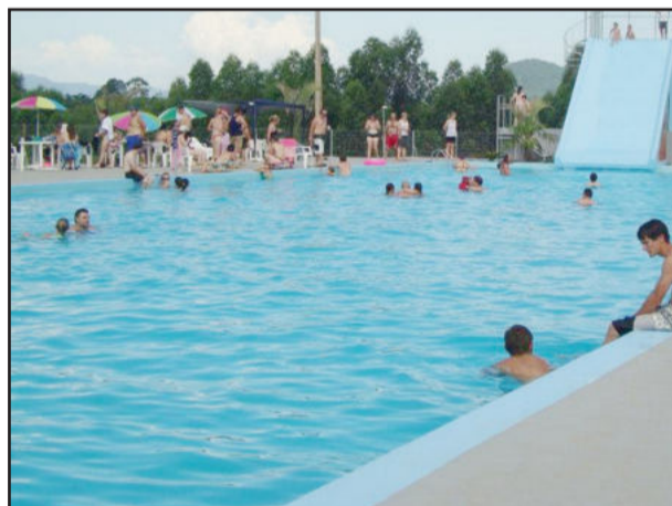
Os balneários vêm ganhando a preferência de muitas pessoas por serem um destino mais prático e econômico