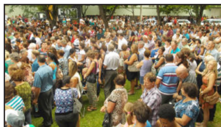
Multidão se espalhou por todo o terreno da igreja