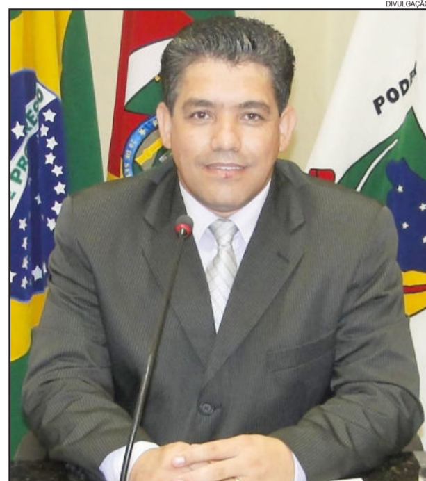
Conforme Alves, o período de recesso no primeiro ano de mandato dos vereadores deverá ser discutido ainda este ano

Conforme o cientista político e professor da Univates, Laerson Bruxel, “a atividade do vereador não é restrita à sua participação somente às sessões do Poder Legislativo. A função legislativa é apenas uma delas. Mesmo que não tenha reunião num determinado período, em tese, o vereador tem muito a fazer. Outra função do vereador é fiscalizar”. “O vereador precisa, de forma ininterrupta,