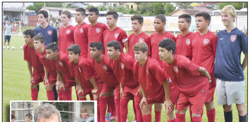
Equipe do Desportivo Brasil, de São Paulo, estreou com vitória

Mais informações sobre jogos e fotos podem ser acessados no Facebook da Planeta Bola Eventos Esportivos, ou pelo site, www.planetabolaeventos.com.br .