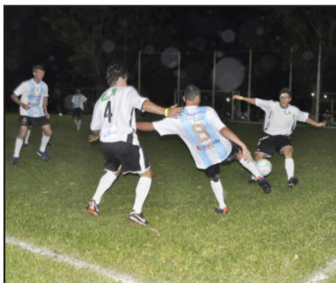
Schneider construções estreiou na competição com um jogo muito disputado