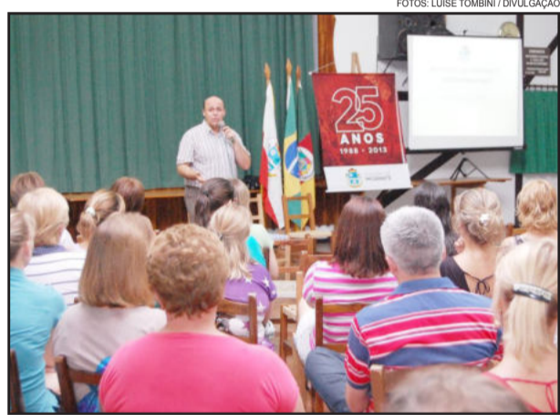
Prefeito Celso Kaplan falou para os associados