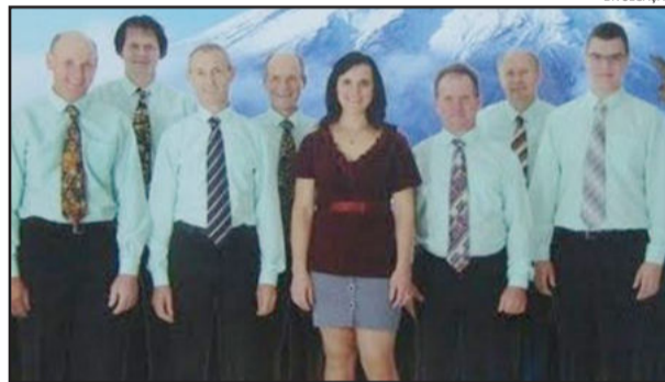
Musical Monte Azul anima o Kerb deste ano

Neste sábado, dia 26, a Comunidade Evangélica Redentor, do Bairro Canabarro, Teutônia, comemora mais um ano de construção do seu templo com o tradicional baile de kerb. A programação inicia às 21h com culto; às 22h30min, já no pavilhão, acontece a apresentação do grupo de danças alemãs da Associação Artístico Cultural Teutônia; e às 23h sobe ao palco o Musical Monte Azul, de Nova Petrópolis, para agitar o público.