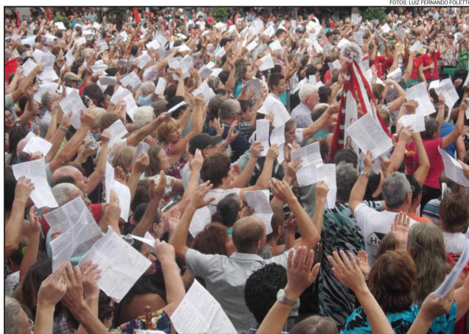
Fiéis rezaram e cantaram louvando São Sebastião Mártir