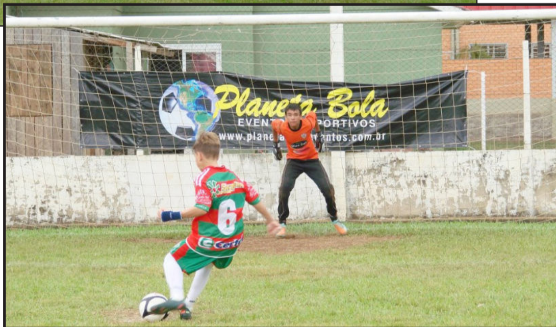
Juventus, de Teutônia, foi para disputa de pênaltis, na final, em duas categorias, e ficou com o vice