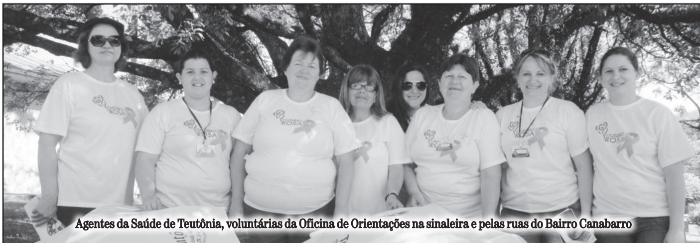
Agentes da Saúde de Teutônia, voluntárias da Oficina de Orientações na sinaleira e pelas ruas do Bairro Canabarro