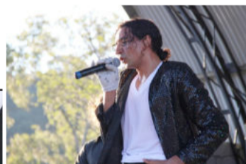
Champ Rock day

A mistura dos melhores espumantes do país e a diversidade musical do