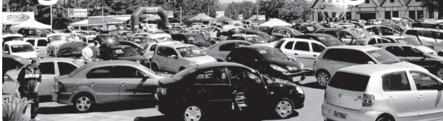
Feirão reuniu dez revendas de Teutônia no Centro Administrativo Municipal

No último final de semana, dias 19 e 20 de outubro, a CIC Teutônia, com apoio da Prefeitura de Teutônia e revendas do município, realizou o 8º Feirão de Veículos Seminovos de Teutônia. Em apenas dois dias, números extraordinários fornecidos pelas próprias revendas dão conta de que foram comercializados cerca de 50 veículos, além de outros negócios encaminhados para fechamento a partir desta semana. Realizado no Centro Administrativo Municipal, os dias ensolarados contribuíram para os negócios e as revendas comemoram as vendas.