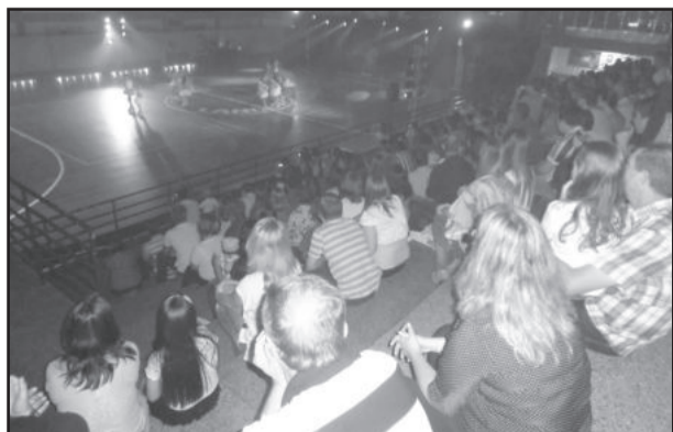
O público ficou atento a cada movimento