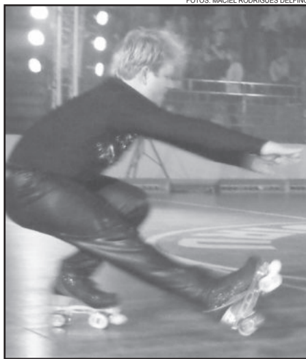
Um show de equilíbrio, movimento e arte

Neste sábado, dia 19, foi realizado o segundo evento da programação do Teutoarte 2013: o 2º Festival de Patinação. A Associação dos Funcionários da Languiru (Mimi) foi palco de belas apresentações artísticas sobre patins.