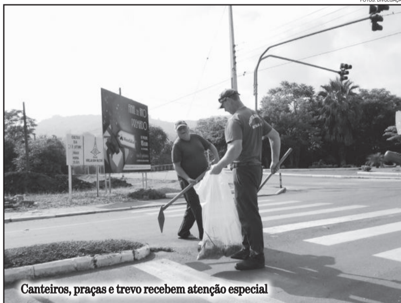
Canteiros, praças e trevo recebem atenção especial