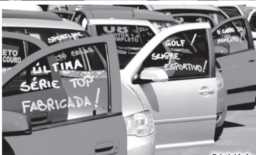
Criatividade para chamar a atenção dos clientes

Iniciado em 2009, o Feirão surgiu da necessidade verificada pelas próprias revendas teutonienses, que buscaram o auxílio da CIC para sua viabilização e concretização, possibilitando o incremento nas vendas de veículos e reforçando a integração entre empresários. A cada nova edição tem ocorrido o aumento na quantidade de veículos e valores negociados. Conforme dados das revendas, as oito edições do Feirão de Seminovos somadas possibilitaram a comercialização de aproximadamente 500 veículos e cerca de R$ 6,5 milhões em negócios.