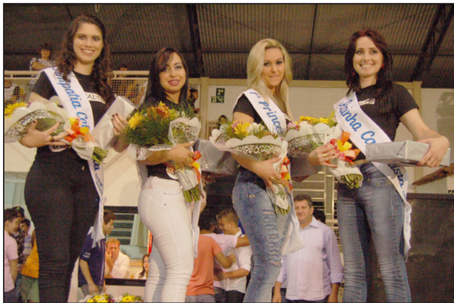
Corte Mulher Calçadista 2013

Escolha das soberanas do Sitalte aconteceu na noite de sábado