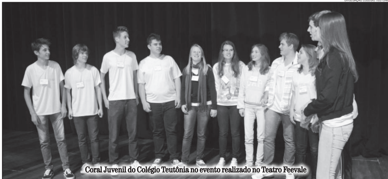
Coral Juvenil do Colégio Teutônia no evento realizado no Teatro Feevale