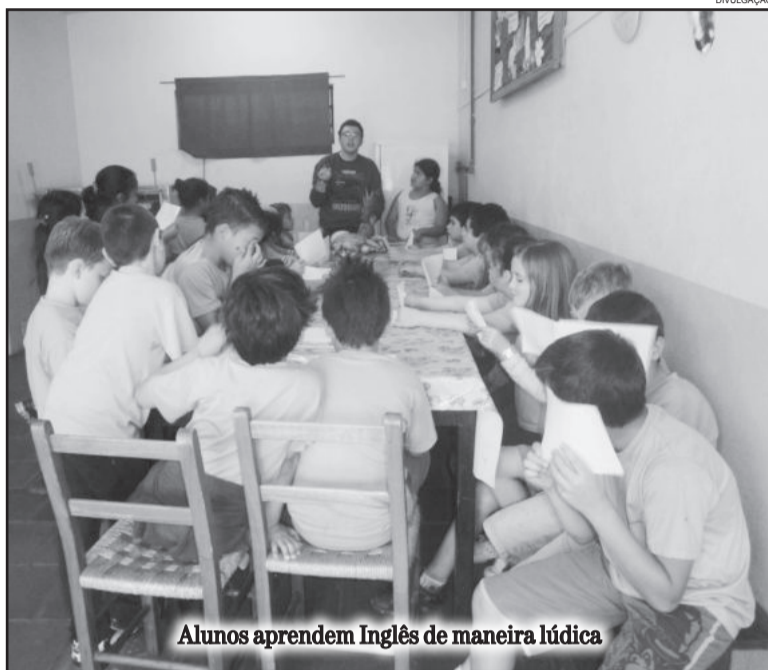
Alunos aprendem Inglês de maneira lúdica

Os alunos realizam as aulas unindo teoria e prática, pois a assimilação do vocabulário e a memorização ficam mais fáceis quando se tem o estímulo visual.