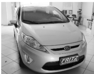
New Fiesta 1.6 R$ 45.900

Aberto de segunda a sexta das 8h às 18h30min. Sem fechar ao meio dia e nos sábados das 8h às 16h.