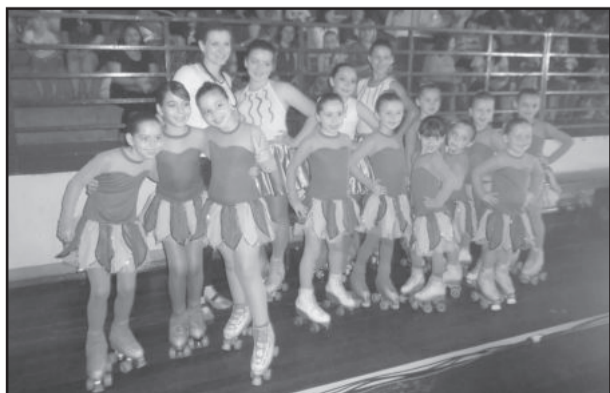
Equipe de patinação da Ieceg - Teutônia