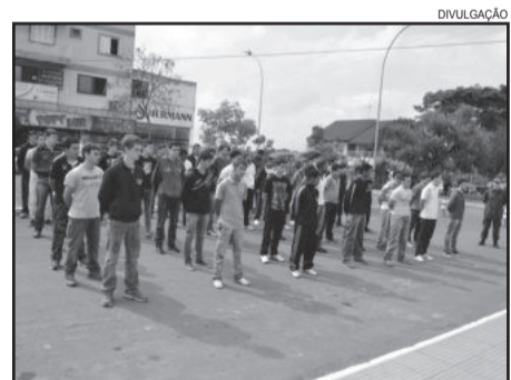
Quarenta e nove jovens prestaram o Juramento à Bandeira