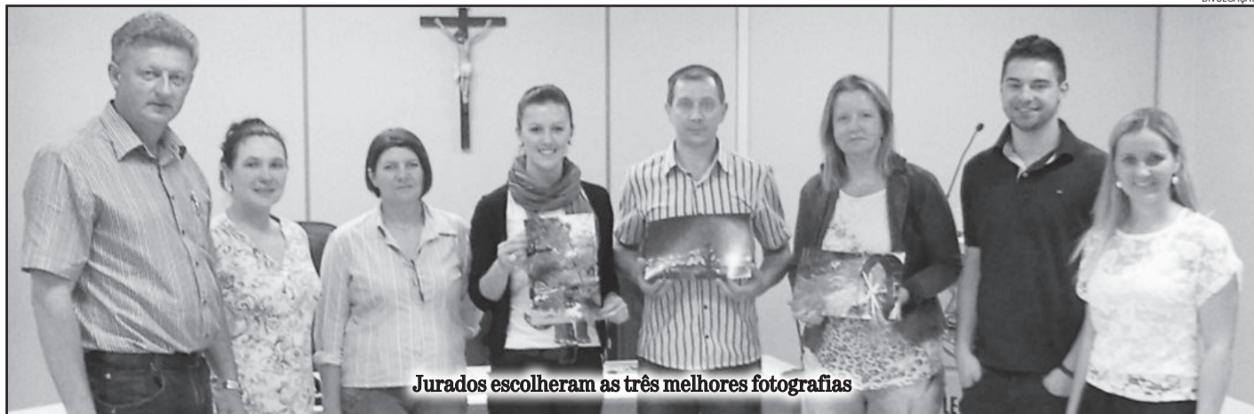
Jurados escolheram as três melhores fotografias