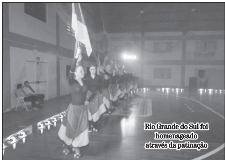
Rio Grande do Sul homenageado através da patinação