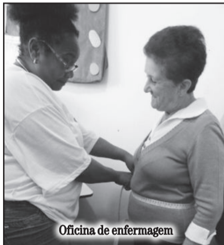
Oficina de enfermagem