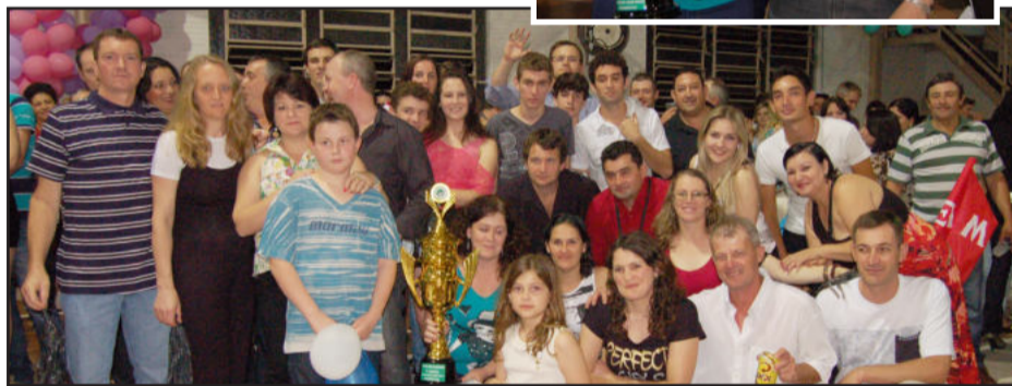
Piccadilly Boa Vista foi a melhor torcida