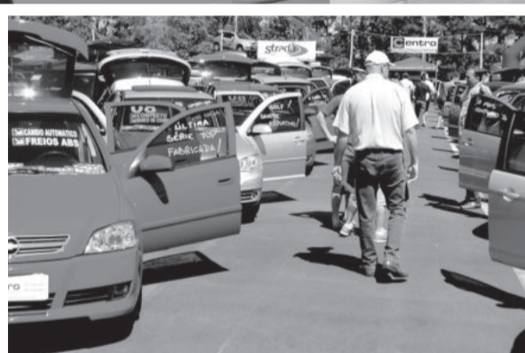
Variedade em marcas, modelos e ofertas num só lugar