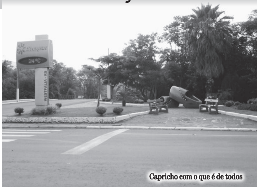
Capricho com o que é de todos

No interior, além da atenção dispensada pelas secretarias de Agricultura e Obras para melhorar a qualidade dos acessos às propriedades, houve dedicação por parte da Administração Municipal com a colocação de uma leve camada de brita sobre o saibro melhorando muito a condição de trafegabilidade.