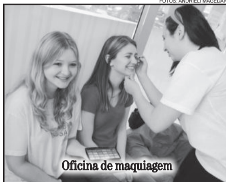
Oficina de maquiagem