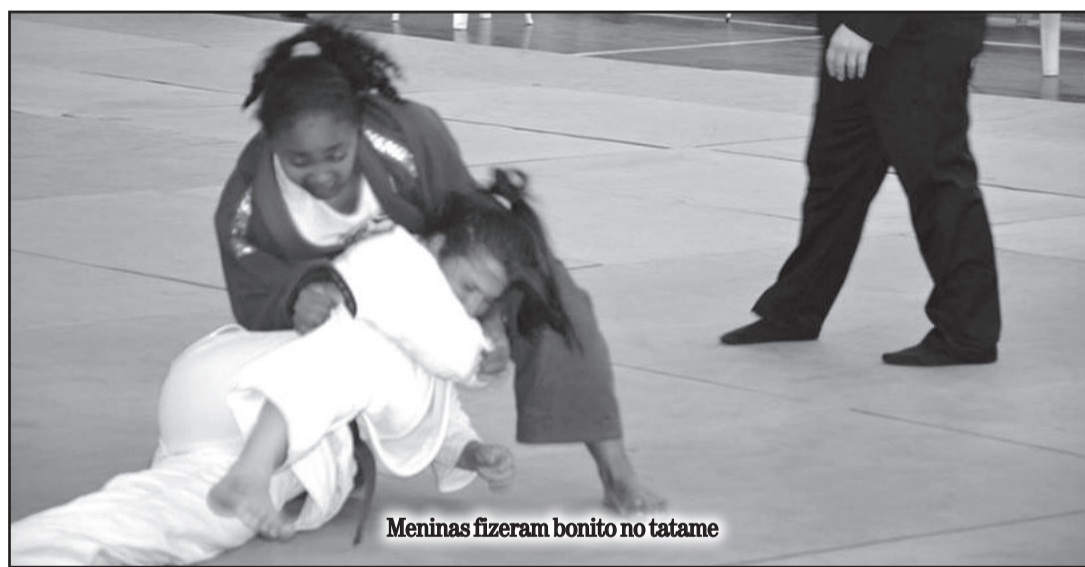
Meninas fizeram bonito no tatame