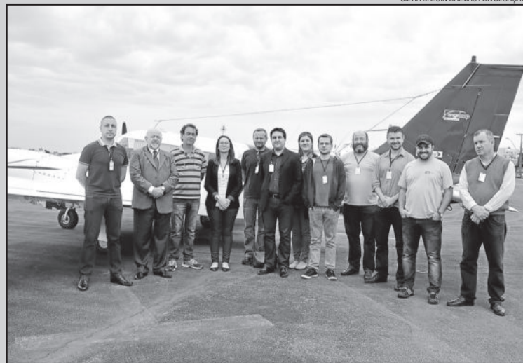
Recentemente, equipe barbosense conheceu mais sobre a tecnologia do trabalho no aeroporto de Caxias do Sul

O último levantamento feito no Município foi em 1992, com uma tecnologia muito inferior em relação à usada hoje em dia. Nos Estados Unidos, 99% dos municípios possuem mapeamento com esta mesma tecnologia. No Brasil, apenas 1% dos municípios.