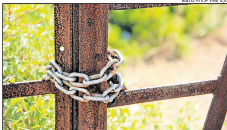
O medo e a insegurança assombram as comunidades

para efetuar o roubo. No local tinha em torno de 15 pessoas e os ladrões levaram praticamente todas as chaves dos veículos que estavam em frente à Sociedade, em torno de R$ 2 mil em dinheiro, celulares, carteiras, um Toyota Corolla e uma moto. Nenhuma pessoa ficou ferida e o carro foi recuperado.