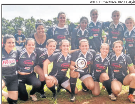
Equipe feminina do Centauros com a taça de vice-campeão

O time feminino do Centauros Rugby conquistou o título de vice-campeão gaúcho neste sábado, dia 19. O título do Circuito Gaúcho de Rugby Sevens foi decidido na 5ª etapa do campeonato que ocorreu no Parcão, em Estrela. O Centauros disputou o título com o Charrua, de Porto Alegre, mas não conseguiu quebrar a hegemonia do clube porto-alegrense, que garantiu o tricampeonato.