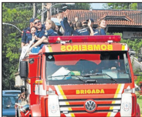
Em Estrela, comemoração com carreta no caminhão do Corpo de Bombeiros

“Foi uma competição muito difícil, pois se tratavam dos campeões de cada Estado e havia várias atletas de Seleção Brasileira em cada equipe. Só do Rio de Janeiro eram quatro”, salienta o técnico Rodrigo Rother. Outra dificuldade encarada pelas gaúchas é a bola, diferente da utilizada no Rio Grande do Sul, “o que atrapalha na adaptação. Fomos crescendo na competição e acabamos conseguindo jogar nosso melhor vôlei nos momentos mais importantes”, destaca.