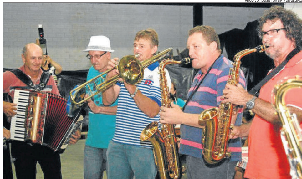
Músicos de várias cidades participam