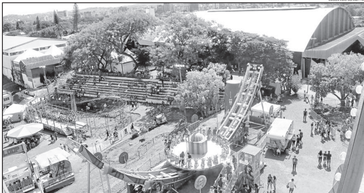
Parque de Diversões foi uma das diversas atrações