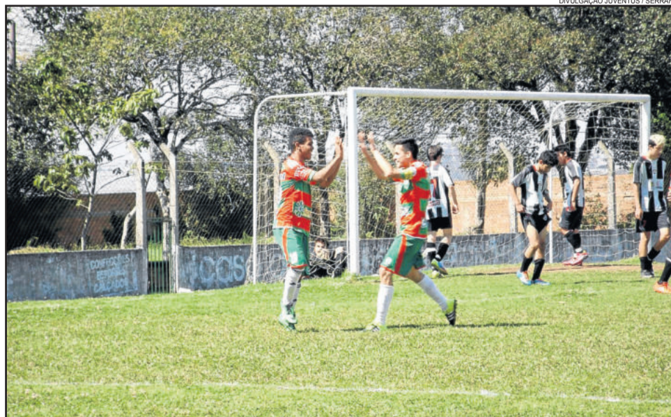
Serrano/Juventus comemora a classificação e pega o Juventude na semifinal