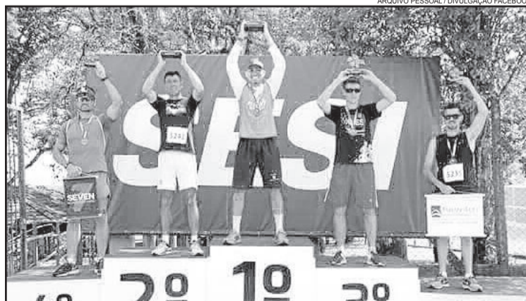
Neymar subiu ao posto mais alto do pódio em Lajeado

a final estadual do Circuito SESC de Corrida em Torres.