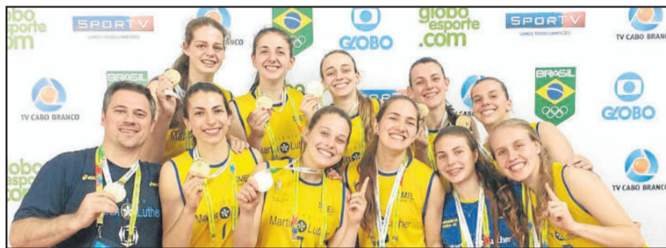
Languiru/Martin Luther/Avates é campeã feminina de vôlei dos Jogos Escolares da Juventude

A situação mais delicada na competição foi proporcionou a expectativa de ser campeão. “Após perdemos para Minas Gerais no último jogo da classificatória, teríamos o Paraná na semi, que estava invicto e havia nos vencido duas semanas antes na Taça Paraná (brasileiro de clubes). Além disso, no jogo contra Minas uma de nossas atletas se lesionou e não sabíamos se poderíamos contar com ela nesta partida decisiva. Saímos perdendo por 0x1, mas nos mantivemos focados, seguimos lutando e viramos o jogo para 3x1. Foi um momento muito marcante e decisivo. A final seria contra o Rio de Janeiro, que é quem mais venceu os jogos escolares na história do evento. Mas após a vitória da semi, da forma que