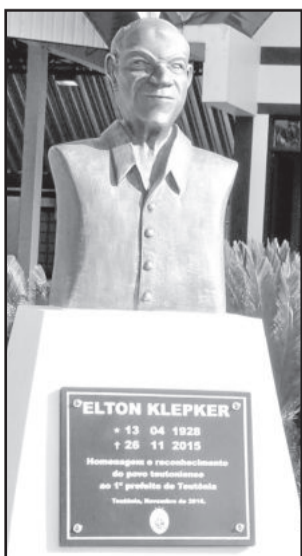
Busto fica localizado em frente ao Gabinete do Prefeito

A Secretaria da Fazenda lembra: verifique se você está em dia com suas obrigações com o Município. Solicita-se que, na medida do possível, as pendências sejam quitadas para evitar a inscrição em Dívida Ativa. Caso o munícipe não tenha condições de pagar em cota única, pode-se verificar a possibilidade de parcelamento.