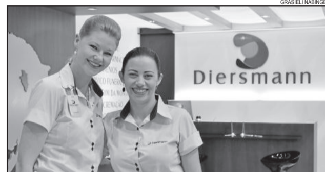
Diersmann Assistência Familiar