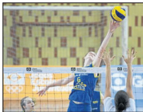
Em quadra, superação e vitórias importantes para consolidar o título