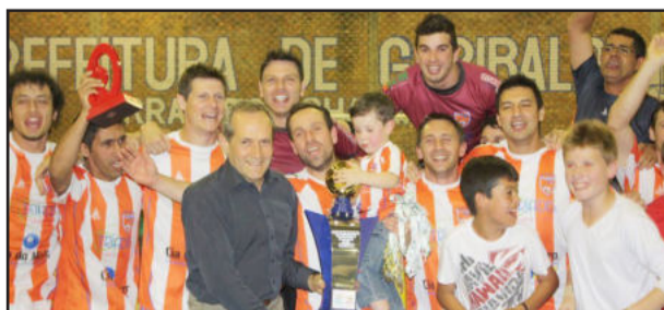
Tigres, Campeão no Força Livre