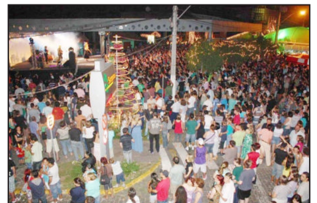
Natal Borbulhante atrai grande público às programações em Garibaldi

O Natal Borbulhante 2011 é uma realização do Cecar e Prefeitura de Garibaldi, com apoio de Aviga, Apepe e Governo Federal.