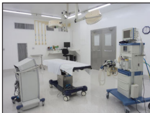
Sala cirúrgica depois da reforma