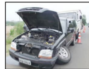
Acidente apenas resultou em danos materiais nos veículos