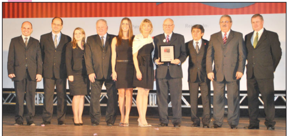
Distinção foi entregue a diretores e colaboradores da Certel Energia