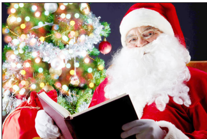
Decorações sempre devem oferecer segurança

A iluminação natalina de ruas e calçadas, realizada pelas prefeituras, não pode ser toda feita em uma