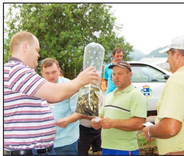
Produtores apostam na criação de alevinos

Esse é mais um projeto que a Secretaria Municipal da Agricultura de Imigrante oportuniza aos produtores rurais.