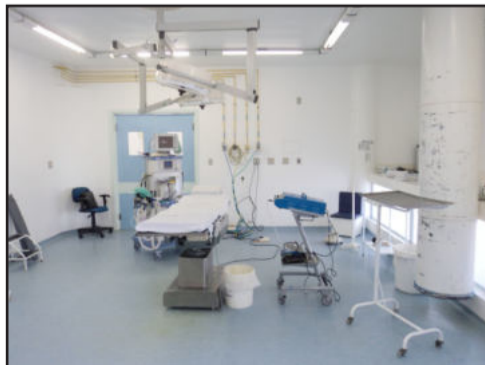
Sala cirúrgica antes da reforma

O engenheiro civil do HBB, Élbio Dutra, explica que o piso instalado é chamado de piso vinílico condutivo, bastante usado e recomendado em salas cirúrgicas para manter a segurança das instalações médicas e preservar a integridade dos equipamentos sensíveis. "O piso possui partículas de carbono e embaixo dele, que possui dois milímetros de espessura, toda extensão da sala possui carbono para que se possibilite a condução de eletricidade estática. Esta condução mantém a segurança e a integridade dos equipamentos sensíveis", ressalta o engenheiro. Foram instaladas portas em aço inox, sendo as folhas da porta, o marco e a guarnição, todos neste material. "O inox é melhor para resistir ao possível atrito com as macas e também para assepsia/limpeza", explica Dutra. As portas possuem mola hidráulica na parte superior, com braço de parada que faz com que fiquem abertas 90° para possibilitar a entrada de macas. Já o visor da porta possui uma persiana entre vidros com acionamento através de um botão, onde girando-o é possível abrir e fechar a persiana.