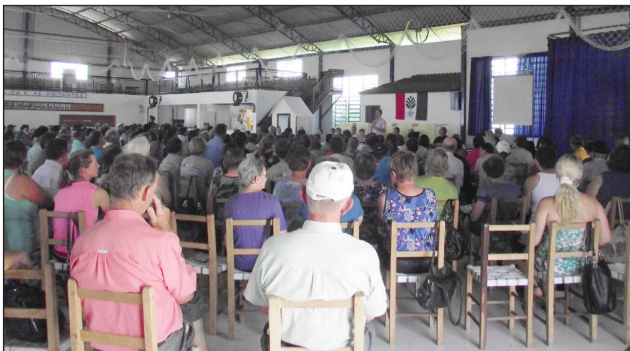
Assembleia ordinária do STR reuniu expressivo número de associados na tarde de sexta-feira

Orçamento aprovado para o ano que vem supera R$ 2,4 milhões