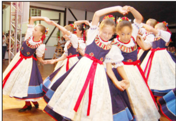
Grupo Sonnenlicht faz apresentação no domingo

Na mesma noite será inaugurada a Decoração Natalina do Município, com destaque para os pórticos, três na Sede e um no Bairro Daltro, em um trabalho que está sendo realizado pelo pessoal da Secretaria de Obras/equipe de eletricitistas.