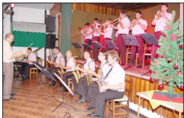
Orquestra realiza shows natalinos