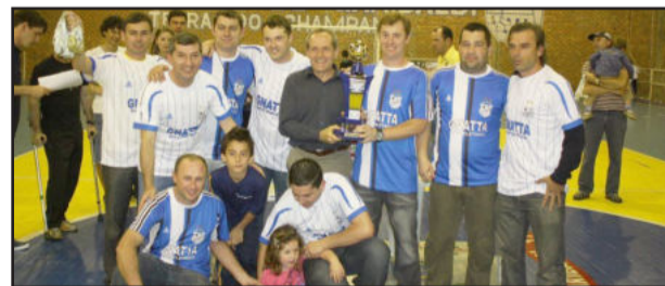
Gnatta/Los Gringos, Campeão no Veterano