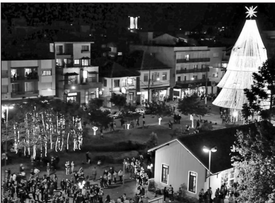
Natal das Estrelas 2011 inicia dia 27

A decoração do Natal das Estrelas de Carlos Barbosa ganhou ainda mais luz em 2011. A Secretaria de Turismo, Indústria, Comércio e Serviços, em parceria com entidades e empresas, tem buscando qualificar a cada ano o Natal para que este se torne um dos principais eventos da região. Neste ano, as novidades recebem os visitantes, com bandeiras natalinas adornando o Portal das Bandeiras e luminárias especiais, enquanto árvores de luz montadas nos postes mostram o caminho ao pinheiro de 23 metros montado na Torre da Estação.