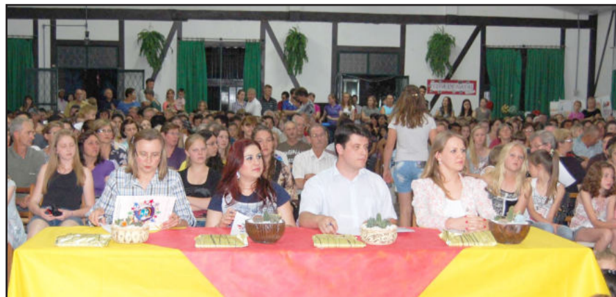
O júri e o público que prestigiu o evento