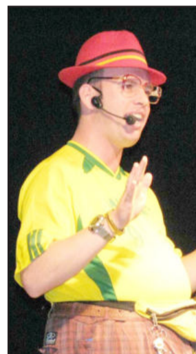
Personagem Willmutt faz show em Imigrante

O personagem Willmutt tornou-se conhecido através da internet, interpretando um alemão atrapalhado e que aplica trotes telefônicos em centrais telefônicas. Os trotes