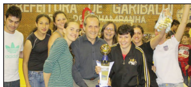
BGF, Campeã no Feminino