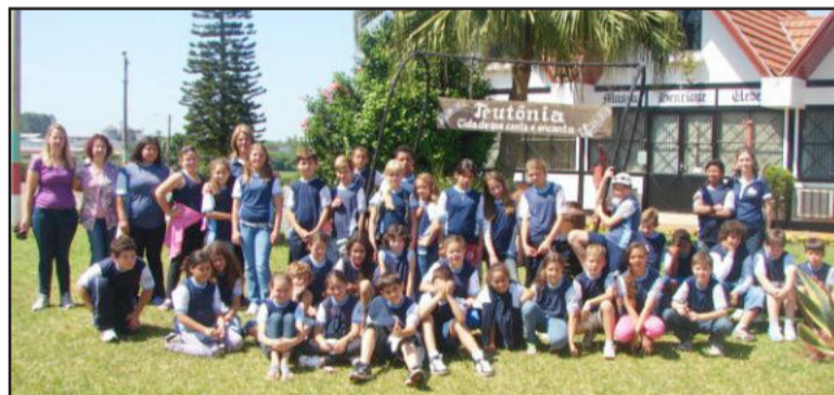
Alunos da EMEF Alfredo Schneider visitaram o Centro Administrativo