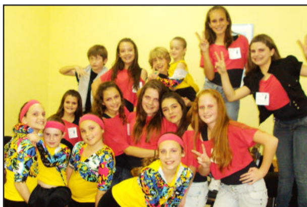
Alunas do Grupo Expressart