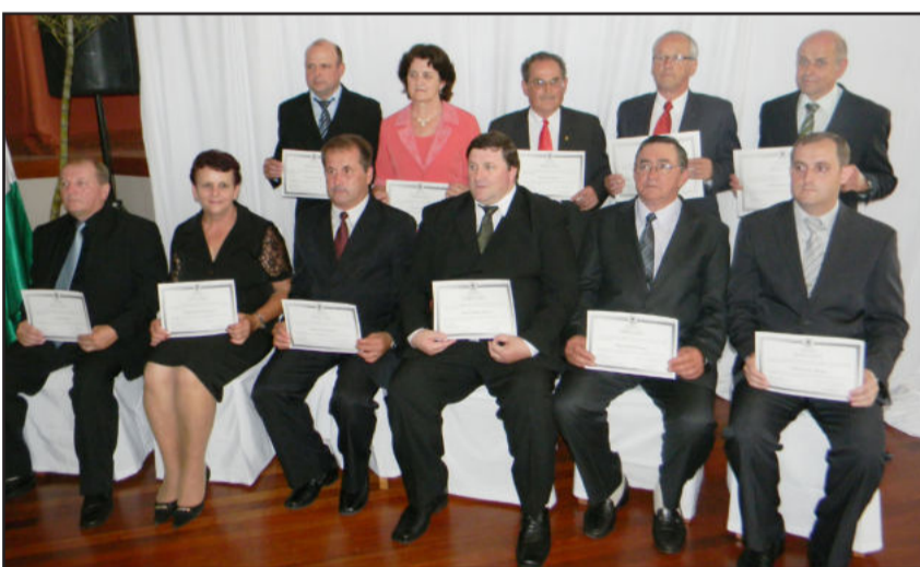
Candidatos eleitos em Poço das Antas