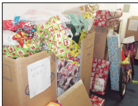
Presentes arrecadados pelos Correios