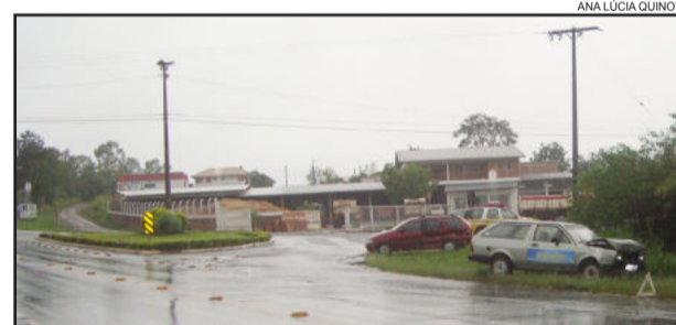
Acidente envolveu dois veículos e resultou em danos materiais

Por volta das 11h da manhã de ontem, sexta-feira, dia 21, ocorreu um acidente com danos materiais no entroncamento da ERS-128 com a Rua 17 de Junho, no trevo de acesso ao Bairro Canabarro e a Linha Ribeiro. Um Fiat Pálio Weekend, placas IJD-0470, fazia a travessia do trevo do Bairro Canabarro em direção a Linha Ribeiro. O condutor não viu a Parati, placas IGG-4378, que vinha pela ERS-128 (Via Láctea), no sentido Fazenda Vilanova a Teutônia. A Parati bateu na lateral da Pálio Weekend, ocasionando apenas danos materiais nos dois veículos.