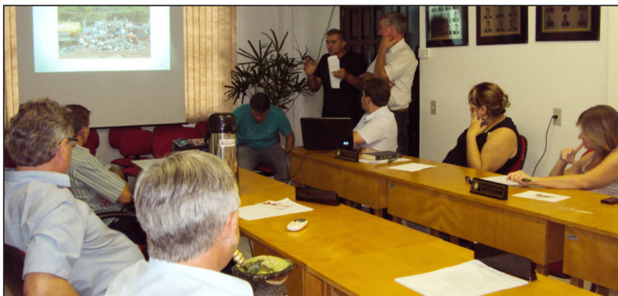
Secretários de Obras e Agricultura apresentaram relatórios dos serviços realizados no ano