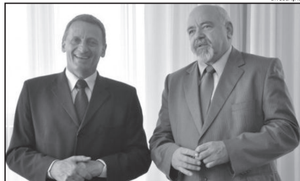
Xavier (d) reassume o Executivo

Neste período de finalização de governo, o atendimento ao público no Gabinete do Prefeito está suspenso nos meses de dezembro e janeiro, sendo normalizado em 13 de fevereiro.