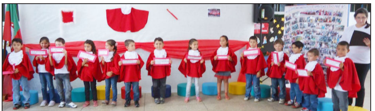
Turma do Pré-B se formou na Educação Infantil