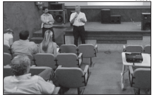
Apresentado Plano Municipal de Gestão Integrada de Resíduos Sólidos

Segundo ela, o lixo urbano de Carlos Barbosa é destinado a três locais diferentes. O lixo orgânico é conduzido à Unidade de Transbordo de Barão e, em seguida, ao aterro sanitário de Minas do Leão. O lixo seco é encaminhado à Central de Triagem Municipal, sendo enviado para reciclagem ou ao aterro sanitário municipal. O plano propõe alternativas, tais como: ampliar o atual aterro sanitário, implantar novo aterro sanitário municipal, fazer a disposição em Minas do Leão, estudar a implantação de soluções em conjunto com outros município através de consórcios, ou analisar outras tecnologias de destinação - incineração, compostagem, aproveitamento energético.