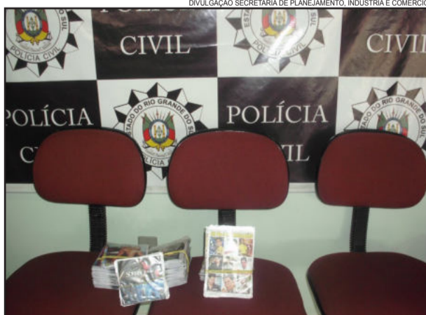
Apreensões realizadas no dia 19

A Prefeitura de Garibaldi, através da Secretaria de Planejamento, Indústria e Comércio, tem intensificado as ações de combate ao comércio ilegal nestes dias que antecedem o natal.