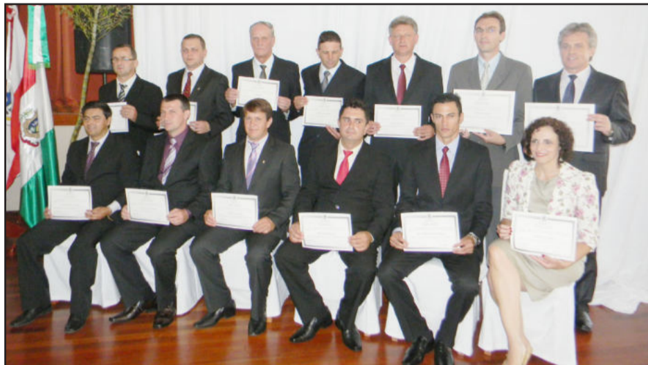
Candidatos eleitos em Teutônia