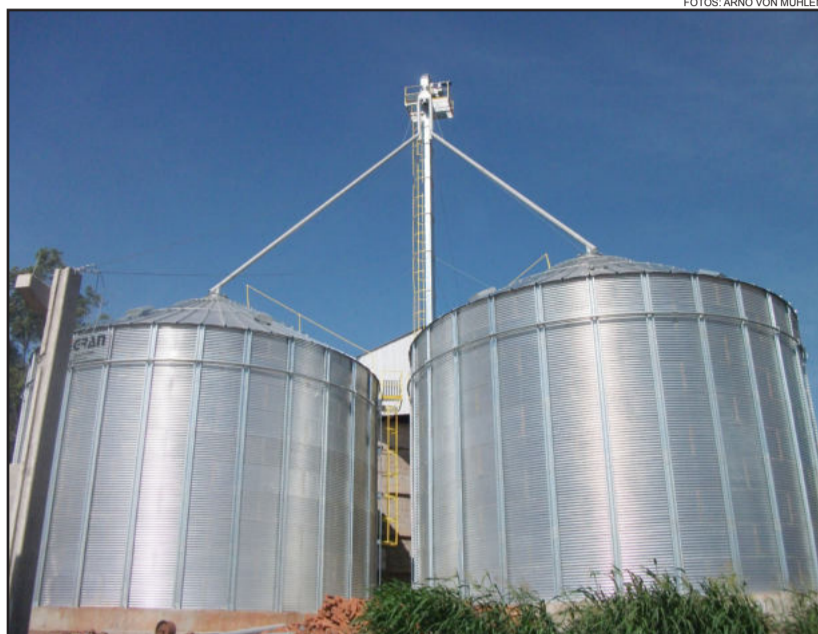
Novos silos ampliam a capacidade de armazenamento da Cooperagri

Na questão da balança, "muitas vezes estamos comprando produto em carreta e bitrem e não tínhamos condições de pesar, porque temos uma balança mecânica de 30 toneladas. Estamos colocando uma balança totalmente ele-