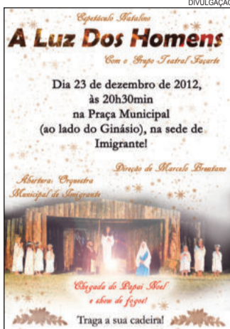
Cartaz do espetáculo