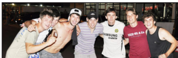
Eles também torceram

A Miss Brasil pisou em solo brasileiro por volta do meio-dia de ontem. Assim que chegou em sua residência, tirou alguns minutos para descansar e, após, começou a atender a imprensa.