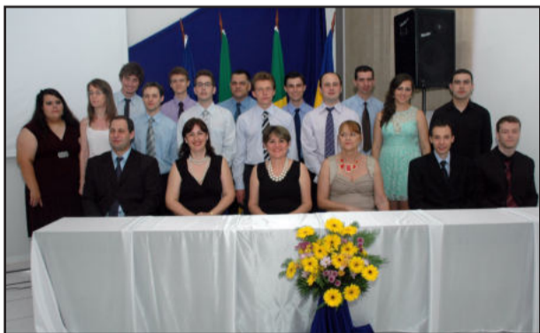
Turma de informática