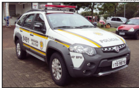
Brigada Militar recebeu nova viatura no dia 7 deste mês