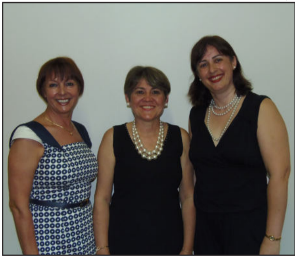
Coordenadoras da formatura