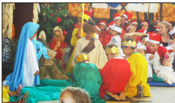
Encenação do nascimento de Jesus e chegada do Papai Noel emocionaram as famílias da EMEI Sonho de Criança

amor em ação! Natal é sentir gratidão. Nosso agradecimento especial à Administração Municipal, especialmente à Secretaria de Educação, à Associação de Pais da escola, aos pais, aos profissionais e principalmente às crianças que fazem desta escola um lugar para ser e conviver!", destaca a direção da EMEI Sonho de Criança.