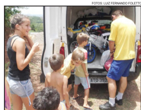
Crianças fizeram fila para receber os presentes de Natal

Este ano foi escolhidos duas escolas para participar da campanha de Natal dos Correios: uma estadual e outra municipal, indicadas pelas secretarias de educação estadual e municipal. Um deles foi o CIEP no Bairro Santo Antônio e o outro o Francisco Oscar Karnal. "A escolha é por uma comunidade carente. Não adianta fazer uma campanha em um colégio particular aqui do Centro, pois não terá o verdadeiro sentido do Natal", diz o gerente.