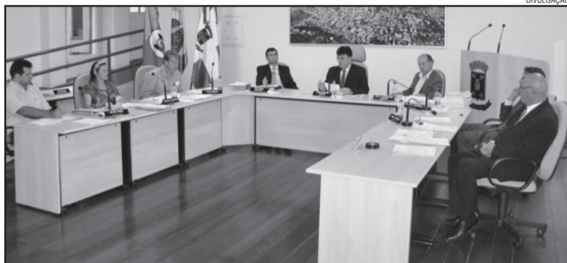
Parlamentares garibaldenses se reuniram na última sessão ordinária do ano

Também uma autorização para firmar convênio e a repassar contribuição financeira ao Fraterno Auxílio Cristão (FAC), no montante de 240 mil reais, divididos em 11 parcelas, sendo uma de 22 mil e as demais de 21 mil e 800 reais cada, de fevereiro a dezembro de 2013. O recurso será aplicado em despesas decorrentes