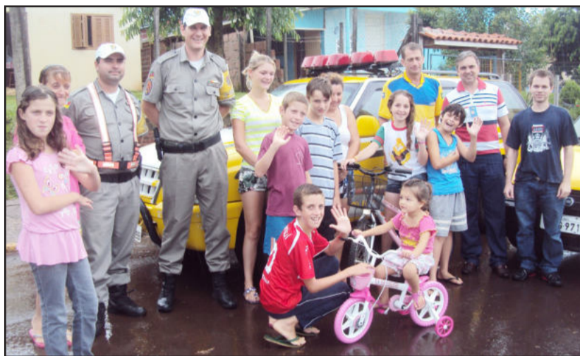
Belo gesto de Natal Polícia Rodoviária, Correios e empresários entregam presentes