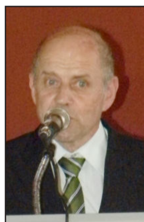
Prefeito eleito de Poço das Antas, Glicério Ivo Junges