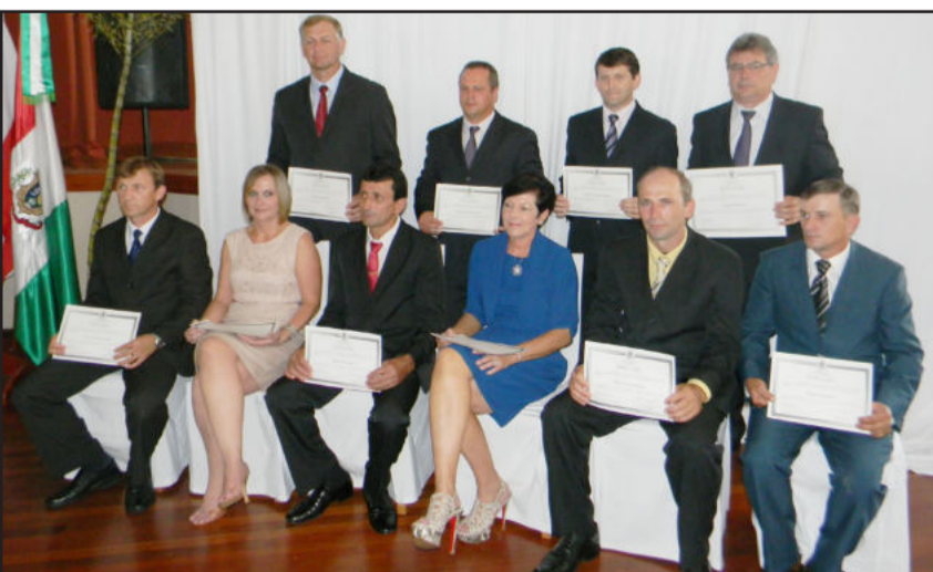
Candidatos eleitos em Westfália