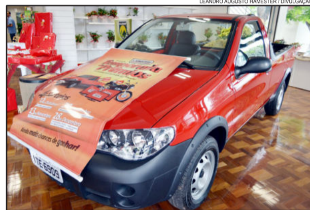
Último sorteio da Temporada de Prêmios Languiru 2012 irá distribuir um automóvel zero quilômetro (foto), uma TV LED 42 polegadas, um vale-compras de R$ 1 mil, um vale-compras de R$ 750,00 e um vale-compras de R$ 500,00.

Nos sorteios anteriores, realizados nos meses de outubro e novembro, foram distribuídos dois televisores de LED 42", seis vale-compras no valor de R$ 500,00 cada e uma moto Honda Fan 125 KS zero quilômetro. Todas as cautelas sorteadas até o momento retornam às urnas e seguem concorrendo no sorteio final do dia 28 de dezembro.