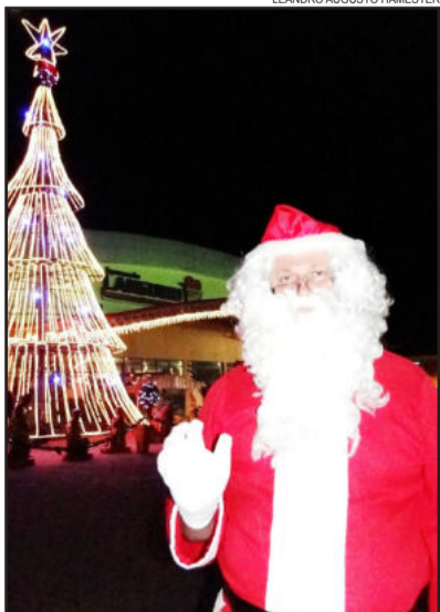
Papai Noel distribui balas e posa para fotos com as crianças

Já a Mamãe Noel estará na unidade do Bairro Languiru no dia 22 de dezembro, das 17h às 18h30min, e no dia 24, das 14h às 17h; no Bairro Canabarro dia 21, das 18h15min às 20h, dia 22, das 11h às 12h30min, e dia 23, das 9h às 11h; no Supermercado Languiru de Poço das Antas no dia 21, das 16h às 17h45min, e no dia 22, das 15h às 16h30min; e no Supermercado Languiru de Bom Retiro do Sul no dia 22 de dezembro, das 9h às 10h30min, e dia 24, das 10h às 12h.