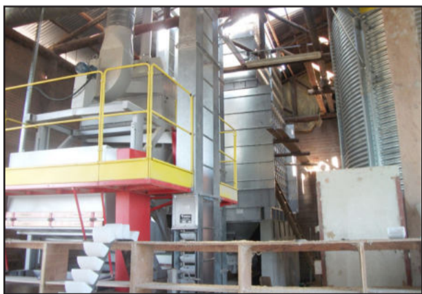
Novos equipamentos aumentam a capacidade de produção da fábrica de rações