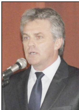
Prefeito eleito de Teutônia, Renato Altmann