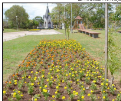
Praça da Ermida passou por revitalização

turistas, uma infraestrutura moderna e funcional, aliada às históricas manifestações religiosas do povo garibaldense.