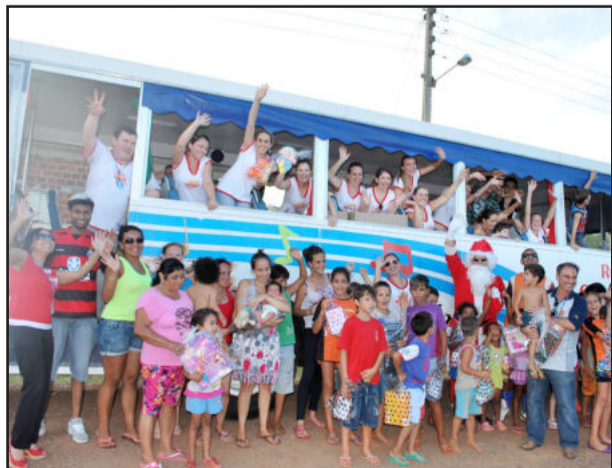
Papai Noel acompanhou distribuição de presentes