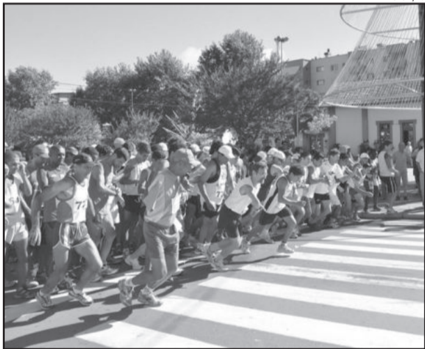
Rústica será na segunda, dia 31, contabilizando um percurso de 10 km

A 38ª Rústica de São Silvestre e a 11ª São Silvestrinha são promovidas pela Administração Municipal, por meio da Secretaria de Esportes, Lazer e Juventude.