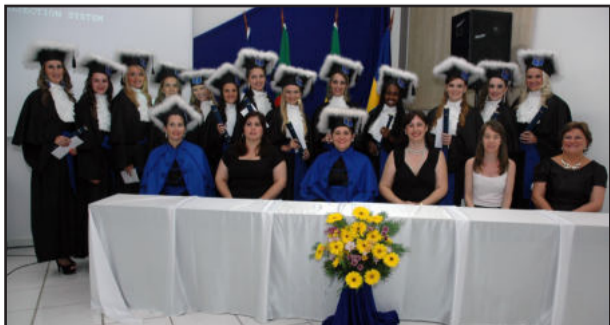
Turma do secretariado