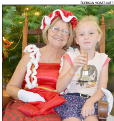
Mamãe Noel também marca presença neste Natal