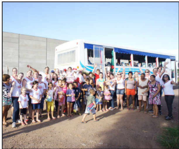
Campanha alegrou e emocionou as comunidades