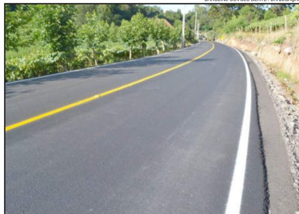
A obra teve investimentos federais e de recursos próprios

A pavimentação asfáltica de São Gabriel recebeu um investimento de R$ 1 milhão, sendo R$ 780 mil oriundos de recursos federais, através do Ministério do Turismo, e R$ 220 mil de recursos municipais. Além de beneficiar os moradores da comunidade de São Gabriel, esta pavimentação contribuirá para a melhoria da infraestrutura do Turismo Rural, uma vez que integra o Roteiro Turístico Estrada do Sabor.