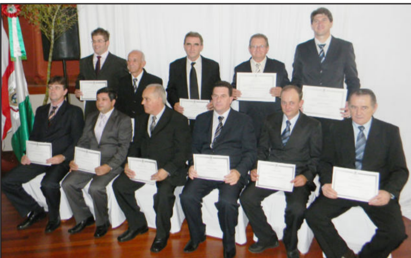
Candidatos eleitos em Paverama