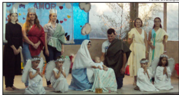
Professores, pais e alunos participaram das apresentações

A Creche Azaléia entrou em férias nesta semana. Nesta quarta-feira, dia 20, foi o último dia de atendimento da creche para 2012.