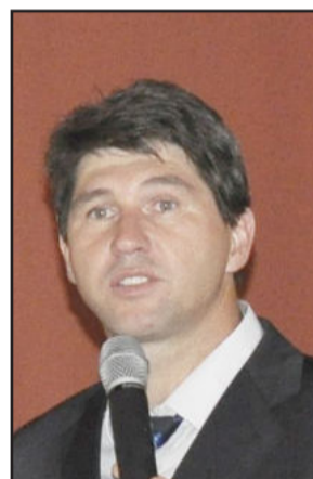
Prefeito eleito de Paverama, Vanderlei Marjus