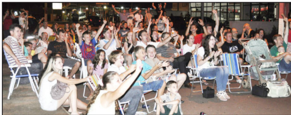
Vibração com o anúncio das cinco finalistas