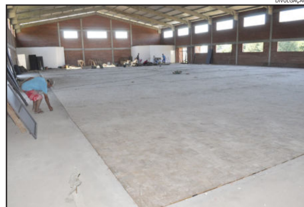
Obras do Ginásio da EMEF Alfredo Schneider

A primeira etapa da obra do ginásio da EMEF Alfredo Schneider também foi efetuada com recursos próprios do Município neste ano, executada pela empresa Pizzato Engenharia em Pré-Moldados, no valor total de R$ 334.613,46. A primeira etapa foi mais estrutural.