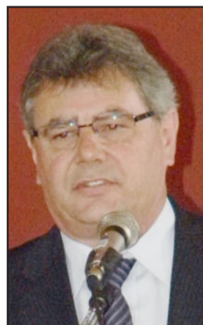
Prefeito reeleito de Westfália, Sérgio Marasca