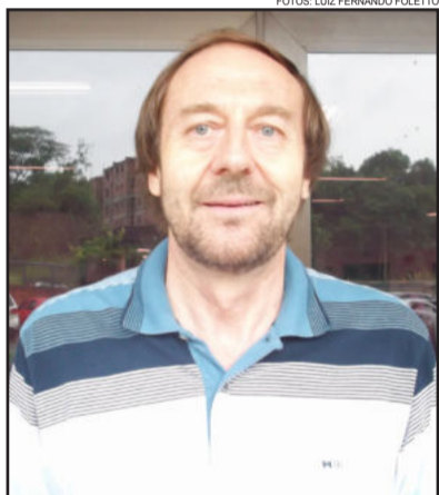
João ressalta que o CPF é documento obrigatório para efetuar a inscrição