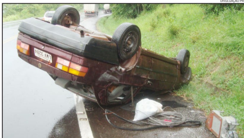
Santana capotou em Marques de Souza e deixou condutor com ferimentos leves

Às 16h55min desta quinta-feira, dia 20, uma saída de pista seguida de capotamento na BR-386 deixou uma pessoa ferida. Segundo a Polícia Rodoviária Federal, o Santana, placas de Palmeira das Missões, seguia no sentido interior-capital, saiu da pista, colidiu na sarjeta e capotou sobre a pista, causando lesões leves no condutor, um homem de 33 anos.