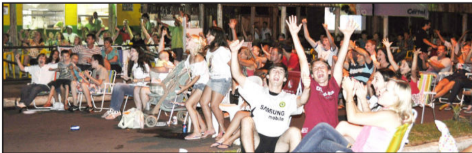
Vibração com o anúncio das cinco finalistas