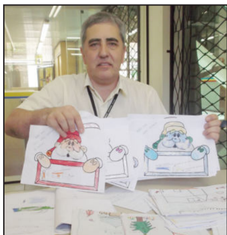
Crianças carentes enviaram suas cartinhas