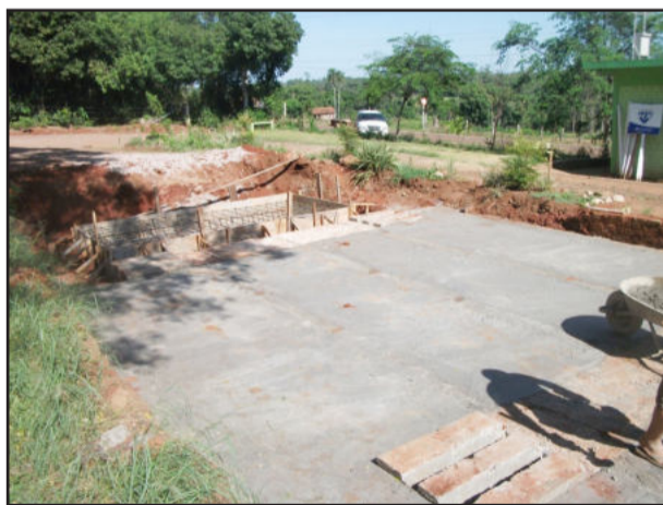
Cooperagri continua em fase de expansão