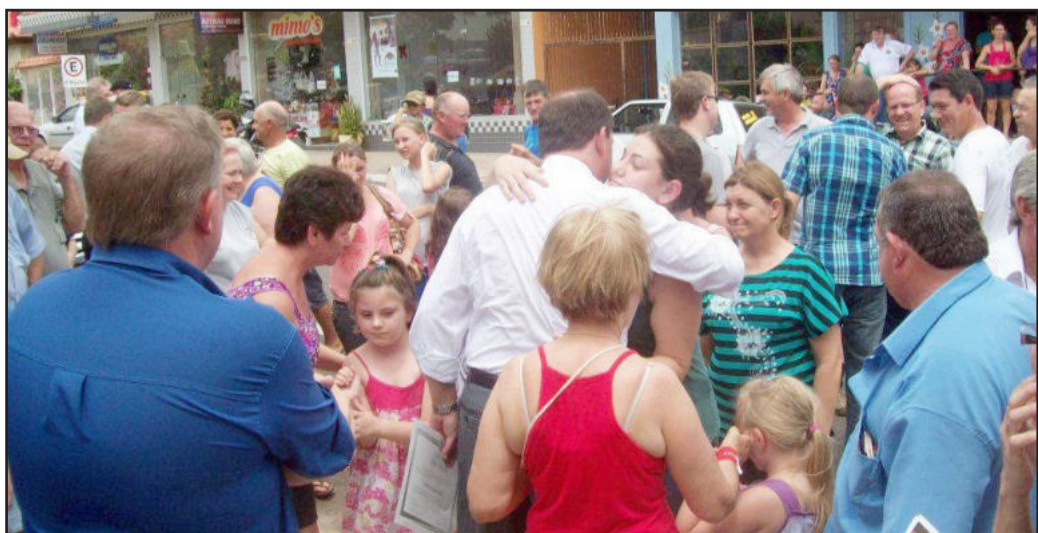
Recepção ao prefeito novamente foi calorosa de parte da comunidade