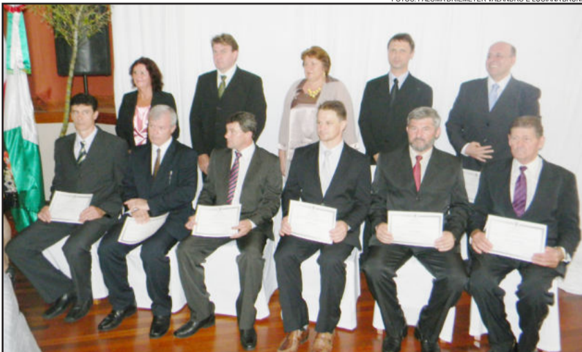
Candidatos eleitos em Imigrante