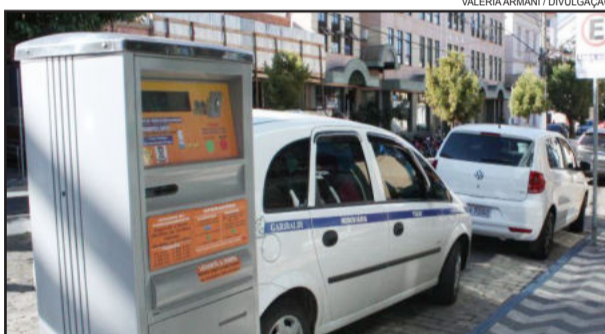
No dia 31 não haverá cobrança de rotativo em Garibaldi

A Prefeitura de Garibaldi, através do Departamento de Trânsito, informa que no dia 31 de dezembro, véspera da Confraternização Universal, não haverá cobrança do Estacionamento Rotativo. Desta forma, os condutores poderão estacionar na área azul sem apresentar o ticket de pagamento.