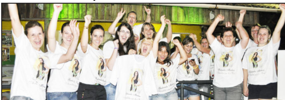
Torcida uniformizada para torcer