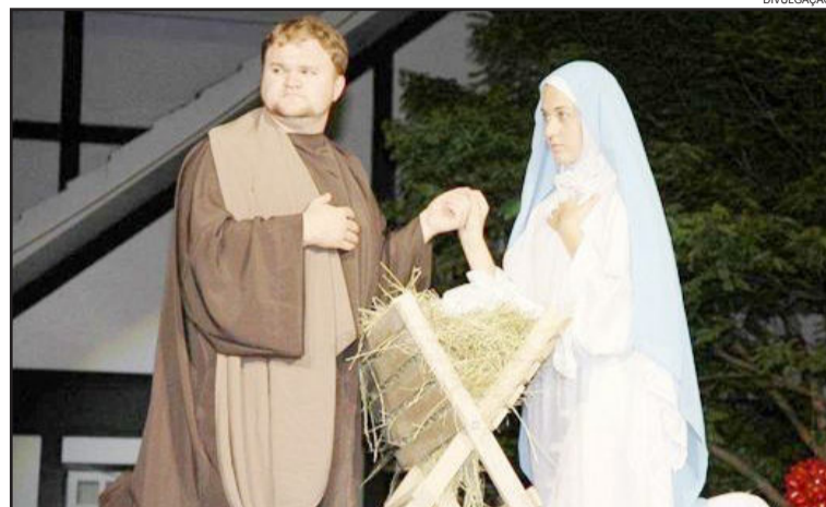
Encenação de Natal de Westfália é aguardada pela comunidade

As escolas municipais Vila Schmidt e Olavo Bilac farão uma participação especial, abrindo a peça teatral "O Brilho da Estrela". A programação continua com o Show Pirotécnico e a inusitada chegada do Papai Noel. A presença da Ervateira Gaúcha da Serra já está confirmada, garantido o tradicional chimarrão. Venha prestigiar o Brilho da Estrela, e não esqueça a sua cadeira.