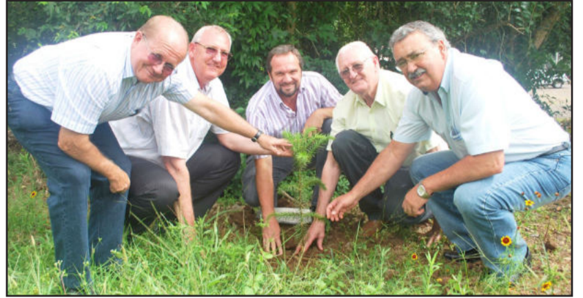
Plantio marca a intercooperação existente em Teutônia

Foi efetuado na manhã desta quarta-feira, dia 19, na Associação Atlética da Sicredi Ouro Branco, em Boa Vista, Teutônia, o plantio de árvores para a neutralização dos gases de efeito estufa emitidos pelo Encontro "A Intercooperação Sustentável". O evento, alusivo ao Ano Internacional das Cooperativas, foi promovido em setembro pelas cooperativas Languiru, Certel e Sicredi Ouro Branco, integrando líderes de núcleo das três entidades, tendo por local a Associação dos Funcionários da Languiru. Foram plantados dois pinheiros para a neutralização de 0,14 tonelada de carbono equivalente emitidos pelo evento.