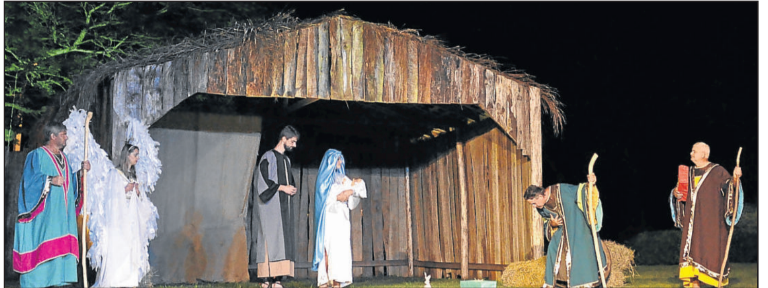
Nascimento de Cristo foi encenado pelo Grupo Teatral Façarte