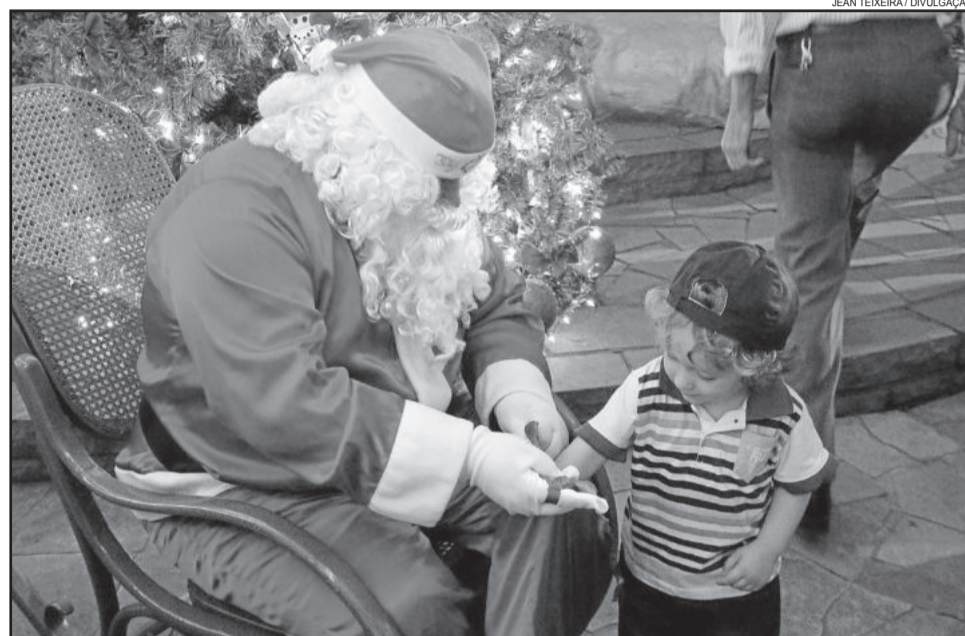
Papai Noel no Natal Borbulhante

Rental é o responsável pelo fornecimento de energia para a 18ª edição do Natal Borbulhante de Garibaldi e para o Natal de Bento Gonçalves, no Vale dos Vinhedos.