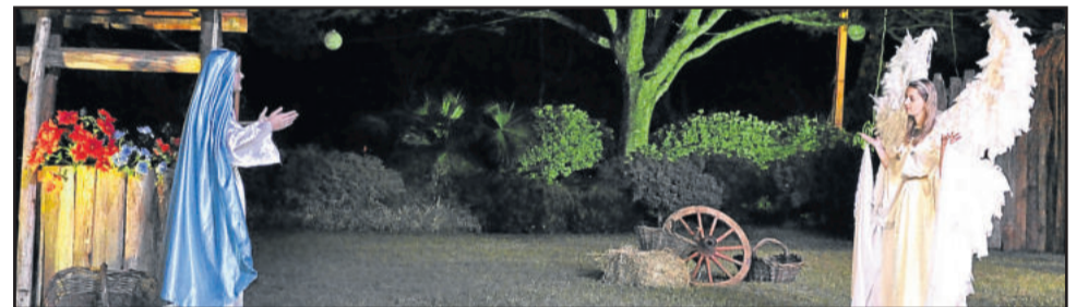
Encenação contou os principais momentos antes do nascimento de Cristo