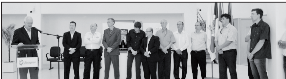
Diretoria e autoridades reunidas no cerimonial de inauguração

Estrela conta agora com duas Unidades de Atendimento no município, uma no Centro e outra no Bairro Oriental.