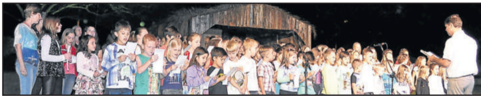
Programação também teve apresentações das escolas

do ano. "Passamos por tormentas, mas nossa comunidade se manteve forte. Somos uma comunidade que luta. Encerramos o ano com o melhor PIB do Vale do Taquari e 22º do Estado. Cada um de vocês contribuiu com esse resultado", destacou.