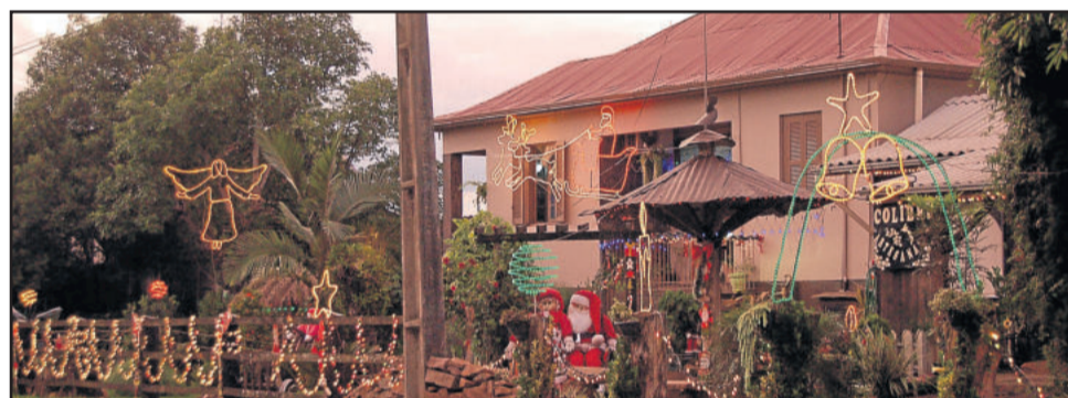
Artesanato Colibri novamente figura entre os destaques