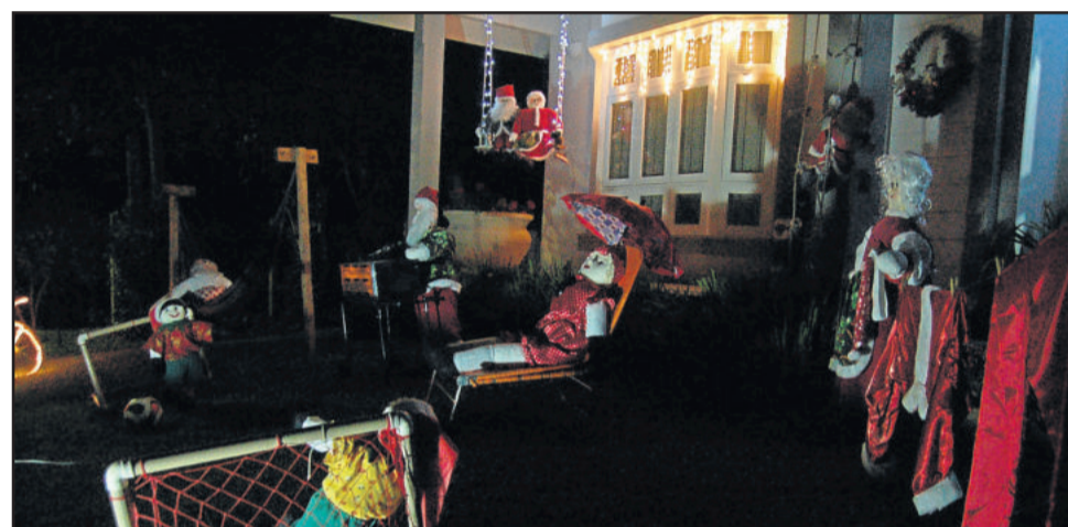
Criatividade chamou atenção dos jurados