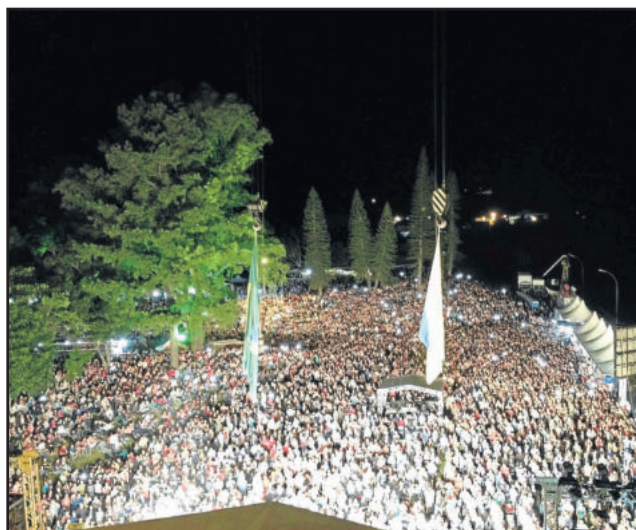
Público lotou as margens do Rio Taquari