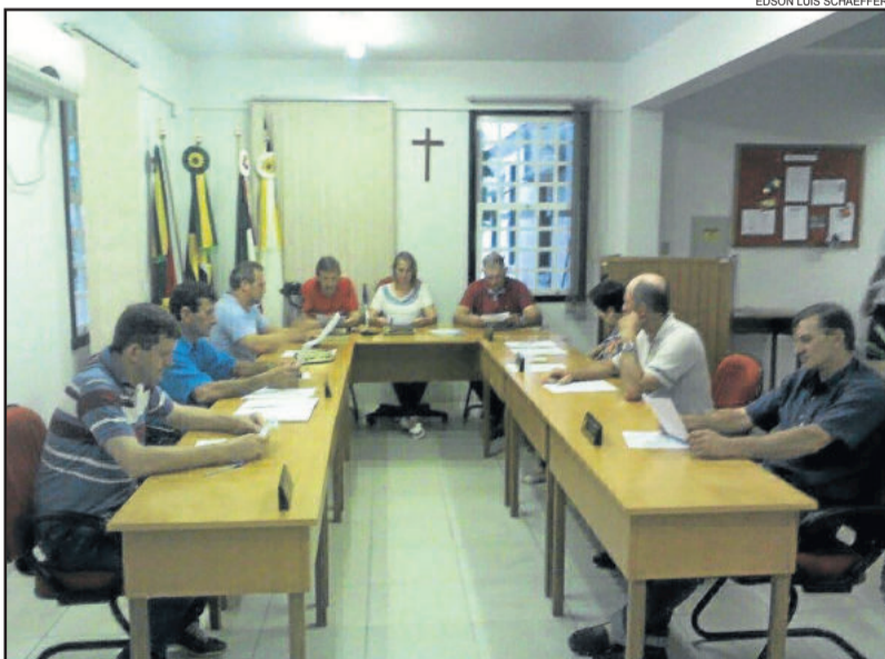
Vereadores se reuniram em sessão extraordinária para ler e autorizar a ata da sessão anterior, além de ler o ofício do Executivo solicitando a retirada do projeto

Na sessão ainda, foi lido o ofício número 185/2015 de autoria do Executivo, solicitando a retirada do projeto de lei que havia sido baixado nas comissões na sessão do dia 16 de dezembro. O Projeto de Lei nº 100 autorizava a cessão de uso temporário de prédio e de área de terras à Rede de Proteção Ambiental e a Animais. A intenção era instalar um Centro de Estudos Ambientais, em Linha Berlim Fundos.