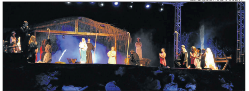
Como no ano passado, teatro será encenado em palco natural, montado no Parque Municipal de Eventos

O 5º Natal Iluminado tem o patrocínio de Cooperativa Languiru, Sicredi, EXPOPEDRAS, Jaime Euri Grave & Cia, Hollmann & Bagio, Xile Paisagismo, Electro Luz, Frigorífico Angus e Metalúrgica Krabbe.