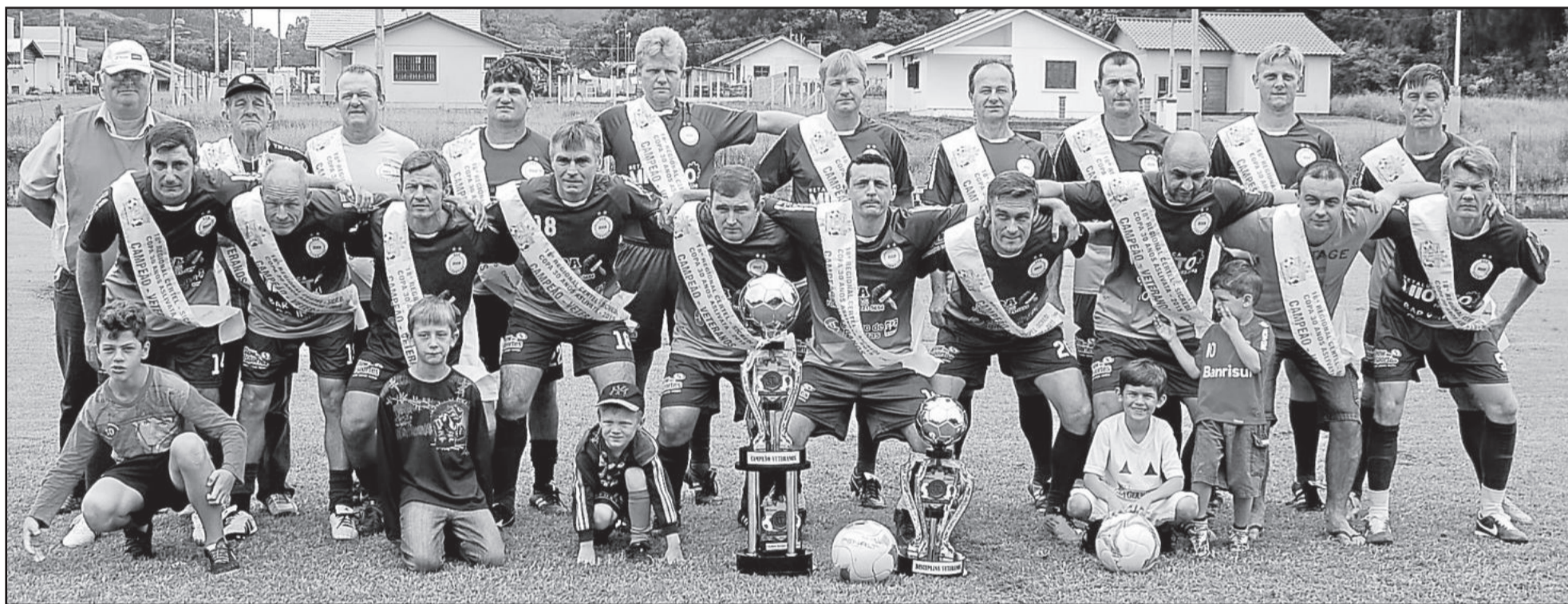
Juventude, campeão regional de veteranos