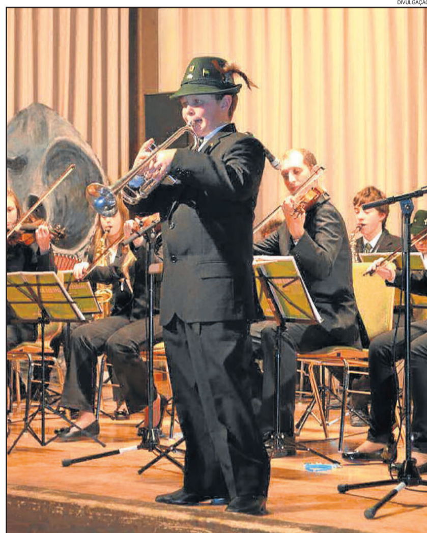
Apresentação com Orquestra do Colégio Teutônia na Alemanha