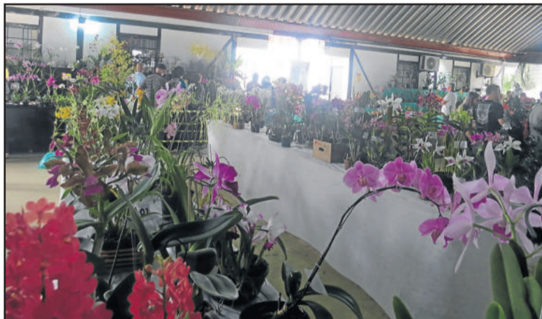
O Centro Cívico da Prefeitura foi tomado pelas flores