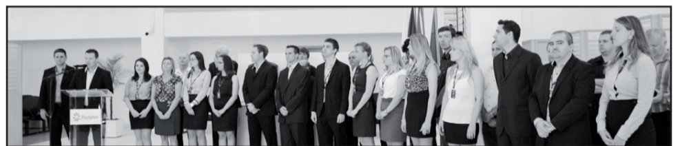
Equipe de colaboradores da nova Unidade de Atendimento