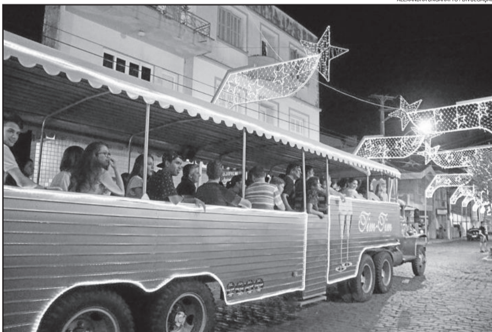
Passeio de Tim Tim no Natal Borbulhante