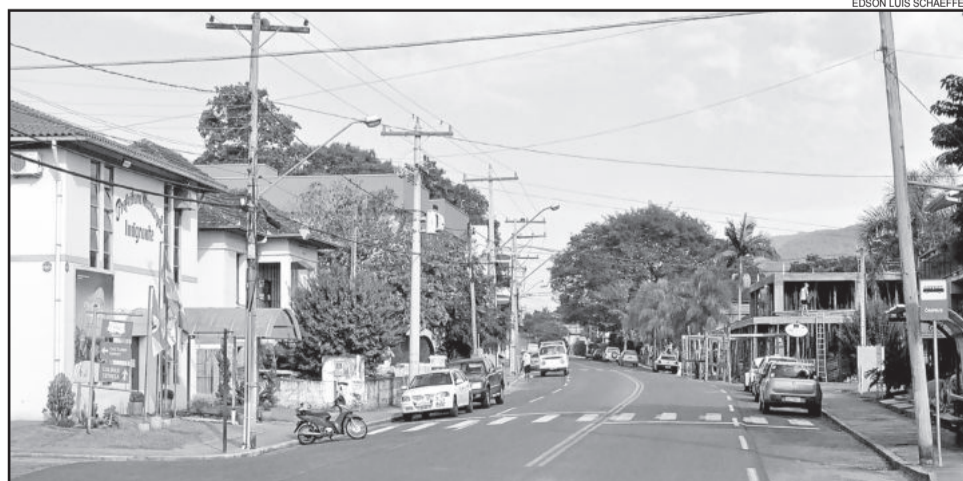
Imigrante lidera o ranking no Vale do Taquari