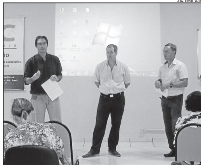
Em Teutônia, reunião ocorreu no dia 4 de março

Apesar do planeta ser repleto de água, estima-se que apenas 0,77% estejam disponíveis para o consumo humano em lagos, rios e reservatórios subterrâneos.