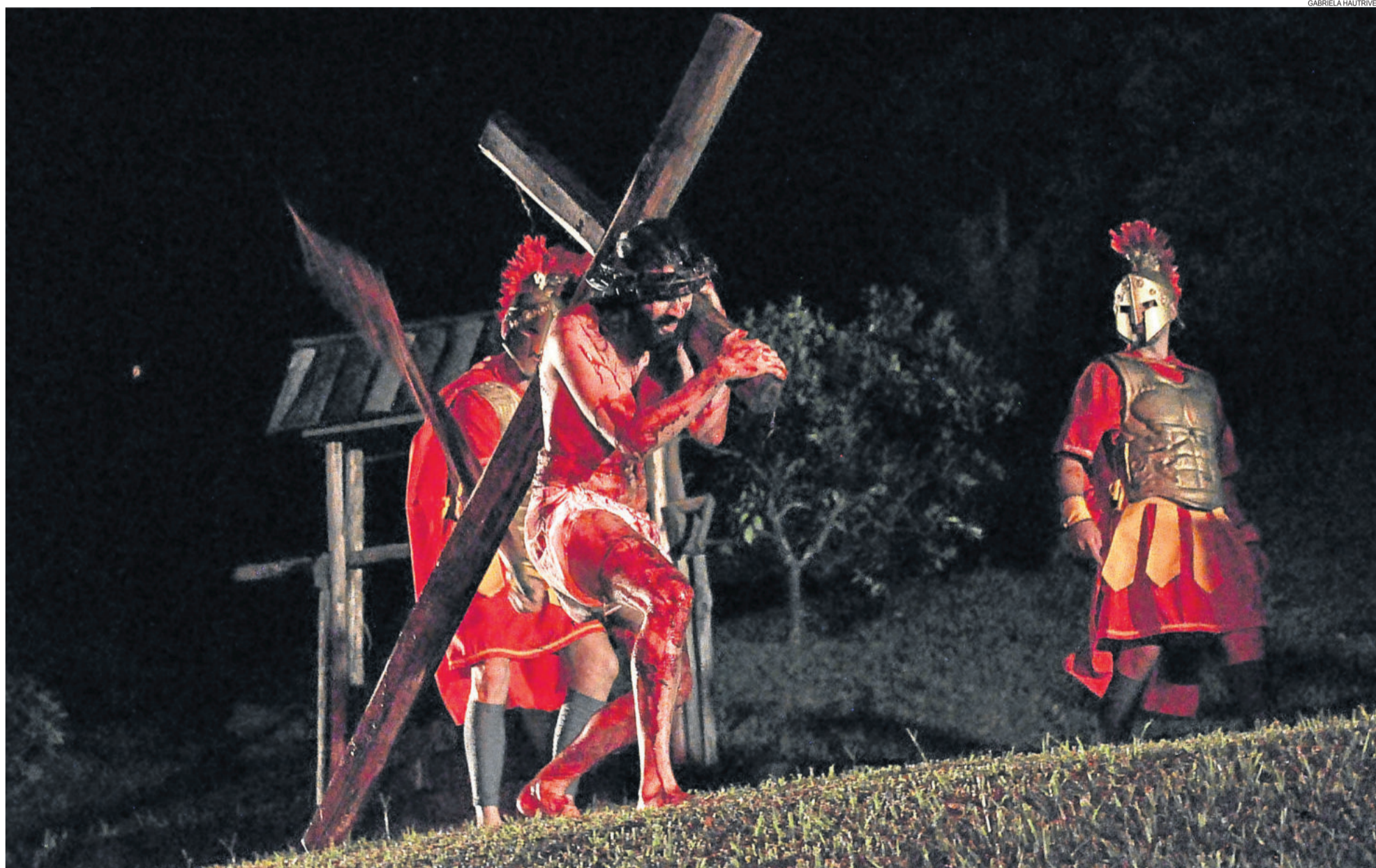
Espectáculo mais uma vez impressionou pelo realismo das cenas e emocionou. Cerca de 5 mil pessoas prestigiaram a encenação. IMIGRANTE > 5

PROGRAMAÇÃO DE PÁScoa ATRAI CRIANÇAS DE TODA REGIÃO