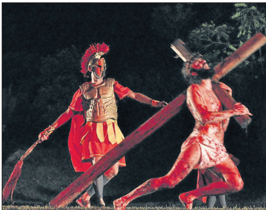
Cena em que Cristo carrega a cruz é uma das principais da encenação