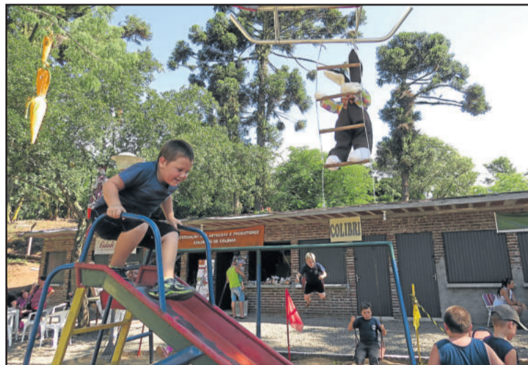
Diversão não faltou na programação