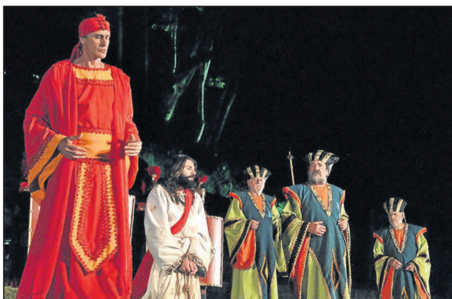
Empenho dos atores em cada momento da apresentação