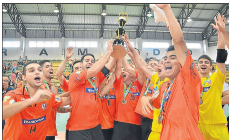
ACBF conquistou o sexto título consecutivo

dia, em Santa Catarina, nos dias 23 e 24 de março. No dia 4 de abril, o time de Carlos Barbosa disputa o título da Supercopa contra o Jaraguá, na casa do adversário. O vencedor disputará a Libertadores, no final de abril, na Venezuela.