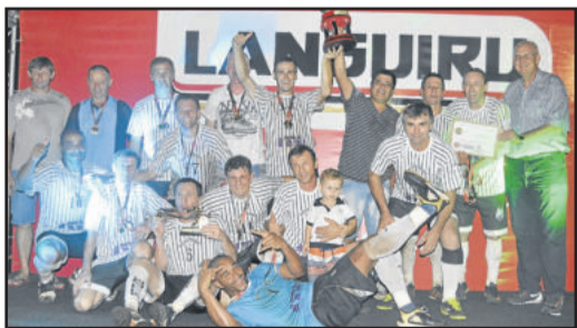
Renegados, campeão do Master