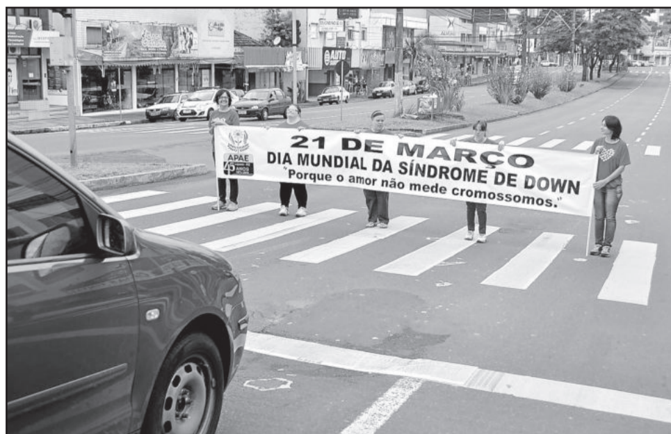
Pela manhã, os alunos estiveram com faixas em sinalização do Centro de Lajeado