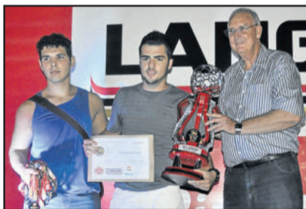
Rudibar, vice-campeão do Sub-20