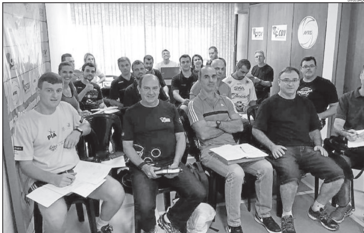
Técnicos de todo Estado estiveram na FGV para definir as competições do semestre

Braga/FGV, Festival Internacional Cidade de Estrela e Torneio Internacional de San Jerônimo, na Argentina. As datas do segundo semestre serão definidas numa próxima reunião, em data a ser marcada pela FGV.