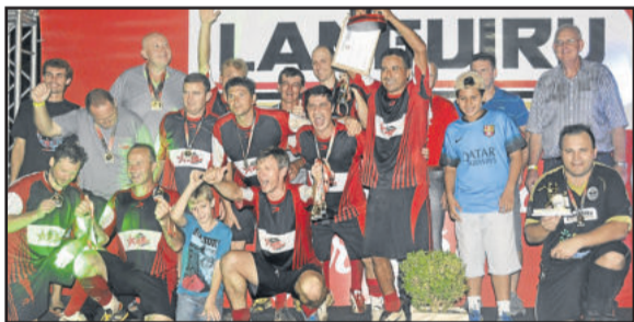
Viévi Automóveis, campeão do Veterano