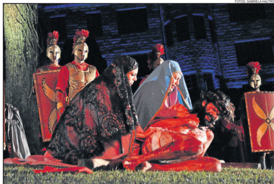
Realismo das cenas impressiona o público