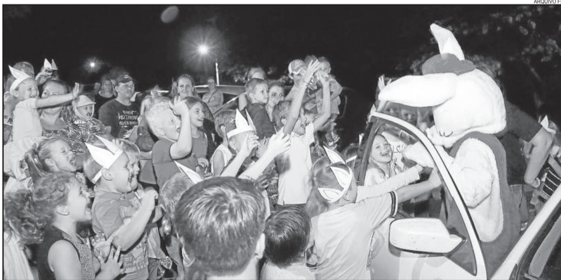
Evento ocorrerá no Esporte Clube Juventude, de Linha Berlim

Ao final, haverá show ao ar livre com a Banda Barbarella. O ingresso para adultos será de R$ 10,00 e crianças até 12 anos não pagam.