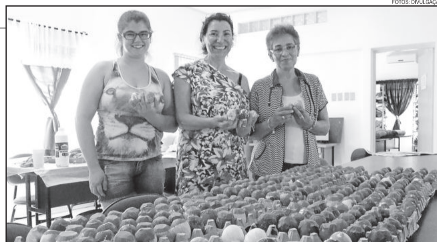
Oficineiras e equipe do Cras confeccionaram mais de 300 casquinhas

A decoração, realizada pelas integrantes do Centro de Referência em Assistência Social, está presente também na Administração Municipal e suas secretarias, com o desejo de uma Feliz Páscoa a toda a comunidade.