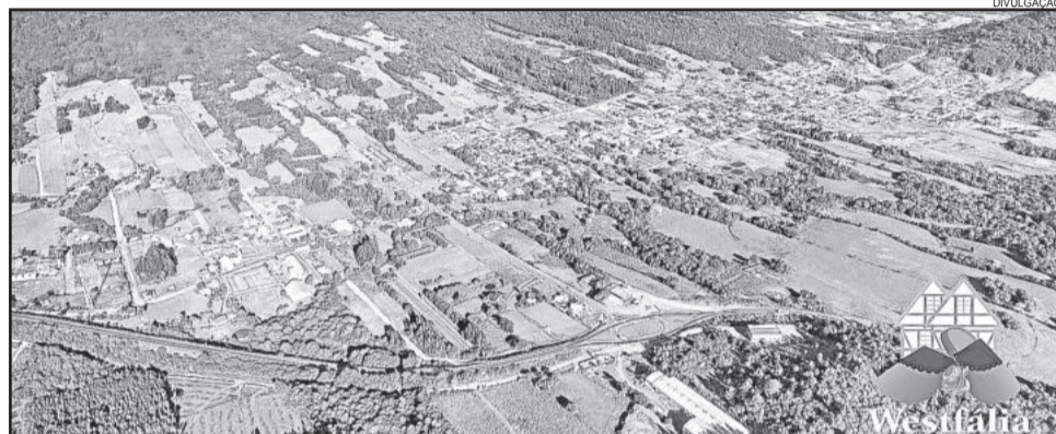
Westfália cresce ordenadamente

se desenvolvendo juntas, propiciam uma melhor qualidade de vida para nossa comunidade. Trabalhamos com vistas para o futuro e nos preocupamos em organizar nossa cidade da melhor forma. A busca por recursos é uma constante, sempre embasados com projetos e atentos às oportunidades. Nosso povo é trabalhador e essa é a nossa maior marca. Westfália está de parabéns e se esforça unida para que possamos ser uma terra cada vez mais próspera, com organização e qualidade de vida”, destaca ele.