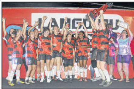
Flamengo, vice-campeão do Feminino