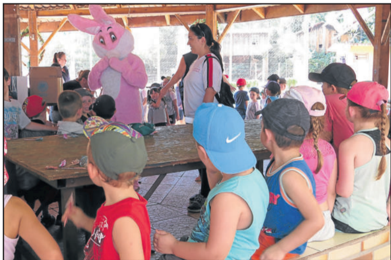
Presença do coelho anima as crianças