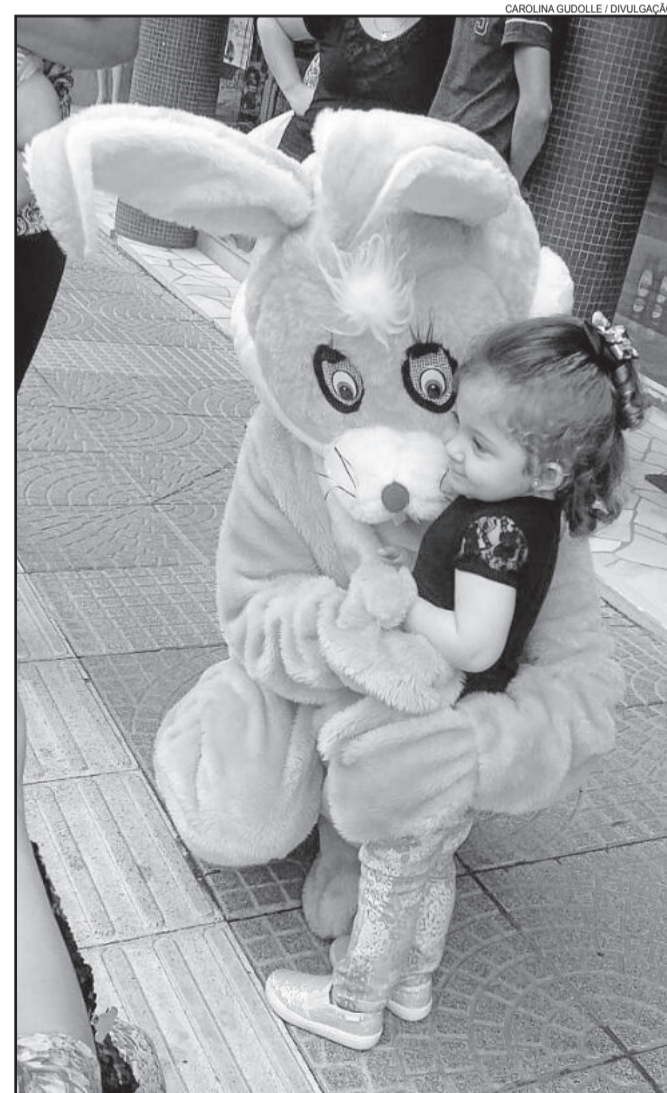
Coelhos interagem com as crianças