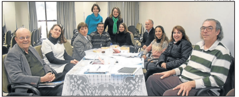
Conferência da Cultura realizada em 2013

A Conferência é uma realização da Prefeitura de Garibaldi, por meio da Secretaria de Turismo e Cultura. Os interessados devem confirmar presença pelo e-mail cultura@garibaldi.rs.gov.br ou pelo telefone (54) 3462-8235.