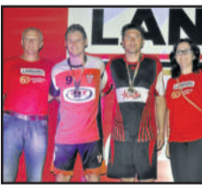
Pitbul (Força Jovem) e Maravilha (Viévi) foram os goleadores do Veterano