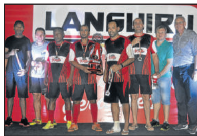
Viévi Automóveis, vice-campeão do Master