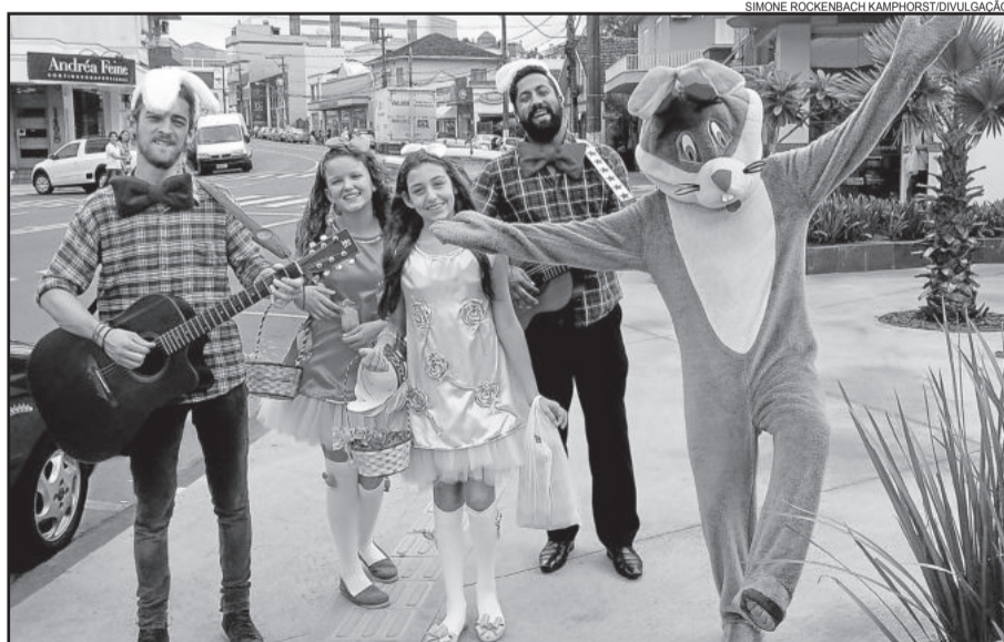
Trupes do Coelho já circularam sábado e voltam às ruas nesta quarta-feira

A CDL Lajeado convida a população para doar agasalhos e alimentos não perecíveis. Os itens podem ser levados até uma das lojas participantes da ação, que estão identificadas com cartazes. O montante será destinado a instituições beneficentes do Município. A iniciativa conta com o patrocínio de Florestal Alimentos.