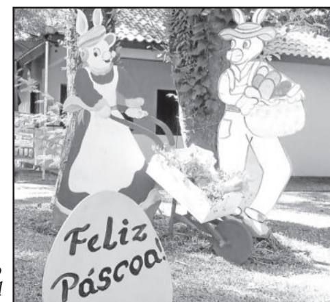
Ornamentação do Parque 13 de Abril