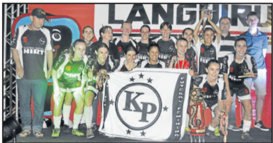
Kipoder, campeão do Feminino