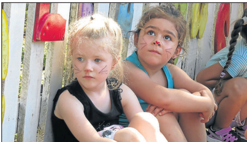
Pintura de coelhinho é feita no rosto das crianças