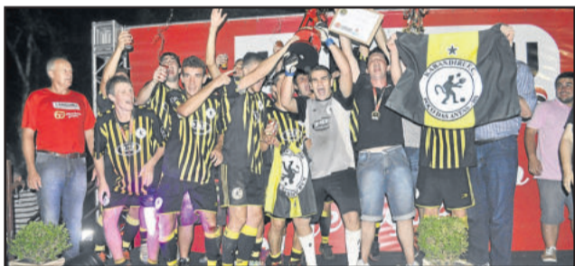
Karandiru FC, campeão do Sub-20