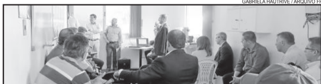
Encontro marcado para o dia 9 de março foi cancelado