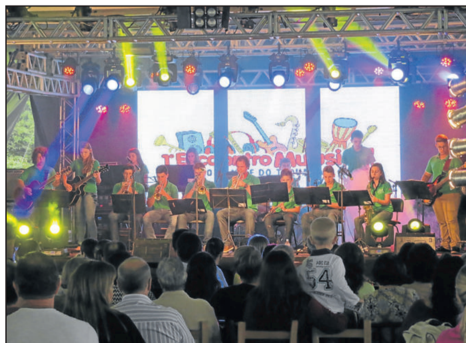
Orquestra Juvenil representou Teutônia no 1º Encontro Musical do Vale do Taquari