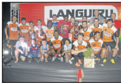
Força Jovem-Amigos do Nenê, vice-campeão do Veterano