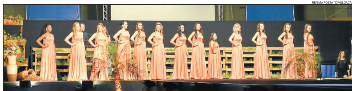
Concurso contou com a participação de 13 candidatas