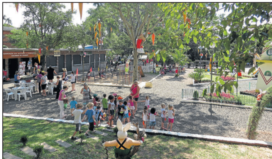
Praça dos Pássaros está toda decorada