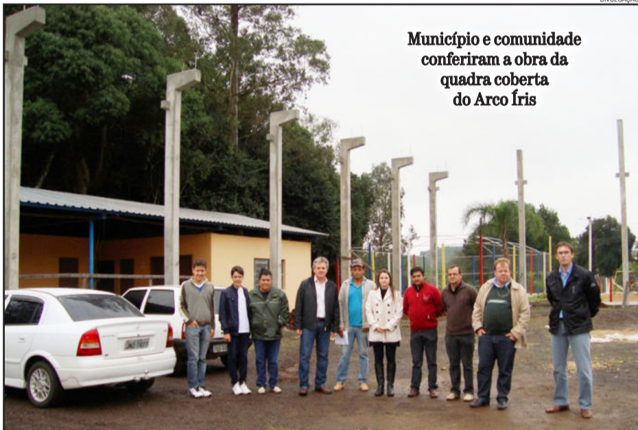
Município e comunidade conferiram a obra da quadra coberta do Arco Íris

A obra foi licitada ao valor total de R$ 206.728,96, dos quais R$ 146.250,00 são de recursos federais, liberados pelo Ministério do Esporte, através de emenda do deputado federal Mendes Ribeiro Filho (PMDB). O restante do valor, aproximadamente R$ 60,5 mil, será em forma contrapartida com recursos próprios da Prefeitura de Teutônia.