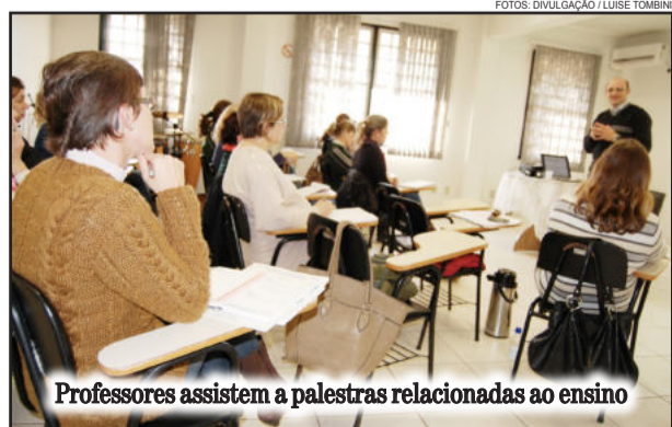
Professores assistem a palestras relacionadas ao ensino

A Secretaria Municipal de Educação, Cultura, Turismo e Desporto de Imigrante realiza, em parceria com o município de Westfália, oficinas de formação continuada. As atividades são voltadas para professores e gestores da rede municipal de ensino e coordenadas pelo Instituto Superior de Educação Ivoti - ISEI.