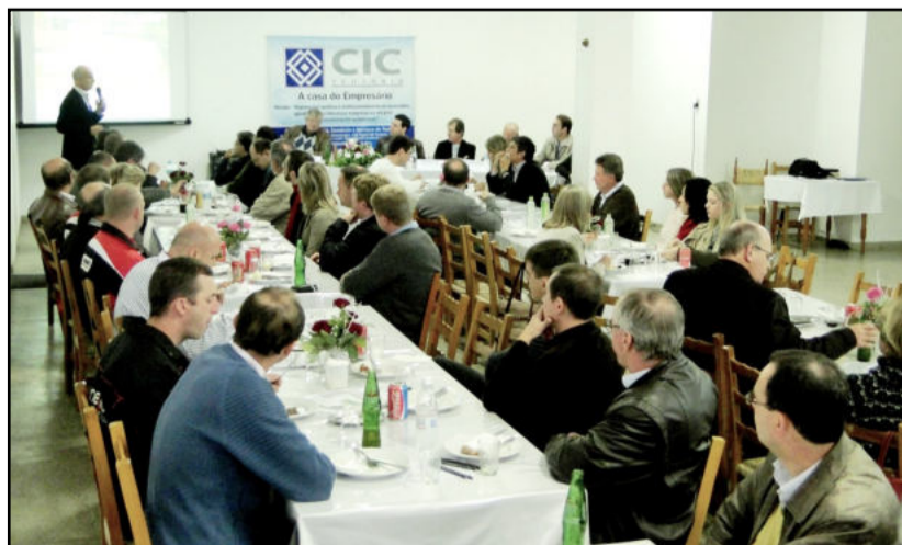
Evento reuniu cerca de 70 pessoas