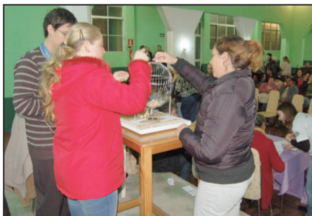
Sorteio foi conduzido pela Caixa e teve fiscalização de duas beneficiárias