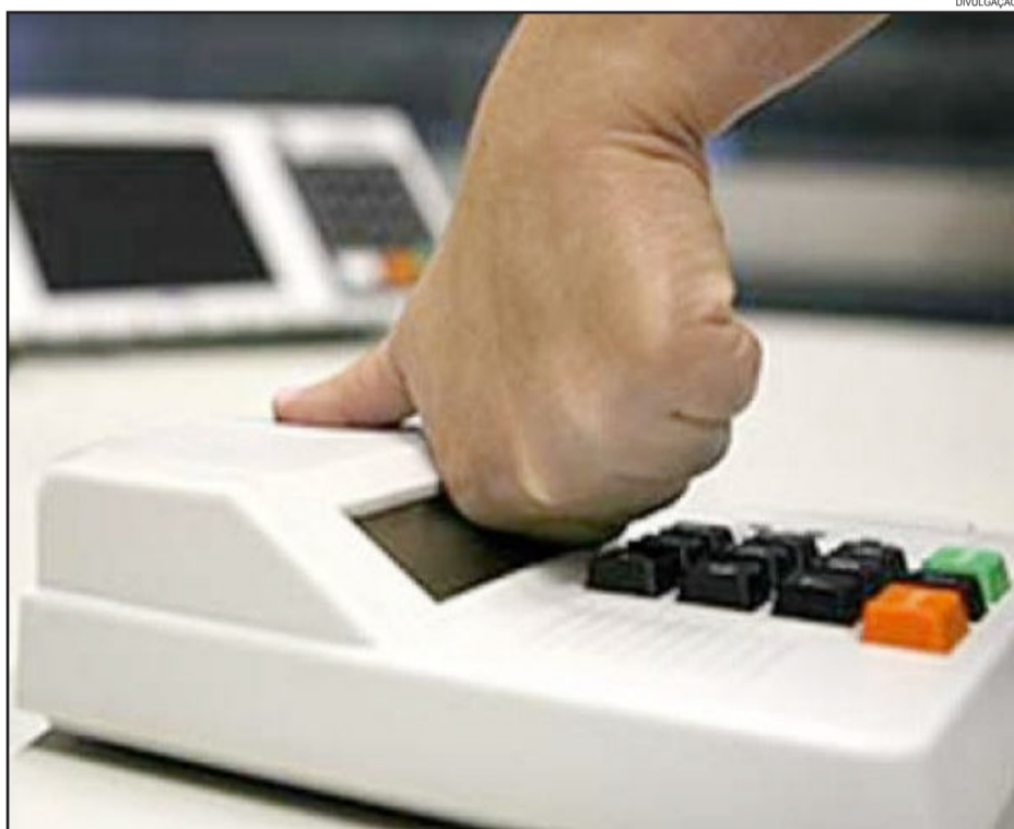
Cadastro biométrico visa trazer mais segurança no processo eleitoral

Por recomendação do Cartório Eleitoral, a prefeitura disponibilizará, inicialmente, transporte diário até Teutônia, para 50 eleitores, sendo 25 para às 12h e 25 às 14h. Maiores informações deverão ser obtidas na prefeitura, pelo telefone (51) 3773-1122, ou no Cartório Eleitoral, pelo telefone (51) 3762-2251.