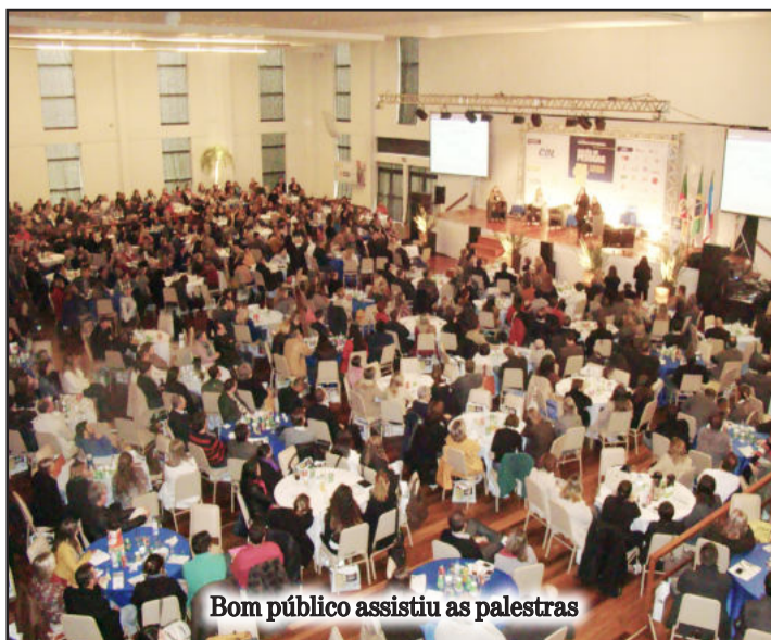
Bom público assistiu as palestras