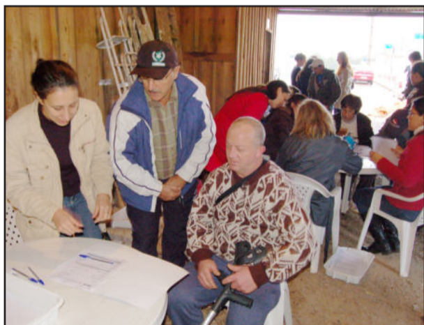
Beneficiários preencheram avaliação após a vistoria

cerá com equipe de pedreiro, encanador e electricista por 30 dias para que sejam providenciados eventuais reparos que fazem parte da garantia.