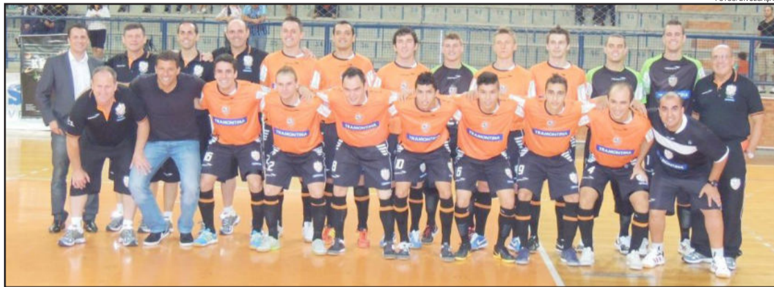
ACBF tem muitas caras novas na equipe

O formato da disputa é de jogos entre as equipes em casa um dos grupos. Os dois melhores de cada chave realizam a grande final. Serão ao todo quatro dias de