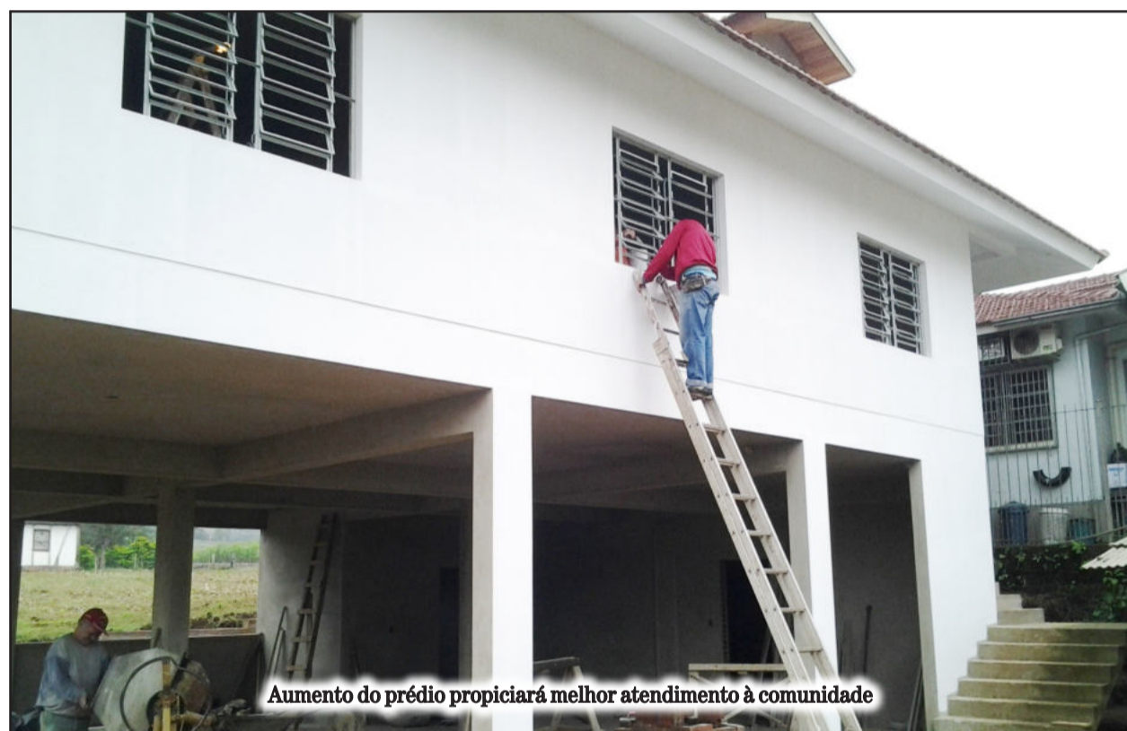
Aumento do prédio propiciará melhor atendimento à comunidade