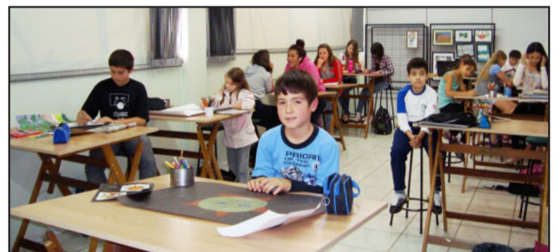
Alunos produzem verdadeiras obras de arte