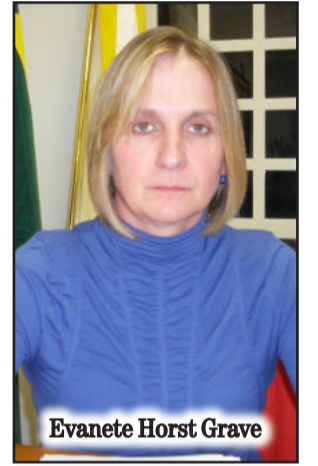
Evanete Horst Grave