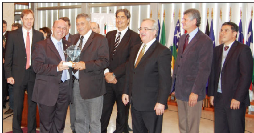
Imigrante recebe homenagem pelos seus 25 anos de emancipação