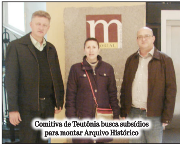
Comitiva de Teutônia busca subsídios para montar Arquivo Histórico