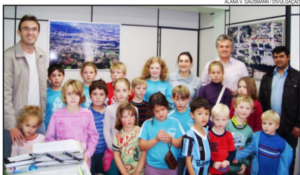
Visita de alunos da Escola Municipal Getúlio Vargas, de Linha Harmonia