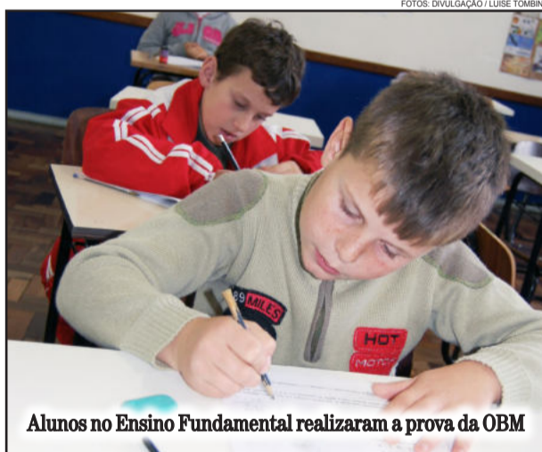
Alunos no Ensino Fundamental realizaram a prova da OBM

A OBM é uma competição aberta a todos os estudantes, a partir do 6º ano do Ensino Fundamental, de escolas públicas e privadas. Tem como objetivos interferir na melhoria do ensino da Matemática, descobrir jovens com talento matemático e selecionar estudantes para representar o Brasil nas Olimpíadas Internacionais de Matemática.