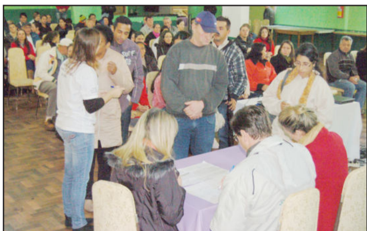
Comissão acompanhou a escolha das casas pelas famílias

A construção do Loteamento Morada do Sol é fruto de uma parceria pioneira no Vale do Taquari com investimento que chega próximo a R$ 7 milhões. A área, avaliada em cerca de R$ 1,160 milhão, foi doada pela Prefeitura de Teutônia para a execução da obra e tem um total de 64 lotes. Sobre cada lote serão construídas duas casas geminadas, totalizando 128 novas residências. O valor de aproximadamente R$ 5,760 milhões será financiado pela Caixa para a construção das casas, pavimentação das ruas e colocação das calçadas de passeio.