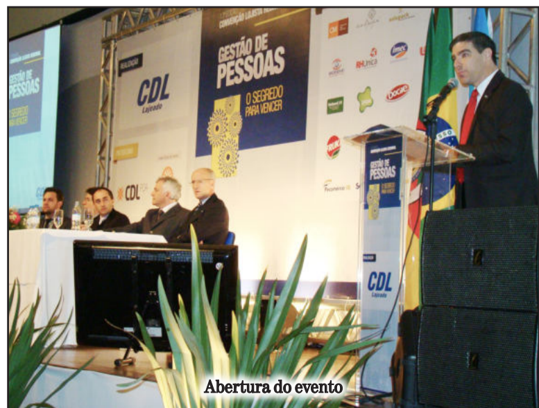
Abertura do evento