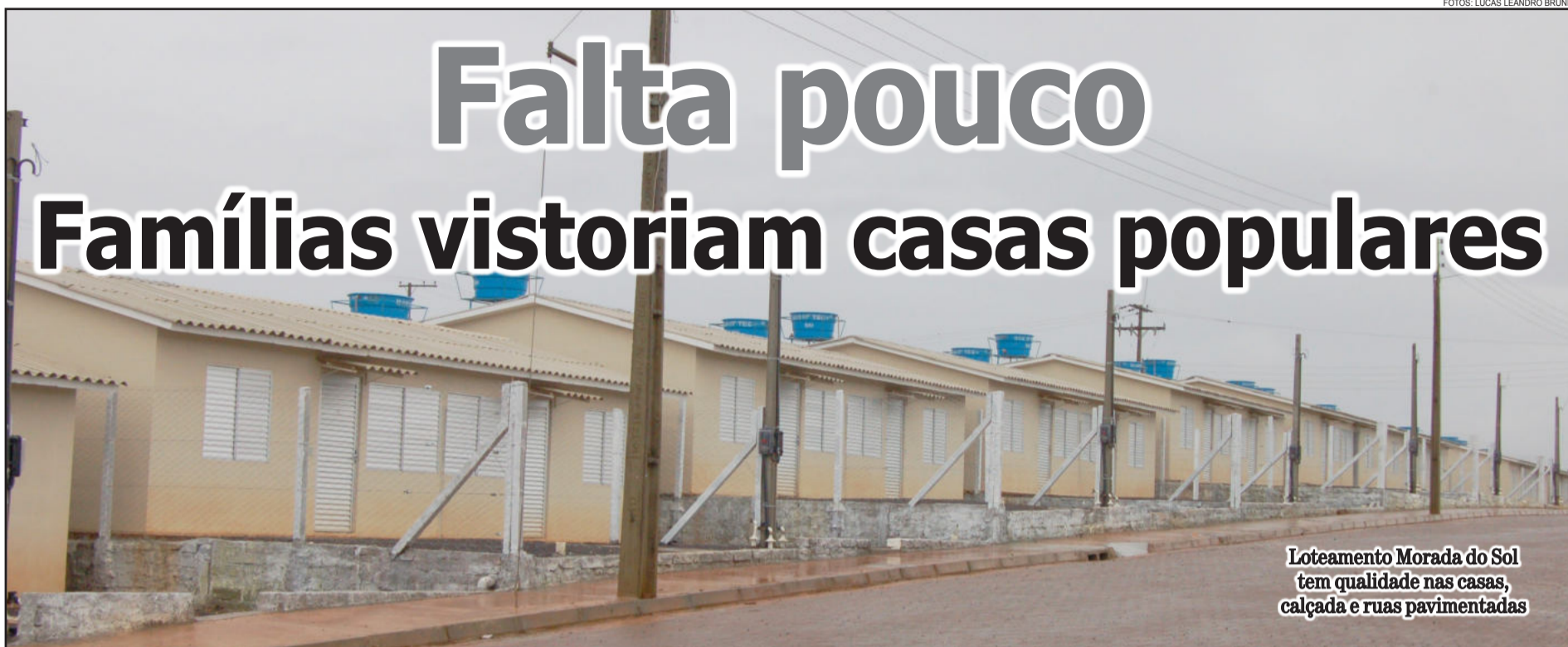
Loteamento Morada do Sol tem qualidade nas casas, calçada e ruas pavimentadas