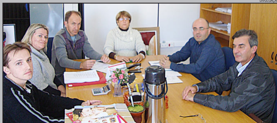
Município busca integrar setores de Compras e Almoxarifado