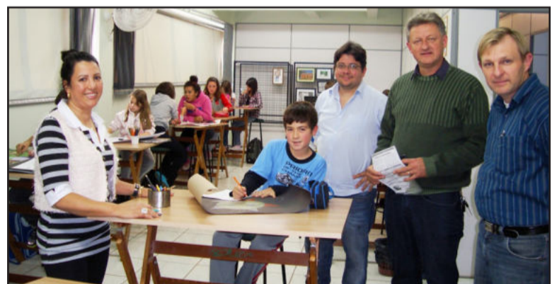
Alunos são estimulados a criar no desenho artístico