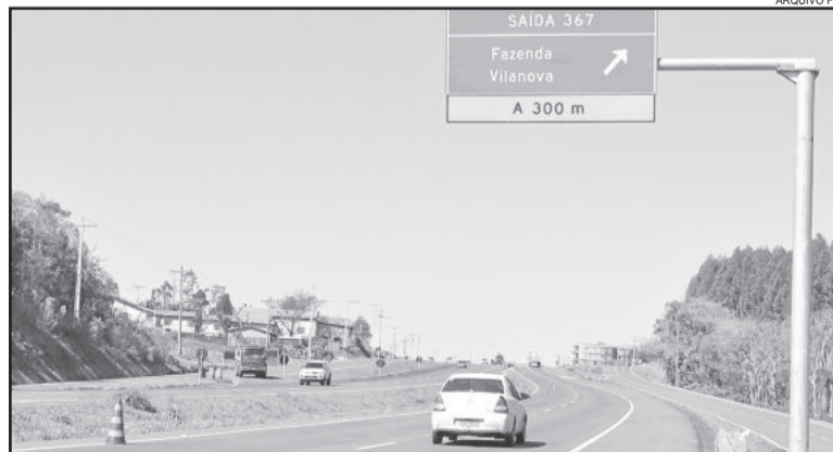
Faixa de domínio e área não edificante estão preocupando o Município, que busca soluções

As áreas não edificantes ou edificáveis são diferentes das faixas de domínio. Estas áreas funcionam como reservas. A maioria das rodovias, quando construídas, não tinha duplicação, por isso essas áreas foram reservadas para futuras ampliações. Como a BR-386 já está duplicada em Fazenda Vilanova, os defensores da legalização dos imóveis justificam que a área reservada não é mais necessária. “A nossa BR-386 foi duplicada. Existem as ruas laterais, tudo certinho. Não tem problema nenhum, não coloca em risco a vida dos usuários. Não vejo empecilho para ser regularizada aquela área. E se não quiserem regularizar, indeniza quem está lá em cima”, conclui o vereador.