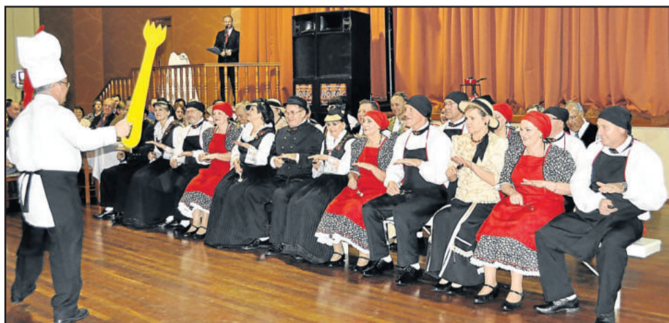
Teutotanzgruppe fez apresentações recordando os 25 anos de atividades do grupo e fazendo alusão ao tema gastronomia