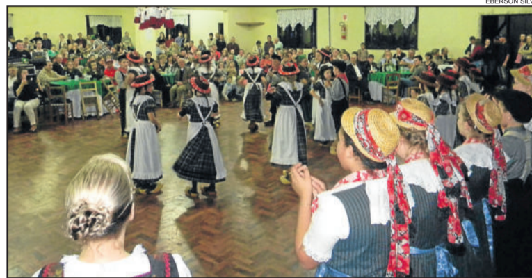
Westfälische Tanzgruppe se apresentou à comunidade, que lotou a Casa da OASE