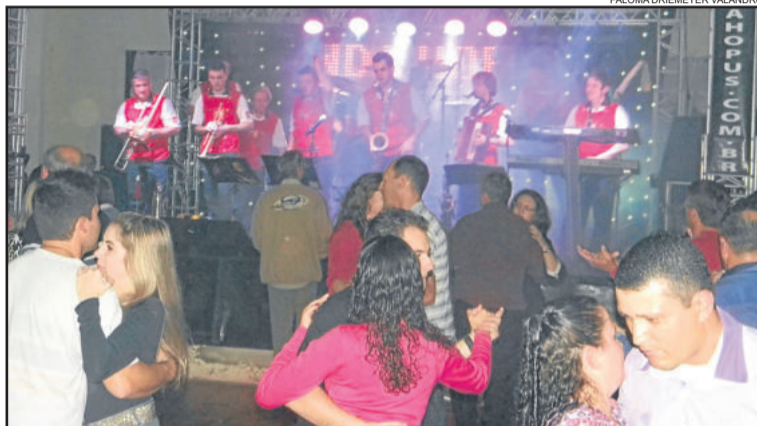
Banda Hoppus animou o baile

mesmo com chuva, vieram se divertir no nosso baile. Agradeço também aos setoristas, que não mediram esforços para que o evento fosse, mais uma vez, um verdadeiro sucesso", pontua.