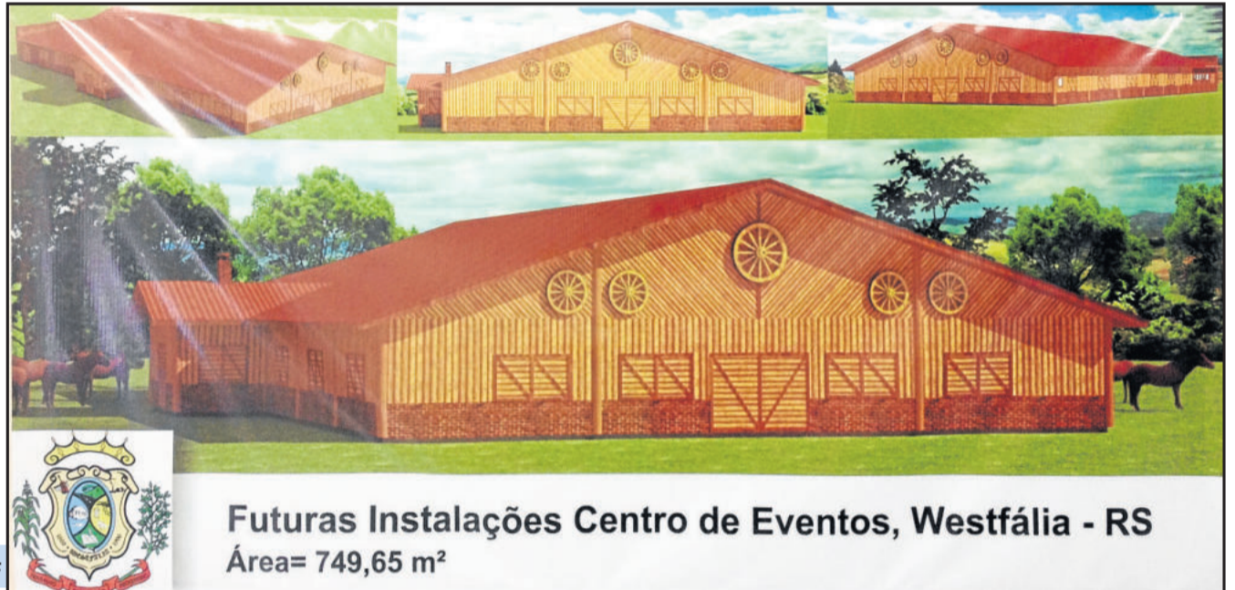
Futuras Instalações Centro de Eventos, Westfália - RS Área= 749,65 m 2