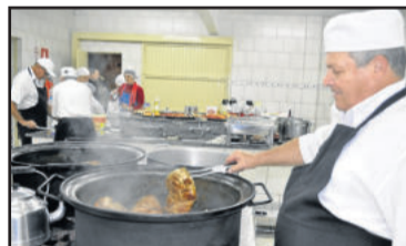
Na cozinha, bastante trabalho para preparar o Schweinebraten de panela e demais pratos

Há dois anos, a empresa CVC fez um levantamento do potencial turístico do Vale do Taquari para comercializar pacotes para interessados a virem à região. Além de indicar os atrativos, o levantamento também analisou a estrutura hoteleira e a culinária, casando com a ideia de elaborar o prato típico. "Podemos mostrar aos nossos turistas o que temos de melhor na culinária. O Schweinebraten é algo que vem nas nossas tradições e faz parte da nossa história, está presente no dia a dia desde a colonização", observou Landmeier.