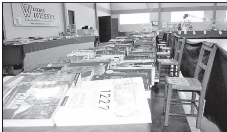
Livros foram comercializados pela Loja Wessel

apresentação que iniciou por volta das 10h30.