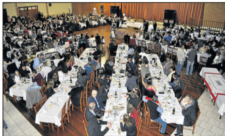
Centenas de pessoas acompanharam a programação

A ideia é dispor a receita para os restaurantes, além de difundir o Schweinebraten como prato típico de Teutônia. "Cada restaurante vai servir da sua forma, com os seus temperos, mas respeitando as diretrizes que a comissão está definindo. O Schweinebraten será um grande incremento no turismo de Teutônia", observou Magedanz.