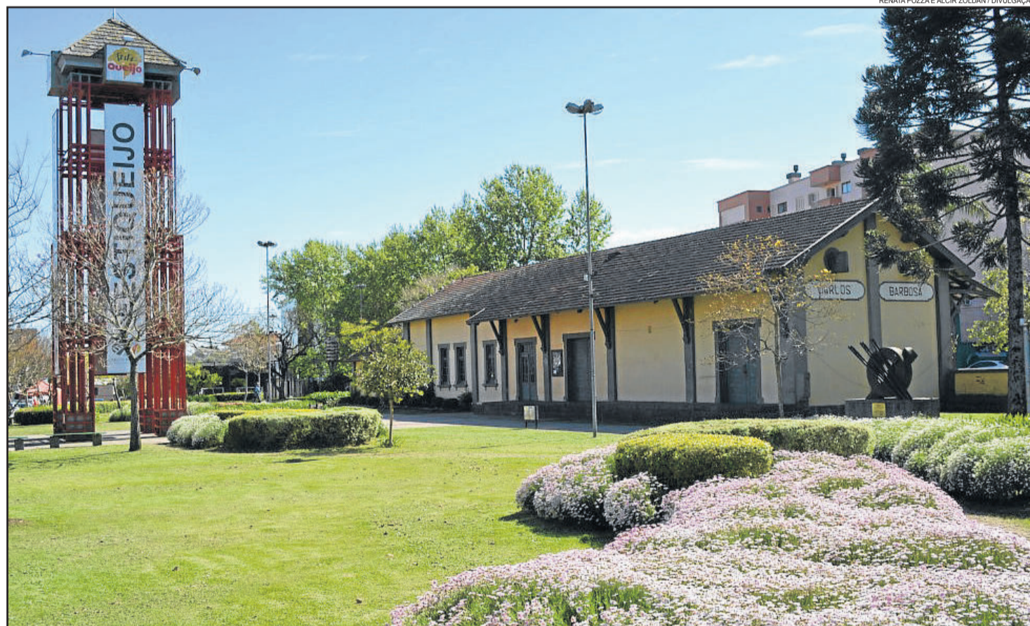
Parque da Estação fica situado no Centro da cidade