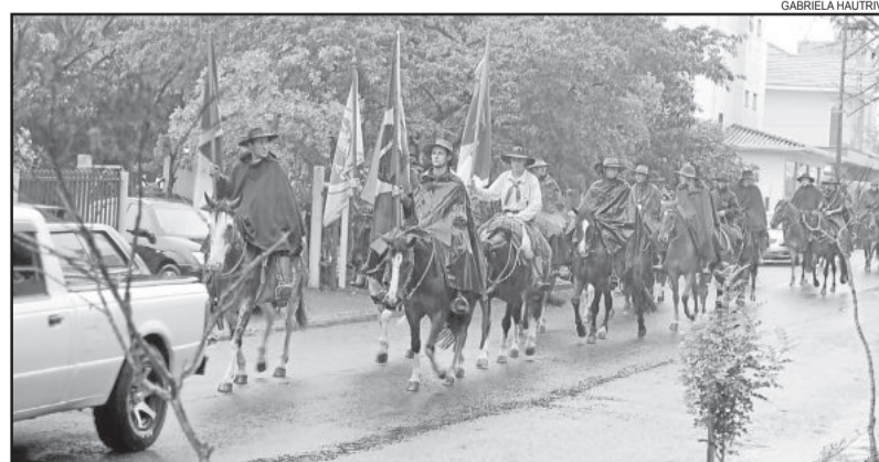
Cerca de 30 cavalários participaram do desfile do CTG Rincão das Coxilhas

Rua Pedro Schneider, por volta das 9h30min e depois seguiram em direção ao Bairro Canabarro e retornaram até o CTG, onde realizaram um churrasco em comemoração à data.