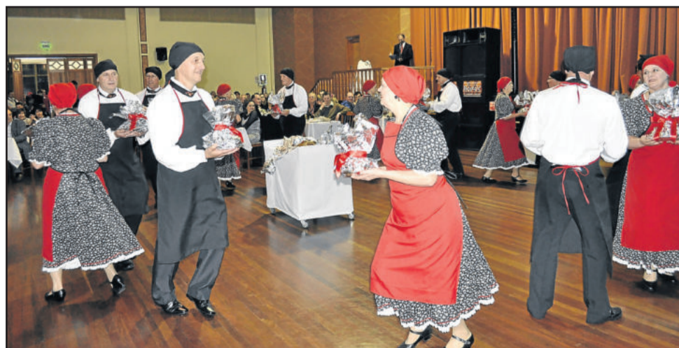
Lançamento também contou com apresentação do Teutotanzgruppe