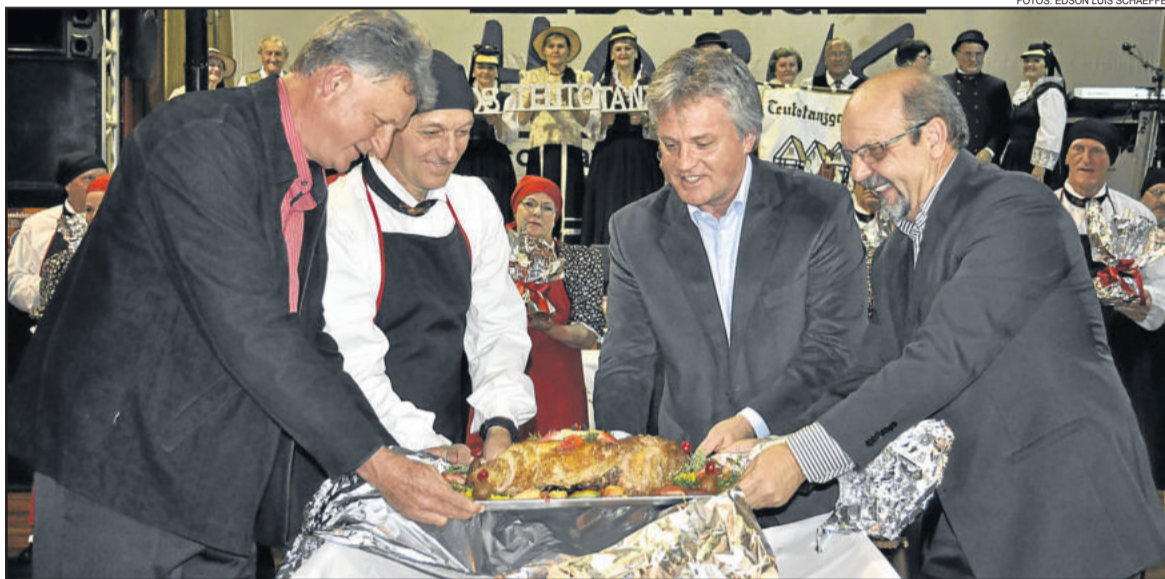
Schweinebraten foi lançado oficialmente como prato típico de Teutônia

A ideia de escolher o Schweinebraten como prato típico de Teutônia foi liderada por integrantes do grupo de danças, que fez uma pesquisa informal nas localidades de Teutônia, em que pessoas mais idosas eram questionadas