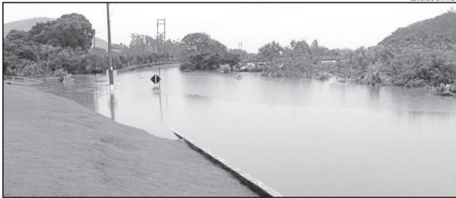
Em Colinas, Rio Taquari bloqueou acesso ao Município neste domingo

Junto ao Porto de Estrela, na leitura das 17 horas de ontem, foi registrado 20,71m. Como o pico foi de 22,10m à 0h45min desta madrugada, em mais de 16 horas após o ápice, o nível baixou 1,39 metro. O nível normal em Estrela é de 12,5 metros.