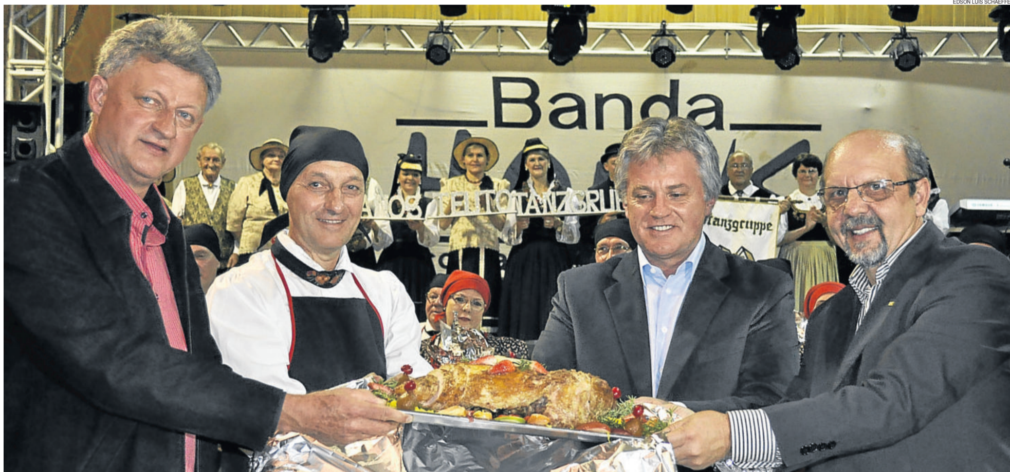
Lançamento ocorreu durante a festa dos 25 anos do Teutotanzgruppe, que este ano abordou o tema gastronomia alemã. TEUTÔNIA > 13

“TUDO VALE A PENA QUANDO SE QUER AMAR” TAQUARI > 12