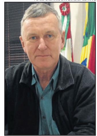
Landmeier enaltece Festa do Idoso