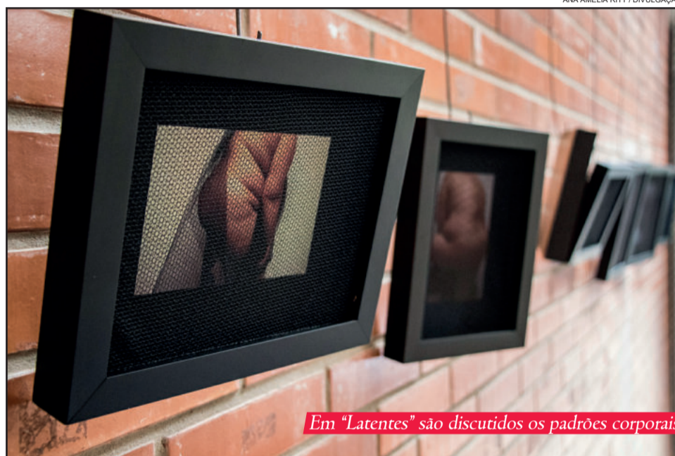
Em “Latentes” são discutidos os padrões corporais

“Era o fim de um ciclo, e me vi diante de uma pergunta: para onde lançar meu olhar agora? Minha rotina fotográfica já não poderia ser a mesma, minha casa não existia mais e o objeto do meu trabalho não fazia mais parte da minha vida. Foi quando me voltei para mim, me tornei meu próprio objeto de pesquisa na fotografia. Algo não tão fácil para quem sempre preferiu lançar suas lentes para o outro, para o que estava ao redor. Me fundi em dupla exposição, me