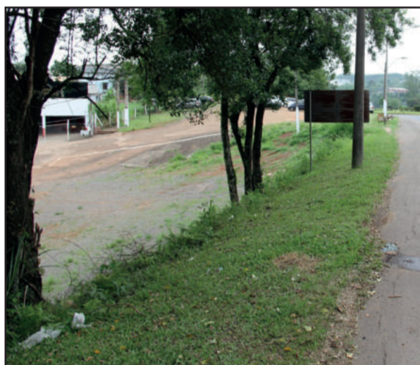
Desnível das laterais em relação à rodovia permite construção de passagem inferior a ERS 130 na divisa dos bairros Moinhos e Moinhos D'Água