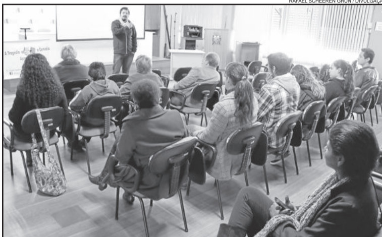
Cineasta Gilson Vargas explanou sobre o cinema no Estado, no País e no mundo

Segundo Vargas, o Brasil dormiu no ponto em algumas questões. Para exemplificar, citou que no início da década de 90, o Brasil não enviou representante governamental para congresso no qual, entre outras coisas, diversos países ganharam isenções para suas produções se valerem da tecnologia de som Dolby. “As produções nacionais tem que pagar muito para usar a tecnologia Dolby, quando o som parece vir de vários lugares, sendo muito superior às demais