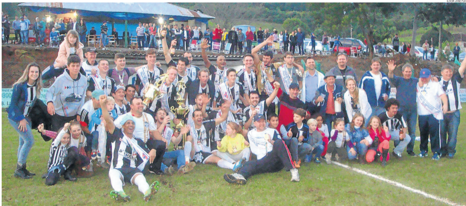
Aspirantes e Titulares festejaram o título na Linha Berlim, em Westfália, após vitórias diante do Juventude. TAÇA DA AMIZADE > 20 E 21 + PÔSTER > 12, 13 E 14

ESCRITOR REMY VALDUGA SERÁ PATRONO DA FEIRA DO LIVRO