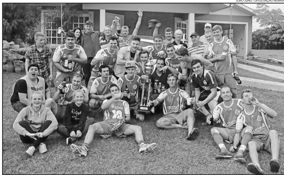
Juventude comemorou muito a primeira conquista do campeonato amador de Marques de Souza

De imediato, os jogadores que estavam no campo e o pessoal do banco correram em sua direção e lhe cercaram. Um dos jogadores