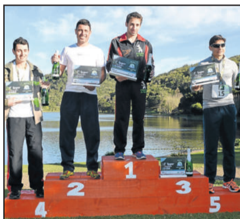
Vencedores nos 9 km masculino