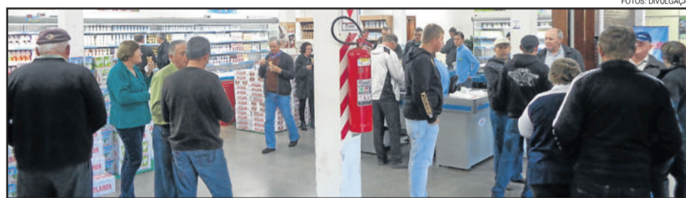
Grupo no varejo da Cooperativa La Holanda

A limpeza e os pátios ajardinados, além de amplas casas, chamam a atenção de quem visita a Colônia Sommerfeld. Outro destaque é a preocupação com a educação e o amparo dos seus membros, principalmente das crianças e dos idosos. Neste sentido, as crianças frequentam as aulas na própria colônia, onde os professores também são da comunidade. A colônia ainda conta com hospital, farmácia,