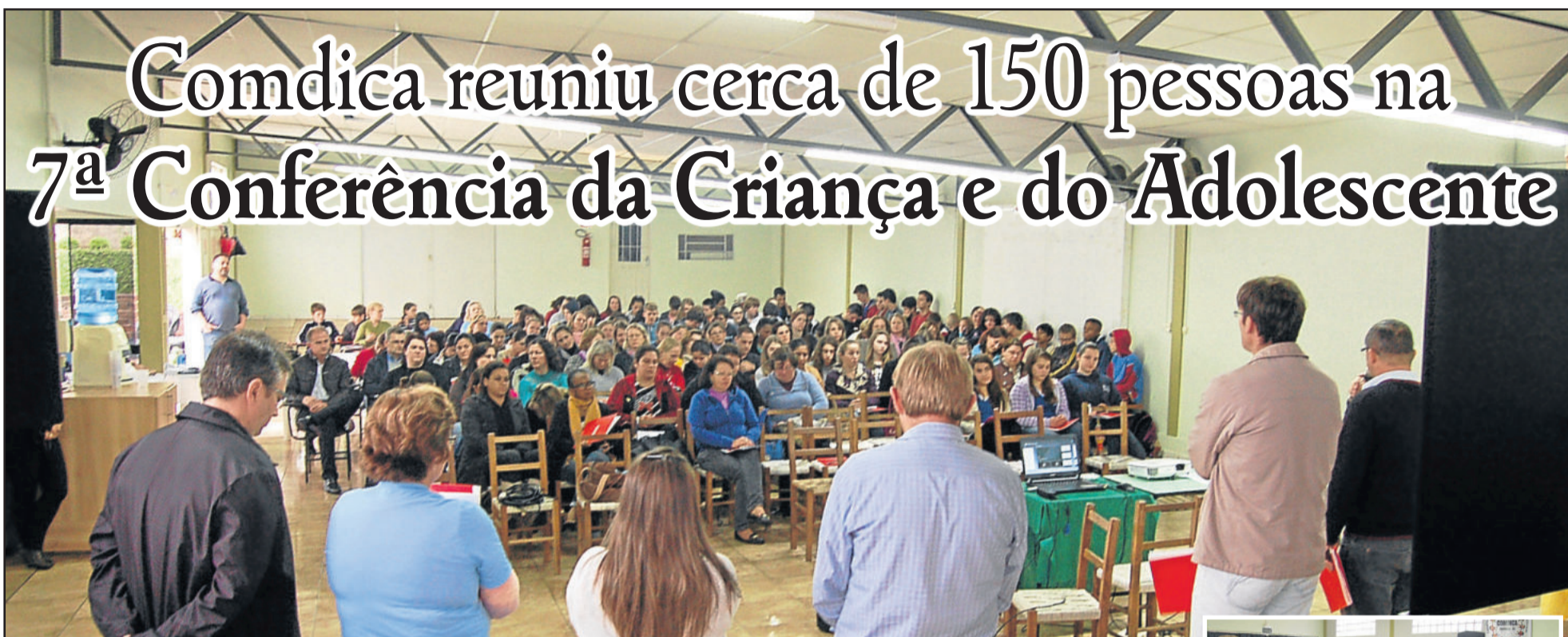
Excelente participação na conferência

E m torno de 150 pessoas compareceram, na tarde desta segunda-feira, dia 22, para participar da 7ª Conferência Municipal da Criança e do Adolescente, realizada no salão de festas do Sindicato dos Trabalhadores nas Indústrias Calçadistas de Teutônia (Siticalte), no Bairro Canabarro. O tema central será a “Política e Plano Decenal dos Direitos Humanos de Crianças e Adolescentes – Fortalecendo os Conselhos dos Direitos da Criança e do Adolescente”.