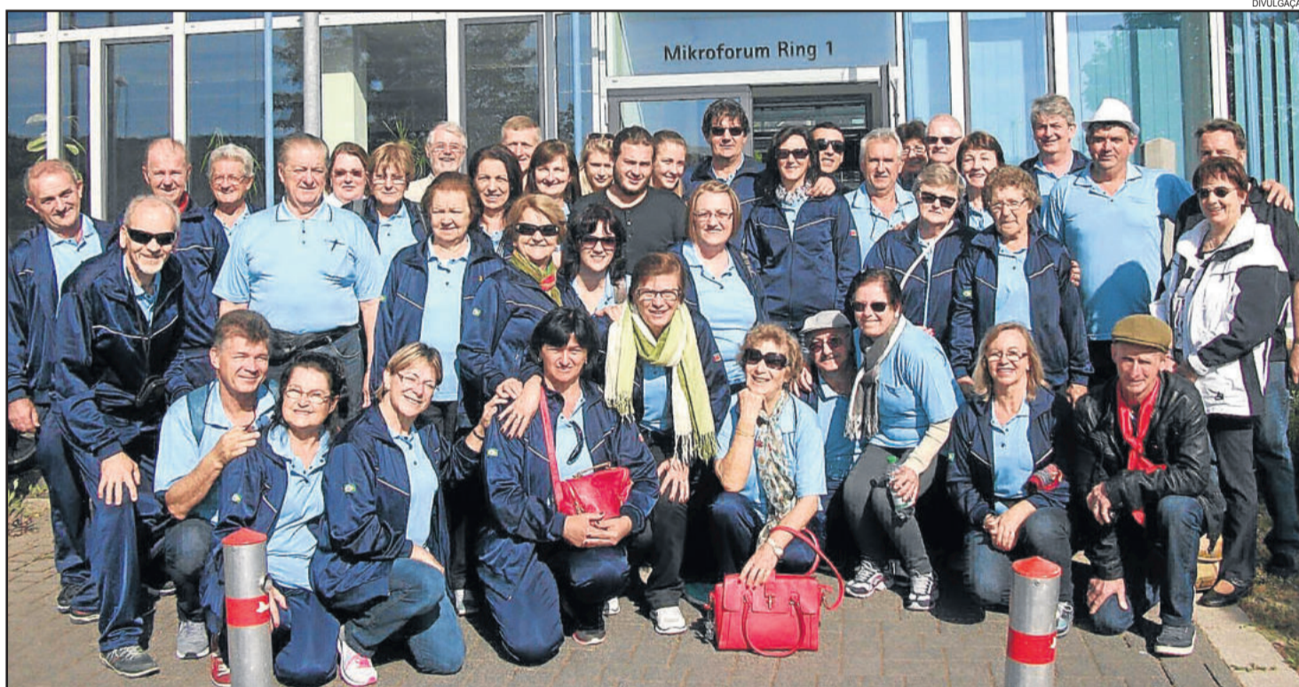
Depois de visitar os quatro cantos da Alemanha, o grupo voltou ao Brasil