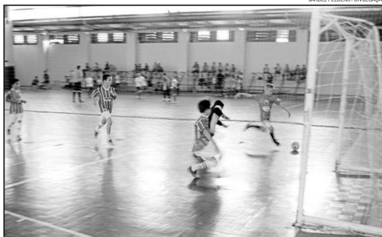
Equipes ainda lutam pela classificação para a segunda fase

O 27º Campeonato Piá de futsal é uma promoção do Governo de Lajeado, através da Secretaria da Juventude, Esporte e Lazer (Sejel) e reúne escolinhas de futsal, projetos sociais e organizações não governamentais (ONGs) de diversas cidades da região e estado.