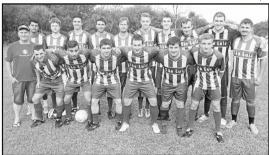
São Luiz é o campeão do futebol de campo

por 2x1. Na final São Jacó derrotou Linha Lenz por 2x0 e ficou com o título da modalidade.