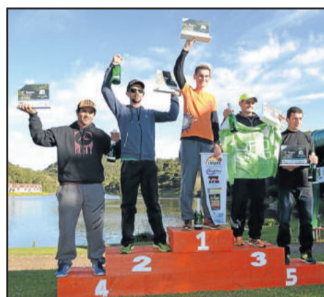
Vencedores nos 15 km masculino