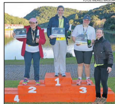
Vencedoras nos 15 km feminino