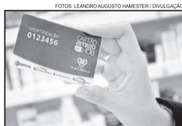
Cartão Amigo do HOB não possui custo nem mensalidade para o cliente

Já na Central de Convênios, em consultas com médicos especialistas, conforme agendamento e disponibilidade de horários, há valor diferenciado acer-