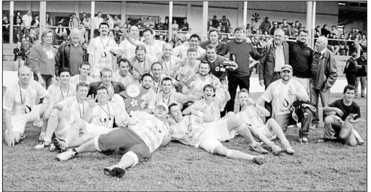
1º Lugar: CR Rui Barbosa