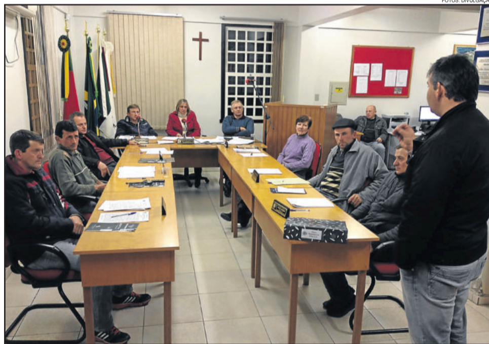
Sieben explicou planejamento de 10 anos.