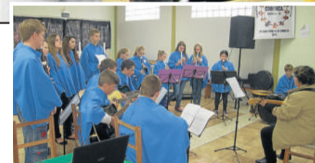
Show Musical Paz abriu o encontro

Após a leitura do Regimento Interno da con-