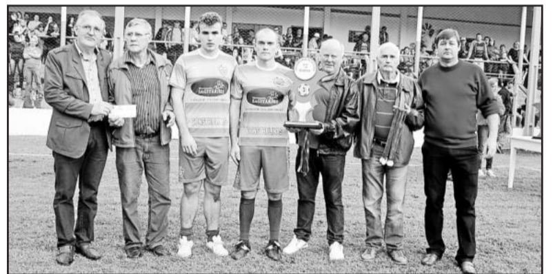
SER Juventude ficou em segundo lugar