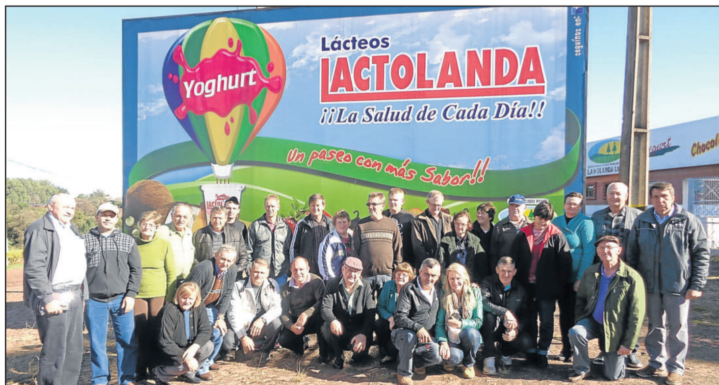
Amigos da Terra diante do painel dos produtos Lactolanda

Em 1987, a cooperativa iniciou um trabalho de erradicação da tuberculose e brucelose do rebanho leiteiro dos associados, sendo a primeira região da América Latina a ser declarada livre destas enfermidades.