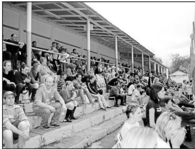
Bom público esteve presente na final