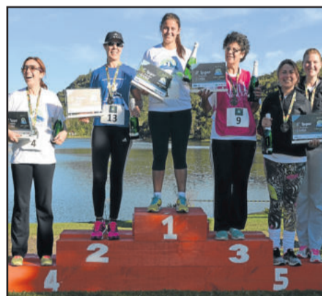
Vencedoras nos 9 km feminino