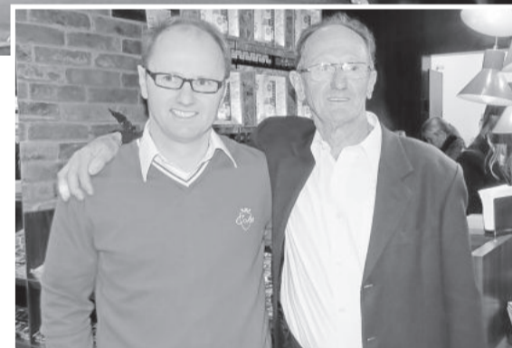
Pai e filho são sócios no empreendimento

Desde a manhã de sexta-feira, as bombas já foram abastecendo os veículos. Ao entardecer, os proprietários receberam os convidados e a comunidade que veio conhecer o novo espaço. O atendimento do posto será das 6 às 22h30min.