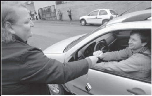
Adesivos foram distribuídos