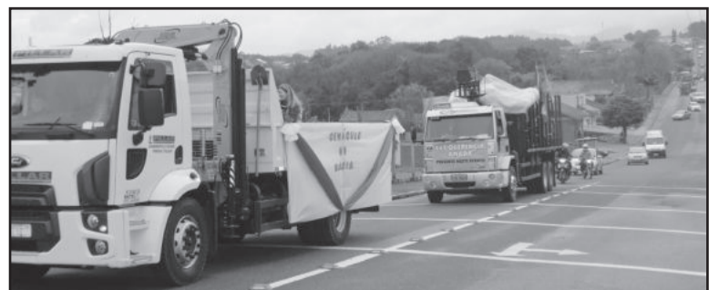
Os veículos buzonavam e faziam zigue-zague na via