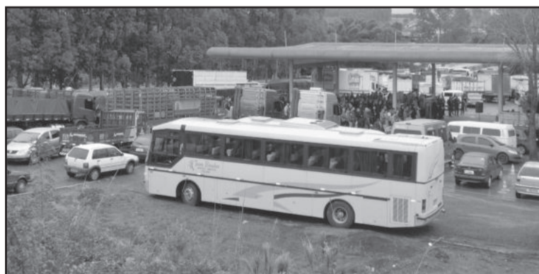
A localidade ficou cercada de carros, caminhões, ônibus e motos