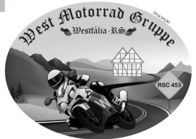
Logomarca criada pela empresa Nosso Micro

O grupo agradece aos amigos que estiveram presentes em mais este importante passo e parabeniza a todos os motociclistas pela passagem do Dia do Motociclista comemorado sábado dia 27 de julho. Motociclismo, hobby que proporciona conhecer lugares novos e conquistar amigos, torna-se divertido quando praticado de forma ordeira e consciente.