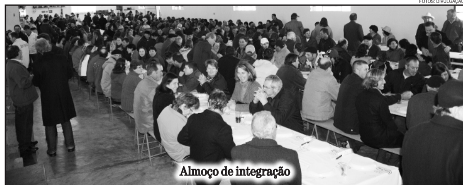
Almoço de integração

Os ingressos para o almoço serão comercializados ao valor de R$23 adulto e R$12 infantil. Informações na secretaria pelo telefone (54)3462.8222.