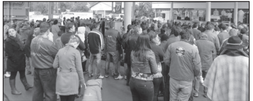
O frio não espantou os fiéis

Ao meio-dia teve almoço no saguão. A tarde a festa ficou por conta da Banda Brilhante, que animou ainda mais a tarde. A Festa do Colono e Motorista é tradição e para o próximo ano já está prevista uma festa ainda maior, já que também será comemorado o 30º ano da Paróquia Nossa Senhora do Rosário.