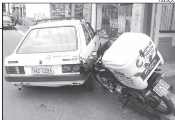
Motorista perdeu o controle de seu veículo e bateu em moto parada

O segundo acidente aconteceu às 10 horas. Um Santana, placas IAW-6338, de Mato Leitão, seguia pela Rua 3 de Outubro. Ao ingressar na Rua Guilherme Brust, o condutor perdeu o controle de seu automóvel e bateu em um veículo Peugeot, placas IPL-2742, de Teutônia, que estava estacionado. O acidente aconteceu nas proximidades da Turis Wolf. Neste caso, também foram registrados somente danos materiais.