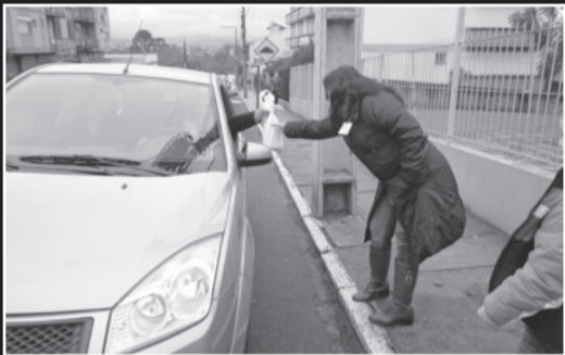
Adesivos foram entregues