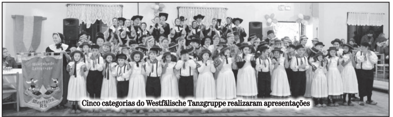
Cinco categorias do Westfälische Tanzgruppe realizaram apresentações