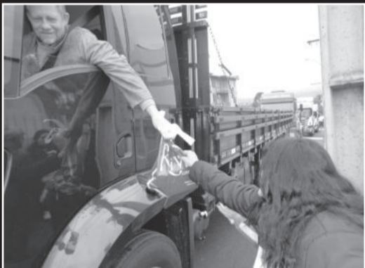
Donativos foram arrecadados