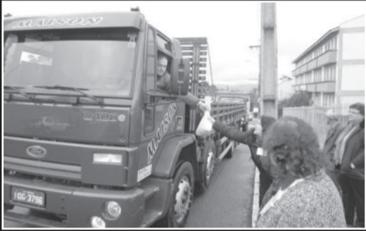
Donativos foram arrecadados