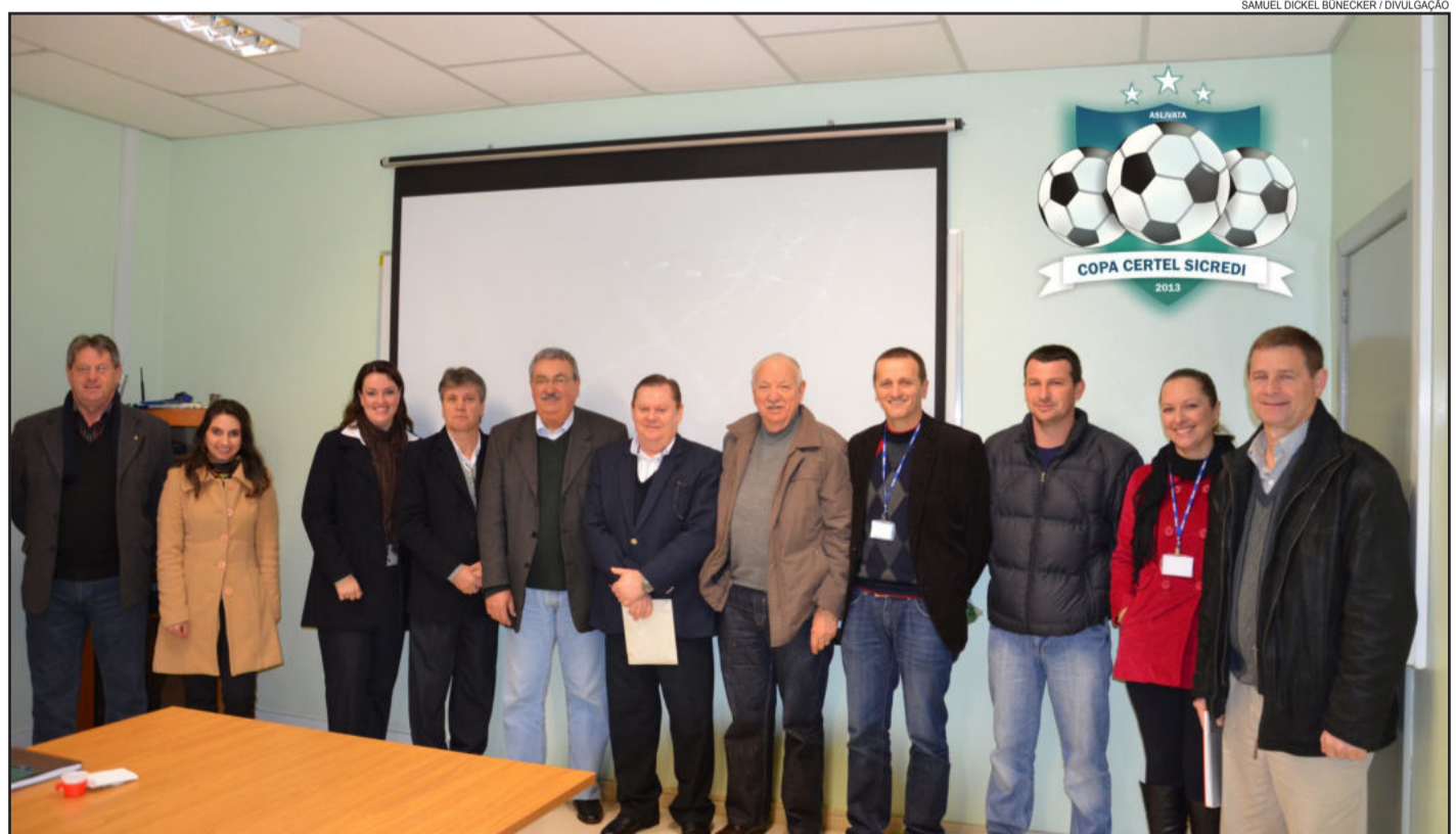
Representantes da Aslivata, Certel e Sicredi firmaram parceria

Um total de 42 clubes de 21 municípios participará do campeonato, que integrará em torno de 100 mil pessoas. Teutônia terá o maior número de representantes, com 12 clubes participantes. Arroio do Meio, Cruzeiro do Sul e Lajeado vêm, cada um, com 3 clubes. Imigrante, Poço das Antas, Westfália e Taquari estarão com 2 equipes cada.