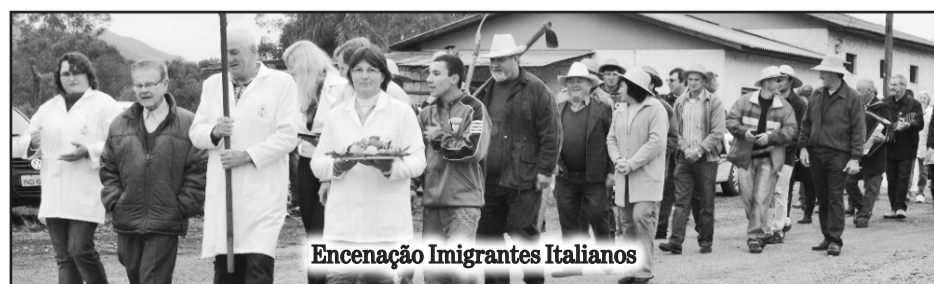
Encenação Imigrantes Italianos