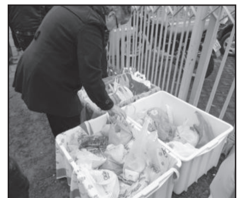
Muitos donativos foram arrecadados