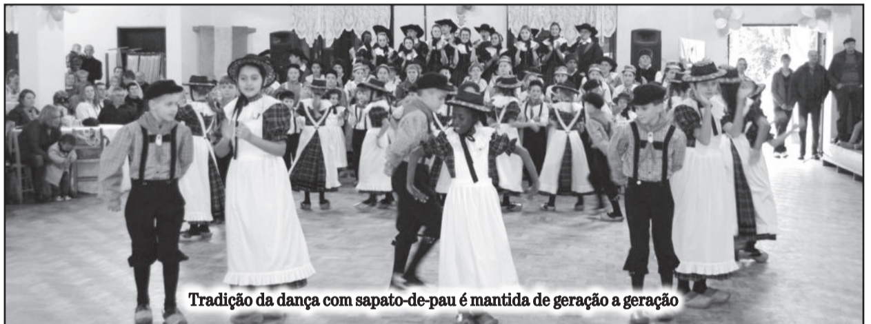
Tradição da dança com sapato-de-pau é mantida de geração a geração