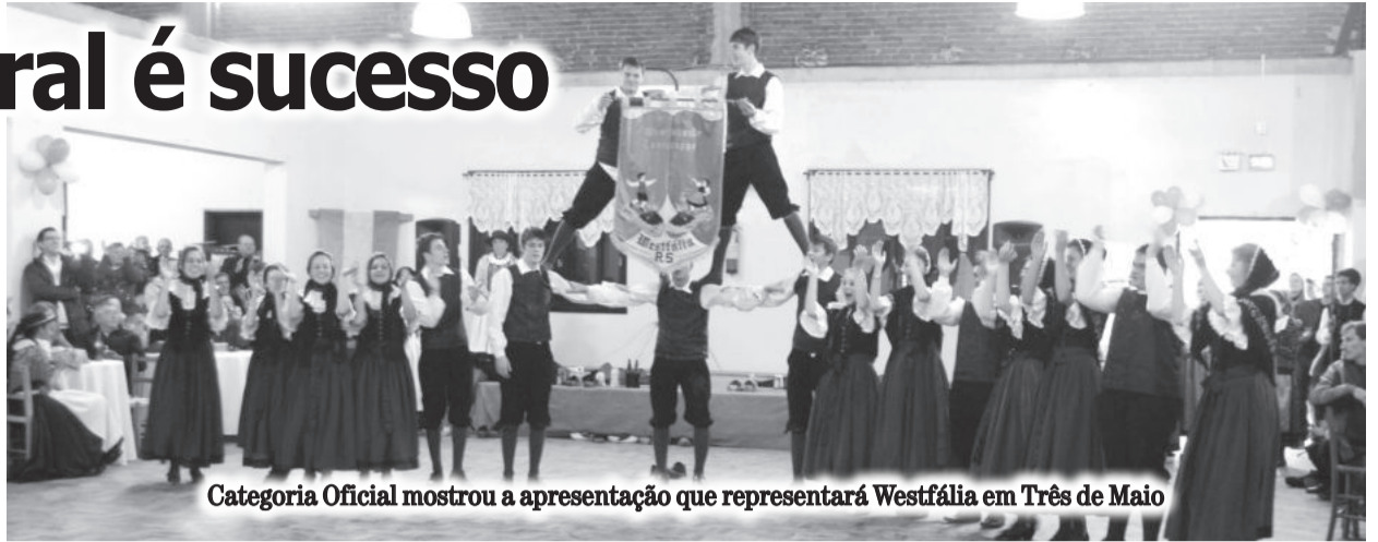
Categoria Oficial mostrou a apresentação que representará Westfália em Três de Maio