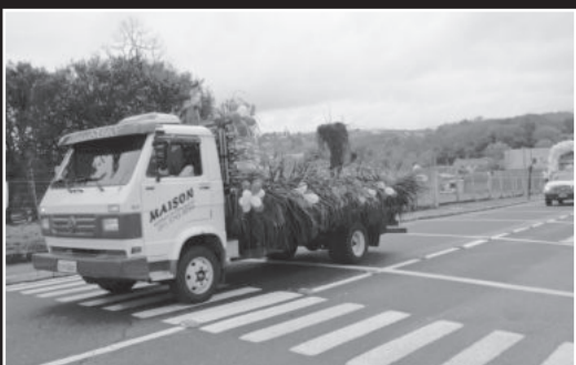
São Cristovão conduziu a carreta