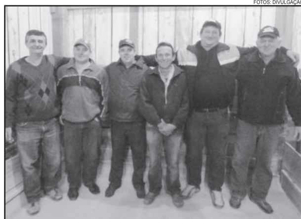
Morro Azul - Campeão do Municipal de Bocha de Paverama