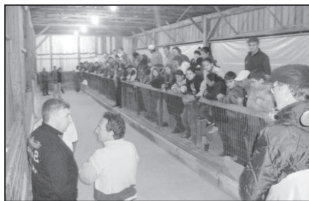
Grande público prestigiou, mesmo com a noite fria