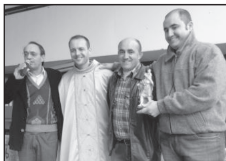
Lojas Vargas arrematou São Cristovão