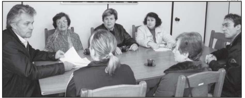
Diretoria do Clube de Mães Lar da Amizade recebeu os recursos da Administração Municipal