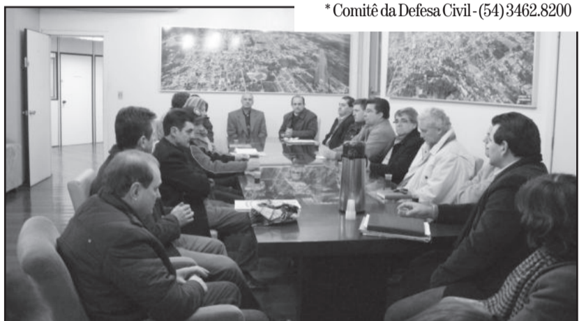
Defesa Civil se reuniu na tarde de sexta-feira, 19 de julho

Telefones úteis * Casos mais graves: Hospital (54) 3464.9700 (24 horas) * Posto de Atendimento Médico (PAM) - (54) 3462.8142 (24 horas) * Bombeiros 193 * SAMU 192 * Comitê da Defesa Civil - (54) 3462.8200