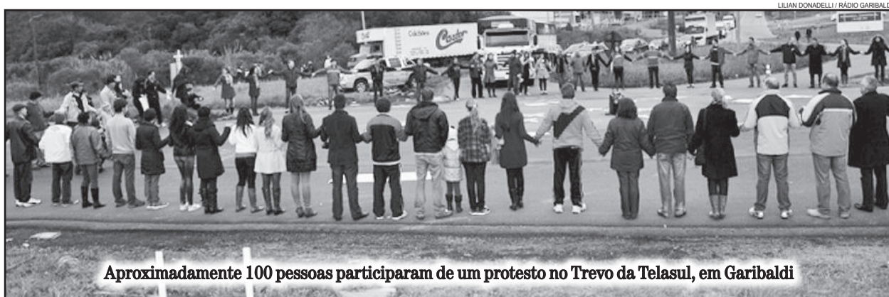
Aproximadamente 100 pessoas participaram de um protesto no Trevo da Telasul, em Garibaldi

Nos primeiros seis meses do ano a Polícia Rodoviária Estadual atendeu a 15 acidentes no Trevo da Telasul, com 37 veículos envolvidos, o que resultou em três mortes e 11 feridos.