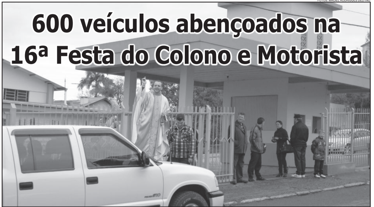
Padre abençoou os veículos em frente ao Pavilhão da Comunidade

Neste domingo, dia 21 de julho, a Paróquia Nossa Senhora do Rosário, do Bairro Canabarro - Teutônia, realizou a 16ª Festa do Colono e Motorista. A missa campal aconteceu no Posto Canteiros, situado no trevo de acesso ao bairro, próximo à Vila Arco Íris. O frio e o céu nublado não espantaram os fiéis, que participaram da missa entre as bombas de combustíveis do posto; ao redor, ônibus, caminhões e carros lotaram os espaços, inclusive nas ruas do entorno.