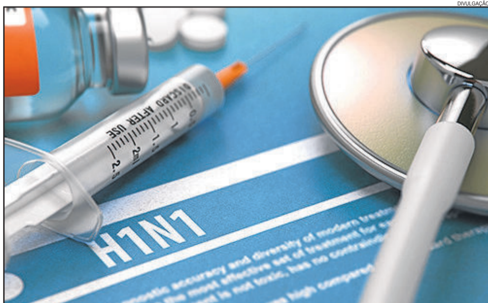
Uma das prevenções para a gripe é tomar a vacina

Especialistas dizem que os sintomas da gripe H1N1 são muito semelhantes aos da gripe comum, mas surgem de repente e com mais intensidade, febre, dor e dificuldade para respirar. A gripe é transmitida pelo contato com pessoas doentes. Em caso de suspeita, a recomendação é ir ao médico para saber como tratar e evitar transmissão da doença.