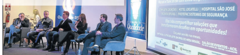
Cinco empresários compartilharam suas caminhadas na gestão da qualidade e inovação em seus negócios

Na quarta-feira, dia 20, ocorreu o 1º Encontro de Cases Vale do Taquari no salão da Acil em Lajeado. Na ocasião, foi realizado painel e talk show