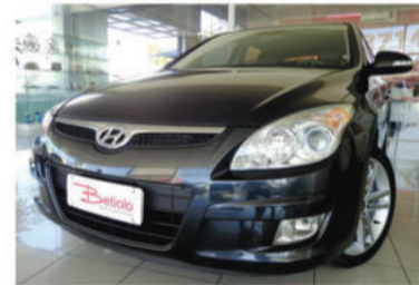
I30 2.0 MPI 16V - 2010 Preto, 4 portas, Automático, Gasolina - IYY-0119.