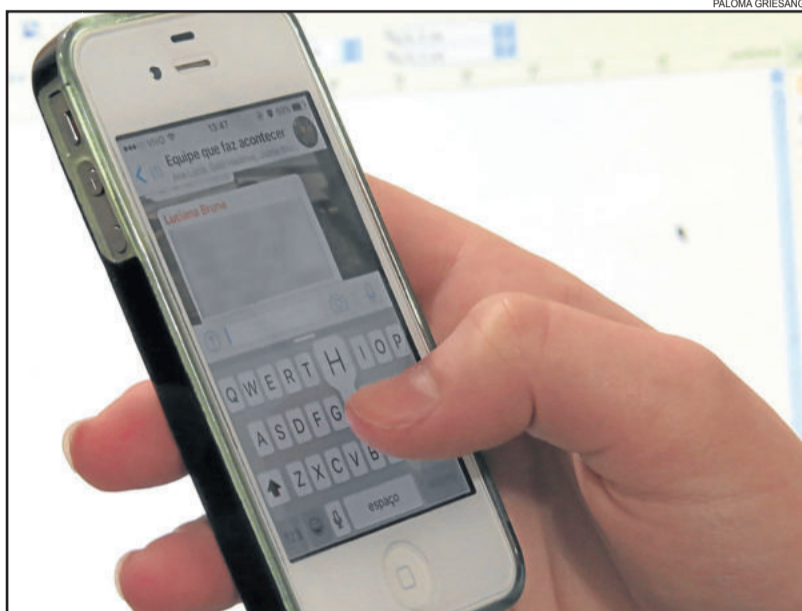
Intimações poderão ser enviadas através do aplicativo WhatsApp

Iniciativa será testada em Juizado Especial Cível em Porto Alegre