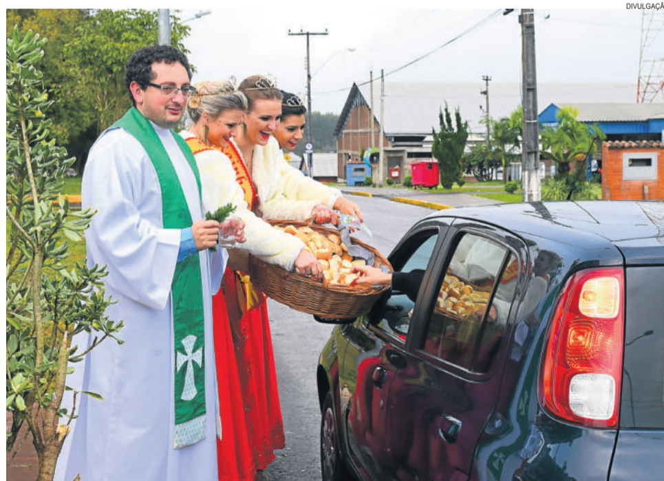
No Bairro Canabarro, em Teutônia, bênção aos motoristas é tradicional