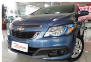
ONIX LT 1.4 MPFI 8V - 2014 Azul, 4 portas, Flex - IVI-8934.