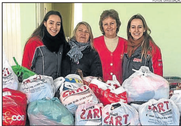
Colaboradoras fizeram a entrega das doações na segunda-feira passada