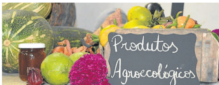
Produção agroecológica resgata os primórdios da colonização

A agroecologia vai além da produção de alimentos orgânicos. É uma filosofia de vida que preza pelo cuidado com a natureza, ao passo em que não polui o solo, as águas e as plantas e, também, preserva espécies nativas essenciais para o ecossistema. “É uma concepção ideológica que contrapõe o modelo capitalista do agronegócio, tornando a agroecologia mais plena”, destaca a monitora de saúde comunitária.