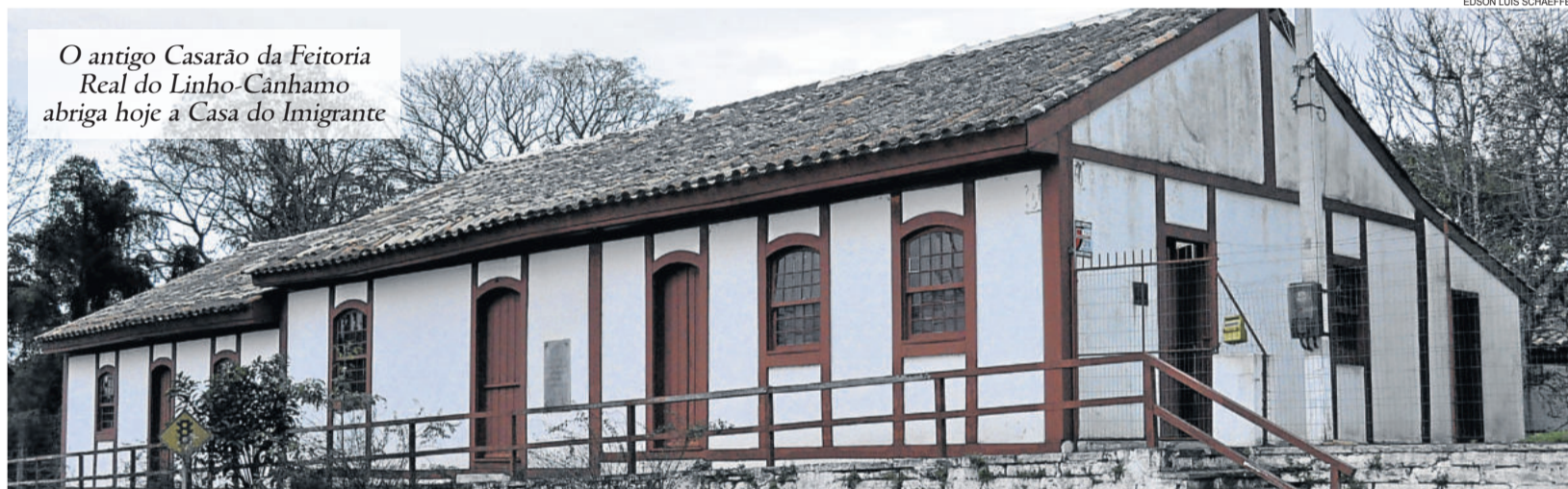
O antigo Casarão da Feitoria Real do Linho-Cânhamo abriga hoje a Casa do Imigrante

Em 12 de abril, a Lei Provincial nº 563 eleva a Vila de São Leopoldo à categoria de cidade, sendo que no final daquele ano, São Leopoldo contava com mais 14 mil habitantes. Convém ressaltar que, entre 1835 e 1845 a imigração foi interrompida em razão da Revolução Farroupilha. Após 1845, a imigração ocorreu em menor intensidade.