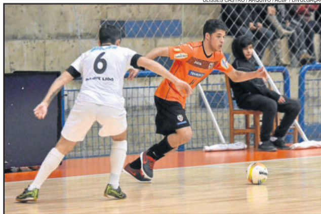
A equipe Sub-20 da ACBF, do ala Andrew, estreia contra o Minas na Taça Brasil