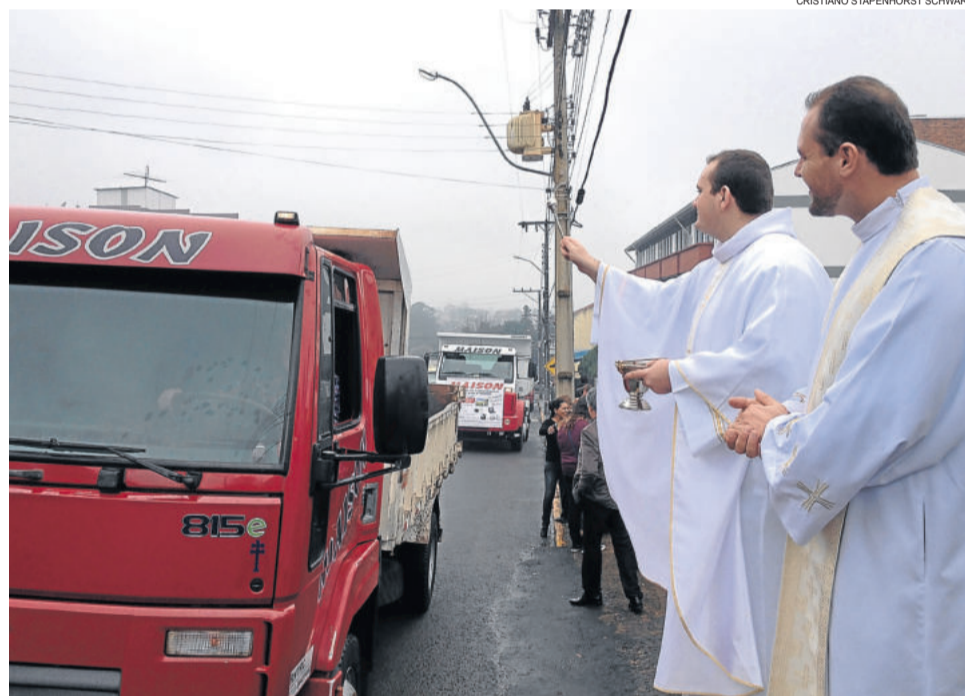
Festa já é tradicional há 21 anos em Fazenda Vilanova

Outras atividades e serviços estão programadas para todo o dia.