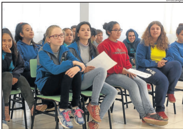
Festival de Paródias já está mobilizando alunos

A 8ª Feira Municipal do Conhecimento de Westfália, entre os dias 31 de agosto e 2 de setembro na Casa da Oase, terá, além do Festival de Paródias, outras atrações, tais como: Concurso de Oratória, mostra fotográfica, Feira do Livro, apresentações, exposição de trabalhos, peça teatral e encontro com autores.