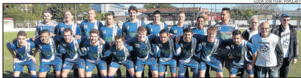
União Campestre tem duelo importante em casa contra o Ribeirense