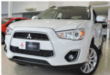
ASX 4X4 AWD 2.0 16V - 2014 Branco, 4 portas, Automático, Gasolina - OBO-3666.