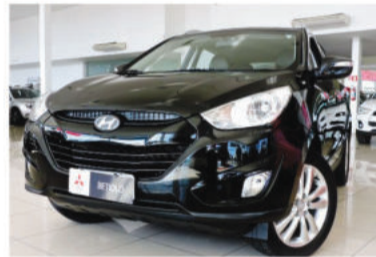
IX35 4X2 2.0 MPI 16V - 2012 Prata, 4 portas, Flex - IXZ-2606.