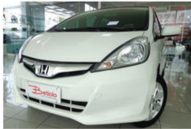
FIT LX 1.4 16V - 2013 Branco, 4 portas, Automático, Flex - ITC-4976.