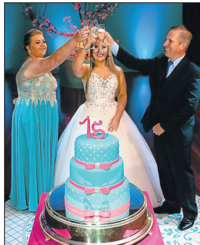
O brinde em família