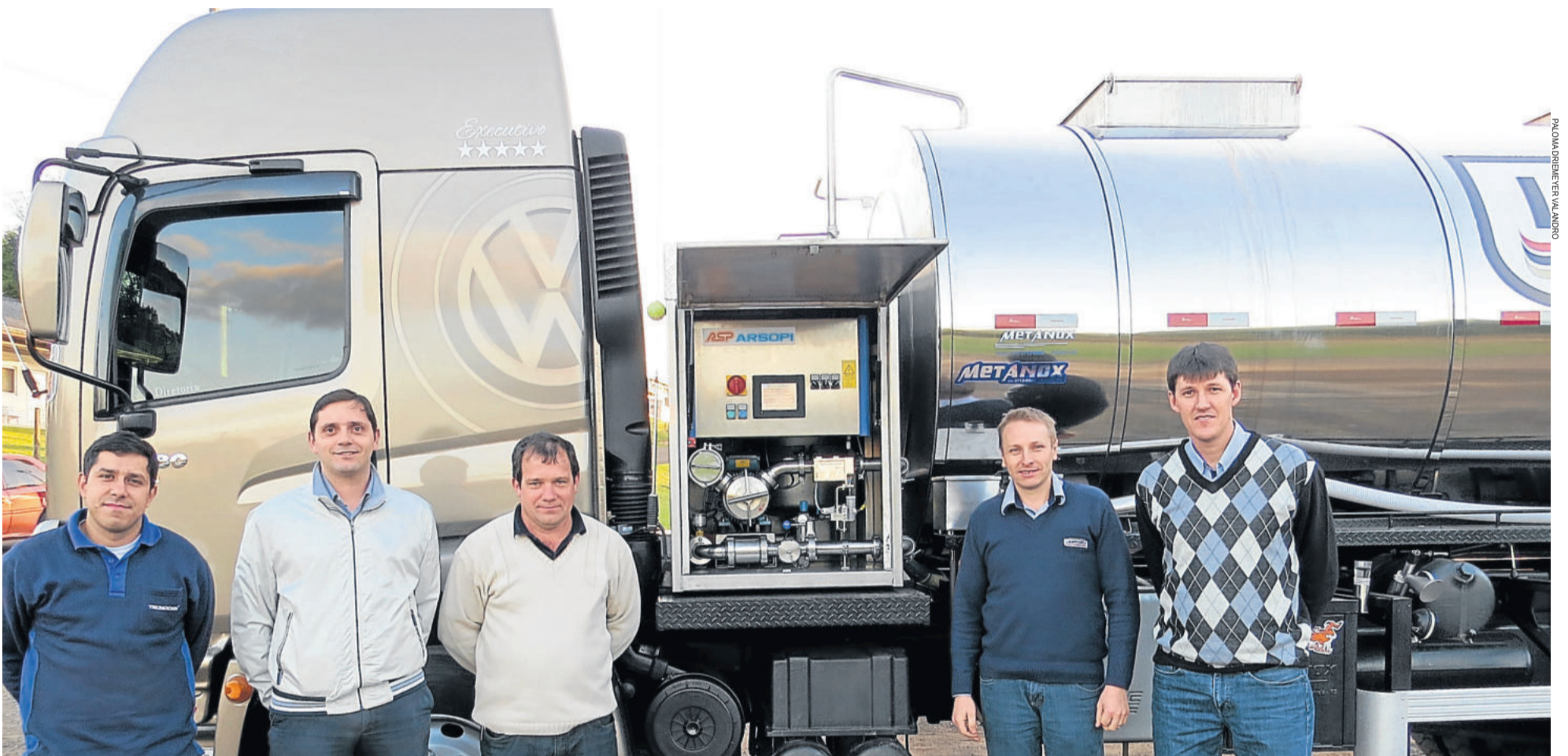
Equipamento de tecnologia portuguesa deve facilitar o trabalho dos transportadores. Na foto, representantes da Arsopi (e), Wiebusch (c) e colaboradores da Languiru. TEUTÔNIA > PÁGINA 2