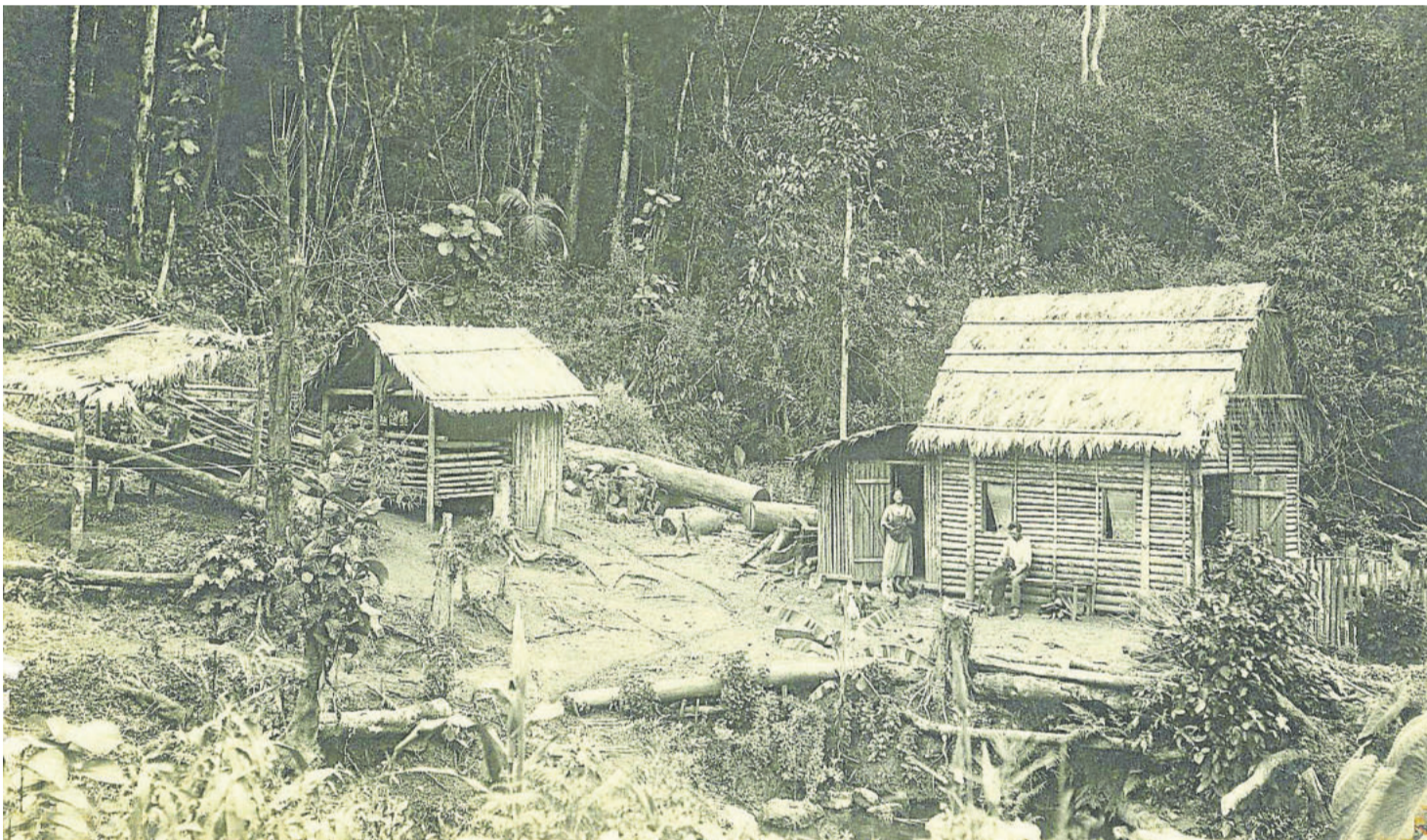
Os imigrantes aos poucos foram recebendo seus lotes de terras e foram vencendo as dificuldades (foto não datada)