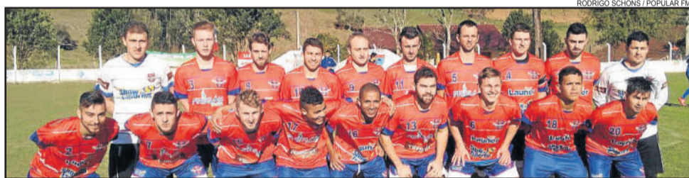
Aimoré de Estrela folga na segunda rodada

Enquanto isso, a Chave D programa três jogos para ver se alguma equipe consegue vencer, já que na rodada inaugural houve três empates. Em Westfália, o Juventude enfrenta o Canarinho de Cruzeiro do Sul. Em Lajeado, o União Campestre encara o Ribeirense de Teutônia. Já em Taquari, no Bairro Leo Alvim Faller, o Colorado recebe o Rui Barbosa de Arroio do Meio.