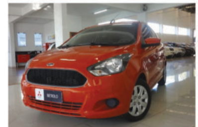
KA SE 1.0 - 2015 Laranja, 4 portas, Flex - IWF-6091.