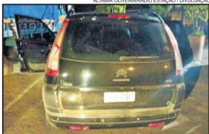
Um dos carros roubados pelos bandidos era um Picasso