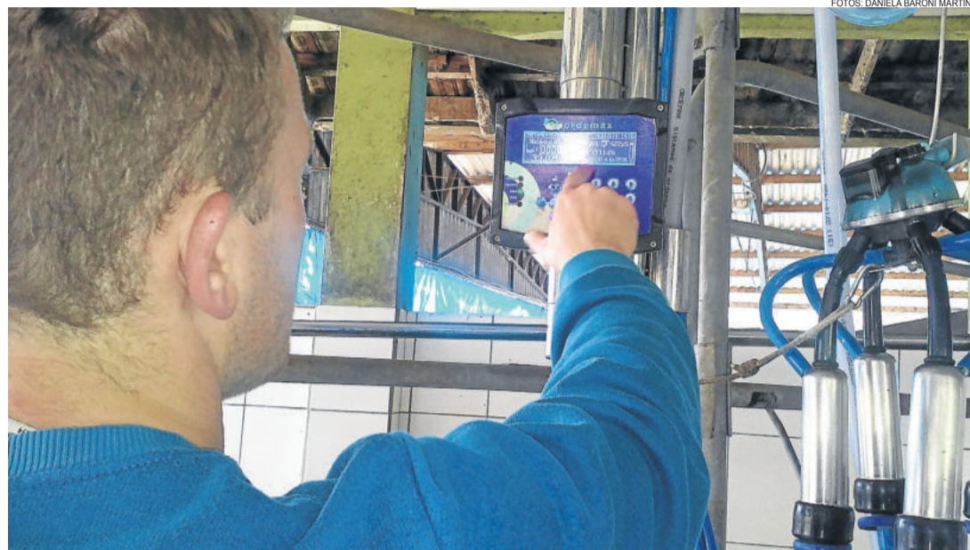
Tecnologias vão sendo incorporadas nas atividades diárias

O software desenvolvido pela empresa teutoniense Control Milk Tecnologia e Informação é focado no controle zootécnico e financeiro. “Na área zootécnica, por exemplo, tem o controle da produção das vacas, dos medicamentos que precisam ser aplicados, da árvore