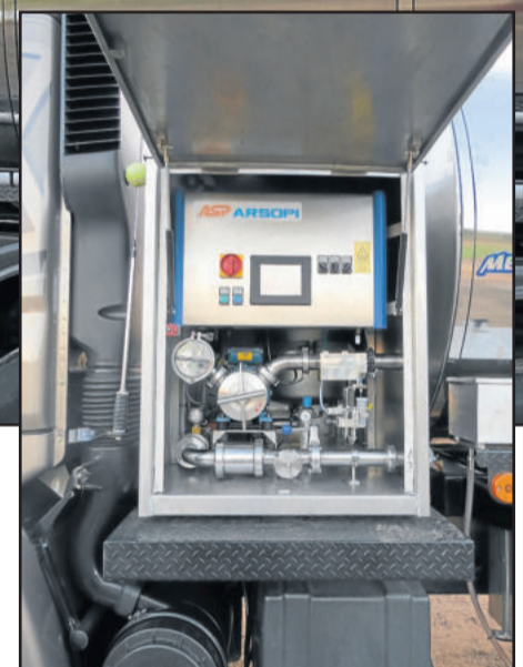
Equipamento português ficará em testes por dois meses