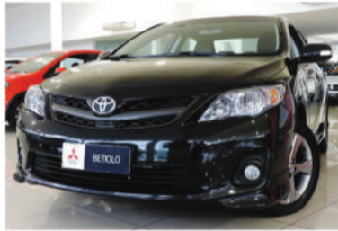
COROLLA XRS 2.0 16V - 2014 Preto, 4 portas, Automático, Flex - IUZ-0676.