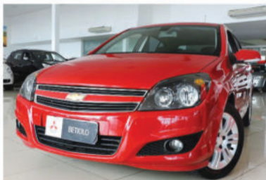
VECTRA GT 2.0 MPFI 8V - 2011 Vermelho, 4 portas, Flex - IRA-6786.