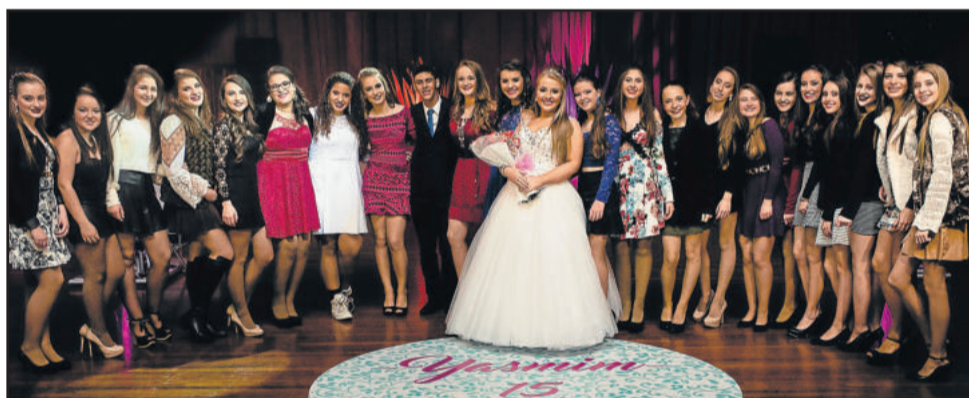
Com alguns amigos e colegas