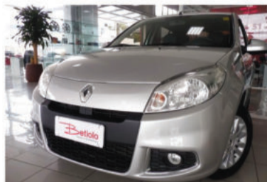
SANDERO PRIVILÉGE 1.6 8V - 2013 Prata, 4 portas, Flex - ITQ-4352.