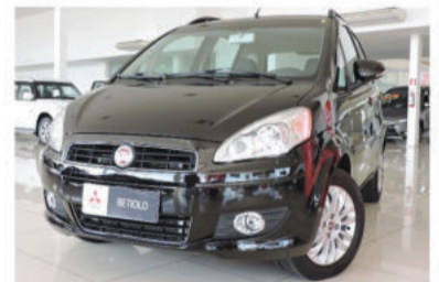
IDEA ESSENCE 1.6 16V - 2011 Preto, 4 portas, Flex - IRM-9505.