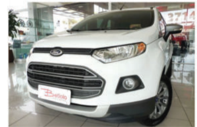
ECOSPORT FREESTYLE 1.6 - 2013 Branco, 4 portas, Flex - IUA-5601.