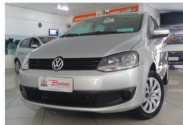
FOX TREND 1.6 MI 8V - 2013 Prata, 4 portas, Flex - ITO-3720.