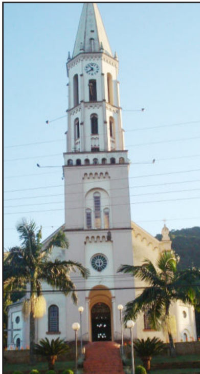
Bênção será em frente à Matriz

A Administração Municipal de Poço das Antas informa que no dia 17 de agosto, das 13 às 17 horas, no Centro Administrativo, em Poço das Antas, estará o Cartório Eleitoral de Teutônia para realizar o alistamento (título novo), transferências ou alteração de título de eleitoral. Interessados deverão comparecer munidos dos seguintes documentos originais e cópia: documento de identificação, CPF “se tiver” e comprovante de residência. Jovens do sexo masculino que fizeram alistamento no ano de 2011 deverão trazer a quitação militar.