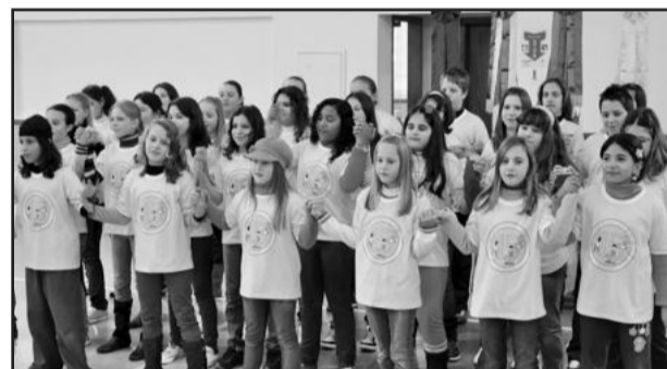
Administração presta homenagem aos 15 anos do Centro Educativo Crescer

O Centro Educativo Crescer iniciou suas atividades há 15 anos e hoje conta com diversas oficinas, as quais as crianças e adolescentes podem frequentar no turno inverso ao das aulas. São oficinas de música, dança, esportes, informática, artes e outras, além de serviço psicossocial e grupo de pais. Desde 1996, mais de 2.100 crianças já foram beneficiadas pela instituição, que atende atualmente mais de 400 crianças e adolescentes de 6 a 15 anos.