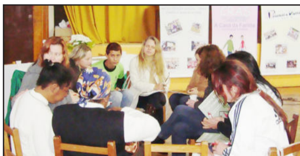
Tema e subtemas foram debatidos em grupos