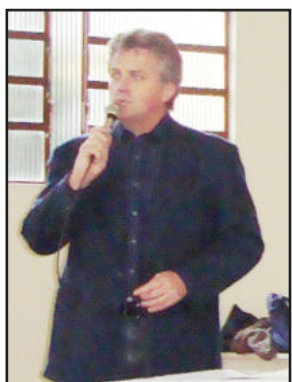
Prefeito Renato Airton Altmann