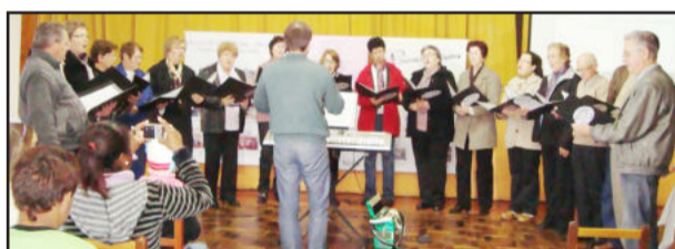
Apresentações também marcaram o trabalho

* 3ª Proposta - Identificar famílias para encaminhamento e atendimento no CRAS.