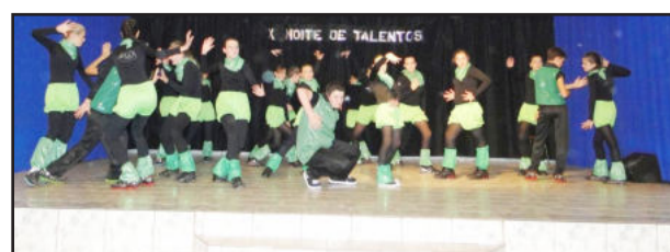
Grupo de Danças Argos