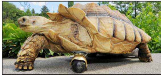
Imagem divulgada pela Universidade do Estado de Washington, nos Estados Unidos, mostra uma tartaruga de 12 anos exibindo uma prótese implantada no lugar de uma de suas patas. Gamera, nome dado ao

animal, sofreu intervenção cirúrgica para implantar a peça depois que a pata esquerda dianteira foi amputada devido a uma infecção. A tartaruga está na cidade de Pullman, em Washington.