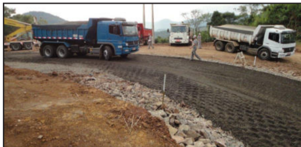
Obras no Morro Wiethölter, em Westfália

As obras de pavimentação asfáltica da estrada de Linha Frank, em Westfália, seguem em bom ritmo, apesar das condições climáticas desfavoráveis das últimas duas semanas. No Morro Wiethölter, apesar da chuva, a previsão é de que em breve a camada final deverá ser implantada. Nestes últimos dias, a Conpasul colocou a base de brita, preparando a pista para a futura imprimação.