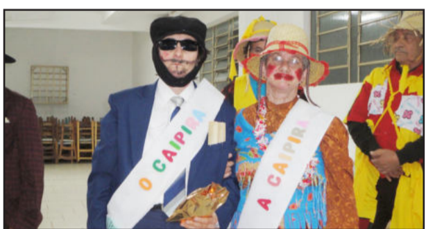
Escolha do Casal Caipira também ocorreu