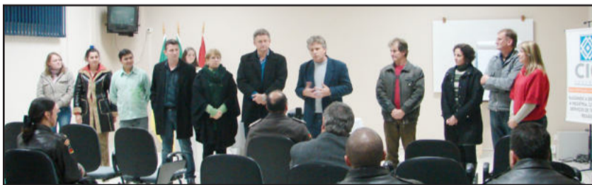
Administração Municipal de Teutônia é parceria da BM