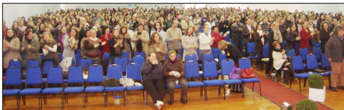
Encontro de professores promovido pela CRE