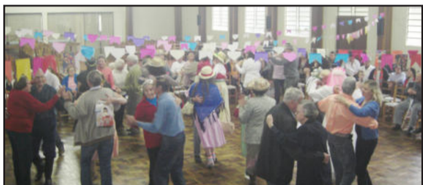
Grupos dançaram e se divertiram