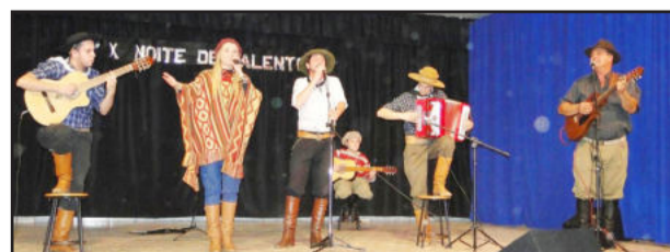
Grupo Cincerro de Prata de Lajeado