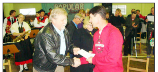
Prefeito entregando auxílio aos corais do Município