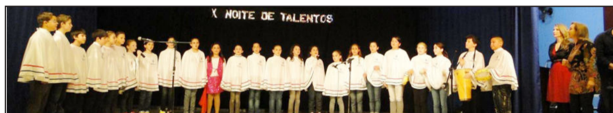
Coral Pequenos Brilhantes