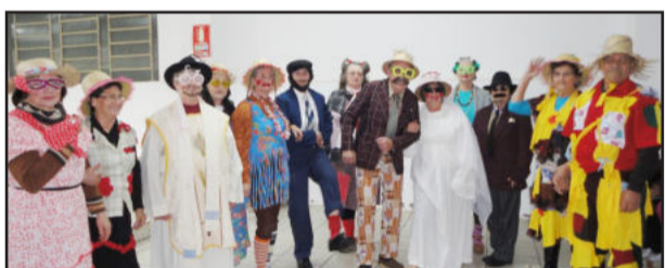
Vestidos a rigor, idosos brincaram e se divertiram no São João