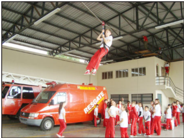
Alunos tiveram oportunidade de realizar atividades práticas, como rapel

O Salvar Vidas/Bombeiros Mirins é uma parceria entre a Prefeitura de Estrela, por meio da Secretaria de Esporte e Lazer, e Corpo de Bombeiros de Estrela. As atividades ocorrem todas as terças e quintas-feiras na sede do Corpo de Bombeiros.