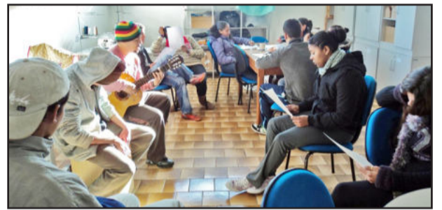
Letras de músicas trabalham valorização do direito humano

Os encontros ocorrem nas segundas, quartas e quintas-feiras no CRAS Imigrantes, das 14 às 16h30min.