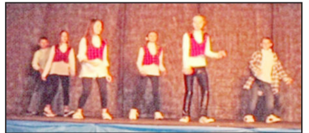
Alunos da EMEF Pinheiros