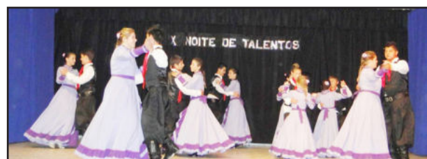
Invernada Infantil do DTG