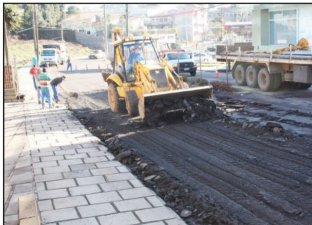
Prefeitura retira camada asfáltica deteriorada