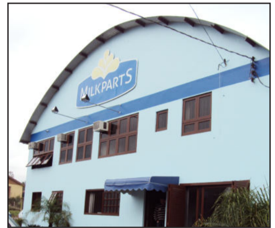
Milkparts está em novo endereço

A Milkparts Sistemas de Ordenha está atuando em novo endereço desde ontem, sexta-feira, dia 22 de julho. Agora a empresa conta com mais espaço para expandir sua produção, inclusive, com fabricação própria de resfriadores de leite. A Milkparts sai das imediações do Centro Administrativo e se muda para a Rua Carlos Frederico Guilherme Ahlert, no Bairro Teutônia. O acesso é na rua lateral a Mecânica do Tata, lado oposto do depósito da Certel, na Via Láctea. Informações: (51) 3762-3338.