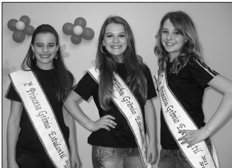
Escola Duque de Caxias de Boa Vista do Sul escolheu sua Rainhas e Princesas

O prêmio de melhor torcida ficou para a turma da 6ª série, que receberá um prêmio surpresa na volta às aulas, em agosto. A Comissão Organizadora do Grêmio Estudantil agradeceu a participação das candidatas e a colaboração de todos para a realização desta atividade de integração da comunidade escolar.