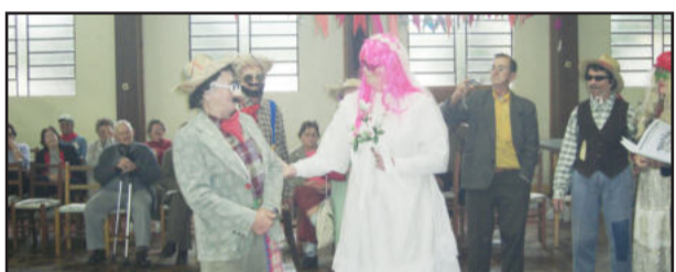
Até casamento caipira saiu na Festa de São João da Melhor Idade