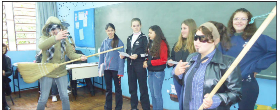
Paródia Literária teve mais uma etapa

No dia 11 de julho, alunos e professores da Escola Municipal de Ensino Fundamental (EMEF) Leopoldo Klepker, do Bairro Alesgut, estiveram reunidos para assistir às apresentações das paródias literárias criadas pelas equipes da 2ª Gincana Literária, que vem ocorrendo ao longo do ano letivo como estratégia do projeto "Cidade Leitora", coordena-