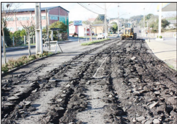
Obras emergenciais na Buarque de Macedo iniciaram ontem

A Secretaria Municipal de Obras, Transporte e Trânsito pede a atenção e compreensão dos motoristas que circularem nos próximos dias pela rua, devido às obras de retirada do asfalto. Nos pontos onde a deformação é menor, o asfalto será mantido até que se inicie a nova obra de pavimentação.