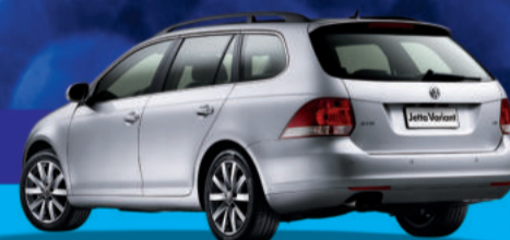
Nova Jetta Variant

A partir de R$ 85.990, Completíssima entrada 50% e saldo em 24x e juros de 0,49% a.m