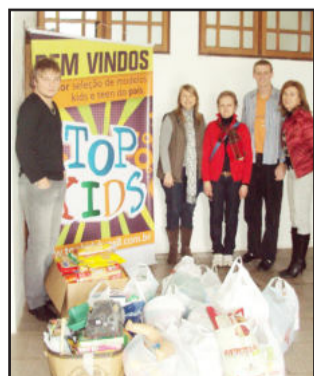
Top Kids doou alimentos e brinquedos

Nesta terça-feira, dia 19 de julho, o Departamento de Assistência Social de Teutônia recebeu a doação de aproximadamente 200