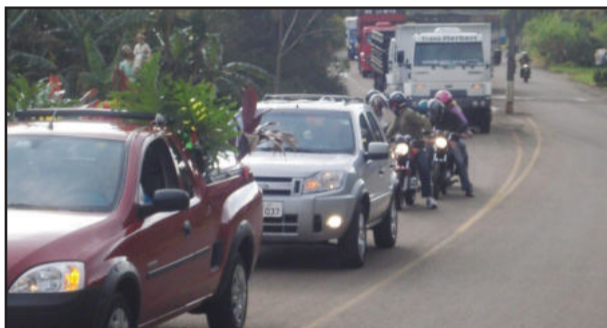
Procissão é prestigiada em grande número