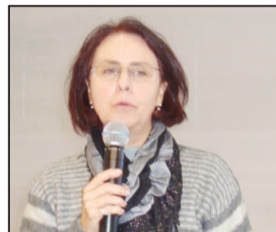
Palestrantes debateram vários temas

Estiveram no palco do Complexo Esportivo da Univates o coral da Escola Antônio de Conto de Encantado, os Barõesinhos da Escola Estadual Barão de Antonina de Taquari e o Coral Raio de Sol de Travesseiro.