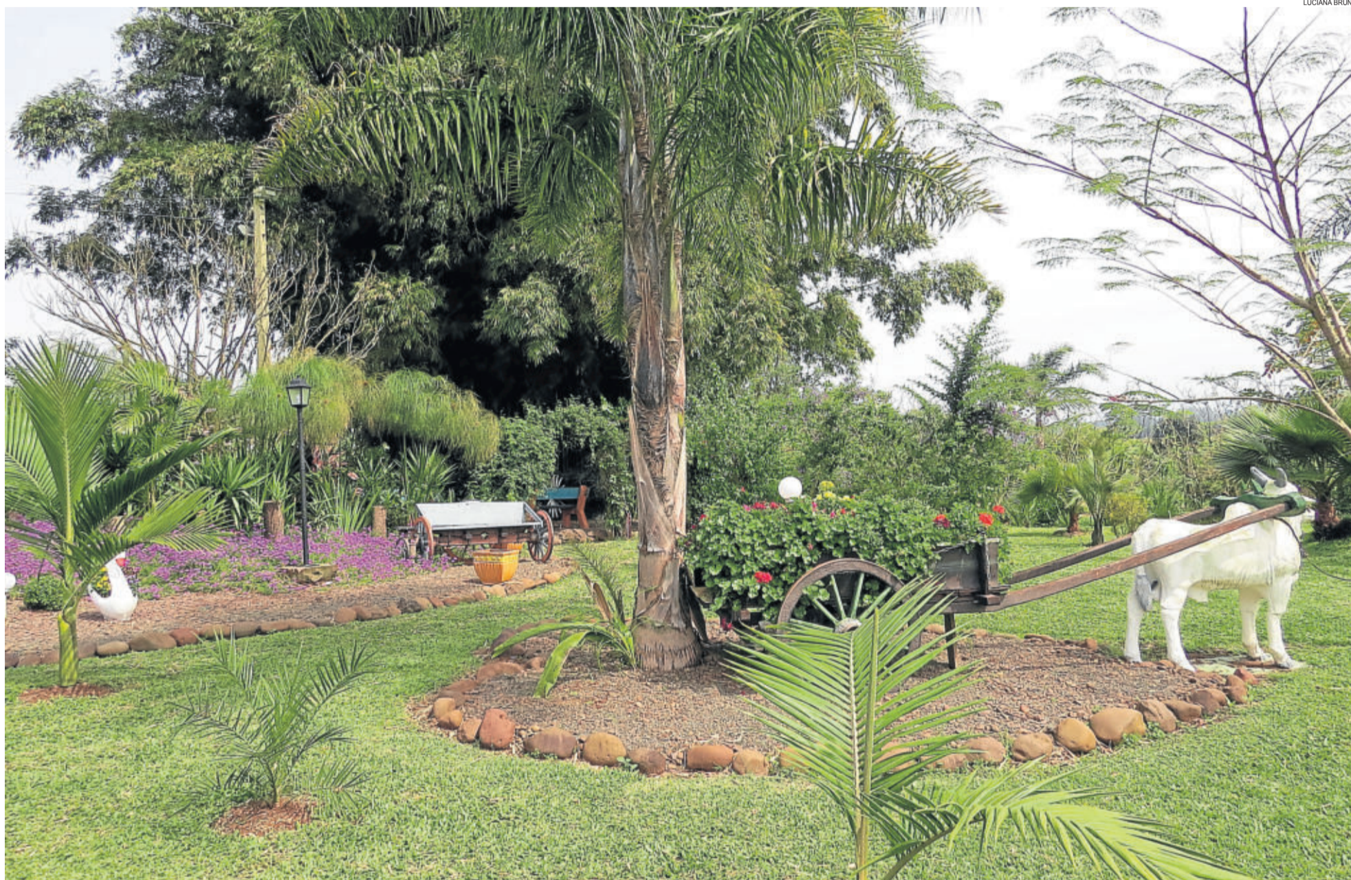
Jardins ganhadores foram premiados e reconhecidos no sábado à noite, durante o 23º Blumentanzfest. NOTÍCIAS > 8 E 9