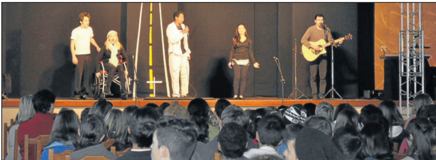
Grupo Luz e Cena

A próxima ação do CFC Reichert, dentro da Semana do Trânsito, será um seminário de trânsito previsto para hoje, dia 23, às 19h30min, na Associação Pró-Desenvolvimento de Languiru. Os temas a serem abordados serão: Tragédia nas rodovias e apontamento de soluções; Trânsito de Teutônia; Formação de Condutores; Perfil do condutor e consequências em acidentes.