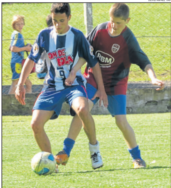
Jogos de ontem encerraram às 16 horas