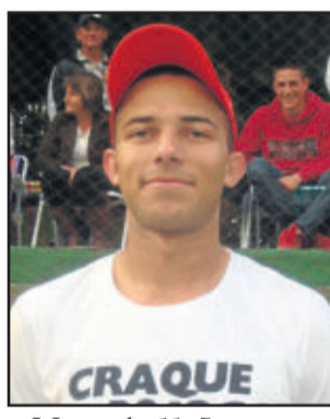
Mano, do 11 Amigos, o craque Lojas Casarão Verde