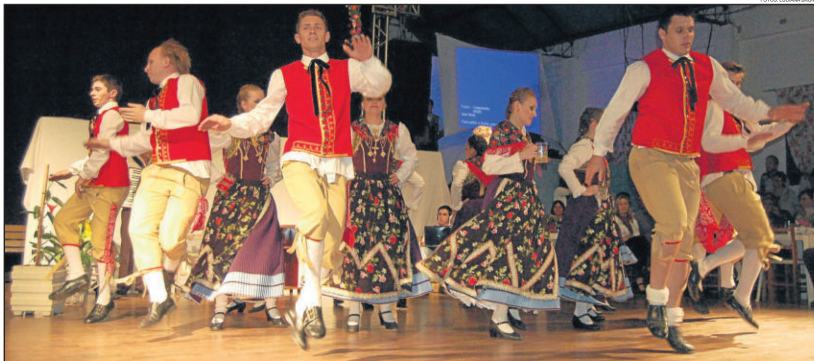
Grupo Morgenstern de Colinas foi o anfitrião do encontro que reuniu 38 grupos

Junto com as danças da categoria principal, foi realizada a encenação de abertura do evento, que mostrou o contraste entre