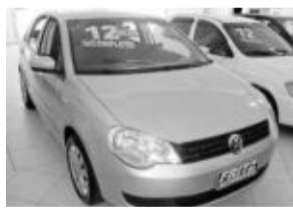
Polo Sedan 1.6 R$ 38.500,00

Aberto de segunda a sexta das 8h às 18h30min. Sem fechar ao meio dia e nos sábados das 8h às 16h.