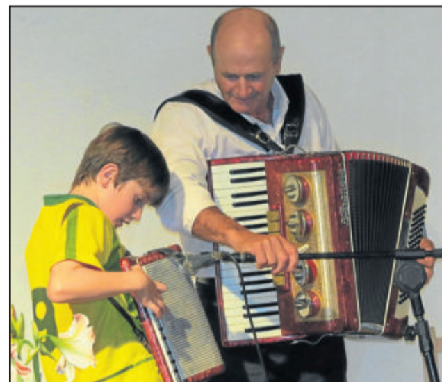
Criança e idoso mostrando habilidade com a gaita, animando a apresentação

Depois, o baile seguiu animado pela Banda K'nekus, com muita festa e animação até de madrugada.