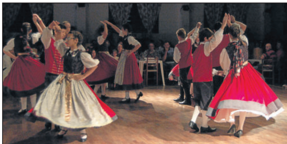
Grupos folclóricos mostraram sua habilidade

as modernas tecnologias e a simplicidade de viver e se relacionar em família e entre amigos. Ao som de gaita, tocadas por um idoso e um jovem menino, o grupo apresentou sua primeira dança. A abertura oficial