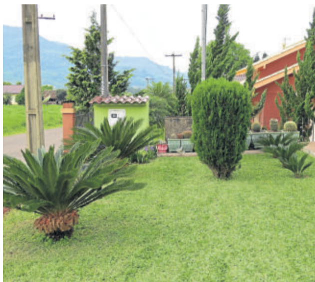
Aproveitamento de espaço: Pedro Schulte