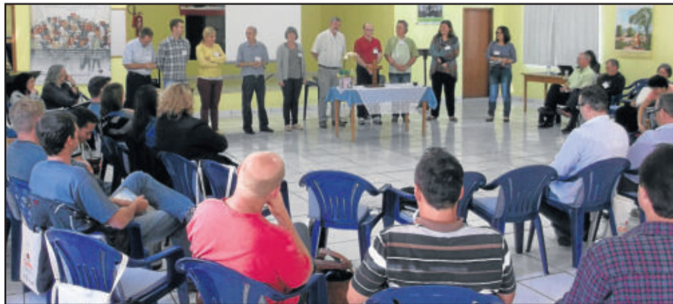
Seminário foi realizado no Paraná e reuniu cerca de 60 pessoas ligadas ao CAPA

Ele reforça que neste cenário é preciso que o CAPA “mantenha sua chama acesa, apontando o futuro”.