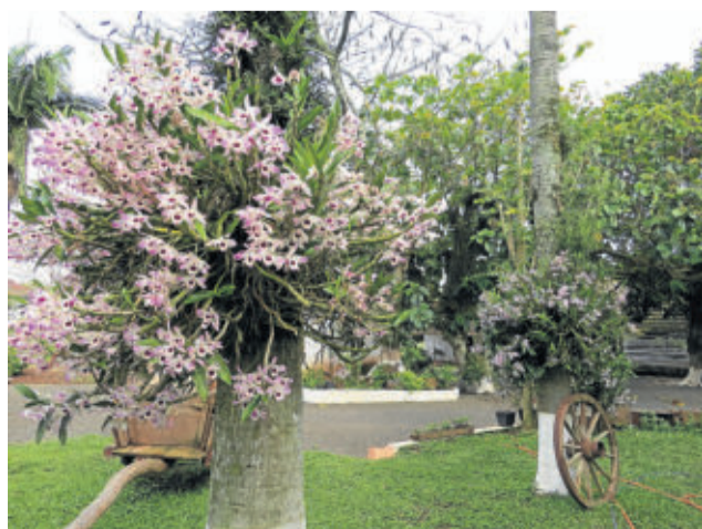
Orquídeas ornamentam muitos jardins