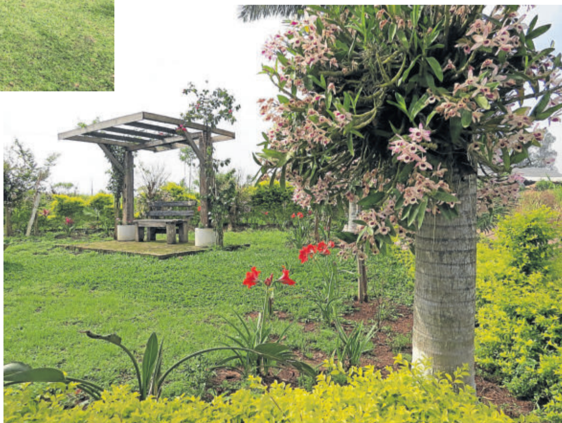
Lindos recantos no interior do Município - Propriedade de Erico Röhsig