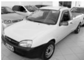
Courier 1.6 R$ 22.800,00

Fritz Automóveis parabeniza todos gaúchos pelo seu dia!