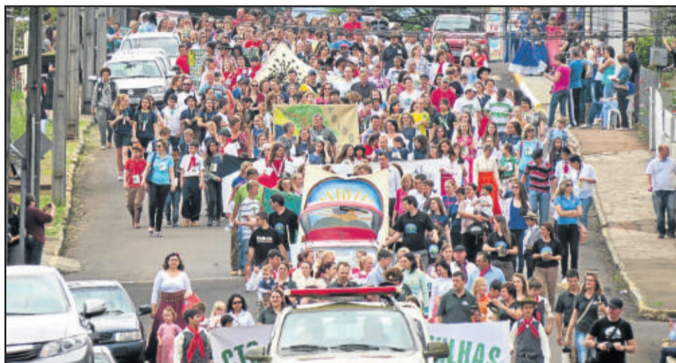
Passeio da Bombacha realizado no Bairro Languiru