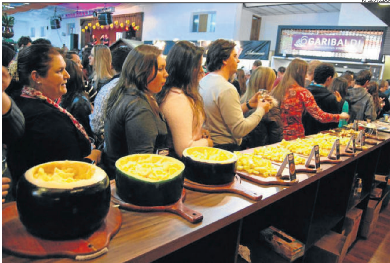
Neste ano, Carlos Barbosa recebeu mais de 19 mil pessoas durante o Festiqueijo

De acordo com Rigo, os resultados aparecem não necessariamente durante o período da festa, mas se propagam depois. “Ele perpetua ao longo dos outros meses porque marca a lembrança do consumidor”, afirma. Turisticamente, o presidente acredita que a contribuição do Festiqueijo seja atrair um público diferente que não chegaria à cidade se não fosse pela participação no festival. “Você acaba trazendo um público que viria a Carlos Barbosa por outro evento. O Festiqueijo traz gente de todo o Estado, de Santa Catarina e São Paulo vem muita gente. Então tu acaba difundindo a marca, fazendo que as pessoas lembrem de Carlos Barbosa”, diz. Ele ainda afirma que atrelar os produtores ao município acaba se tornando um símbolo de qualidade.