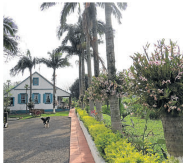
Aproveitamento de espaço: Erico Röhsig