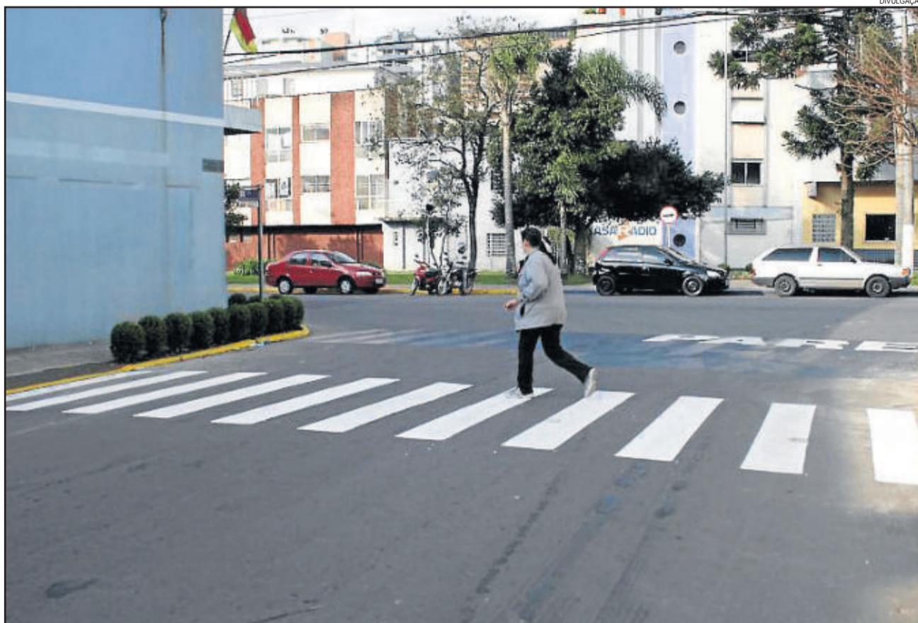
Faixas de segurança e pedestres são respeitadas pelos motoristas em Carlos Barbosa

Mesmo assim, o presidente do Legislativo destaca como sendo um bom hábito que representa a educação do povo barbosense. “É sem dúvida uma demonstração de uma comunidade que é educada, que respeita o pedestre e que valoriza a segurança, dando liberdade para o pessoal caminhar tranquilamente”, afirma.