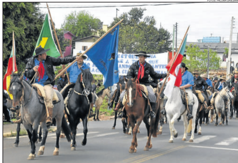
Cavalarianos abrem desfile promovido pelo CCT Querência Amada, em Canabarro, (foto acima). Os pequenos também desfilaram cavalgando (foto ao lado)