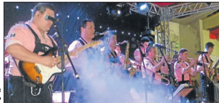
Orquestra La Montanara animou o evento