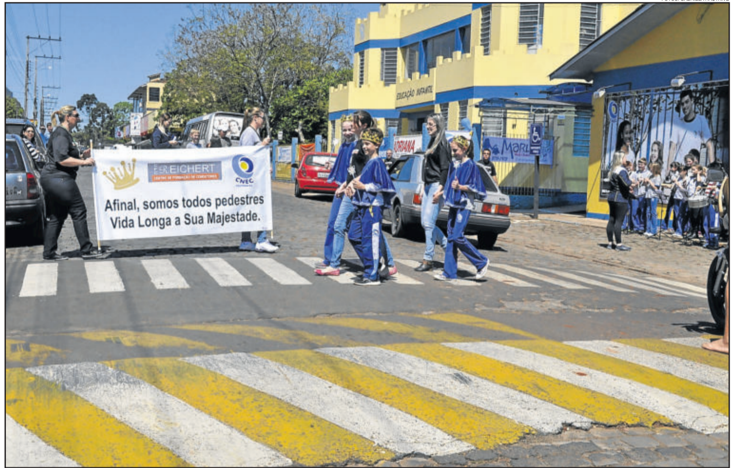
Ação do CFC Reichert contou com o apoio dos alunos do IECEG