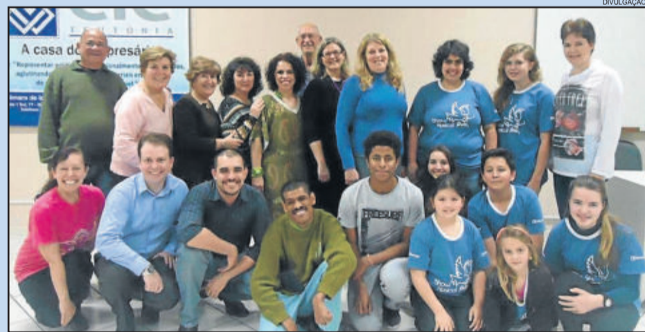
Todos artistas reunidos