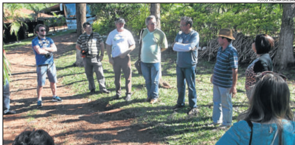
Visita a uma das propriedades atendidas pelo CAPA