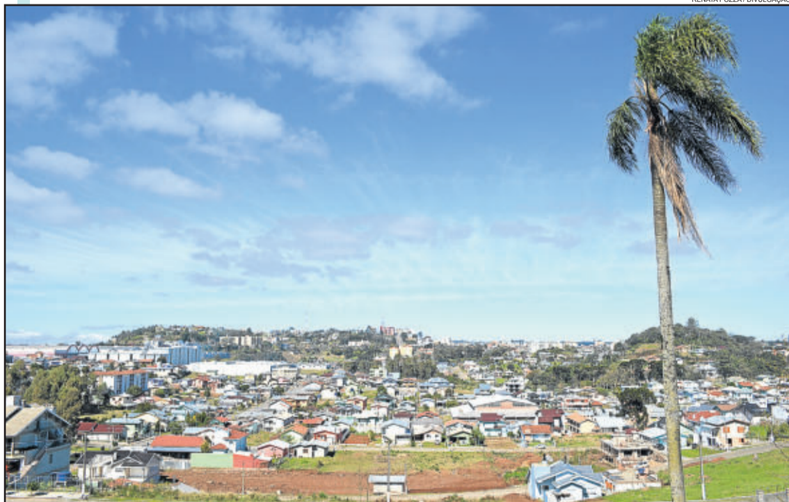
Carlos Barbosa é sinônimo de cidade em constante desenvolvimento. Na imagem, o Bairro Triângulo