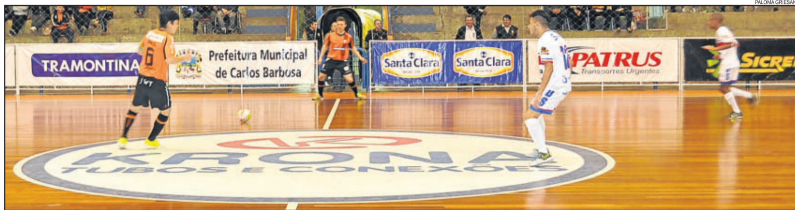
ACBF representa Carlos Barbosa na Liga Nacional e já conquistou títulos em nível internacional, como o Mundial e a Copa América

Nenhum outro esporte identifica tanto Carlos Barbosa quanto o futsal. Nenhuma equipe representa tanto o futsal de Carlos Barbosa quanto a ACBF. O clube que leva o nome do município em seu próprio nome é um dos motivos de orgulho. Com reconhecimento internacional, o clube difundiu também a marca do município