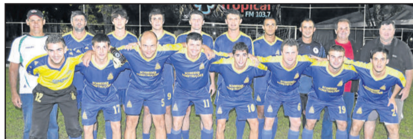
Amigos de Boa Vista também venceu duas vezes

Ontem, sexta-feira, dia 23, foi realizada a 5ª rodada do Abertão de Verão da Languiru, a terceira desta semana, porém as partidas não foram encerradas até o fechamento desta edição. Então estes resultados e destaques estarão na Folha Popular da próxima terça-feira.