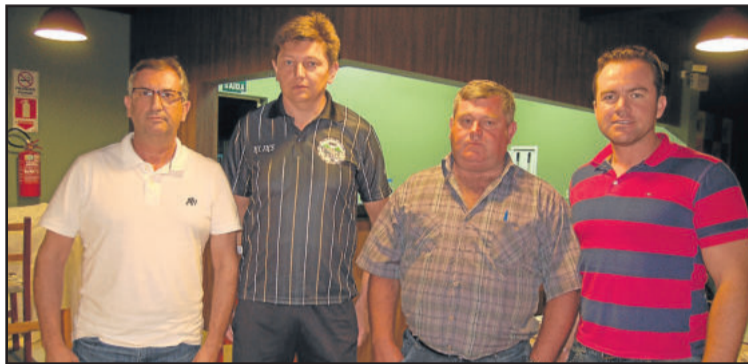
Presidentes de Assaf, ASTF, Assoeva e Alaf se preparam para mais uma Copa dos Vales

Todos os jogos são tratados como clássicos entre as equipes dos vales do Taquari e do Rio Pardo, co-