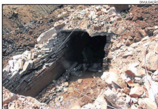
Estrutura da galeria antiga