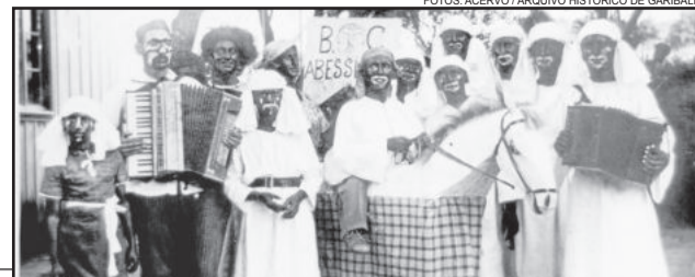
Bloco Abessínios 1950

O Carnaval de Rua Retrô é uma realização da Prefeitura Municipal, por meio da Secretaria de Turismo e Cultura, com apoio das secretarias de Obras, de Segurança e Mobilidade Urbana e da Saúde. Informações no fone (54) 3462 8235.