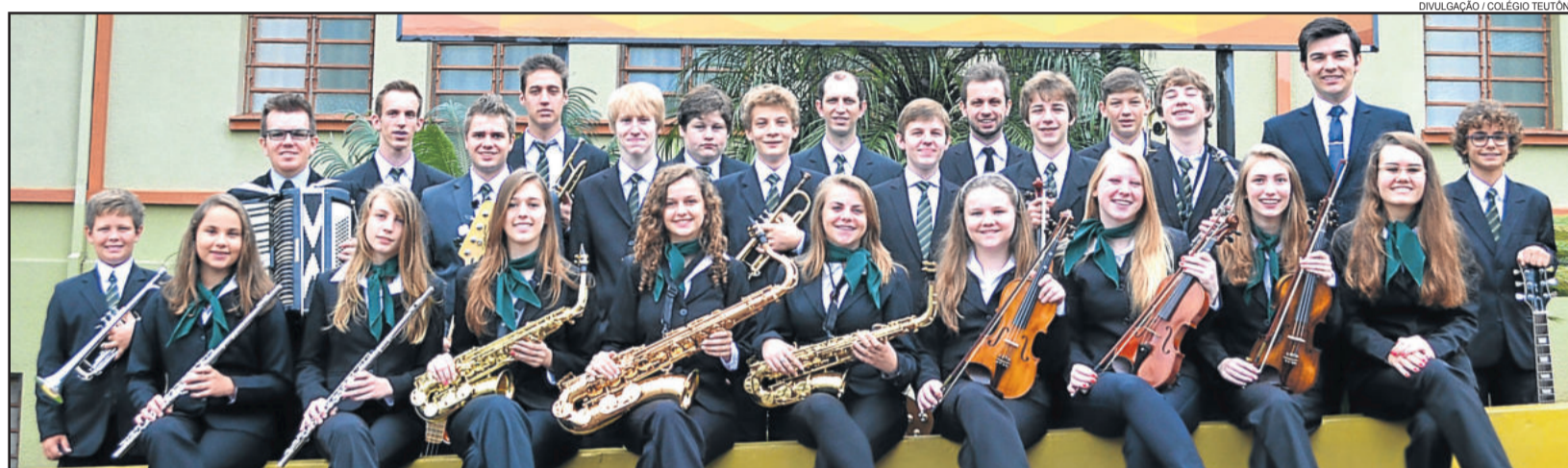
Conjunto Instrumental do Colégio Teutônia apresentou o concerto para a comunidade ontem à noite

Alunos farão apresentações em dez cidades da Alemanha e da Suíça