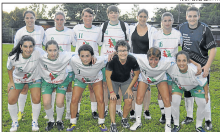
Academia Mega Sports venceu duas vezes na semana

Ontem, sexta-feira, dia 23, foi realizada a 5ª rodada do Abertão de Verão da Languiru, a terceira desta semana, porém as partidas não foram encerradas até o fechamento desta edição. Então estes resultados e destaques estarão na Folha Popular da próxima terça-feira.