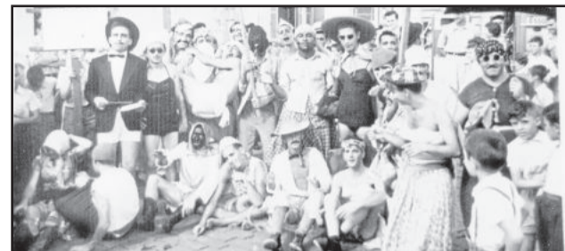
Bloco Maragangalha em 1950