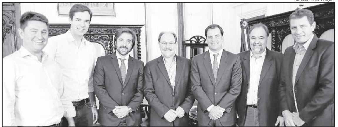
Executivos apresentaram ações nas áreas de avicultura e suinocultura