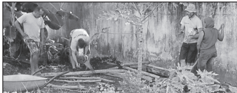
Atividades são desenvolvidas com estudantes, professores, funcionários da biblioteca e do hospital da cidade, além da comunidade em geral