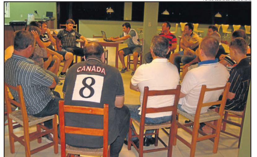
Encontro em Teutônia definiu a 4ª edição da Copa dos Vales de Futsal