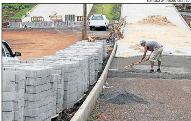
Administração Municipal inicia obras de pavimentação por cinco bairros

Na próxima terça-feira (27), às 17h30, em frente ao Posto de Saúde do bairro Conventos, será realizada cerimônia de anúncio oficial das obras. "Vamos lançar a parte do programa do Badesul. São