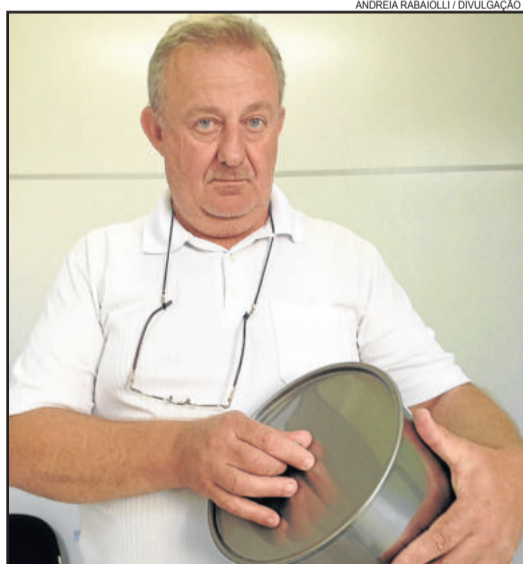
Eidelwein: maneira de conscientizar sobre separação de lixo

Neste ano, o Meio Ambiente entregará um cesto para a população colocar o lixo orgânico. Mas deve pagar a taxa de lixo até dia 13 de março