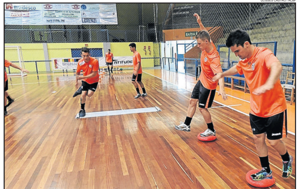
Jogadores da ACBF treinam durante a pré-temporada

A ACBF continua com a pré-temporada em Carlos Barbosa nas próximas duas semanas. O primeiro teste da Laranja Mecânica será no dia 17/02 contra o Concórdia, fora de casa. No dia seguinte, as equipes voltam a se enfrentar, desta vez, na cidade de Piratuba-SC. Entre os dias 24/02 e 28/02, a equi-