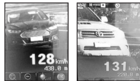
Carros são flagrados em alta velocidade pelos radares em sequência

Para Wachholz, a redução de motoristas notificados é atribuída à consciência dos condutores, ou ao temor dos mesmos em serem autuados, o que em ambos os casos resulta em segurança no trânsito.