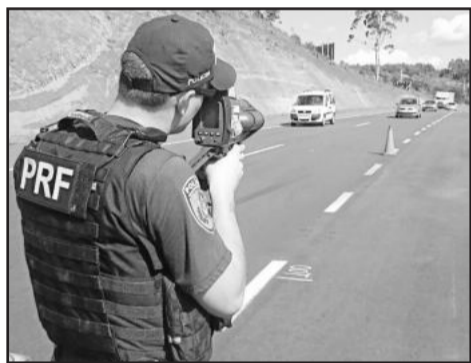
PRF fiscaliza excessos na BR-386

A Polícia Rodoviária Federal realiza desde quinta-feira, dia 21, a Operação Hermes na BR-386. Durante os dias de fiscalização, os policiais estão utilizando cinco radares móveis de forma