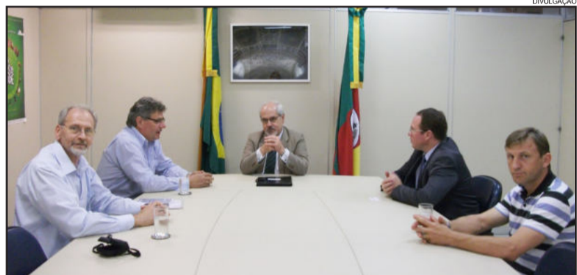
Comitiva apresentou projeto do IHU ao secretário estadual de Cultura (c)