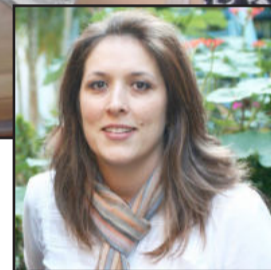
A coordenadora do curso de direito ressalta que objetivo do seminário é aproximar o acadêmico da comunidade e da realidade profissional