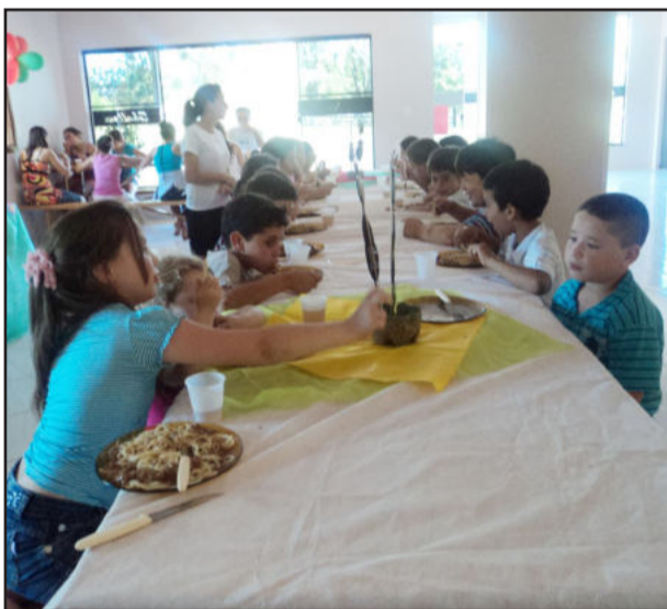
As refeições ajudaram as crianças a reporem as energias