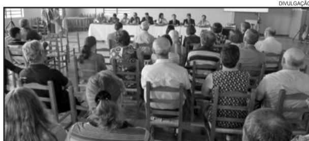
Sessão ordinária da Câmara de Vereadores foi a Santo Antônio de Castro