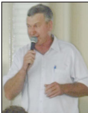
Vice-prefeito de Westfália, Otávio Landmeier