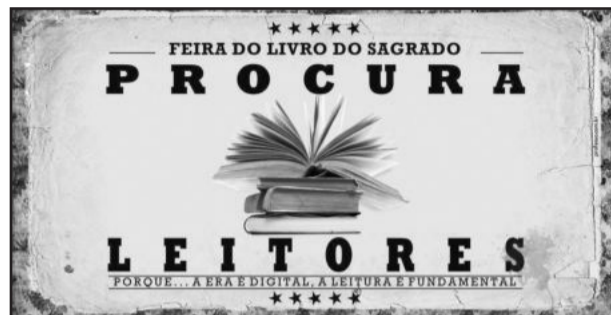
Colégio Sagrado realiza Feira do Livro e Mostra do Conhecimento

O Colégio Sagrado Coração de Jesus de Garibaldi está promovendo sua primeira Feira do Livro e a III Mostra do Conhecimento. Os dois eventos que ocorrem em paralelo iniciaram ontem, dia 23, e encerram no meio-dia de hoje. O objetivo da ação é incentivar a prática da leitura entre os alunos e estimular a produção textual e artística.