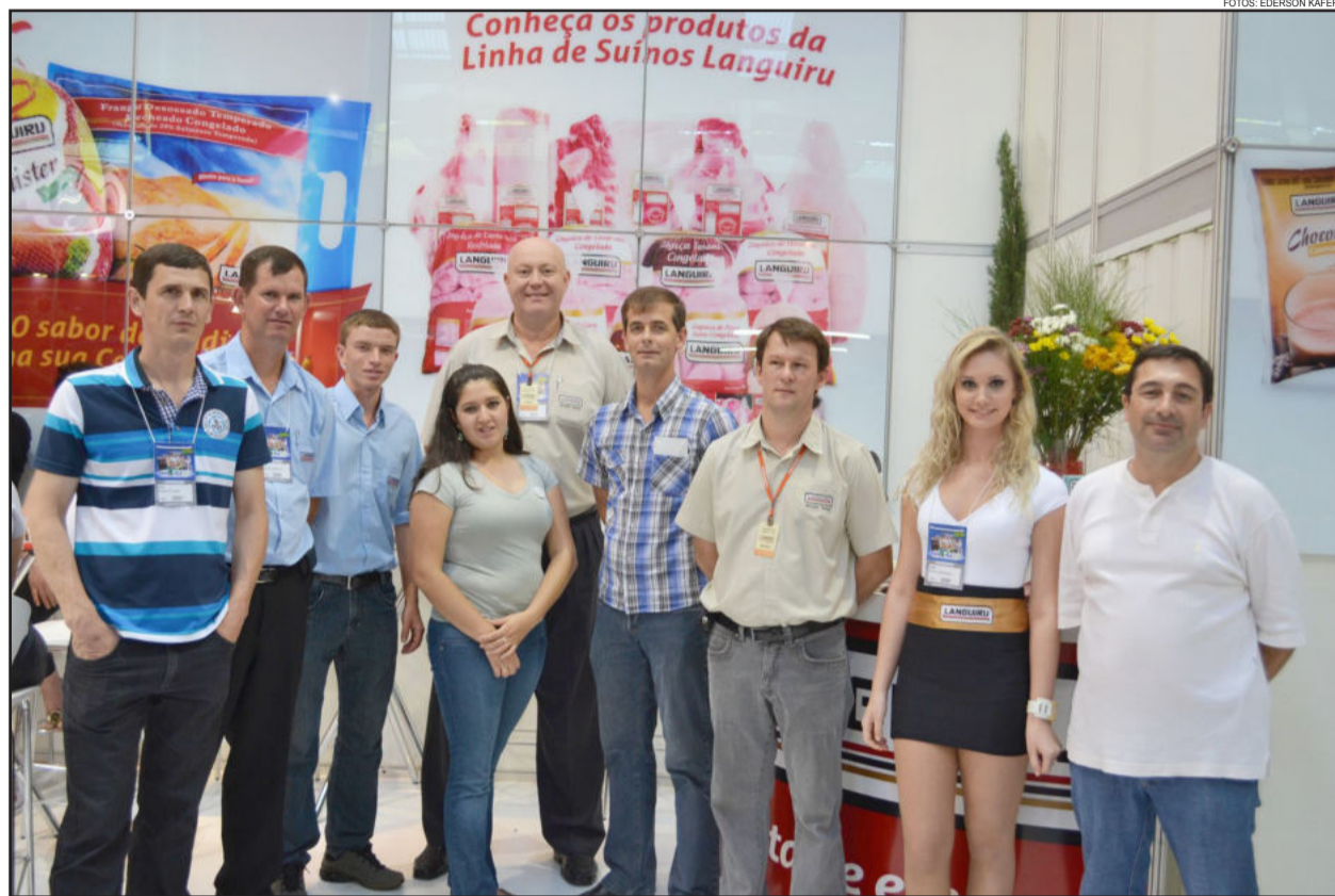
Estande da Cooperativa Languiru foi o primeiro confirmado para a próxima edição da Expovale, agendada para 2014

A Cooperativa Languiru esteve representada na 18ª Feira Industrial, Comercial e de Serviços do Vale do Taquari (Expovale), realizada entre os dias 09 e 18 de novembro, no Parque do Imigrante, em Lajeado. Considerado um dos maiores eventos do Vale do Taquari, a feira evidenciou o potencial das empresas da região em vários segmentos. Em dez dias, 175 mil pessoas conferiram a exposição comercial e shows nacionais.