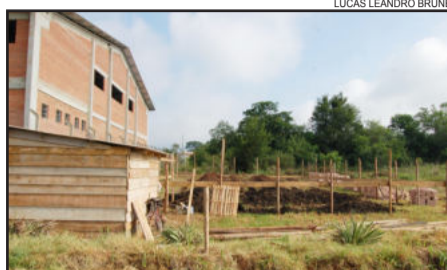
LUCAS LEANDRO BRUNE

O novo Posto de Saúde do Bairro Teutônia terá 193,15 metros quadrados, com estrutura de qualidade semelhante às construídas pelo governo no Loteamento 8 e no Bairro Boa Vista. Haverá rampa de acesso a deficientes, sala de espera, recepção, sanitários, farmácia, sala de enfermagem, consultório de dentista, consultório médico, sala de vacina, sala de observação e toda a estrutura para prestar um bom atendimento à população.