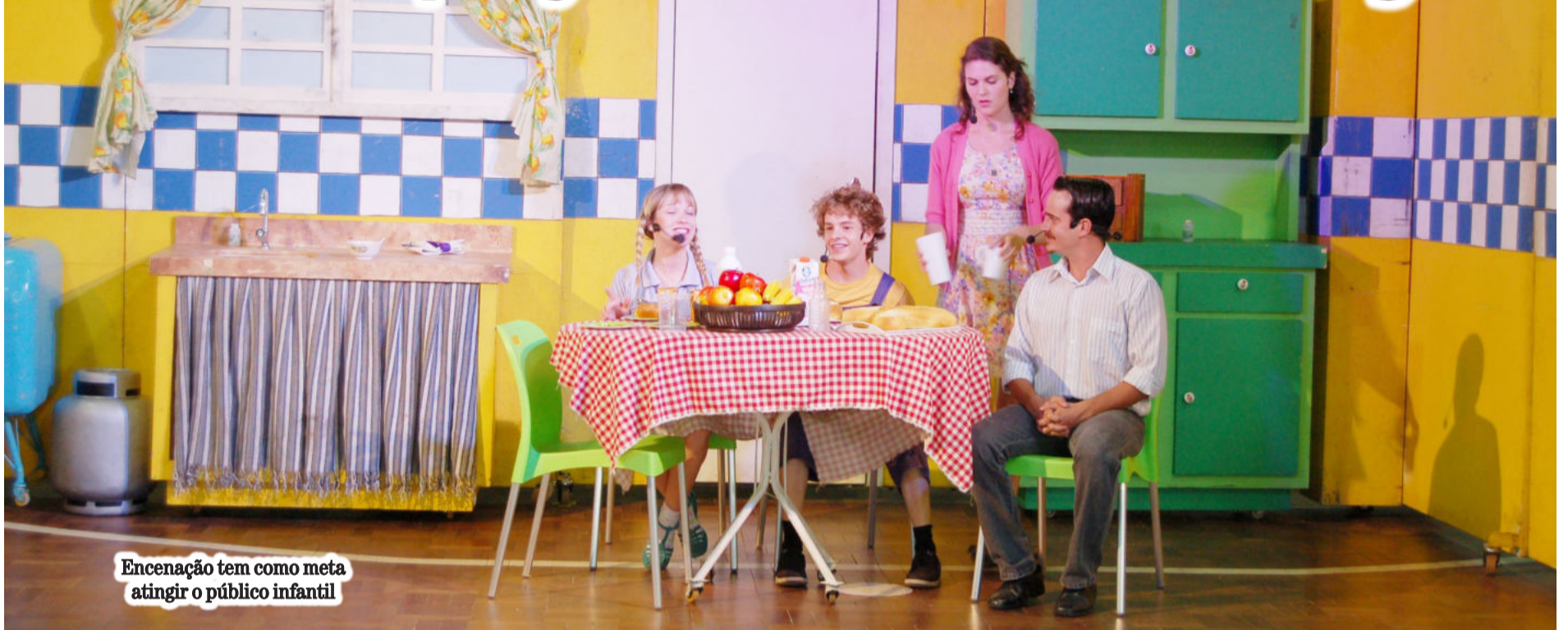
Encenação tem como meta atingir o público infantil

T eutônia está entre as dez primeiras cidades do País a receber o projeto Palco da Reciclagem, com a peça A Arte de Reciclar Contando Histórias. Nesta semana, alunos das escolas do Município, do 1º ao 5º ano, tiveram a oportunidade de assistir a peça, apresentada várias vezes por dia no ginásio da Escola Leopoldo Klepker, no Bairro Alesgut.