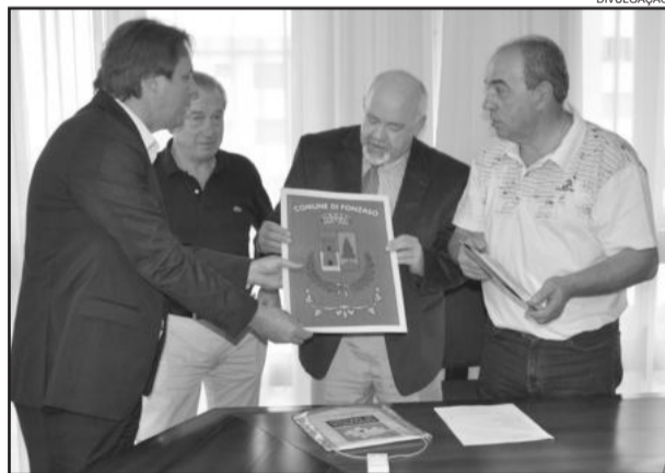
Comitiva italiana visita a cidade

A comitiva italiana, que chegou ao Estado ainda no domingo, esteve em Porto Alegre onde se reuniu com a Federação das Indústrias do Rio Grande do Sul - FIERGS e Associação Gaúcha de Supermercados - AGAS.