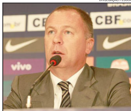
Mano Menezes foi demitido ontem