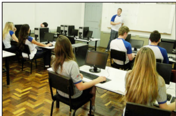
Laboratório de Informática atende os diferentes níveis de ensino da escola teutoniense

Mais informações podem ser obtidas junto à Secretaria da CNEC/IECEG, no Bairro Canabarro, pelo fone (51) 3762-7031 ou pelo e-mail atendimento@ieceg.com.br. O horário de atendimento neste período especial de matrículas e rematrículas é das 7h às 11h40min e das 13h às 22h50min.