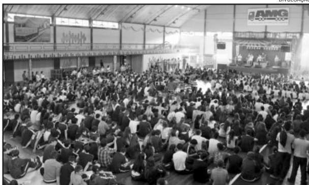
Dia de Ação de Graças reuniu 2000 pessoas

A Ação de Graças é uma promoção da Prefeitura de Garibaldi,