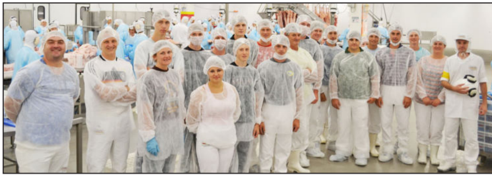
Jovens associados conheceram instalações do novo Frigorífico de Suínos da Cooperativa Languiru, em Poço das Antas

Nesta terça-feira, dia 20 de novembro, cerca de 60 pessoas participaram da segunda etapa do 3º Encontro de Jovens Associados da Cooperativa Languiru. O grupo foi dividido em duas comitativas e a programação contou com visita ao Frigorífico de Suínos, localizado em Poço das Antas, apresentação institucional por parte da direção da cooperativa e almoço na Associação dos Funcionários.