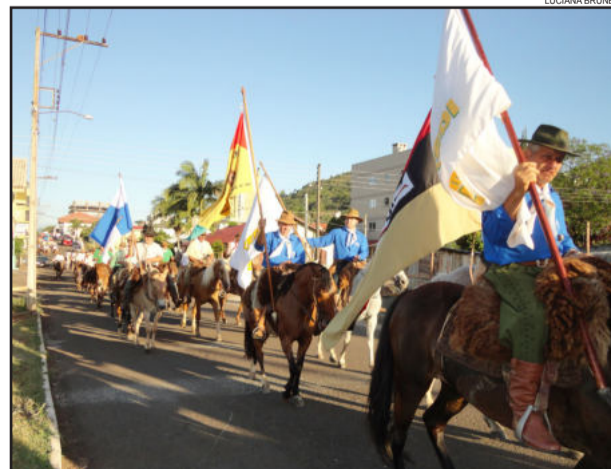
Cavalarianos fazem trajeto percorrido pelo Padre Theodor Amstad

de acordo com o diretor geral da Aliança Cooperativa Internacional - ACI, Charles Gould, sintetiza o objetivo do cooperativismo mundial em contribuir para o desenvolvimento econômico e social das nações. Hoje, o setor cooperativo reúne 1 bilhão de pessoas em mais de 100 países, responde pela geração de mais de 100 milhões de empregos e está presente nos cinco continentes. Em 2010, as 300 maiores cooperativas do mundo tiveram uma movimentação econômico-financeira de US$ 1,6 trilhão.