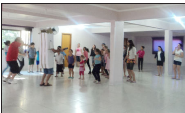
As crianças também participaram de celebrações