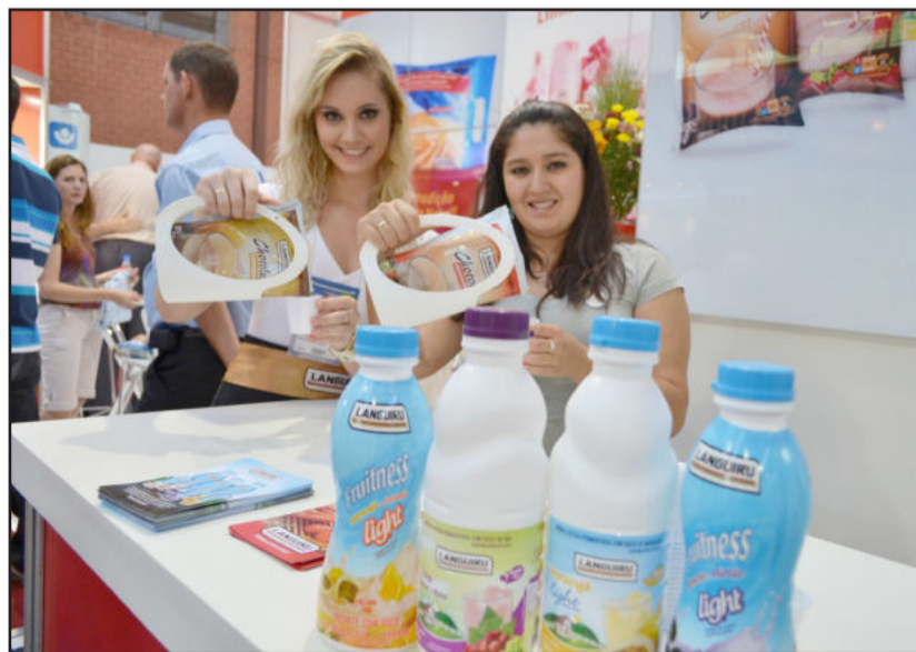
Degustação de produtos agradou visitantes e clientes

O evento foi realizado pela Associação Comercial e Industrial de Lajeado (Acil) e Prefeitura de Lajeado. Contou com o patrocínio de Vonpar e Unimed Vales do Taquari e Rio Pardo (Unimed VTRP), além do apoio de Banrisul, Randon, Corsan, Caixa Econômica Federal, Banco do Brasil e Distribuidora de Produtos de Petróleo Charrua.