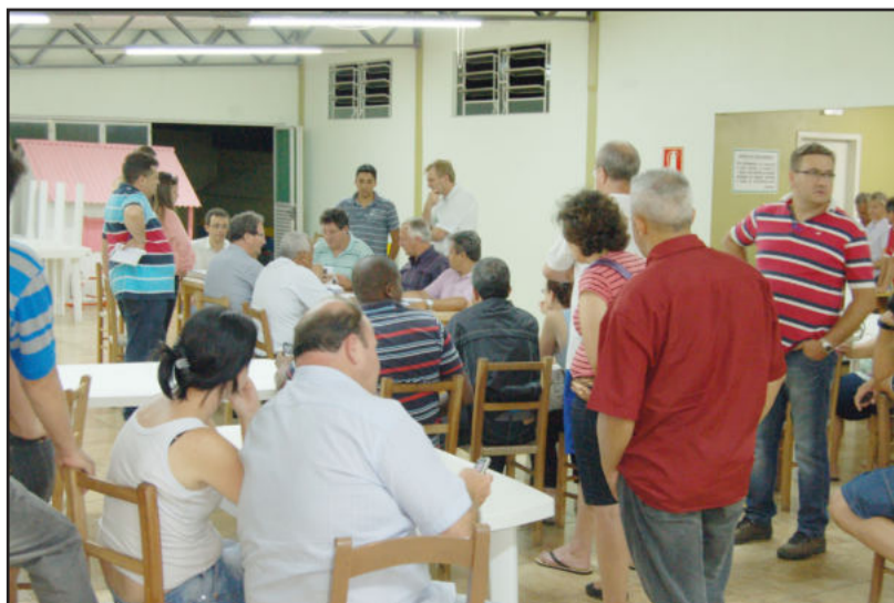
Integrantes das duas chapas acompanharam a apuração