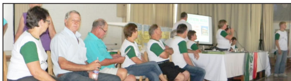
Diretoria do STR e autoridades fizeram parte da mesa principal

Por fim, foram debatidas questões e assuntos gerais do sindicato. Na metade da tarde, os associados do STR receberam lanche e refrigerante.