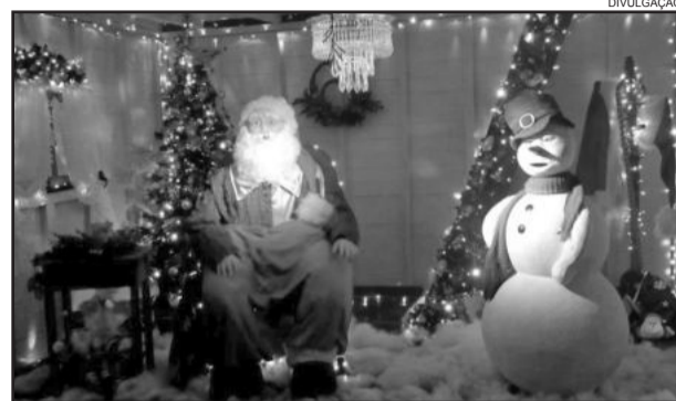
Abertura do Natal no Caminho das Estrelas é amanhã

Carlos Barbosa já está em clima de natal, acentuado pela belíssima decoração que está sendo instalada e que iluminará o município durante as atrações do Natal do Caminho das Estrelas. A festa de abertura será neste domingo, dia 25, às 20 horas, no Parque da Estação e conta com a apresentação "Luz, Magia e Ação!" dos alunos da Educação Infantil.