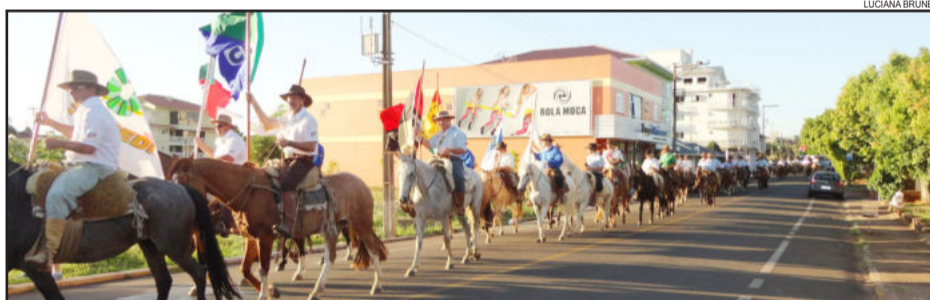
Cavalgada do Cooperativismo percorreu as ruas de Teutônia

Dentro das comemorações pelo Ano Internacional das Cooperativas, o Sescop/RS, com apoio do Sicredi, promove a Cavalgada do Cooperativismo - Caminhos do Padre Theodor Amstad. O objetivo é mostrar a importância do cooperativismo para o desenvolvimento do Rio Grande do Sul e incentivar a intercooperação entre os diferentes ramos, através do resgate da rota percorrida pelo Padre Theodor Amstad.