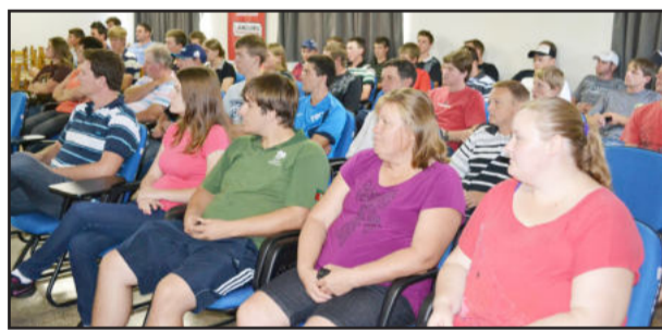
Palestra institucional apresentou estrutura e investimentos da cooperativa