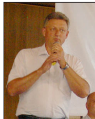
Magedanz acredita que soluções estão nas comunidades