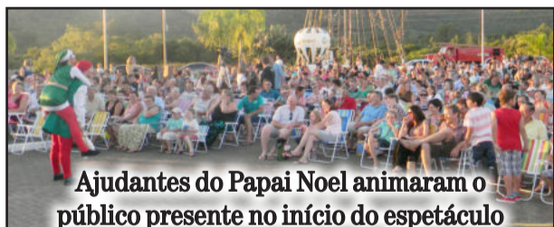
Ajudantes do Papai Noel animaram o público presente no início do espetáculo