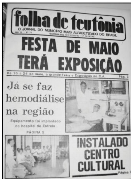
Ortografia mantida conforme edição da época

Centro Cultural está localizado no Centro Administrativo.