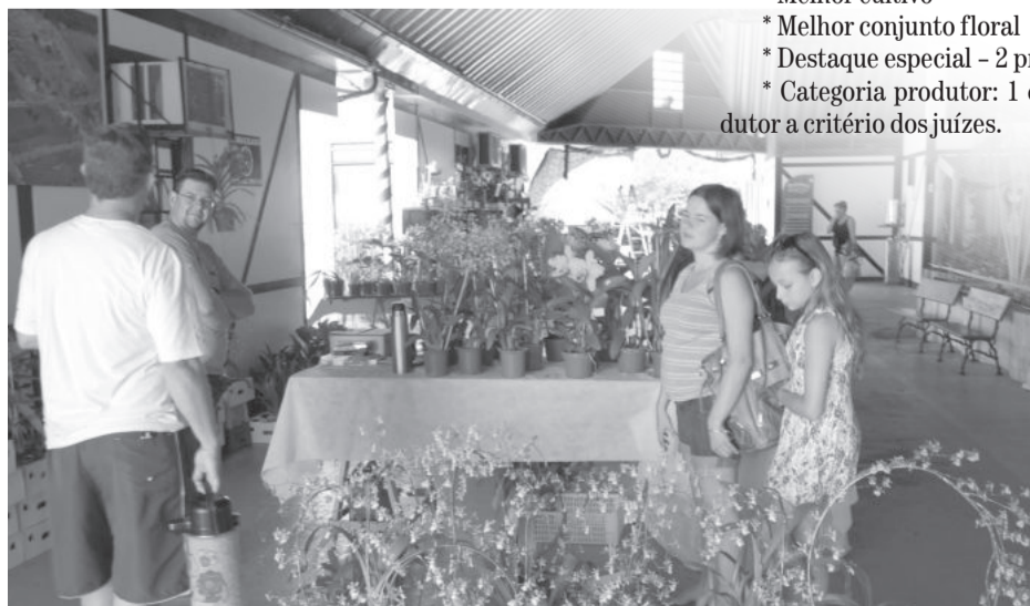
População também compareceu para olhar, comprar e aprender mais sobre as belas orquídeas