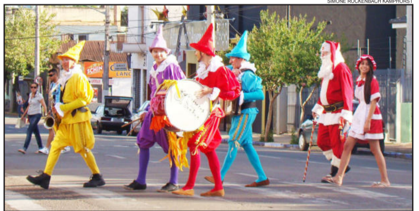
Cortejo espalha alegria do Natal pelas ruas

Também haverá a entrega dos certificados às empresas vencedoras do concurso Vitrine Lajeado Brilha 2013. A programação finaliza às 21h30min