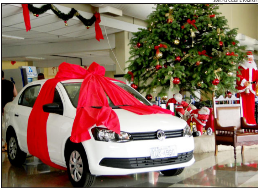
Ganhador do automóvel zero quilômetro será conhecido no sorteio do dia 27 de dezembro, no Supermercado Languiru do Bairro Languiru, a partir das 18h

Último sorteio do ano distribui vales-compras, televisor e automóvel Voyage zero quilômetro