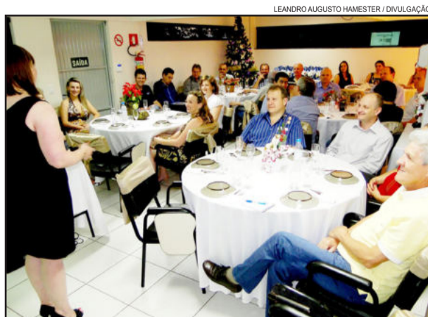
Evento de confraternização entre diretores e colaboradores também teve prestação de contas do exercício

Uma das novidades nos indicadores do exercício foram as atividades do setor de relações com o cliente, implantado desde junho deste ano e que realizou 120 visitas pós-venda, 80 visitas de prospecção de novos associados e 250 visitas de assessoria com os associados. A CIC fecha o ano com 462 integrantes no seu quadro social.