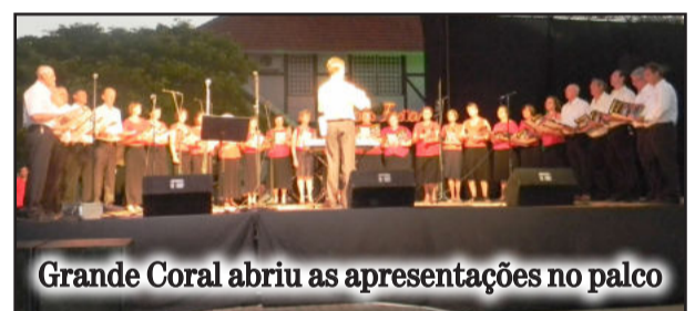
Grande Coral abriu as apresentações no palco