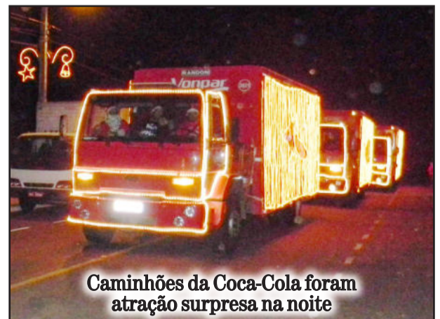
Caminhões da Coca-Cola foram atração surpresa na noite