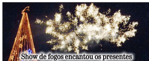
Show de fogos encantou os presentes