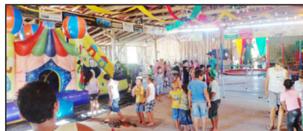
Muita diversão no Primeiro Natal do Morada do Sol