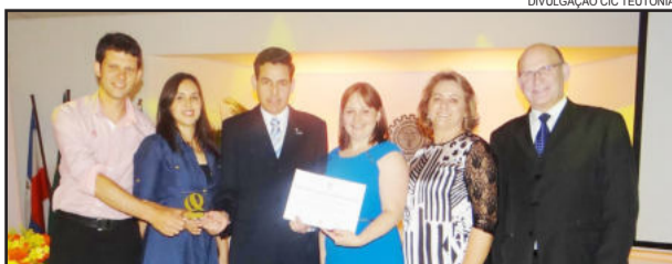
CIC recebeu certificado e troféu por ter participado do Sistema de Avaliação, modalidade Autoavaliação do PGQP

A CIC participa do PGQP desde 2002, buscando a melhoria contínua dos seus processos e participando anualmente de avaliação externa. Em 2004 a entidade conquistou a Medalha de Bronze na 9ª edição do Prêmio Qualidade RS, considerado pelos gaúchos o Oscar da Qualidade, promovido pelo Programa Gaúcho de Qualidade e Produtividade. Conforme previsto em seu planejamento estratégico, a entidade tem por objetivo voltar a concorrer à premiação do PGQP em 2015.