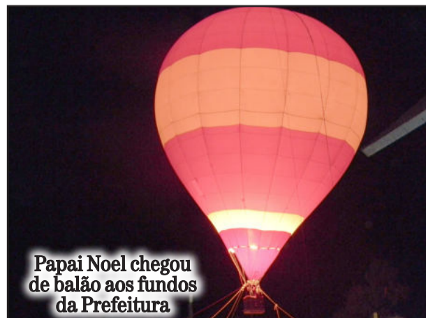
Papai Noel chegou de balão aos fundos da Prefeitura