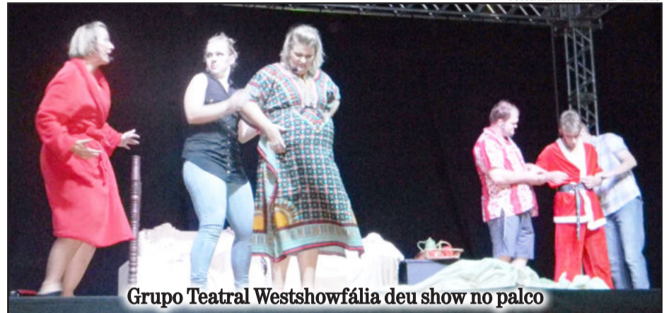
Grupo Teatral Westshowfália deu show no palco