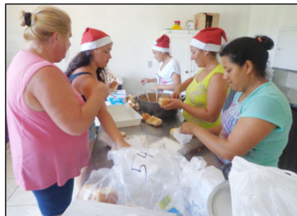
Na cozinha muitos cachorros quentes sendo preparados