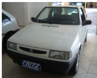
Uno Mille Fire R$ 12.900,00

Aberto de segunda a sexta das 8h às 18h30min. Sem fechar ao meio dia e nos sábados das 8h às 16h.