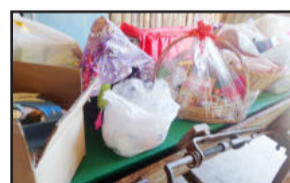
Muitos brinquedos foram distribuídos

Com o apoio de empresas, figuras políticas e pessoas com espírito de solidariedade o Natal no residencial Morada do Sol foi mais alegre e será todos os anos.