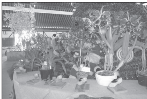
Orquídeas premiadas na Exposição Regional de Teutônia receberam um sapato-de-pau como troféu

O Centro Cívico do Centro Administrativo recebeu o evento, que integrou a programação natalina "Teutônia, Natal é tempo que encanta!". A promoção foi da Associação dos Orquidófilos de Teutônia, com o apoio do Polo do Vale, da Federação Gaúcha dos Orquidófilos e da Administração Municipal de Teutônia.