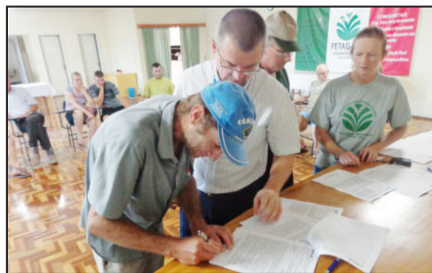
Assinatura dos contratos foram realizadas no dia 20