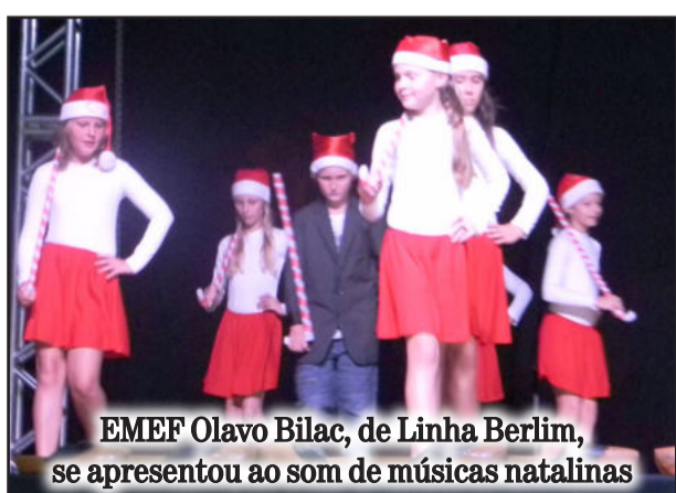
EMEF Olavo Bilac, de Linha Berlim, se apresentou ao som de músicas natalinas