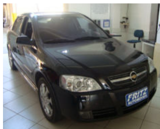
Astra Hatch 2.0 R$ 34.000,00