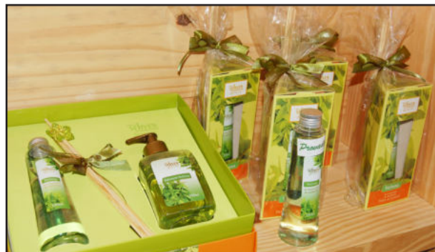
Kits para presentes compõem linha de produtos