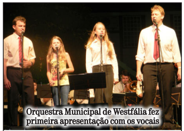
Orquestra Municipal de Westfália fez primeira apresentação com os vocais