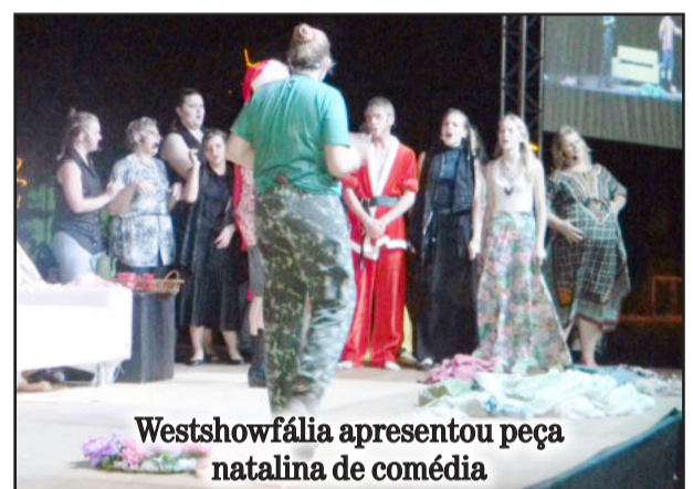
Westshowfália apresentou peça natalina de comédia