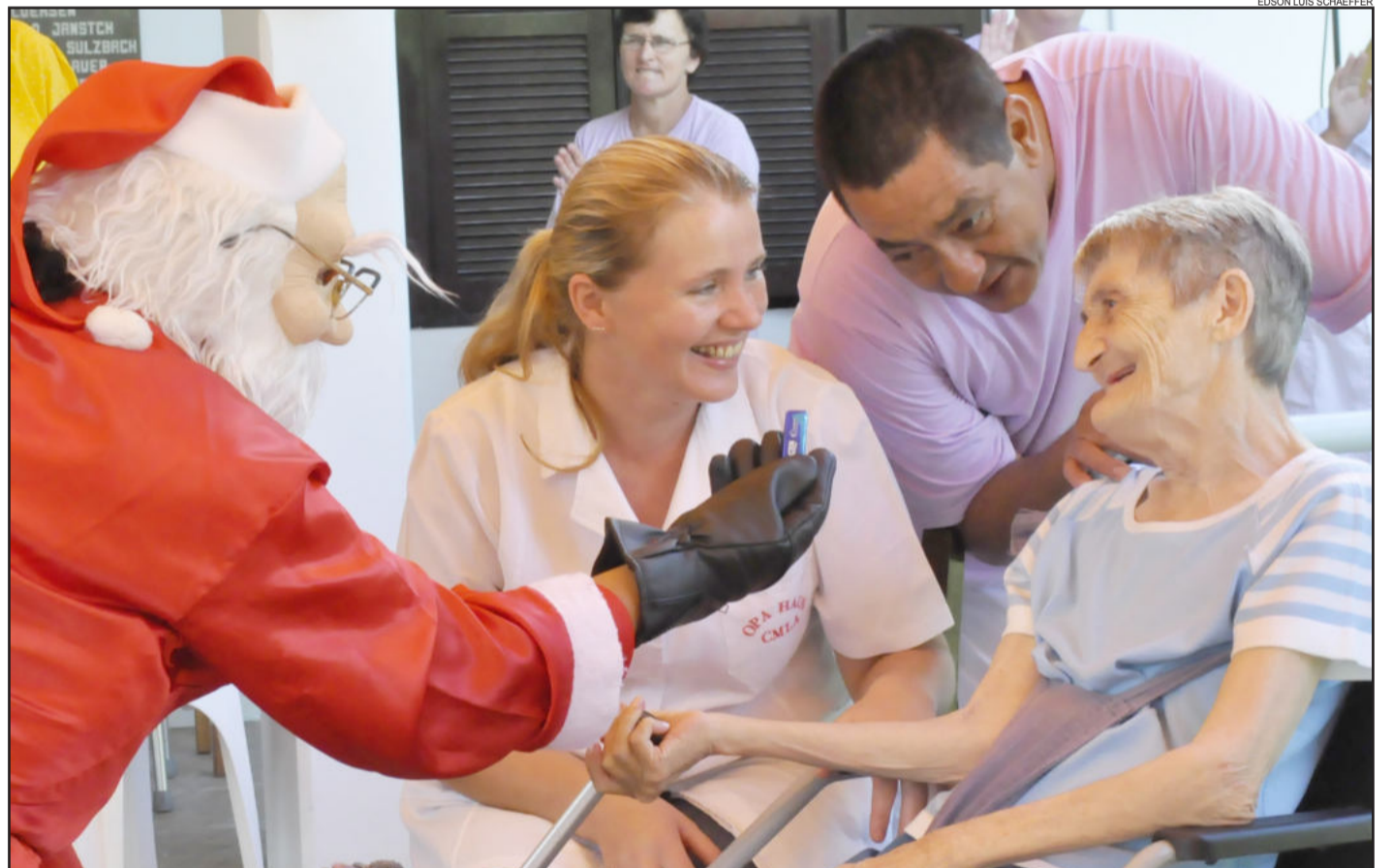
Idosos do Opa Haus, em Teutônia, tiveram programação especial ontem pela manhã. Contracapa