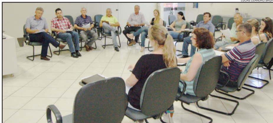
Reunião tratou dos preparativos para a Festa de Maio 2014