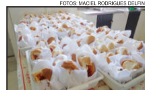
Cachorros quentes prontos para a garotada