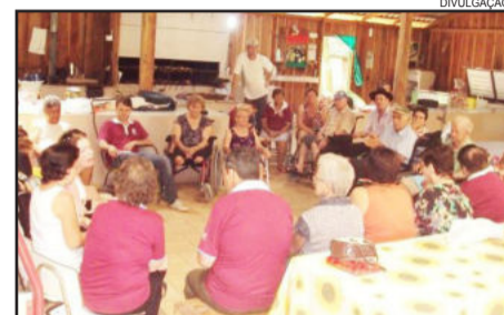
Grupo se reuniu para confraternizar

No dia 20 de dezembro, ocorreu a confraternização de final de ano do grupo dos PCDs, na sede social da Hípica Reckziegel, em Santa Manoela. As atividades iniciaram pela manhã com reunião, quando os participantes realizaram uma retrospectiva dos acontecimentos do ano, das atividades realizadas, bem como troca de ideias entre ambos.