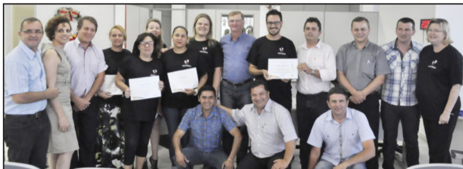
Vereadores homenageiam equipe do PIM

de Saúde, pude regulamentar, através de concurso público, fazendo com que nenhuma administração extinga este importante trabalho. Assim como as agentes de saúde, vocês estão ali, com sol ou chuva, indo de casa em casa fazendo a escuta, observação, o acolhimento, dando carinho, afeto e orientação. Sei que é um trabalho especial, de formiguinha, de forma silenciosa, mas que faz grande diferença na sociedade, para as famílias", destacou a partir da tribuna.