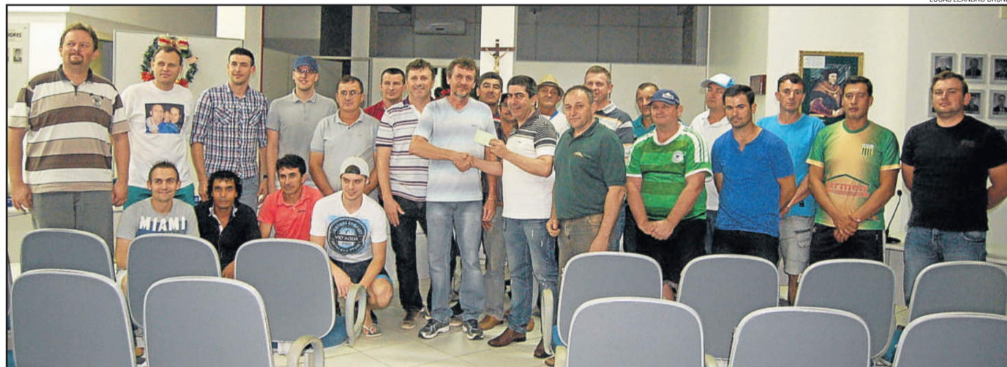
Clubes entregaram valor de R$ 10 mil (de multas e taxas) ao Hospital Ouro Branco para custeio do leite por um ano

Ele reforçou que todos os hospitais passam por dificuldades e que “este foi o ano mais difícil dos 45 anos da ABOB. Bom que as pessoas enxergaram que o hospital pertence à comunidade e fizeram algo. Foi uma das melhores notícias do ano porque termina com uma doação de recursos que não esperávamos. É um fato histórico em Teutônia, pois nestes 24 anos que moro aqui, primeira vez que os clubes de futebol repassam recursos a uma entidade. De grão em grão procuramos manter as portas abertas para fazer o hospital que queremos para nossas comunidades”, concluiu o presidente.