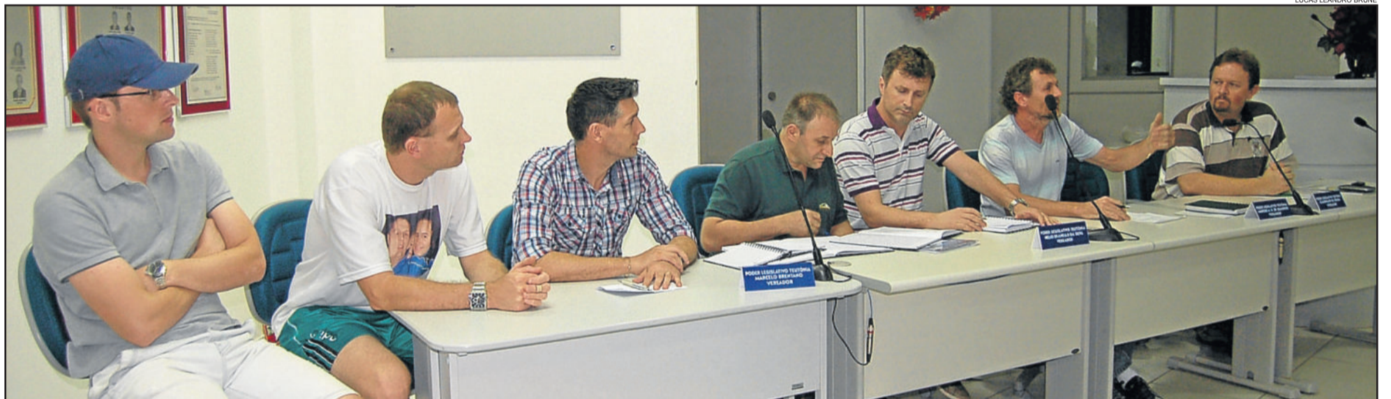
Diretoria eleita para comandar a ACATE conta com renovação e presença de jovens líderes