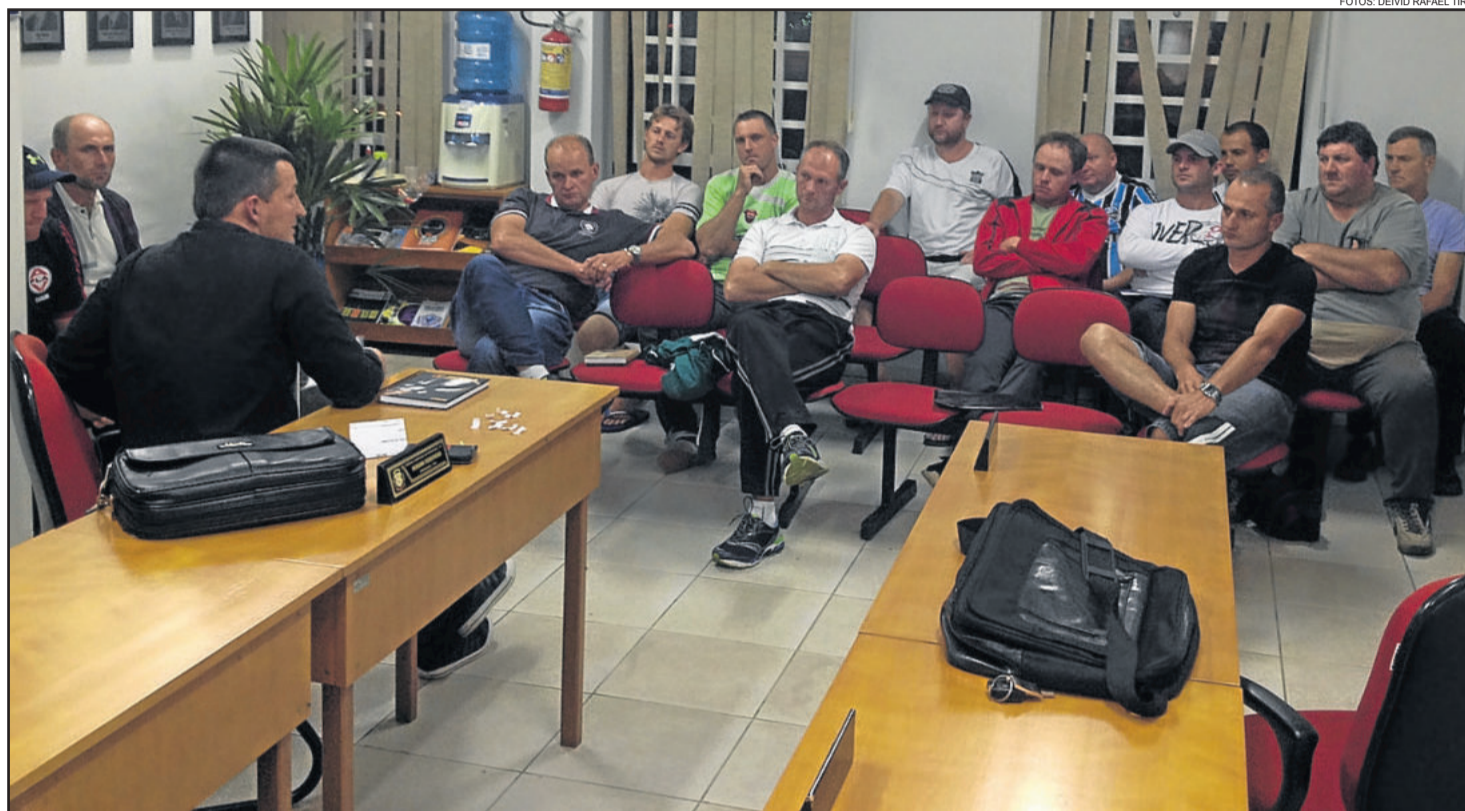
Encontro foi realizado na Câmara de Vereadores de Westfália

tar com 21 jogadores (16 atletas considerados de casa + 5 atletas de fora). Nos aspirantes, a novidade é a possibilidade de utilizar atletas a cima da idade (16 atletas com até 24 anos + 5 atletas de idade livre).