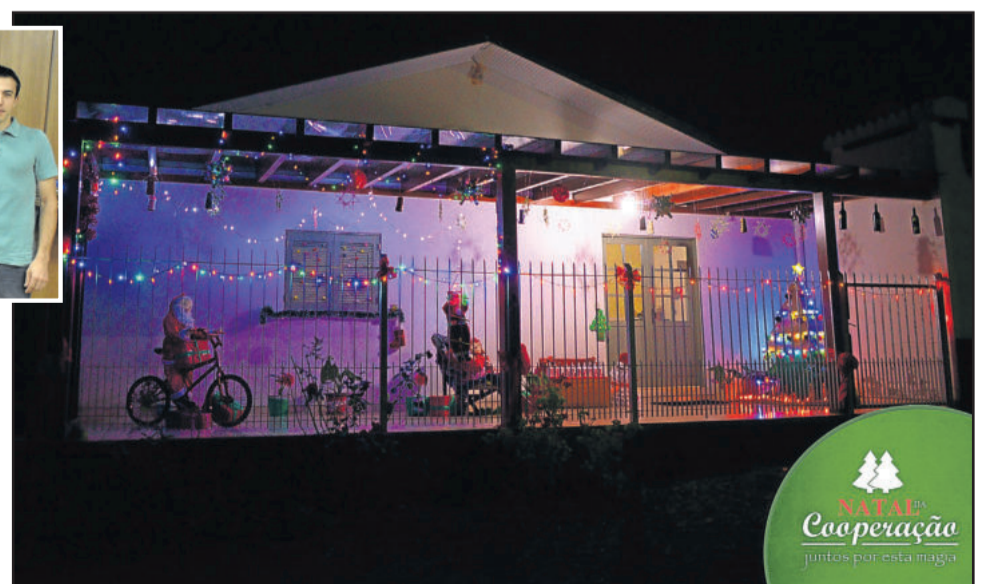
3ª colocada: Liria Angst do Bairro Alesgut