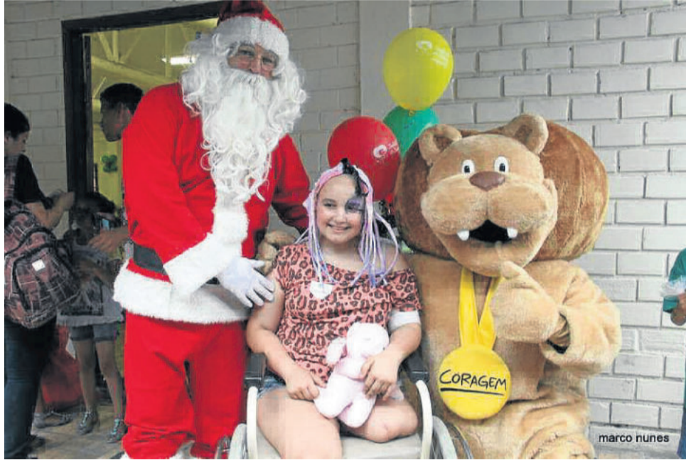
Com perna mecânica, Papai Noel fica ao lado de menina que amputou a perna em razão do câncer