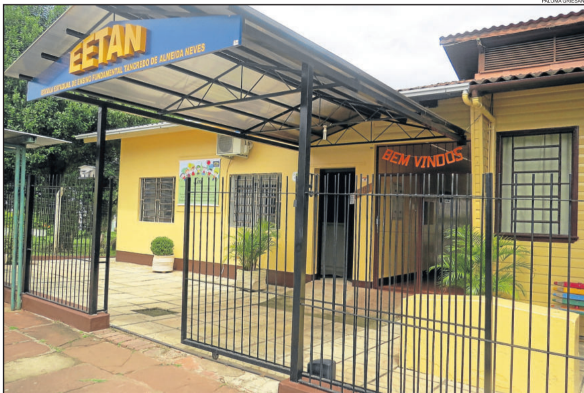
Na Escola Estadual de Ensino Fundamental Tancredo Neves, os alunos receberam as boas-vindas logo na entrada

A segunda-feira foi dia de retomar as atividades também nas escolas estaduais. Na Escola Estadual de Ensino Médio Reynaldo Affonso Augustin, maior escola do município, localizada no Bairro Canabarro, cerca de 1.200 alunos eram aguardados. Na Escola Estadual de Ensino Médio