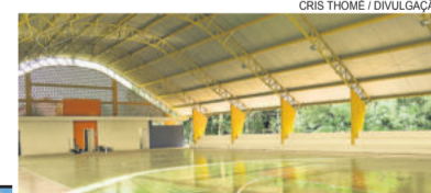
Quadra coberta na Escola Arco-Íris

Mais informações podem ser obtidas pelo telefone (51) 3754-1130, em horário de expediente.