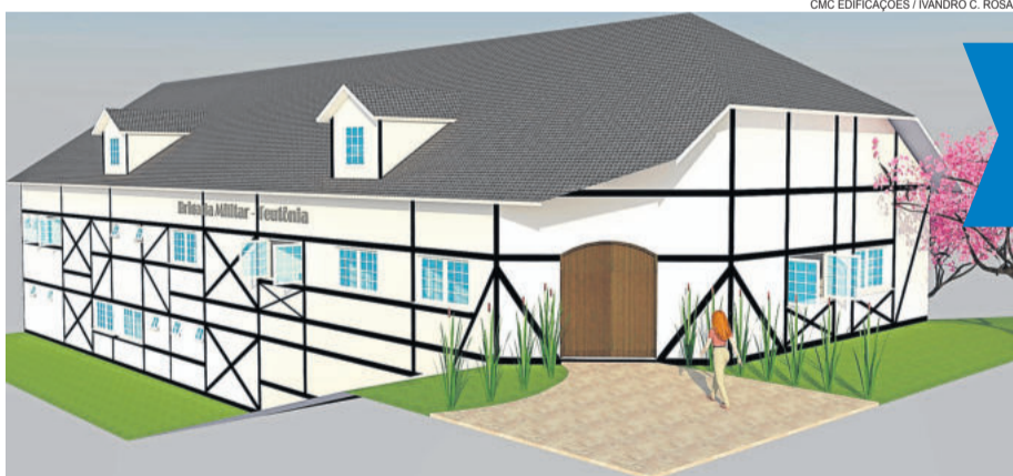
CMC EDIFICAÇÕES / IVANDRO C. ROSA