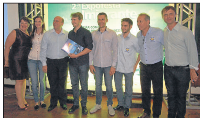
Lançada oficialmente a 2ª Expofesta

Show Infantil Com Peppa Pig E Os Três Porquinhos Show Com Banda Luauê Show Com Banda Alma Nova Banda Brilha Som Show Com Tchê Guri Dj Karamelo