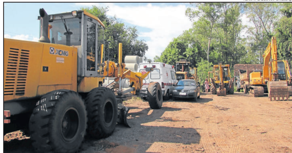
Máquinas e veículos do Edital de Leilão

LOTE 33 - Pá Carregadeira Frontal de Rodas Hyundai HL 730, ano 2010/2010, Série 0110444 NUM/SH 84295199.