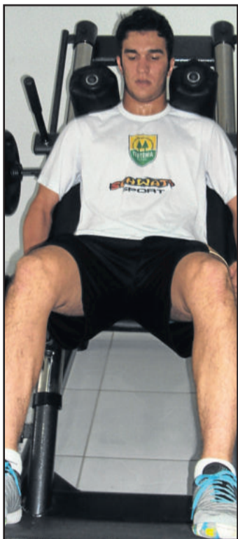
Lelê se recupera de lesão e está fora

Morruga terá vários desfalques para a partida desta noite