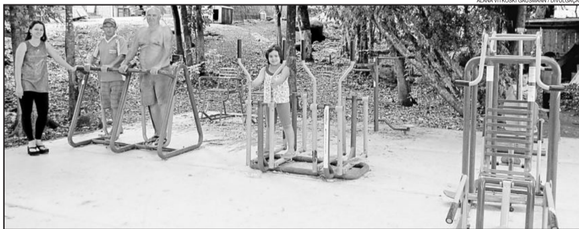
Academia ao ar livre reimplantada no Bairro Alesgut