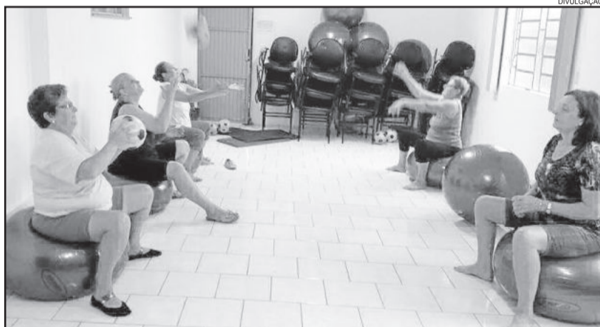
Equipe do ESF Santo André incentiva moradores a ter uma vida mais saudável

Atualmente o grupo é formado por cerca de 20 participantes. Mais informações pelo telefone (15) 3982 1141.