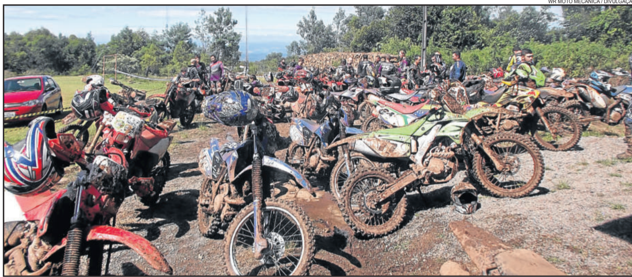
427 motocicletas estiveram inscritas na edição deste ano

A largada foi dada no Centro de Westfália por volta das 9h30min, somente em uma bateria. “Antecipamos um pouco a largada em razão da quantidade de trilheiros. A comissão organizadora foi orientando, enquanto que os participantes chegavam, para