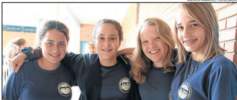
Grupo sempre unido: na mesma série há vários anos

tervalo mais longo a decoração na escola foi feita para receber os professores e os 550 estudantes. “São palavras de