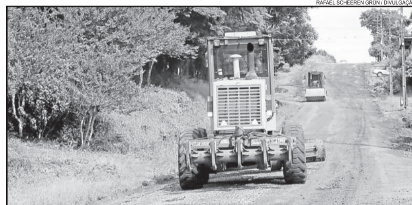
Serviço, como o patrolamento na Rua Henrique Stein Filho, terá prosseguimento durante a semana