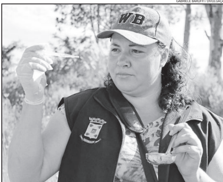
Acompanhamento em residências e terrenos de todos os bairros da cidade