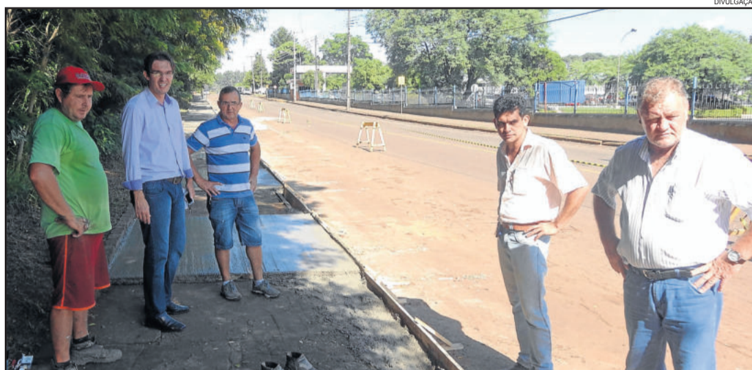
Calçada da Rua Erno Dahmer, no Bairro Alesgut, recebe melhorias

São 380 metros de extensão por 2,20 metros de largura, totalizando 836 metros quadrados de obra. Para executar a obra, o Município de Teutônia comprou o material (concreto) via licitação na modalidade registro de preço e contratou a mão-de-obra em separado. Conforme o setor de compras, desta forma a obra sai mais barata para os cofres públicos.