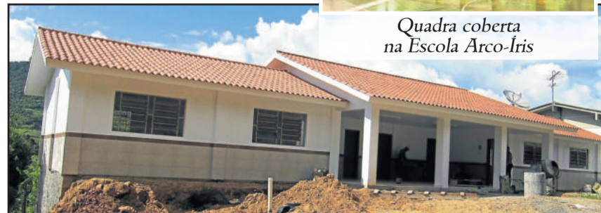
Salas de aula na Escola Santo Antônio