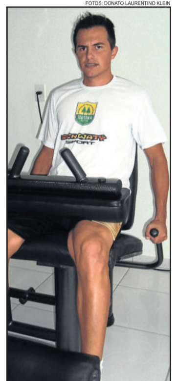
O ala Gauchinho está liberado

O jogo amistoso será disputado no Ginásio da Água. O início da partida está previsto para as 20h30min e terá a transmissão da Rádio Popular 96,9 FM.