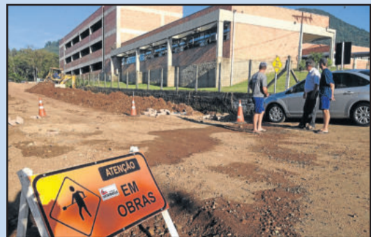
Obras contam com apoio de equipes da Administração Municipal