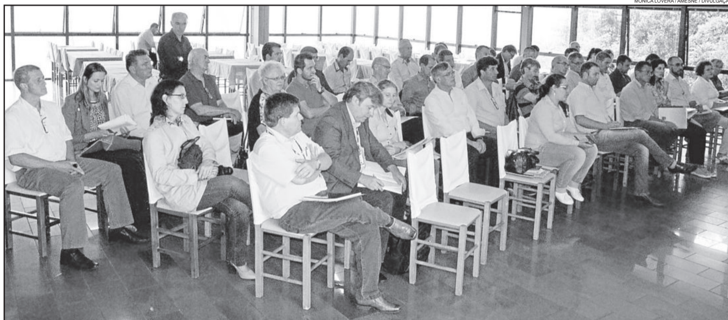
Autoridades da Amesne se reuniram e confirmaram a instalação do campus da UFRGS na Serra

O terreno está localizado em área nobre, a 5km de Garibaldi, 8km de Bento Gonçalves, 10km de Carlos Barbosa, 10km de Monte Belo