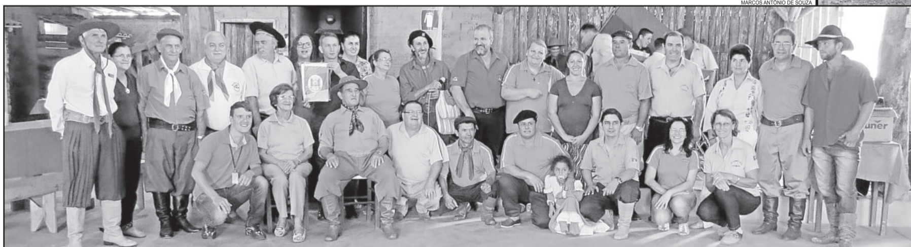
Homenageados com a patronagem da entidade