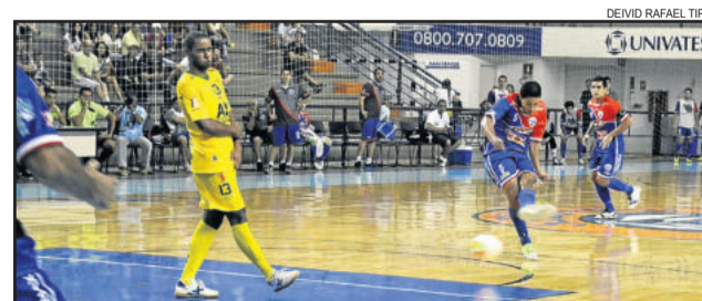
ALAF questionou a arbitragem