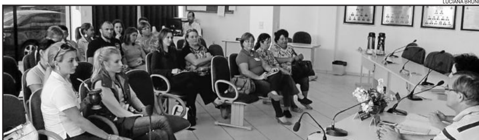
Reunião de planejamento foi nesta segunda

É importante que todas mulheres venham com roupas e calçados confortáveis, próprios para atividade física, para que possam desfrutar das atividades com o conforto necessário.