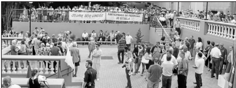
Reinauguração da escadaria reuniu estrelenses e comunidade regional

Em uma cerimônia marcada por surpresas e emoção, a