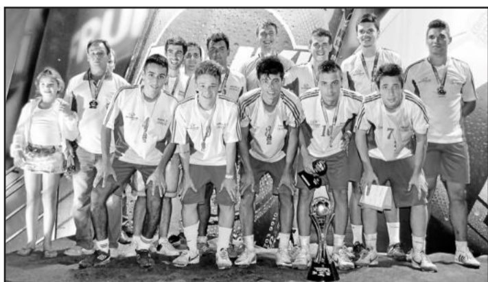
Amigos do Queiroz, vice-campeão Força Livre