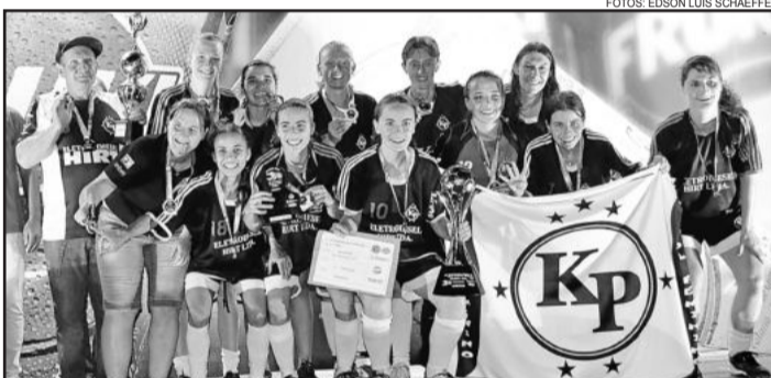
EletroDiesel Hirt/Ki Poder, campeã Feminino