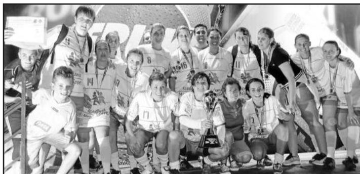
Academia Mega Sports, vice-campeã Feminino

Amigos do Queiroz perdeu para o Kaxa Baxa