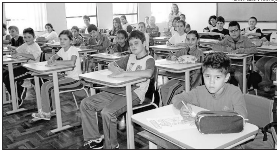
Escola Municipal Pedro Cattani é a primeira da Serra a integrar o Programa de Escolas Associadas

A escola Pedro Cattani, está localizada no bairro Santa Terezinha e atende 321 alunos, da Educação Infantil ao Ensino Fundamental, conta com uma equipe de 37 professores e funcionários e neste ano trabalha o Ano Internacional da Luz, conforme o programa da Unesco.