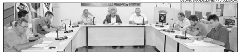
Sessão extraordinária foi realizada na sexta-feira à noite

PROJETO DE LEI LEGISLATIVO Nº 06/2015 - que “Concede revisão anual geral e aumento real aos valores básicos dos vencimentos dos Servidores do Poder Legislativo Municipal”.