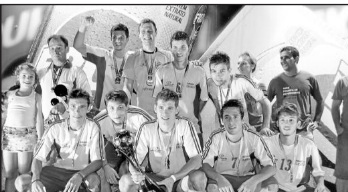
Ruverim/Amigos do Queiroz, campeão Sub-20