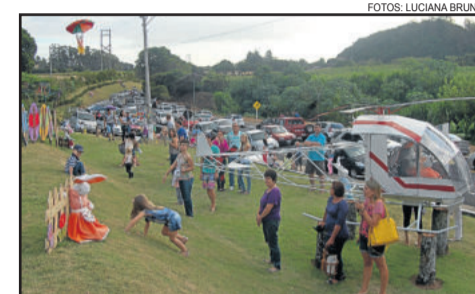
Muito público e ruas lotadas para admirar a decoração