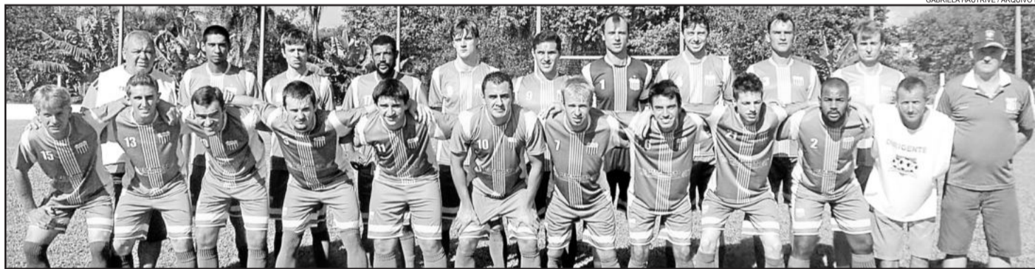
Ouro Verde do Bairro Alesgut surpreendeu o Fluminense na Harmonia

Na Chave A, o Alto Taquari fez 7 a 0 no Ribeirense, reassumiu a vice-liderança e chegou mais perto da vaga. Na última rodada, o clube de São Jacó vai até Linha Germano para enfrentar o invicto Flamengo e só a vitória garante o Alto Taquari. O Catarinense joga na Linha Ribeiro e se vencer pode atingir os 10 pontos, que não necessariamente confirmam a vaga. O próximo domingo será incrível, de muitas contas e olhar voltado para os critérios de desempate, como a disciplina.