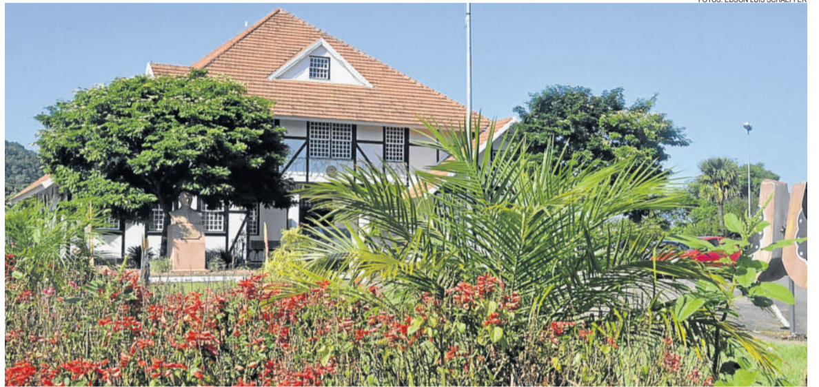
Traços da cultura dos imigrantes westfalianos são encontrados em vários pontos do município

Conforme o coordenador, o westfaliano era uma das línguas faladas pelos grupos saxões. “Na época, Carlos Magno apelidou a região dos saxões de Westfália. Esse nome ficou. Depois, o povo saxão passou a se autodenominar de westfaliano. E