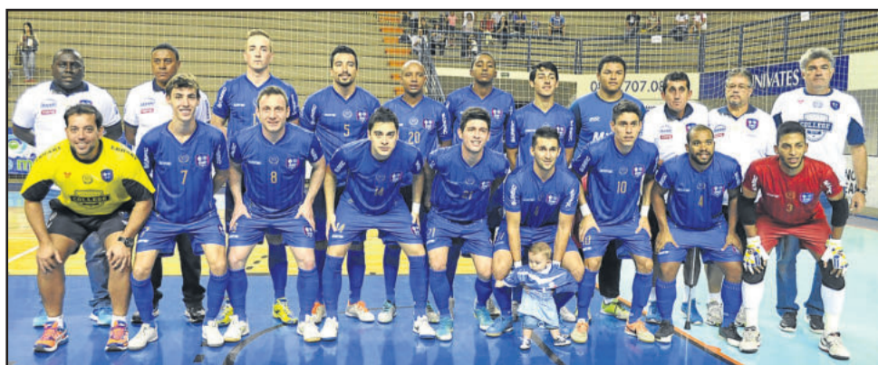
Com mais uma derrota na Copa dos Vales, a ASSAF aguarda a definição do seu adversário na disputa pela terceira colocação