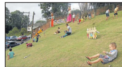
Carrinho de lomba de papelão foi diversão das crianças

Praça dos Pássaros oferece vários atrativos