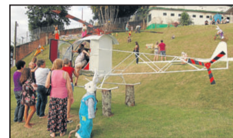
Helicóptero é uma das atrações