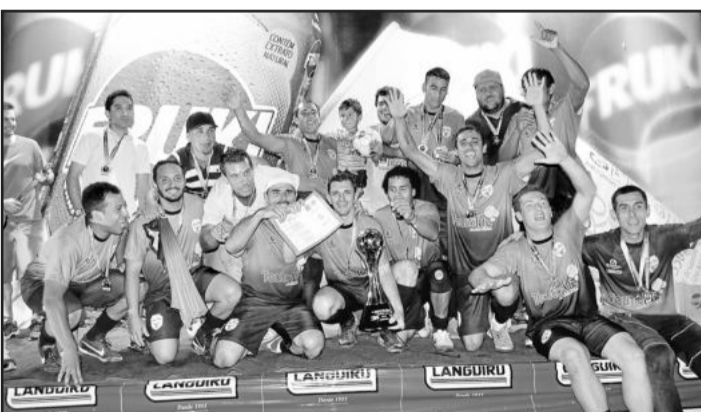
Kaxa Baxa/Amaral DPVAT, campeão Força Livre