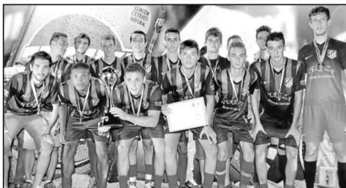
Brocadores, vice-campeão Sub-20