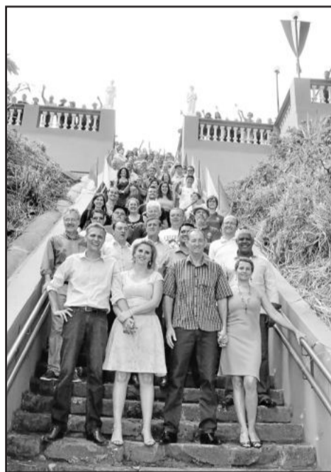
Comunidade reconstituiu foto feita em 1924, quando foi inaugurada a escadaria