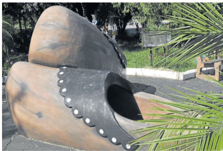
Além do dialeto e calçado, o sapato de pau está presente em forma de monumento

A partir da reescrita e da discussão palavra por palavra, o grupo viu que podia ir além e fazer algo que poderia evitar que muitas palavras do dialeto fossem perdidas ou ficassem incompreendidas: a criação de um dicionário. “Já concluímos a letra A, que é composto por mais de 200 palavras. Escrevemos a palavra em sapato-de-pau, em seguida no alemão e no português. Agora, já estamos praticamente concluindo a letra B. Assim, vamos construindo este dicionário ao longo do tempo”, ressalta.