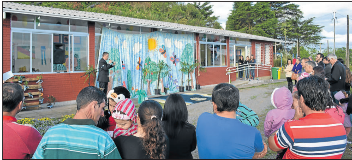
Comunidade de São Sebastião de Castro foi beneficiada com nova escola e academia ao ar livre

Tudo isso já pode ser usufruído gratuitamente pela comunidade, que conta com quatro aparelhos a sua disposição: um multi-exercitador, um simulador de caminhada duplo, um simulador de bicicleta duplo e um espaldar, além de dois bancos de praça.