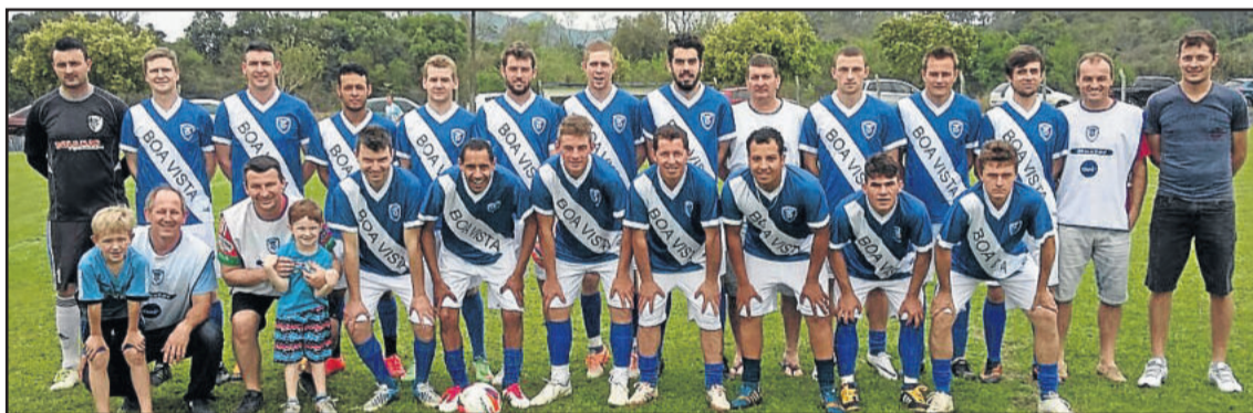
Boa Vista ganhou por 2 a 0 do Independente de Paverama