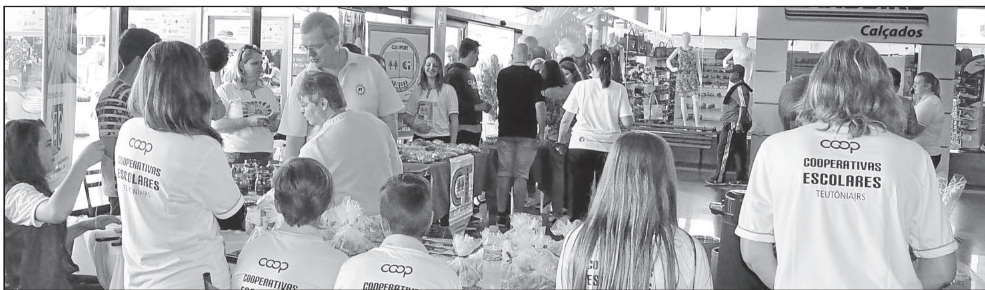
Cooperativas escolares expuseram e comercializaram seus objetos de aprendizagem no Supermercado Languiru do Bairro Languiru