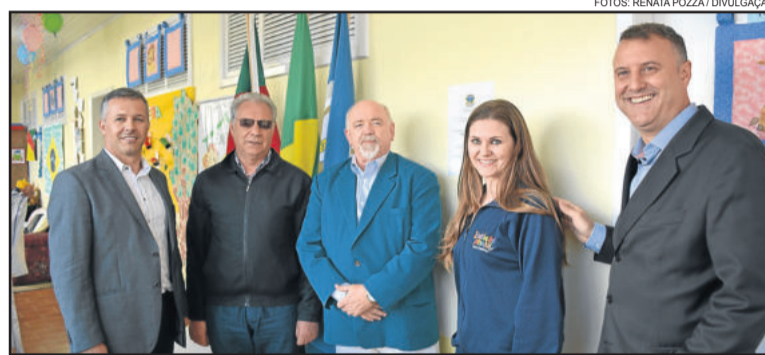
Autoridades municipais participaram da entrega do educandário à comunidade

A estrutura passou por reformas, realizadas pela Secretaria de Projetos e Obras Públicas, e hoje tem capacidade para atender 30 crianças de dois a cinco anos. O valor total do investimento da Administração Municipal foi de R$ 67.382,72. Com este montante, foi feita a adaptação da estrutura física para Escola de Educação Infantil, tendo sido reformados os sanitários, refeitório, instalações