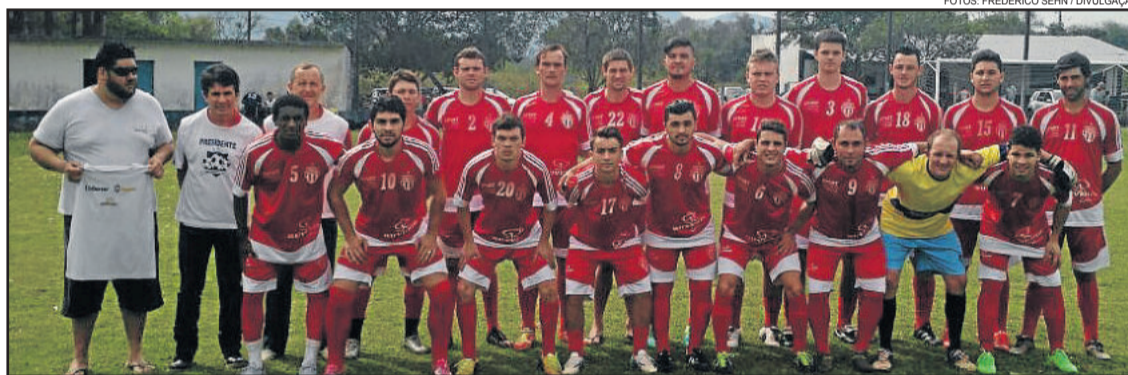
Atlético Gaúcho ganhou do Floriano na semifinal