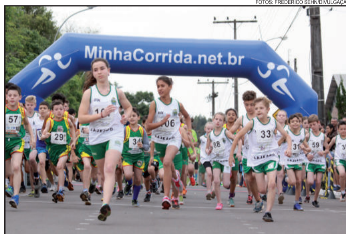
Categorias infantis também integraram a competição