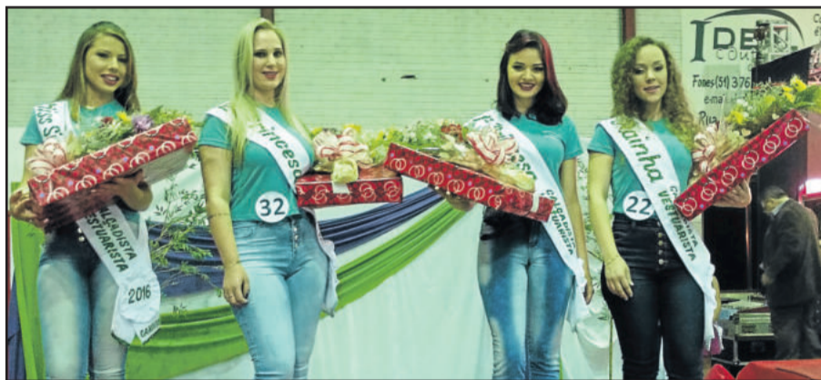
Corte Garota Calçadista