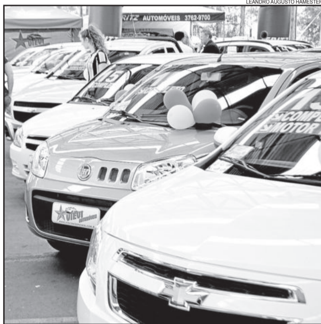
Além das vendas realizadas durante o Feirão, revendas ainda receberam clientes em potencial para outros negócios para fechamento a partir desta semana