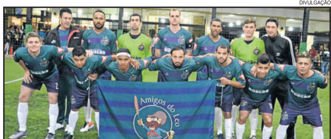
Amigos do Léo