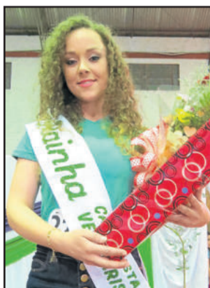
Garota Calçadista 2016