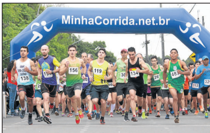
Competição teve a participação de 400 atletas