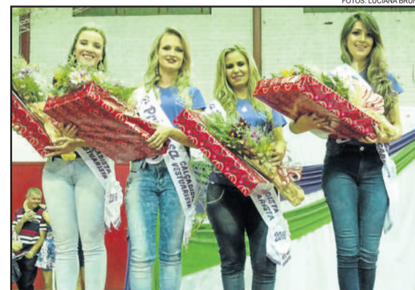
Corte Mulher Calçadista