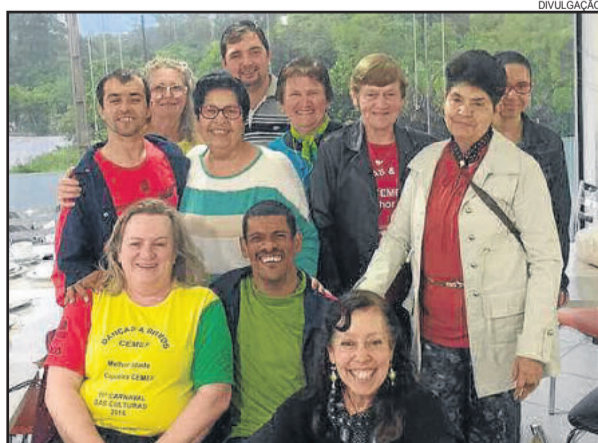
Galera presente na festa