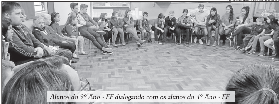
Alunos do 9º Ano - EF dialogando com os alunos do 4º Ano - EF