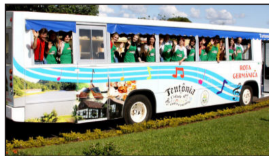
Turismóvel permite passeio dos teutonienses pelos pontos turísticos