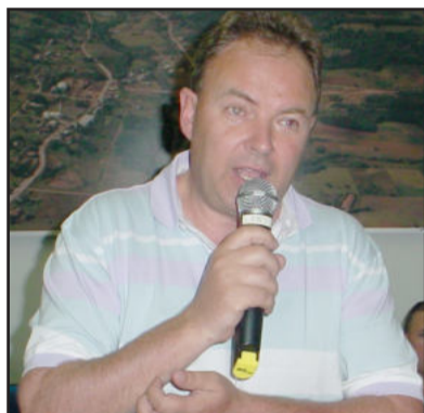
Prefeito de Poço das Antas, Ricardo Luis Flach

Flach também avaliou a mobilização realizada na Assembleia Legislativa da semana passada. "Acredito que vamos colher frutos", destacou. O prefeito ainda enfatizou o apoio recebido dos vereadores: "agradeço o apoio que venho recebendo de vocês vereadores. Assim fica menos difícil a nossa tarefa", finalizou.