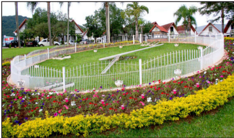
Centro Administrativo e o primeiro relógio de flores do Brasil, ainda em funcionamento

Para comemorar o 10º aniversário da rota turística, a Secretaria Municipal de Cultura e Turismo e a Associação da Rota Germânica organizam uma programação especial para o dia 26 de outubro de 2011, tendo como local um dos pontos turísticos mais visitados de Teutônia, que é a Lagoa da Harmonia. A programação inicia às 20 horas, com homenagens, apresentação do histórico e a posse do Conselho Municipal do Turismo.