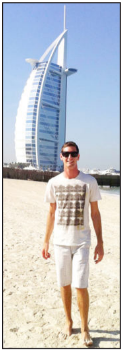
Imigrantense agora retorna a Dubai para trabalhar

De 2008 a 2010, disse ter "descoberto o Mundo", quando estudou línguas e trabalhou na Austrália. No retorno ao Brasil, em dezembro de 2010, como turista, conheceu Dubai, o que considera "uma cidade moderna e fantástica". Agora retorna àquela cidade, sede da empresa para a qual vai prestar serviços e encarar os desafios de uma nova profissão.