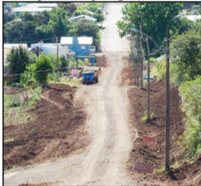
Rua Pastor Henrich Brackmeier receberá pavimentação

A Administração Municipal de Imigrante autorizou o início de nova etapa de pavimentação asfáltica em três ruas do Município, num investimento total estimado em R$ 674 mil, com recursos próprios e do Ministério das Cidades. Inicialmente serão contemplados dois perímetros, na Sede e no Bairro Esperança e, posteriormente, um no Bairro Daltro Filho. Se as condições climáticas estiverem favoráveis, o serviço de terraplenagem, microdrena-