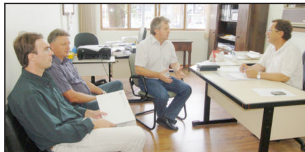
No DAER, Município pede melhorias na RS-419

encaminhou o assunto com a equipe para que sejam adotadas as medidas o mais rápido possível.