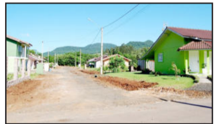
Rua 7 de Setembro também receberá melhorias

- Rua 7 de Setembro, no Bairro Esperança, em área de 752 metros quadrados, e Rua Pastor Henrich Brackmeier, parte 2, na Sede, em área de 968 metros quadrados. Valor da obra: R$ 210.037,80. Recursos da União Federal, por intermédio do Ministério das Cidades, com ações relativas à Gestão da Política de Desenvolvimento, através de emenda parlamentar do deputado federal Renato Molling (PP), no valor de R$ 150 mil, sendo a contrapartida de R$ 60.037,80 com recursos próprios do Município de Imigrante.