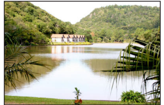
Lagoa da Harmonia é o ponto turístico mais visitado de Teutônia

Passou-se então a inventariar os possíveis empreendedores na área do turismo e após quase dois anos de estudos e planejamento, inaugurava-se, em outubro