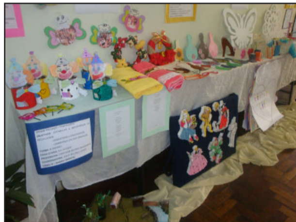
Trabalhos podem ser visitados até dia 28