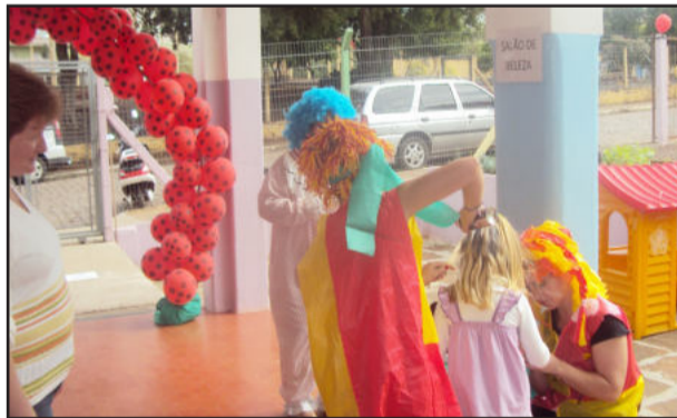
Palhaços animaram as crianças