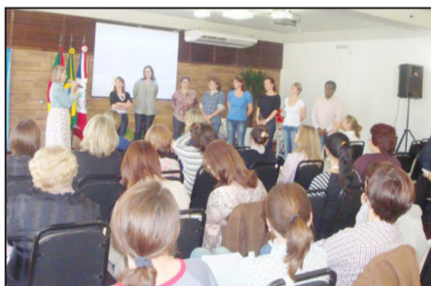
Diversas palestras integraram a programação