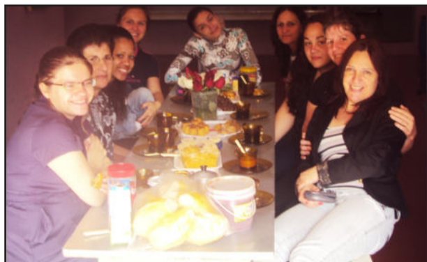
Lanche para homenagear as professoras

A escola agradece a participação de todos os pais que vieram na festa e acompanharam seus filhos neste momento especial.