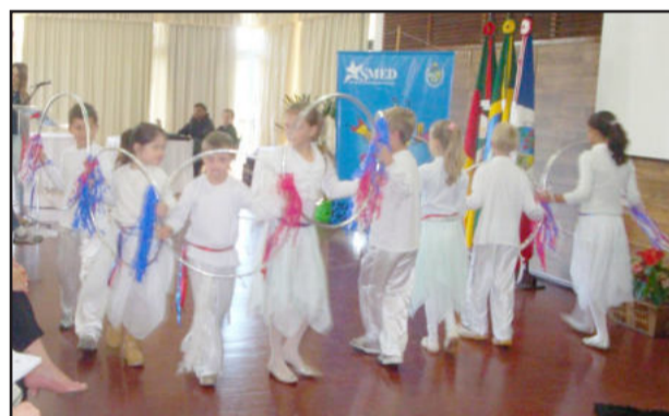
Seminário Educação Inclusiva