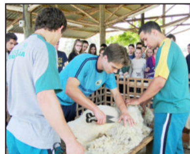
Alunos terão a oportunidade de acompanhar atividades práticas promovidas pelos cursos técnicos do Colégio Teutônia

Na quarta-feira, dia 26, a programação será específica para alunos de escolas de Teutônia. Já na quinta-feira, dia 27, haverá recepção especial para estudantes de Westfália, Imigrante, Colinas, Poço das Antas, Cruzeiro do Sul, Santa Clara do Sul, Marques de Souza, Estrela, Bom Retiro do Sul, Paverama, Fazenda Vilanova, Salvador do Sul, Brochier, Maratá e Boa Vista do Sul. Haverá atividades nos turnos da manhã, tarde e noite.