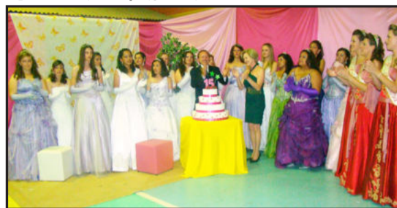
Prefeito, primeira-dama, debutantes e soberanas cantaram o parabéns

O baile de aniversário do município fez parte da programação de 15 anos de Fazenda Vilanova. Foi realizado pela Administração Municipal, com o apoio do Departamento de Cultura e Secretaria da Saúde, Cidadania e Atenção Social. Para comemorar o aniversário, foram realizadas, nas últimas duas semanas, diversos eventos para bebês, crianças, jovens, adultos e terceira idade.