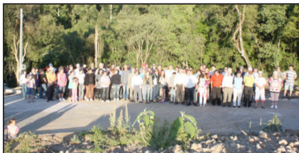
Moradores e autoridades