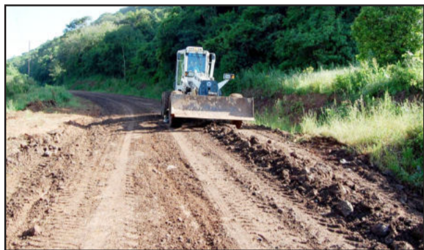
Estrada da Linha Garibaldi recebeu melhorias

Com o fim do inverno e do acentuado período de chuvas, a Secretaria Municipal de Obras, de Imigrante, iniciou em ritmo mais intenso os serviços de recuperação de estradas do interior. Nas últimas duas semanas foram contempladas com melhorias as localidades de Linha Ernesto Alves, Linha Rechts, Linha Fassini e Linha Garibaldi, no acesso a Coronel Pilar. Até o final deste mês as estradas da Linha Herval também deverão receber melhorias.