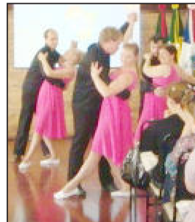
Apresentações de danças durante o Seminário