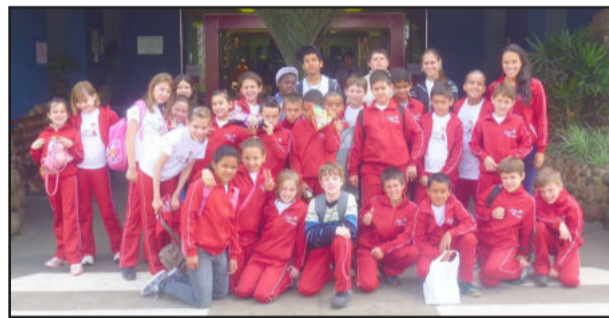
Grupo que participou da atividade

O Projeto Salvar Vidas - Bombeiros Mirins é uma iniciativa da Prefeitura, por intermédio da Secretaria de Esportes e Lazer (SMEL) em parceria com o Corpo de Bombeiros. Os encontros ocorrem todas as terças e quintas-feiras na sede do Corpo de Bombeiros de Estrela.