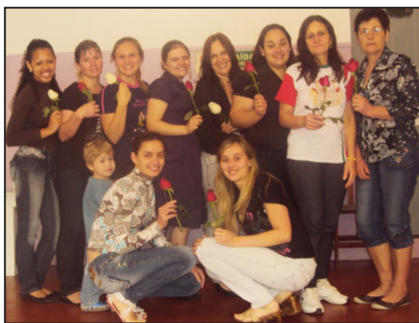
Rosas para as educadoras