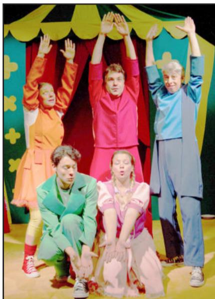
Caravana dos Poupedis

De acordo com a política de sustentabilidade do Sicredi, todo o material utilizado nos figurinos, cenários e adereços será basicamente reciclável, além da iluminação que privilegiará efeitos com luz de LED, que exige um baixo consumo de energia. A Caravana dos Poupedis tem o apoio do Ministério da Cultura, através da Lei Rouanet.