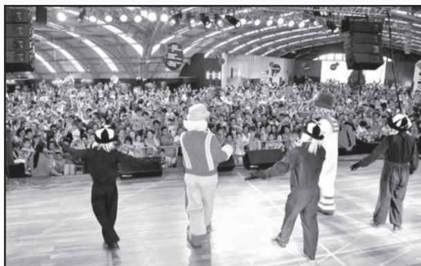
Fenachamp alcança 50 mil visitantes nos três primeiros finais de semana que teve como atração principal a dupla de palhaços Patati-Patatá

A CIC será sede nesta semana, de 25 a 27, da sétima edição do Concurso do Espumante Brasileiro, organizada pela Associação Brasileira de Enologia (ABE). O evento promove e avalia