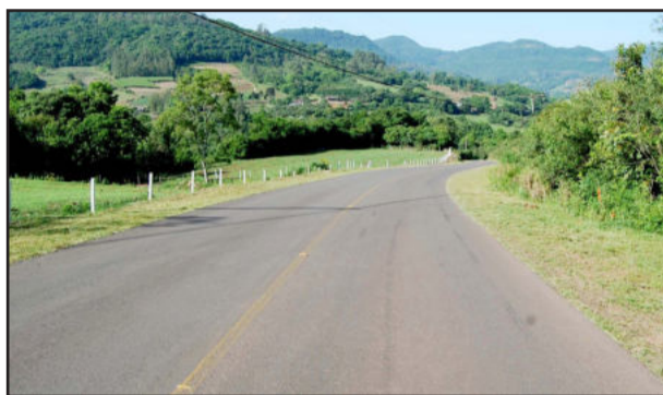
Laterais das rodovias estão "limpas"