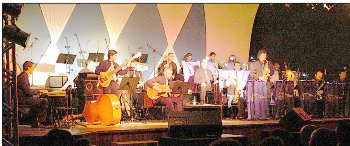
Orquestra Municipal de Garibaldi