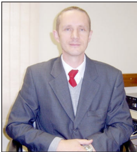
Promotor de Justiça de Teutônia, Jair João Franz

Ou seja, o caso ainda merece uma análise, um estudo, de parte do próprio Ministério Público. O promotor, todavia, alerta que queimar não pode, então, entre queimar e colocar no Aterro Sanitário, sempre colocar no aterro, mas sempre esgotando todas as possibilidades.