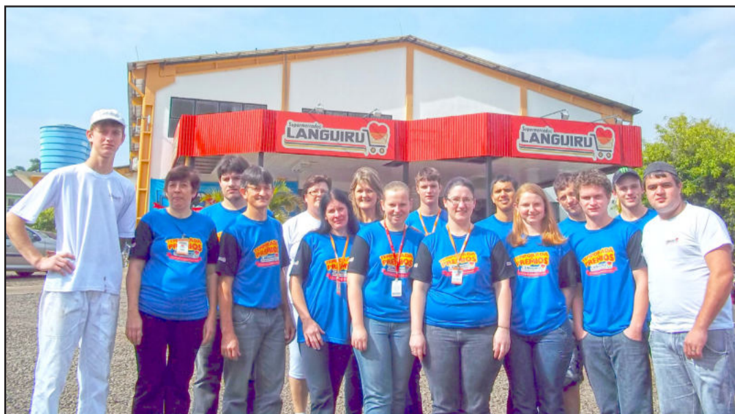
Sorteio em Poço das Antas será na quarta-feira