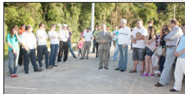
Prefeito Cirano Cisilotto (c)