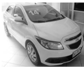
Onix LT 1.4, 4 P. Consulte

Aberto de segunda a sexta das 8h às 18h30min. Sem fechar ao meio dia e nos sábados das 8h às 16h.