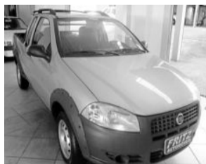
Strada Working 1.4 Consulte