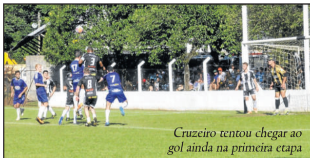
Cruzeiro tentou chegar ao gol ainda na primeira etapa