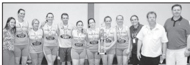
2º Lugar Feminino: Amigas e Rivais