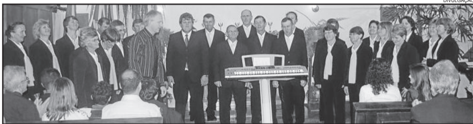
Encontro de corais ocorrerá na Igreja Evangélica de Colinas

Após as apresentações será servida uma janta no Centro Comunitário de Colinas. As reservas de janta poderão ser feitas com Líris Terezinha Brentano, pelo telefone 3760-1092. O encontro é aberto à comunidade. Na noite também terá uma exposição de todas as fotos que participaram do 6º Concurso Fotográfico. As fotos vencedoras estarão em destaque.