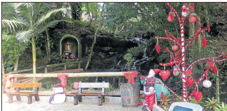
Gruta Nossa Senhora de Fátima transformada num espaço de lazer, religiosidade e turismo