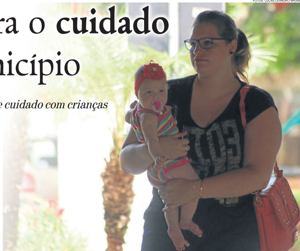
Mães trouxeram filhos para o Dia do Bebê