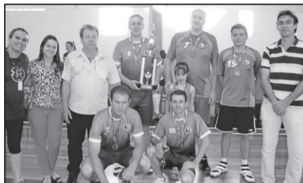
2º Lugar Masculino: Colégio Teutônia