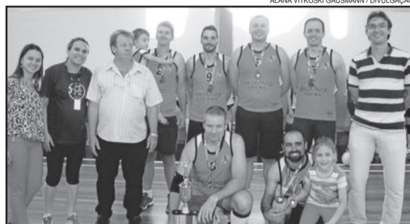
Campeão Masculino: Academia Pró Fitness