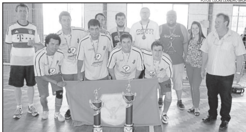
Kaxa Baxa, campeão e campeão da disciplina

No segundo tempo, o Kaxa Baxa tomou a iniciativa do jogo e pulou à frente aos 6 minutos, com gol de Dari. O goleiro Éverson, do Amaral DPVAT, ainda efetuou importantes defesas e evitou a am-