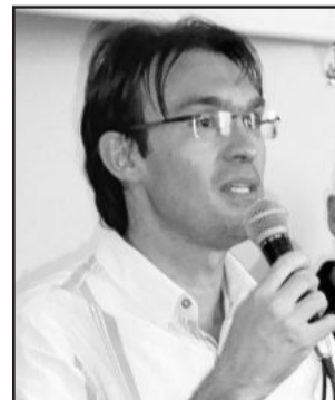
Vice-prefeito Evandro Biondo