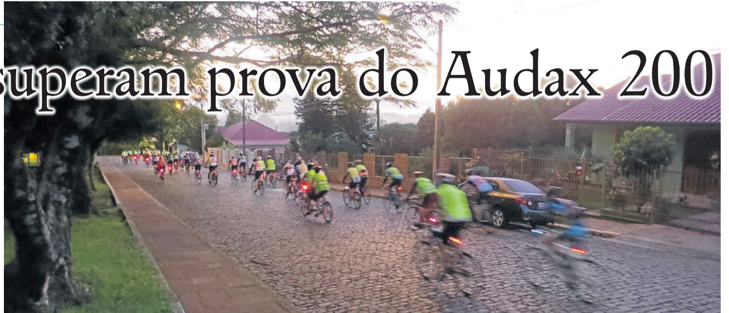
Circuito iniciou às 6h e durou até as 19h30

Audax não é uma competição, mas uma prova de longa distância de cicloturismo, em que não é necessário ser um ciclista de alto rendimento. Exige apenas resistência e superação de limites. A edição de Teutônia foi organizada pela Teutônia Ciclismo e é válida para a temporada de 2015 e para Paris-Brest-Paris. O clube teutoniense já tem, inclusive, novos desafios programados para janeiro, fevereiro, março e outubro do ano que vem.