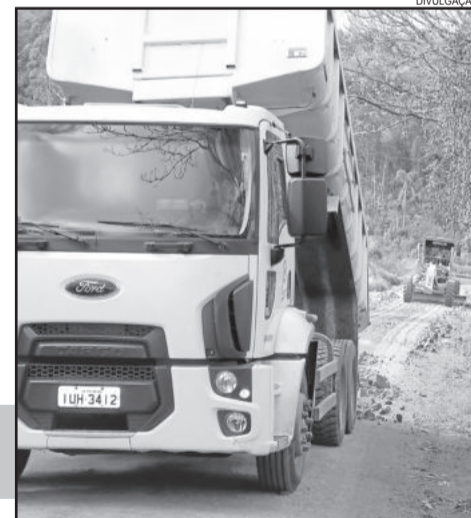
Maquinas trabalhando no interior do Município

O trabalho de revitalização compreende a reestruturação dos trechos do interior da cidade, com serviços de patrolagem, nivelamento, colocação de saibro e abertura das saídas de água.