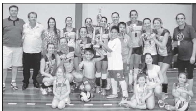
Campeão Feminino: Lajopisos