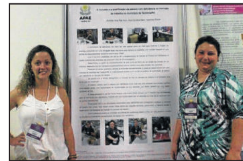
Case de Teutônia apresentado no evento

O case da Apae local foi muito fotografado e elogiado, inclusive já foram combinadas algumas visitas de APAEs do Rio Grande do Sul que pretendem visitar Teutônia e conhecer melhor esse trabalho. "Podemos dizer que foi um sucesso, principalmente porque na área da inclusão laboral o tema está sendo muito discutido, debatendo como preparar a empresa e os alunos para a inclusão", explicou a diretora. O projeto está em sua primeira turma