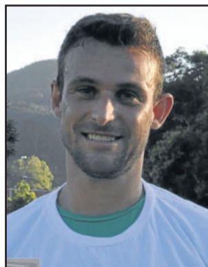
Goleiro Leco, do Cruzeiro, Craque do Jogo