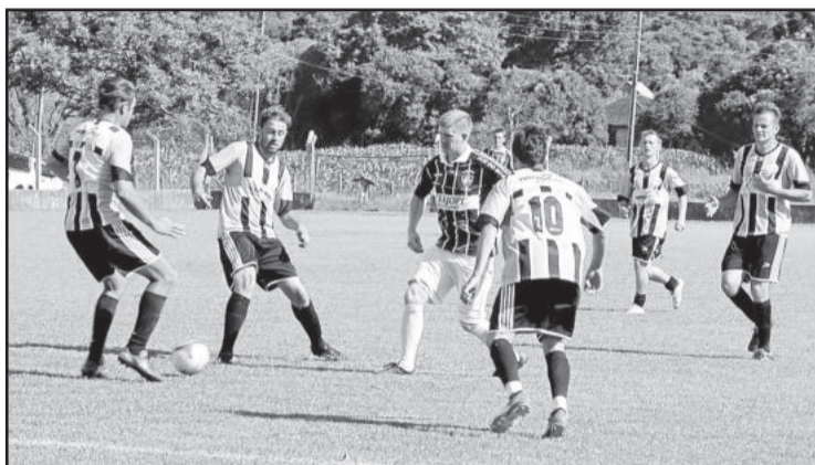
Na disputa do terceiro lugar, Catarinense venceu ao Fluminense por 4 a 3

Em comum acordo entre os presidentes finalistas, durante a realização do primeiro jogo, a segunda partida da final foi novamente remarcada para o próximo domingo, dia 30 de novembro, no campo do Boa Vista.