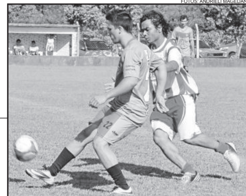
Internacional venceu por 1 a 0 e joga pelo empate para ser campeão