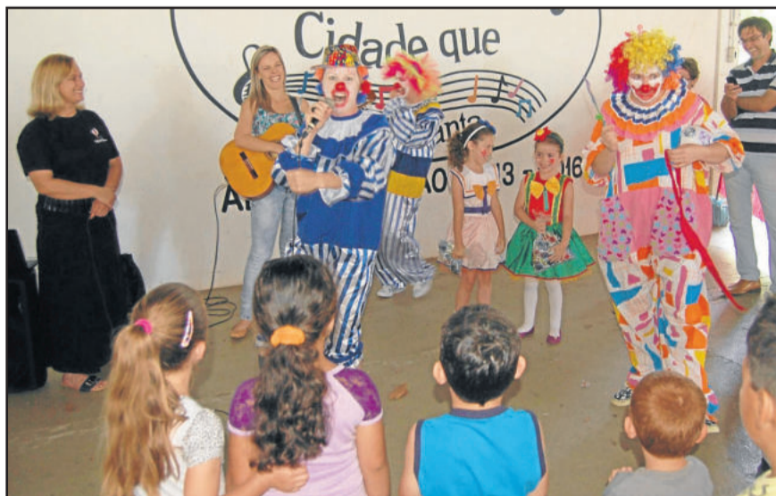
Palhaços também animaram a tarde