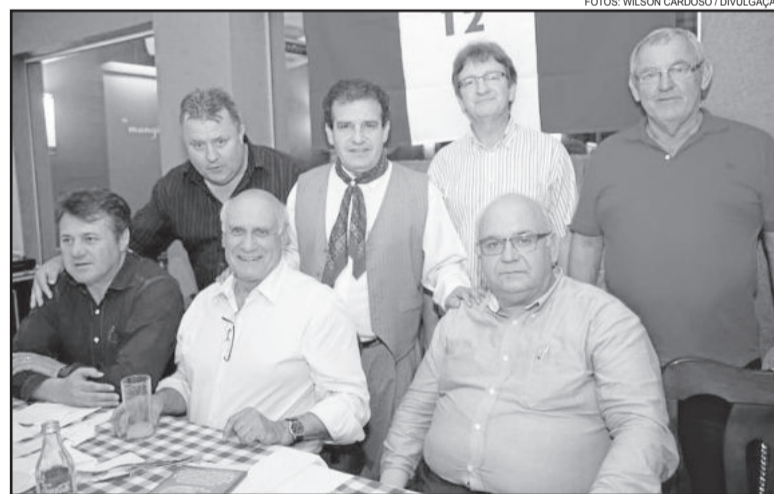
Comitiva teutoniense prestigiou a troca de presidência no PDT