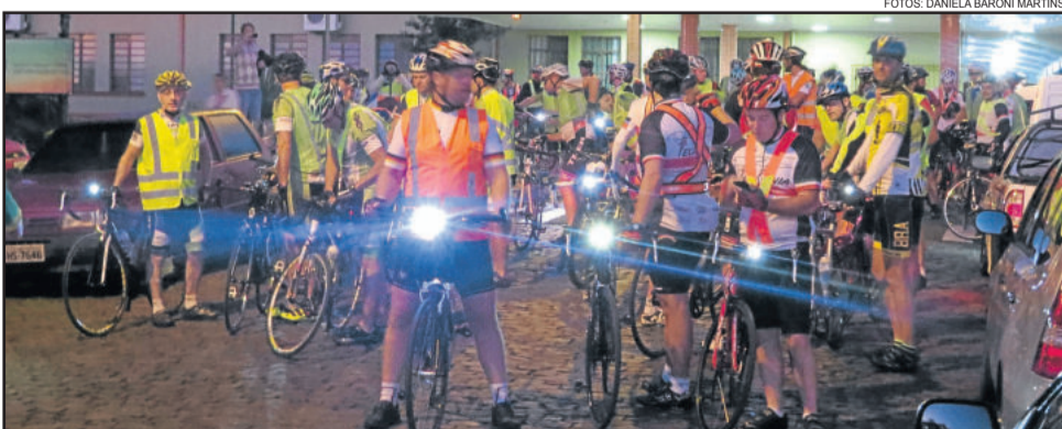
224 ciclistas estavam inscritos para a prova