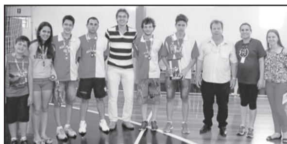
3º Lugar Masculino: Associação Arco Íris