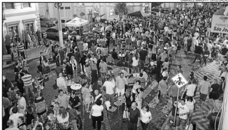
Cerca de 5 mil pessoas prestigiaram o evento

O evento integrou a programação da Primavera em Arte, que iniciou em 23 de setembro e segue até 21 de dezembro, com diversas atrações culturais. Mais informações com a Secretaria Municipal de Turismo e Cultura, no fone (54) 3462 8235.