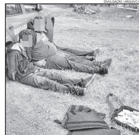
Bandidos foram presos após assalto em Imigrante

Cinco elementos envolvidos na ação foram presos. Duas pessoas foram presas no início da tarde e os outros três elementos no final da tarde de hoje. Além disso, outros dois elementos seguem foragidos nos matos de Linha Imhoff, em Imigrante, e divisa com Boa Vista do Sul. Eles foram cercados pela ação policial. Também foi recuperado parte do dinheiro roubado e ainda armas, abandonadas durante a fuga.