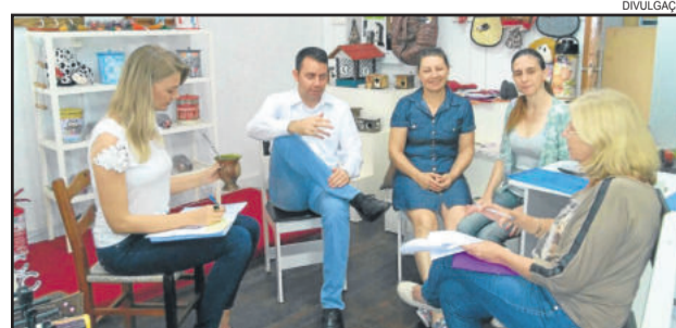
Encontro definiu detalhes da programação