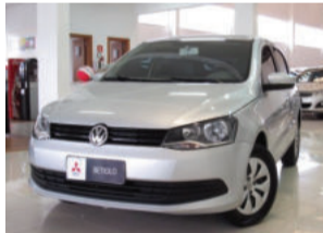
Volkswagen Gol Fun 1.6 Mi 16V 2015 Prata, 4 portas, 53.000Km. IW9341 R$ 39.900,00 COMPLETO