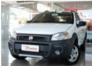
Fiat Strada Working Cabine Estendida 1.4 8V Flex 2014 Branco, 2 portas, 41.571Km. IVG5746 De R$ 35.900,00 por R$ 33.900,00