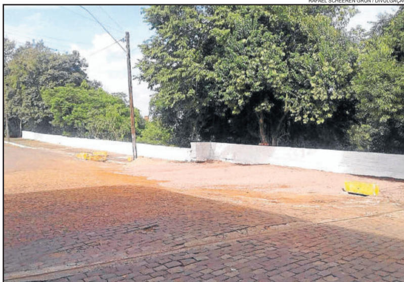
Obra para conter erosão na barranca foi concluída

A Prefeitura de Lajeado, através da Secretaria de Obras e Serviços Públicos (Seosp), concluiu a obra de contenção da erosão junto à barranca do Rio Taquari, na confluência das ruas Oswaldo Aranha e Rio Branco. O local estava desmoronando por conta da ação das águas do rio, sempre que ocorriam as cheias. Pedras grês, terra e reforço com vigamento de concreto e ferro foram utilizados no reforço da barranca, com vistas a eliminar o risco de desmoronamentos. Os acabamentos foram feitos nesta quarta-feira (22).