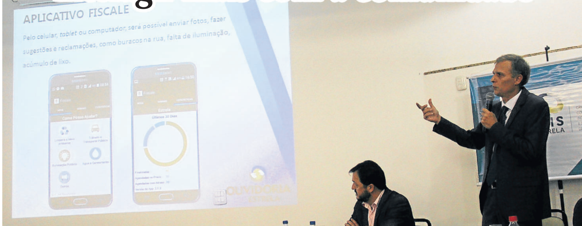
O "Fiscale" foi apresentado na manhã da quinta-feira, dia 23, em reunião interna. Prefeito anunciou novidade na reunião-almoço da Cacis. O aplicativo desenvolvido por empresa de Teutônia será mais uma ferramenta de interação entre a população e o governo local e poderá ser utilizado através de celulares, tablets e computadores. ESTRELA > 8