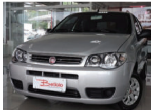
Fiat Palio Fire Flex 1.0 2016 Prata, 4 portas. IWW9479 R$ 29.900,00 COMPLETO