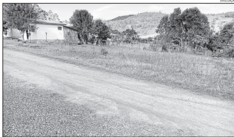
Terrenos do Município poderão ser adquiridos

A Secretaria de Administração está à disposição dos empresários e comunidade interessada na compra desses terrenos para prestar esclarecimentos. A intenção é tornar claros os pontos do edital e mostrar que qualquer pessoa é capaz de entrar numa concorrência pública. O edital pode ser encontrado no site oficial da Prefeitura ( www.paverama.rs.gov.br ) com os valores e parcelas. Além disso, consta a localização dos imóveis e suas devidas medidas.