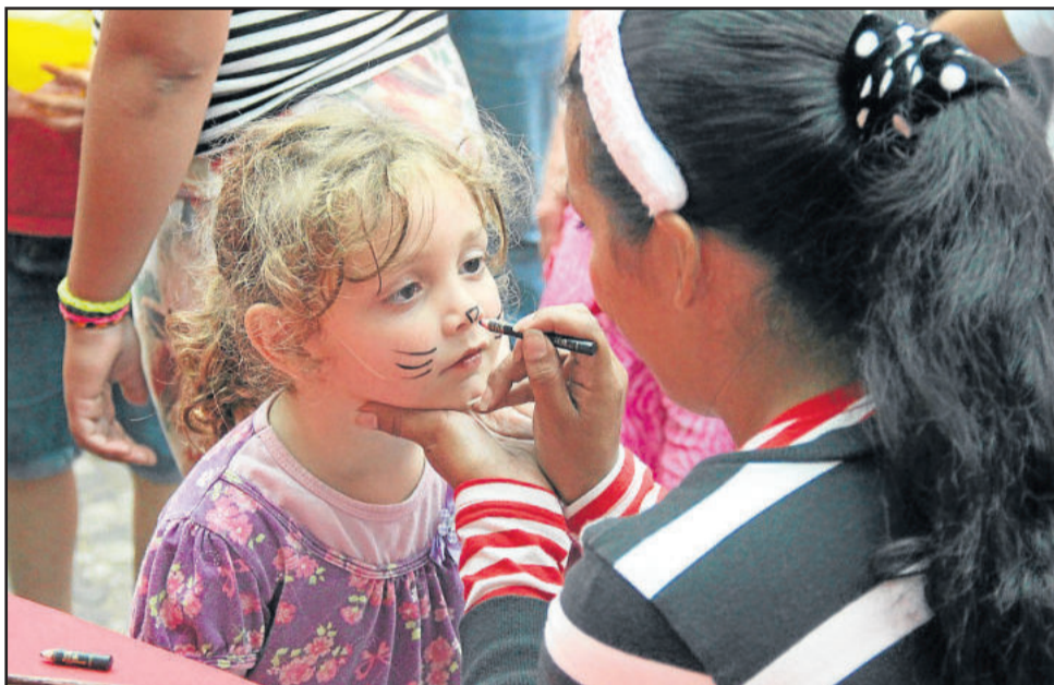
Pinturas no rosto fazem parte da programação