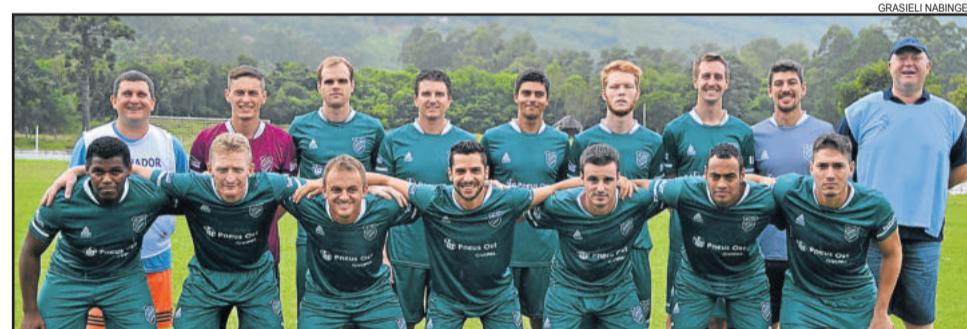
Esperança do Bairro Languiru