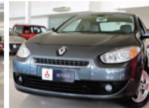
Renault Fluence Dynamique 2.0 16V Hi-Flex 2012 Cinza, 4 portas, Automático. FAI5463 R$ 39.900,00 COMPLETO