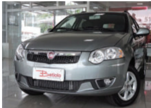
Fiat Palio Weekend Attractive 1.4 Flex 2016 Cinza, 4 portas, 950Km. IXQ6066 De R$ 54.900,00 por R$ 49.900,00 COMPLETO