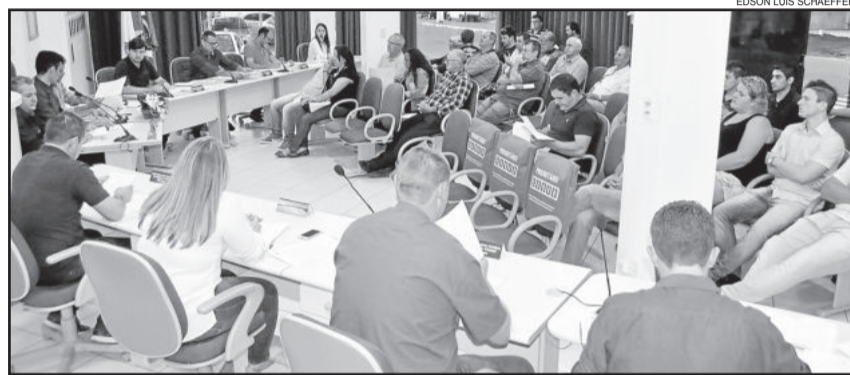
Vereadores se reuniram na noite de quinta-feira

o Serviço de Inspeção Municipal (SIM) e dispõe sobre a Inspeção Sanitária e Industrial dos Produtos de Origem Animal no Município de Teutônia. Dentre os objetivos está a regularização das atividades de pequenos produtores do Município, podendo melhorar seus rendimentos, através da comercialização direta e indireta de seus produtos, agregando valores à produção. O SIM terá pelo menos um Médico Veterinário efetivo. O Executivo acredita que a criação do SIM, aliada a políticas de incentivo e apoio à agricultura local, poderá alavancar novos mercados consumidores, aumentando sua renda e, conseqüente, o retorno ao Município.