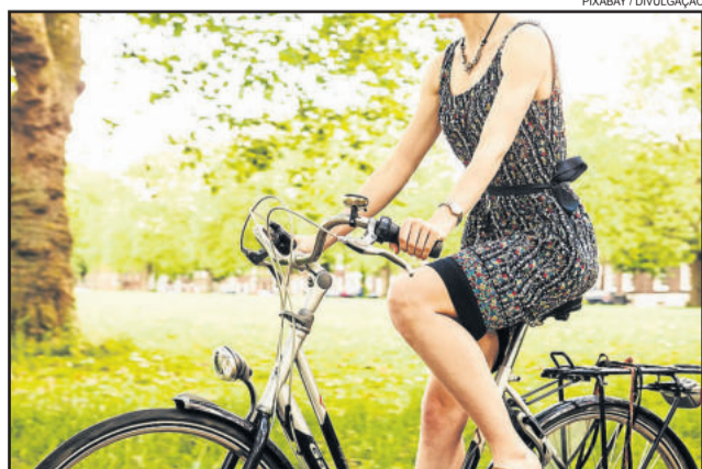
Evento faz parte da programação do Mês da Mulher