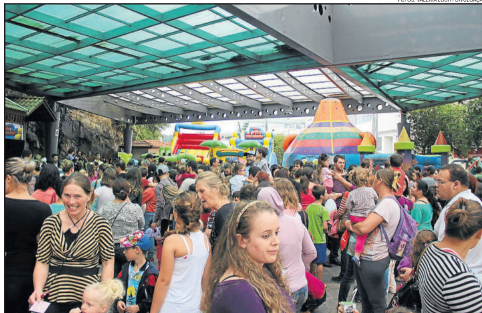
Público compareceu em bom número na última edição