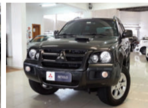
Mitsubishi Pajero Sport HPE 4X4 3.5 V6 24V Flex 2011 Cinza, 4 portas, Automático. IRE5611 R$ 57.900,00 COMPLETO