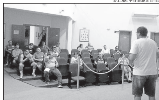
Reunião na Câmara de Vereadores definiu a maioria dos detalhes da competição

Equipe da Secretaria de Esportes e Lazer (Smel) realizou primeira reunião preparatória ao 19º ano da competição