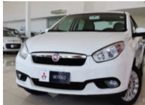
Fiat Grand Siena Essence 1.6 16V Flex 2015 Branco, 4 portas. IV03996 R$ 41.900,00 COMPLETO