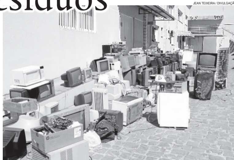
Coleta de Resíduos Eletrônicos

A Secretaria agradece a participação de todos e solicita que a população continue colaborando com a separação e destinação correta de seus resíduos. Esta, foi a campanha de eletrônicos com maior quantidade de resíduos recolhidos. A próxima coleta de resíduos eletrônicos está prevista para o mês de junho.