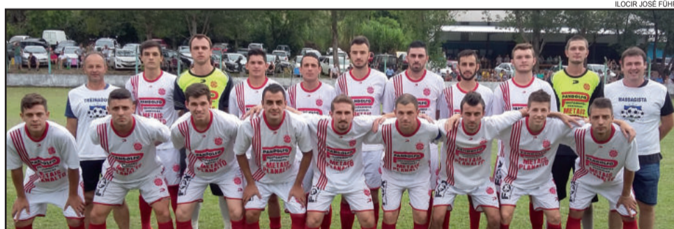
Gaúcho do Bairro Teutônia