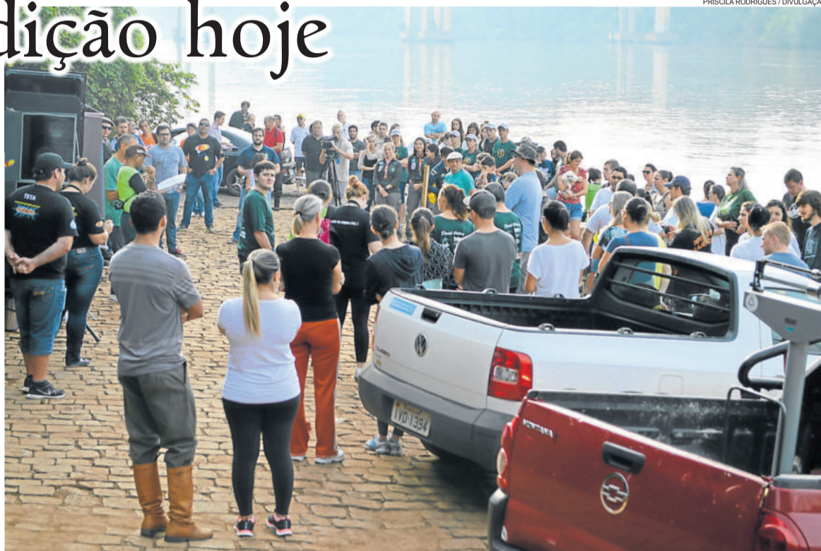
Mais de 600 voluntários participaram da ação em 2016