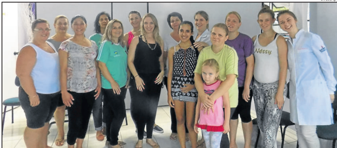
Quatorze mães participaram do encontro

A programação é promovida pela Secretaria Municipal da Saúde de Colinas. As atividades iniciaram em janeiro, com o assunto planejamento familiar. O objetivo do grupo é compartilhar experiências e transformar o momento em uma oportunidade para esclarecimento de dúvidas e solução de angústias e medos, sentimentos comuns nesta fase. O próximo encontro ocorre dia 7 de abril, das 8h30 às 9h30min, no auditório da Unidade Básica de Saúde.