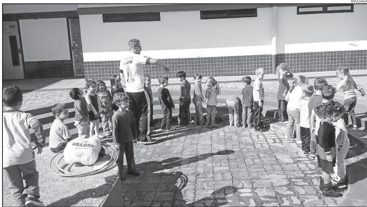
Aulas de Educação Física, que é uma das novidades deste ano na Educação Infantil e que começou na EMEF Proinfância, têm animado as crianças

As atividades iniciaram na EMEI Proinfância, mas gradativamente, dentro das possibilidades da Secretaria e seus profissionais, serão expandidas para as demais Escolas de Educação Infantil de Paverama.