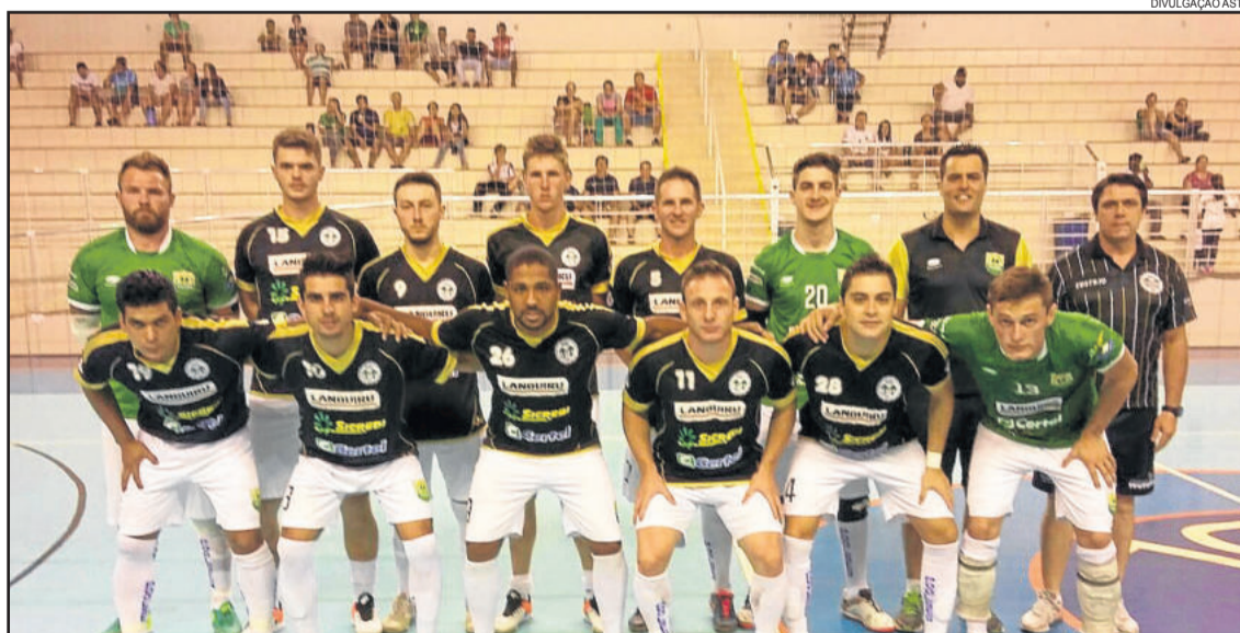
ASTF venceu jogo-treino nesta semana

disputa do Gauchão de Futsal - Série Bronze. A estreia da equipe no Campeonato Estadual será no dia 8 de abril, em casa, diante da AMF de Marau. Antes disso, é possível que outras partidas amistosas e de treinamento sejam realizadas para a preparação da equipe.