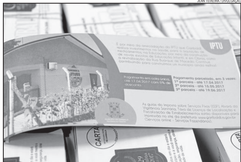
Carnês começaram a ser entregues na sexta-feira (16-03)

rios). Os contribuintes que não receberam os carnês até o final do mês devem entrar em contato com a Secretaria da Fazenda, pelo telefone 3462-8214.