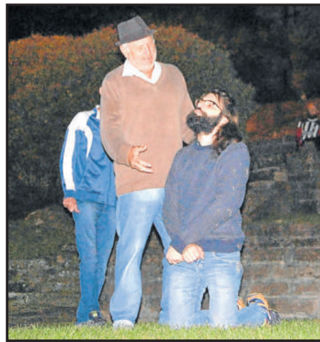
Atores da comunidade compõem o elenco do espetáculo