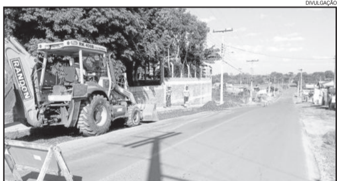
Equipe do Departamento de Trânsito trabalha na Rua 17 de Junho, em Canabarro