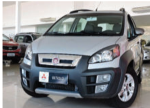
Fiat Idea Adventure Dualogic 1.8 16V Flex 2015 Prata, 4 portas, Automático, 42.682Km. IX8504 R$ 48.900,00 COMPLETO