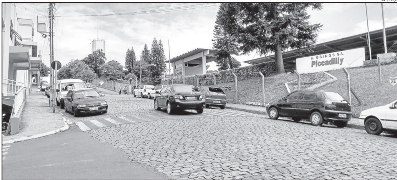
Motoristas poderão somente subir a Rua 31 de Março