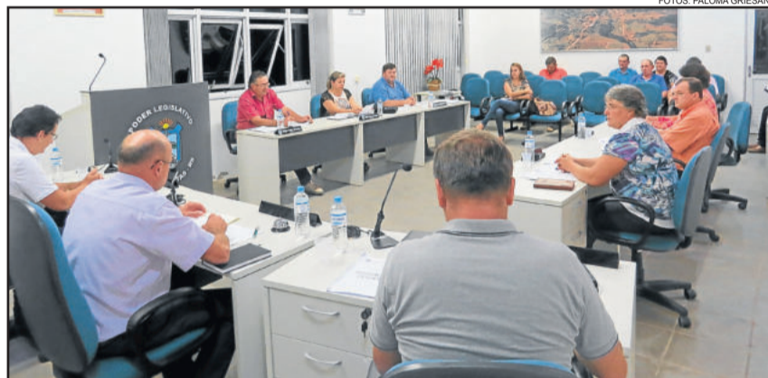
Vereadores aprovaram reajustes nos vencimentos e subsídios

na oportunidade a defesa obteve êxito e eles não sofreram penalidades, porém desta vez preferiu se abster.