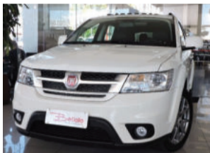
Fiat Freemont Precision 2.4 16V 2015 Branco, 4 portas, Automático, Gasolina, 722Km. PYN9558 De R$ 127.900,00 por R$ 105.900,00 COMPLETO