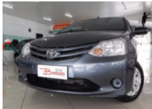
Toyota Etios 1.3 16V Flex 2013 Cinza, 4 portas, 40.000Km. ITR0248 De R$ 31.900,00 por R$ 29.900,00