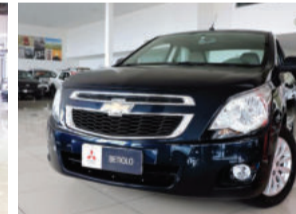
Chevrolet Cobalt LTZ 1.4 8V Flex 2013 Azul, 4 portas. EXI4167 R$ 35.900,00 COMPLETO