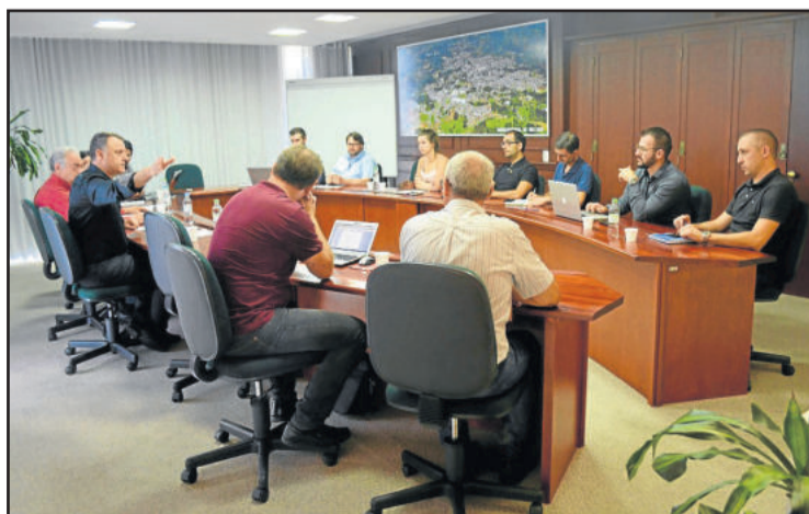
Prefeito apresentou secretários

Os encontros visam um maior entrosamento entre todas as pastas, no intuito de aprimorar ainda mais os serviços ofertados pela Administração Municipal, além de promover a sintonia de ações.