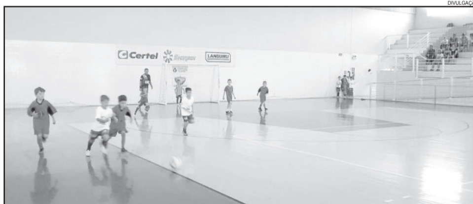
Jogos serão realizados nos sábados em ginásios do município

As equipes poderão escolher o nome dos clubes que participam da Champions League. Os campeões irão disputar a segunda fase que será regional. Haverá premiação para 1º, 2º e 3º lugar. Interessados que não forem da escolinha podem participar. Mais informações podem ser obtidas pelo telefone (51) 999 005 212 ou diretamente no escritório da AERC Juventus em frente ao Corpo de Bombeiros Voluntários de Teutônia.