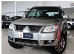
Mitsubishi Pajero TR4 4X2 2.0 16V Flex 2015 Prata, 4 portas, Automático, 52.200Km. QFH8700 R$ 59.900,00 COMPLETO