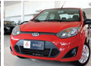
Ford Fiesta Sedan 1.6 MPI 8V Flex 2011 Vermelho, 4 portas, 26.300Km. IRT2652 R$ 26.900,00