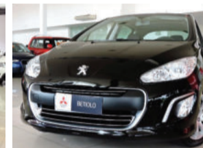
Peugeot 308 Active 1.6 16V Flex 2015 Preto, 4 portas. 30.900Km. IWD8333 R$ 51.900,00 COMPLETO