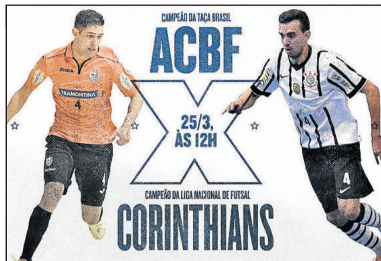
Jogo será hoje, ao meio dia