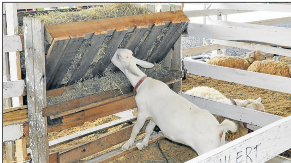
Caprinos foram uma das atrações do setor agropecuário