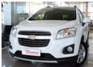
Chevrolet Tracker LT 1.8 16V Ecotec Flex 2016 Branco, 4 portas, Automático, 15.000Km. IX11036 R$ 71.900,00 COMPLETO