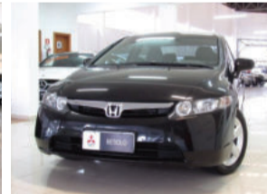
Honda Civic LXS 1.8 16V Flex 2008 Preto, 4 portas, Automático. EE04137 R$ 37.900,00 COMPLETO