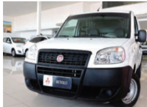
Fiat Doblò Cargo 1.8 MPI 8V Flex 2013 Branco, 4 portas. 29.600Km. IUR7985 R$ 38.900,00 COMPLETO