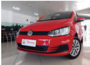
Volkswagen Fox Trend 1.0 Mi 8V Total Flex 2016 Vermelho, 4 portas, 24.000Km. IWX5119 De R$ 43.900,00 por R$ 39.900,00