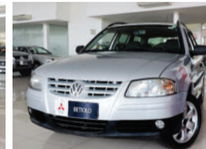
Volkswagen Parati 1.6 Mi 8V Total Flex 2006 Prata, 4 portas. IMT1558 R$ 21.900,00