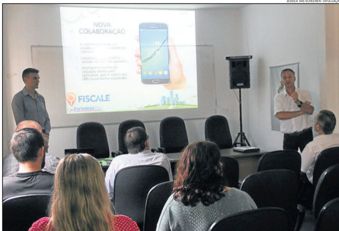
Desenvolvedores do aplicativo apresentaram a nova ferramenta e agora irão realizar adaptações às particularidades de Estrela

Conforme avaliação geral do prefeito e secretários presentes à reunião, o Fiscale permitirá, por parte da população e mesmo das autoridades e setores envolvidos, um melhor acompanhamento das pautas, com mais transparência, agilidade e qualidade aos atendimentos. Com isso, torna-se um elo de comunicação que incentive a participação dos estrelenses de for-