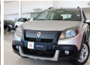
Renault Sandero Stepway 1.6 16V Hi-Flex 2014 Prata, 4 portas, Automático, 34.500Km. IUP2281. De R$ 44.900,00 por R$ 41.900,00 COMPLETO