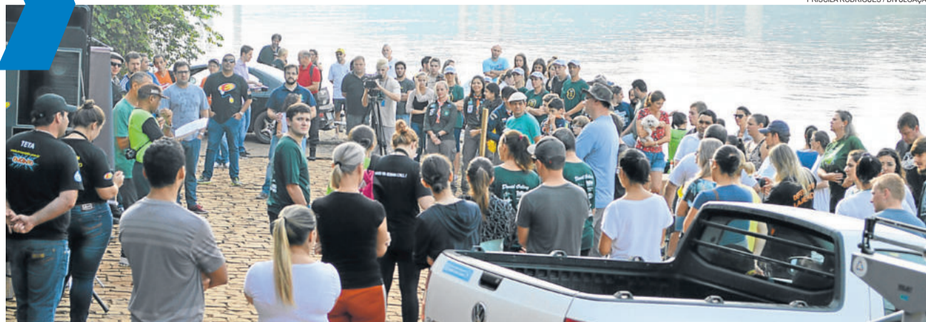
Os organizadores projetam o trabalho voluntário de mais de 600 pessoas na grande jornada de defesa e preservação do principal recurso hídrico da região. REGIÃO > 8