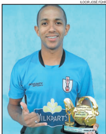
Baiano, do Saidera, o craque nos titulares