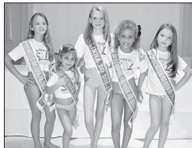
Nas categorias de menor idade, região também foi destaque