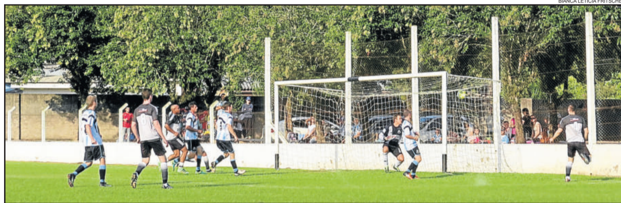
Chances foram criadas, mas o placar mínimo saiu apenas nos acréscimos

gol. Tanque poderia ter chutado, mas viu a passagem de Fininho, que recebeu e empurrou para o fundo das redes: era o 1 a 0 para o Ecas. Com a vitória, o Ecas chega aos 17 pontos e assumiu a liderança da Chave B. Nas quartas-de-final, o Ecas enfrentará o Palmeiras da Westfália.