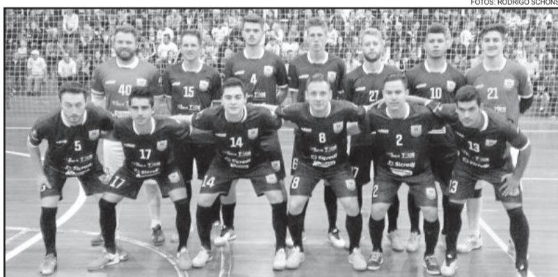
Teutônia Futsal se prepara agora para dois jogos seguidos em casa