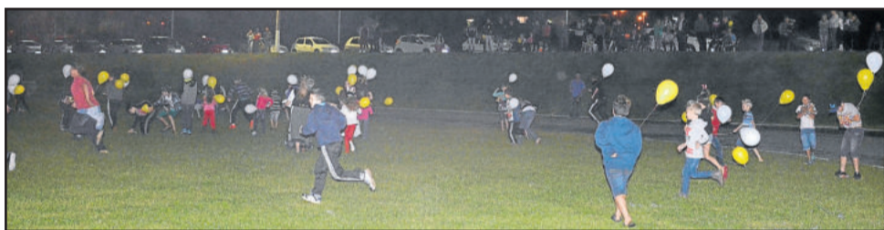
Caça ao Ninho foi realizada no gramado do Parque Municipal de Eventos