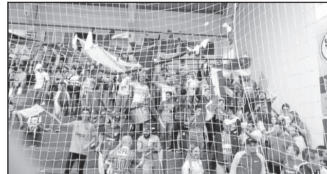
Torcida de Casca incentivou a equipe do início ao final

Torcedores teutonienses que acompanharam a partida em Casca relataram a intensa mobilização e apoio da torcida à equipe da SERCCA. “Jogo acabou e a torcida continua cantando. Entraram dentro do vestiário para fazer a festa com os jogadores. Saudade da época em que fazíamos um agito como foi feito em Casca. Isso precisa voltar”, declarou. Outro torcedor entende que “a ASTF está de parabéns por não deixar o futsal da cidade morrer, mesmo com todas as dificuldades de recursos financeiros”.