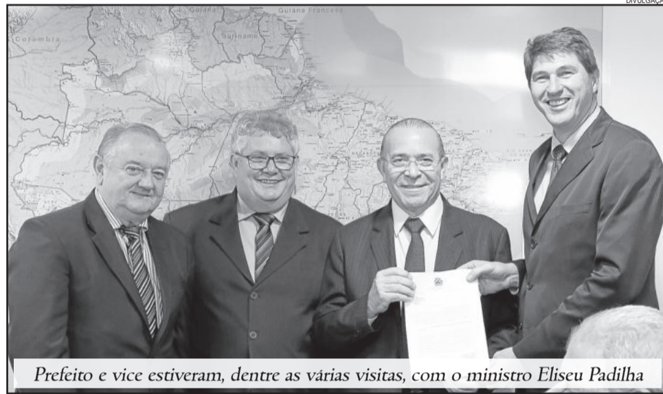
Prefeito e vice estiveram, dentre as várias visitas, com o ministro Eliseu Padilha

Aproveitando a ida a Brasília, prefeito e vice estiveram em audiência com o Ministro da Casa Civil, Eliseu Padilha, para tratar da pavimentação da estrada geral que liga Paverama a Teutônia pela localidade de Santana, a conhecida Rota do Leite. Eles ainda estiveram no Ministério do Desenvolvimento Social e Agrário, com o ministro Osmar Terra, onde protocolaram o pedido de recursos na área de estruturação da rede de serviços de proteção social, para a construção de um Centro Público de Convivência. "É uma luta a busca de recursos, porque as emendas parlamentares são uma ferramenta utilizada pela maioria dos municípios. Estamos sempre buscando alternativas", afirma Markus.