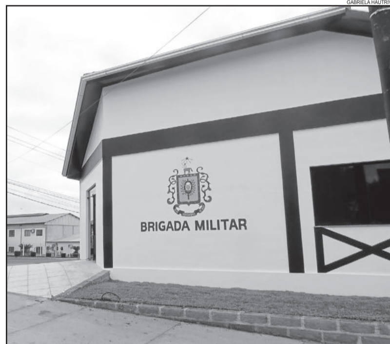
Novo prédio está localizado na Avenida 1 Leste, esquina com a Avenida 1 Norte, no Centro Administrativo

Antes de terem sedes próprias, Brigada Militar e Polícia Civil funcionavam junto ao Centro Administrativo (Prefeitura).