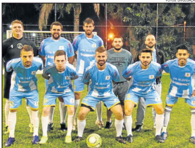
Los Blefes (uniforme azul) enfrenta o São José pela semifinal na categoria Livre

Na categoria Veterano, o Guaíba já está na final e aguarda seu adversário da segunda semifinal, entre Lajopisos e Maguitur. No Força Livre, amanhã à noite acontecem as duas partidas semifinais da competição.