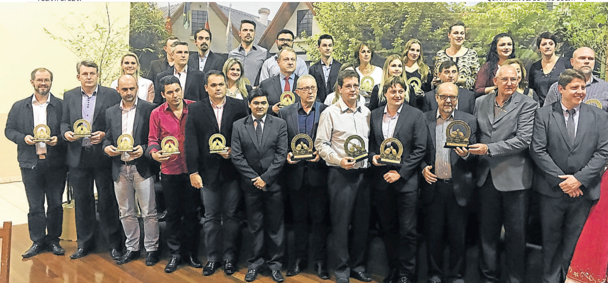
Os representantes das 30 maiores empresas de Teutônia na categoria Empresarial Geral