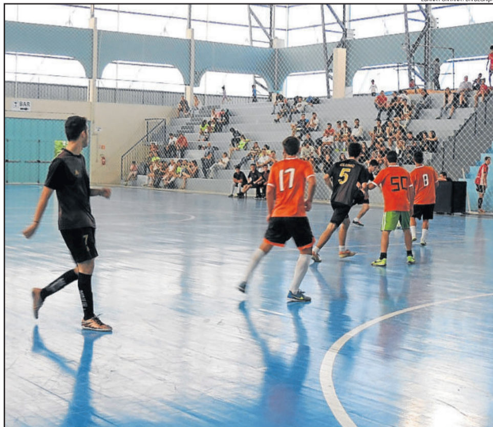
As partidas serão realizadas aos sábados, no Ginásio Municipal de Esportes, sempre com início às 13h30min

Os jogos são abertos à comunidade. Mais informações podem ser obtidas pelo telefone (54) 3462-8269.