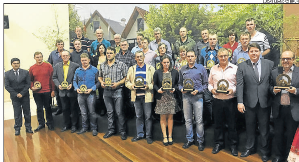
Os 30 maiores produtores rurais laureados por sua expressiva produção