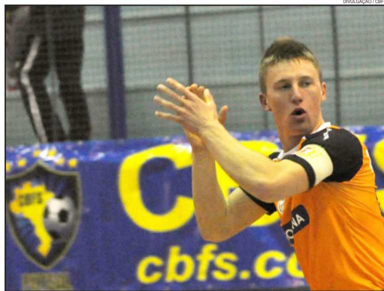
Equipe Juvenil da ACBF participou da Taça Brasil Sub-20 em 2012, sediada em Sananduva

A ACBF não fornece ajuda de custos (passagem, hospedagem, alimentação, etc...) para os inscritos nos testes. Os jovens atletas que forem aprovados para participar dos treinos terão que arcar com os seus custos.