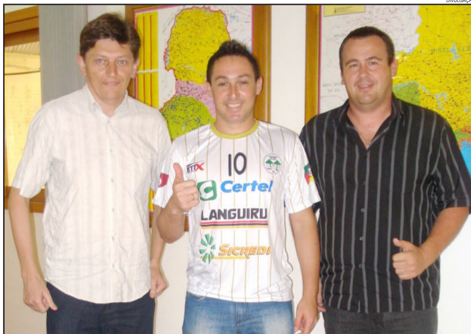
Bilica (c) foi anunciado na manhã de ontem, dia 25 de janeiro

O presidente explica que "o silêncio da ASTF foi estratégico, porque enquanto os clubes da Série Ouro estavam contratando ficava difícil para os clubes da Prata. Mesmo assim, desde que terminou a temporada de 2013, estávamos atentos ao mercado e fazendo contatos para trazer jogadores".