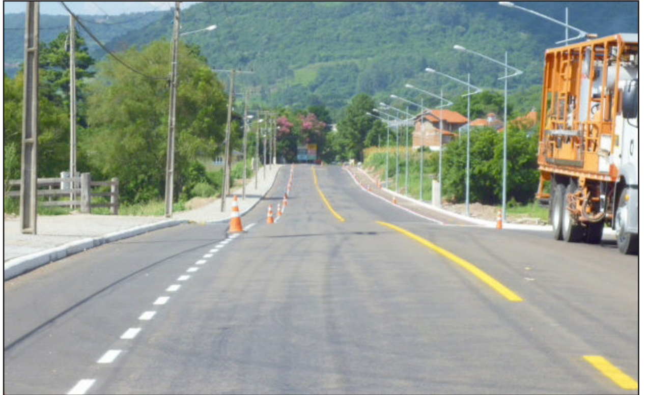
A sinalização do asfalto do trecho de alargamento do acesso entre o Centro e a sede do CRAS foi concluída nesta semana

A Administração Municipal de Westfália concluiu, nesta semana, a sinalização do asfaltamento do trecho de alargamento do acesso entre o Centro e a sede do CRAS, junto a Prefeitura. Neste trajeto de aproximadamente 450 metros de comprimento foram investidos R$ 400 mil em toda a estrutura necessária, desde o alargamento da via, com detonação de rochas, colocação de tubulação, base para asfaltamento e calçamento, iluminação especial, divisão das pistas com tachões e meio fio até a conclusão do pavimento com a pintura que ocorreu na quinta-feira desta semana.