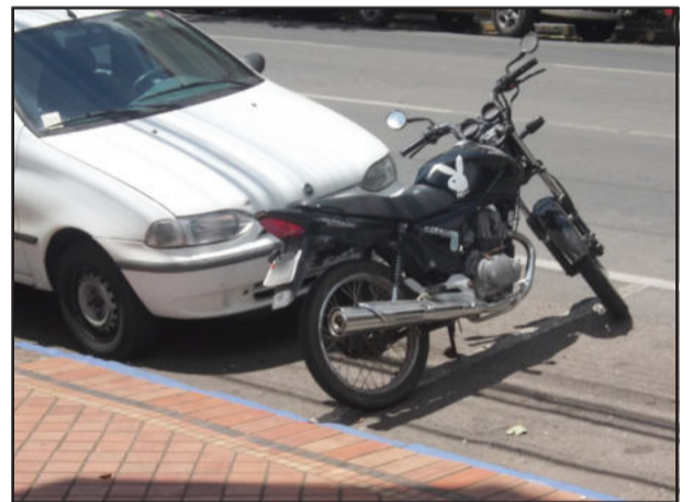
Motocicleta estacionada em lugar destinado para carros

Outro fato que repercutiu nas redes sociais essa semana foi a publicação de uma foto postada por um morador do Bairro Moínhos D'Água. A foto mostra o veículo do Departamento de Trânsito de Lajeado estacionado em um local irregular, destinado à entrada e saída de cadeirantes. Para termos um trânsito consciente e mais educado é importante cada um fazer a sua parte, denunciando e fiscalizando uns aos outros.