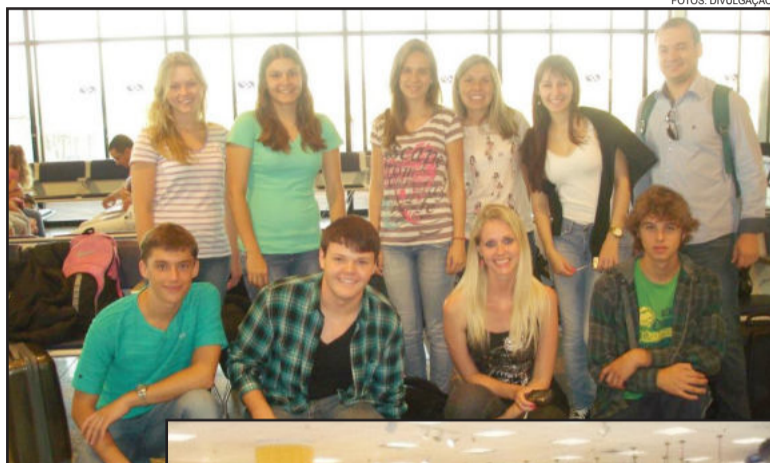
Grupo Wizard no aeroporto

O grupo retorna ao Brasil no dia 15 de fevereiro. Enquanto isso, você pode acessar o facebook da Wizard Idiomas de Teutônia para ter mais informações sobre a viagem, além de conferir fotos atualizadas da viagem.