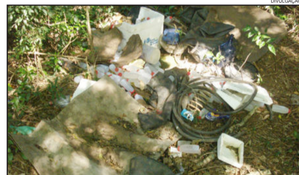
Resíduos encontrados em APP foram recolhidos após denúncia anônima. Caso é investigado

O Departamento de Meio Ambiente abriu processo de investigação para tentar apurar o autor do crime ambiental. Se alguém viu alguém despejando o material pode fazer denúncia para o Departamento de Meio Ambiente, através do telefone (51) 3762-7700.