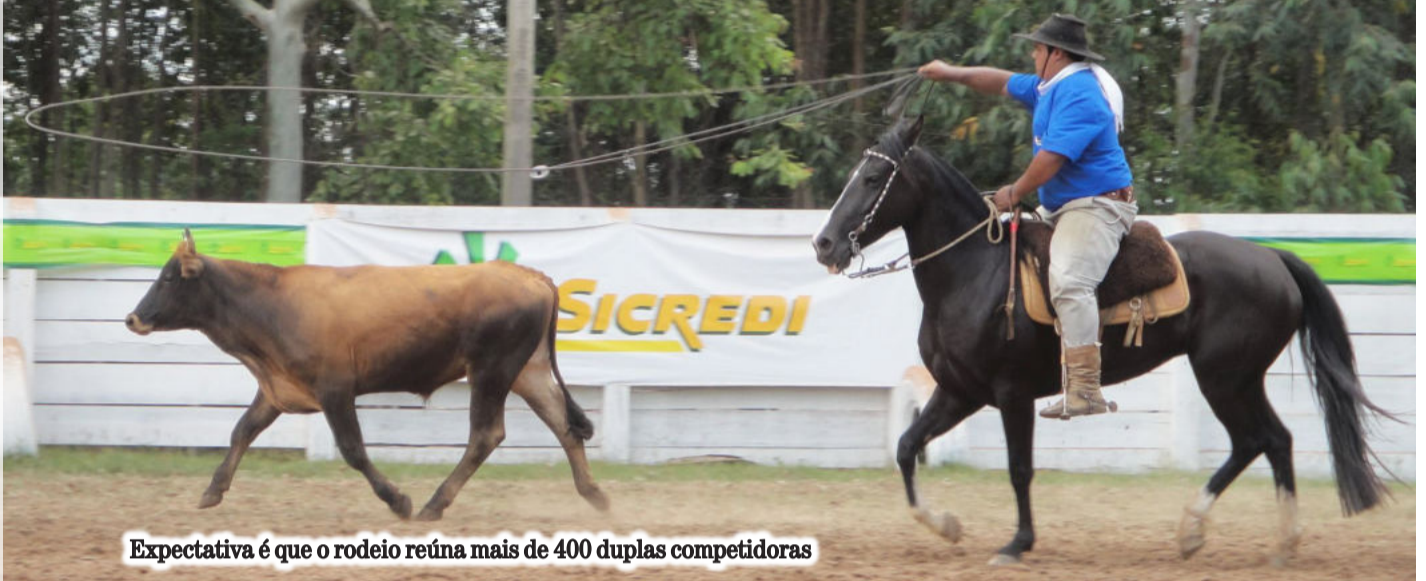
Expectativa é que o rodeio reúna mais de 400 duplas competidoras