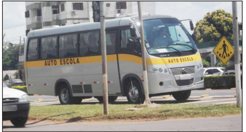
Microônibus, veículo destinado a aprendizagem categoria C, parado em local proibido junto à sinaleira próximo ao Posto do Arco, em Lajeado

Um microônibus, com placas de Encantado e pertencente a um Centro de Formação de Condutores (CFC) de Encantado, estava parado em um local irregular e extremamente perigoso. O veículo estava com o alerta ligado sobre a faixa de canalização devidamente sinalizada, enquanto o