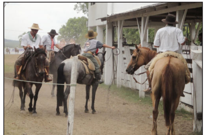
O rodeio reúne competidores iniciantes e profissionais