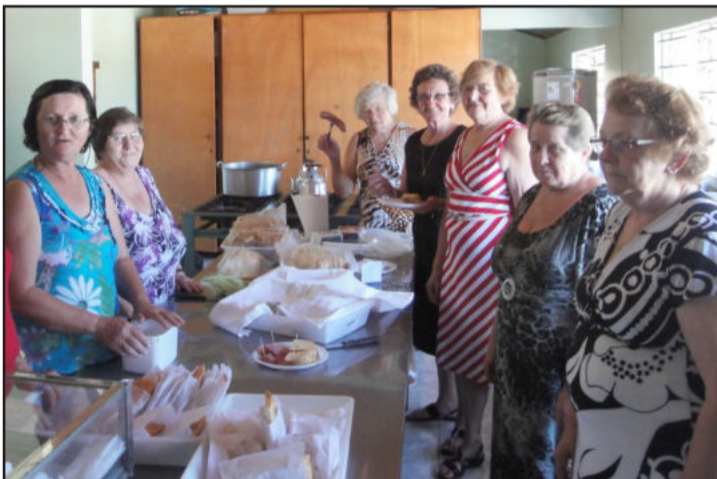
Pessoal da cozinha se mobilizou para bem atender a todos