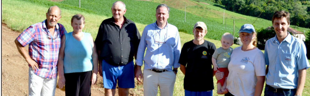
Família Trapp e Osterkamp apresentou produção integrada de suínos, frangos e leite na granja em Linha Berlim