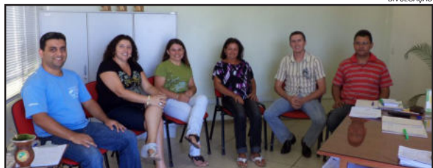
Os conselheiros solicitaram apoio da administração municipal nas suas demandas