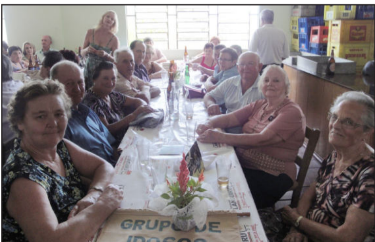
Grupo Flor de Maio, Linha Paissandu - Westfália