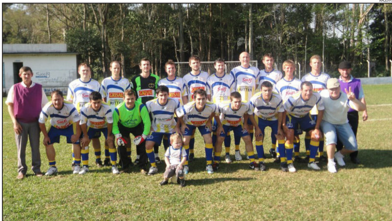
SE Nova Aliança não participará do certame

A Copa STR Lajeado de Futebol Amador de Marques de Souza é organizado pela Aemaso e conta com o apoio da Administração Municipal.