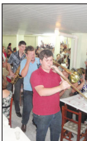
Músicos interagiram com o público