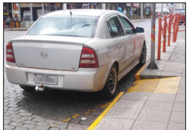
Além do veículo estar estacionado em meio fio rebaixado, também está a menos de cinco metros do bordo do alinhamento da via transversal