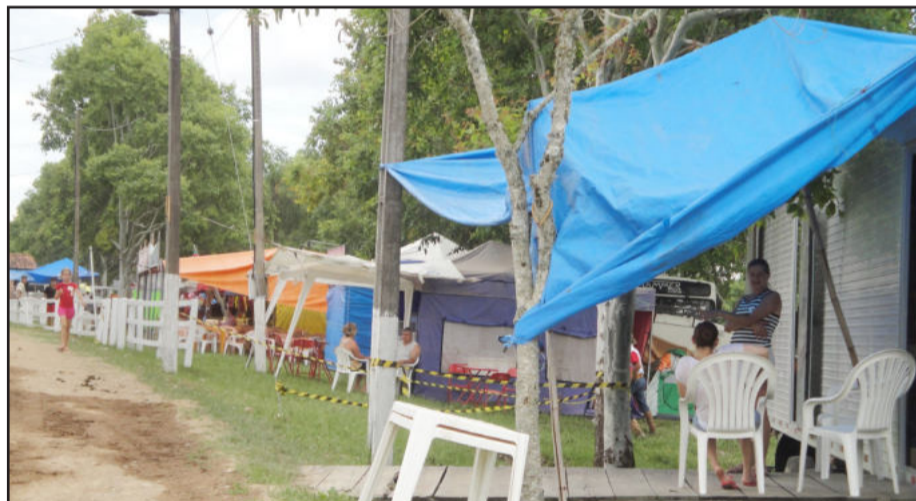
Visitantes têm à disposição uma infraestrutura inigualável, como supermercado, agropecuária, bazar e ampla área de camping

Ele ainda destaca que o rodeio é muito importante para os jovens. “Quando se vai em rodeio, não se vê drogas e violência. Os rodeios tiram os jovens da rua e os fazem praticar um esporte saudável, fazendo-os criar orgulho de suas origens, da sua cultura”, salienta.