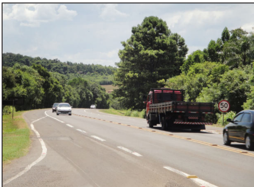
No trecho onde se localiza a aldeia indígena, obras não foram liberadas ainda pela Funai

"A rodovia duplicada significa o desenvolvimento dos nossos municípios e do Estado. A BR-386 também tem importância turística e, principalmente econômica, já que grande parte da produção é escoada pela rodovia", ressalta.