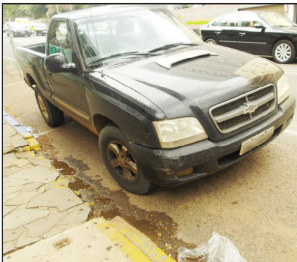
Caminhoneta estacionada em meio fio rebaixado, destinado à entrada e saída de veículos

* Estacionar veículo nas esquinas a menos dos cinco metros do bordo do alinhamento da via transversal (caso do Vectra na foto que também estaciona no meio fio rebaixado) é uma infração média, sujeita à multa de R$ 85,13 quatro pontos no prontuário do condutor e remoção do veículo.