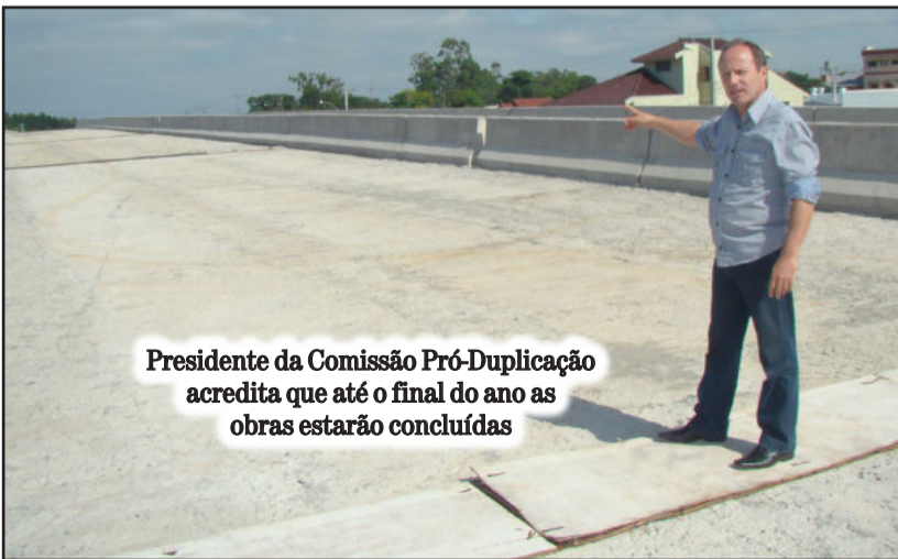
Presidente da Comissão Pró-Duplicação acredita que até o final do ano as obras estarão concluídas