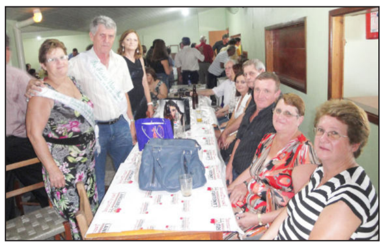
Grupo Vida Nova, Linha 31 de Outubro - Colinas