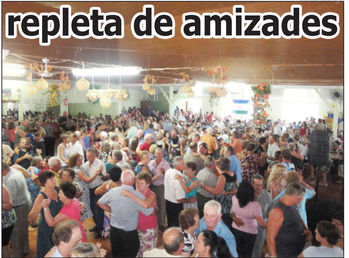
A amizade é o ponto alto dos bailes da melhor idade, como o da Linha Germano

O baile de Linha Germano reuniu 25 grupos de Teutônia, Taquari, Lajeado, Colinas, Roca Sales, Westfália, Fazenda Vilanova e Paverama. A animação do evento ficou a cargo de Los Consagrados.