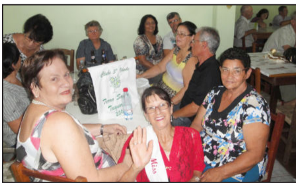
Grupo Terra Santa, de Taquari