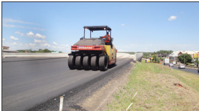
Elevada na Fazenda Vilanova está praticamente concluída