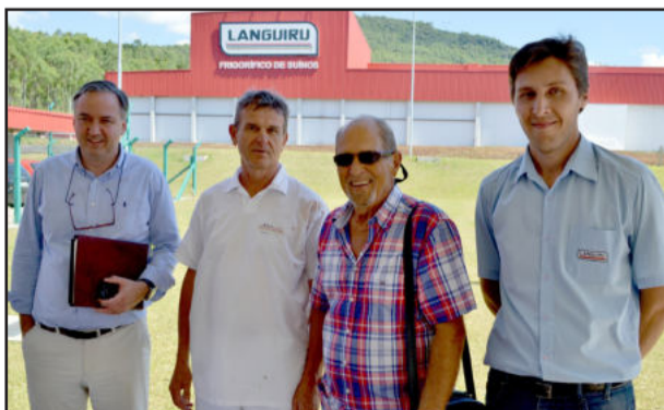
Frigorífico de Suínos em Poço das Antas também foi visitado e recebeu elogios: “muito semelhante aos melhores frigoríficos da Europa”