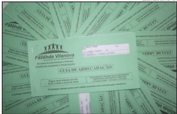
Carnês do IPTU já pode ser retirados