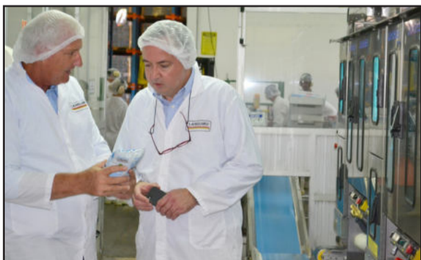
Vice-presidente da Cooperativa Languiru acompanhou diretor internacional da cooperativa alemã na visita à Indústria de Laticínios

A cooperativa conta com 6,5 mil produtores de leite na Alemanha, na França, em Luxemburgo e nos Países Baixos. Industrializa ampla variedade de produtos lácteos, contando com cerca de 1,6 mil colaboradores. De toda sua produção, 90% está concentrada no setor lácteo e 10% no setor de carnes, principalmente suína.