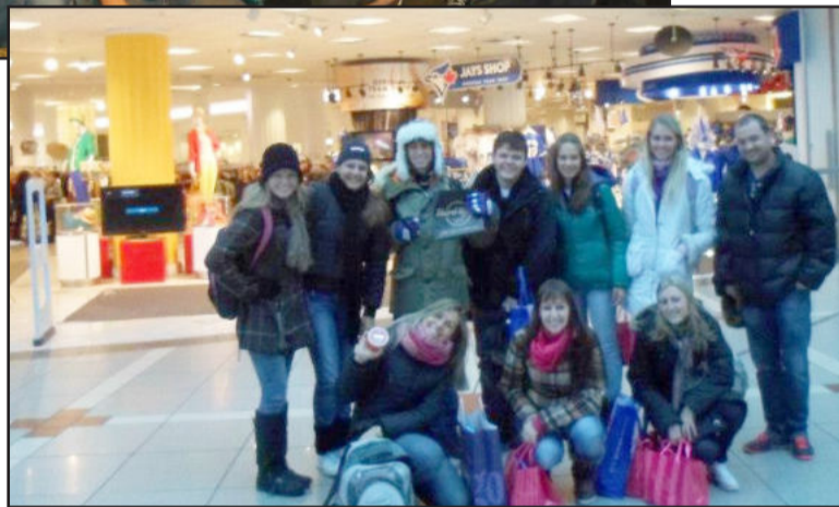
A turma fazendo compras no Canadá