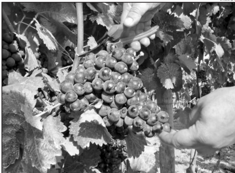
Colheita Noturna foi atração na vindima

Encerrada a degustação e já quando o sol quase se pondo, iniciaram os preparativos para a colheita nos parreirais iluminados que ficam nos fundos da vinícola, uma experiência de aproximadamente trinta minutos. Para isso, cada participante recebeu um avental que também serviu de presente para o visitante, um cesto e uma tesoura para o corte dos cachos. A vindima foi comemorada com uma farta tábuca de produtos coloniais como pão caseiro, copa, queijo e salame, acompanhada por um prato quente típico italiano, e harmonizados com vinhos e espumantes.