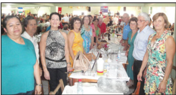
Associação Ecumênica, de Roca Sales