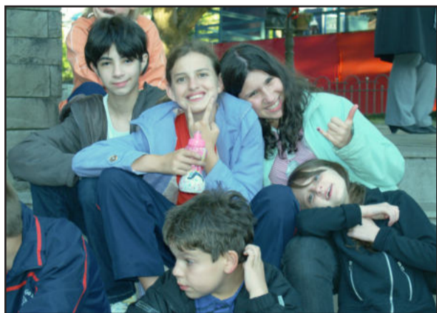
Momentos de descontração e integração