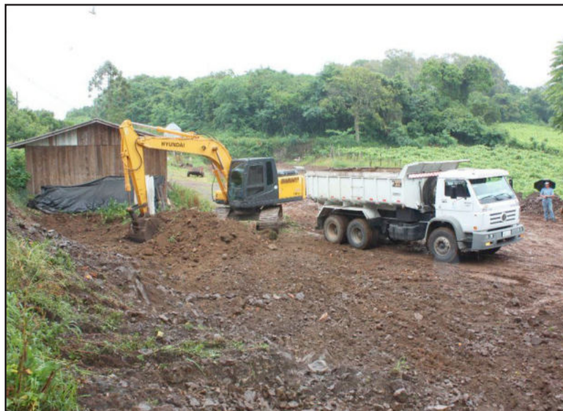
Terraplenagens beneficiam propriedades rurais

O principal objetivo é oferecer ao agricultor garibaldense uma alternativa de renda, além de manter o município de Garibaldi como um dos maiores produtores de frango de corte do Estado.