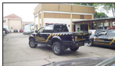
Polícia Federal saiu para Operação Soteria