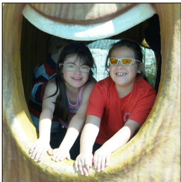
Diversão para os alunos