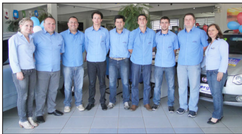
Equipe da Sérgio Veículos espera pelos clientes para comemorar hoje

Por ser uma empresa sólida e de tradição no mercado, com grande conhecimento no ramo em que atua, e também por oferecer produtos de qualidade, a empresa vem cada vez mais acelerando seu crescimento na região, se tornando referência na venda de semi-novos.