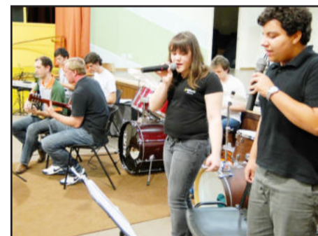
CT Music Band foi apresentada oficialmente no recital