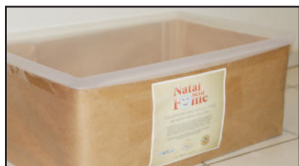
Nas caixas de coleta da Univates podem ser doados alimentos e brinquedos

Alimentos e brinquedos podem ser doados na Instituição