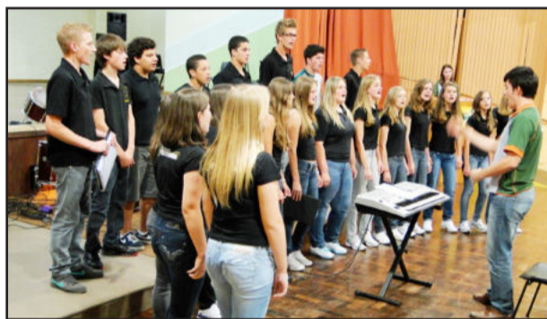
Coral Juvenil do Colégio Teutônia

As aulas ocorrem nas segundas-feiras, nas dependências do Colégio Teutônia. Além das atividades extraclasse, a Música também integra o currículo do Maternal até a 8ª série do Ensino Fundamental, com uma aula semanal.