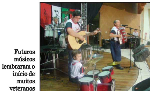
Futuros músicos lembraram o início de muitos veteranos