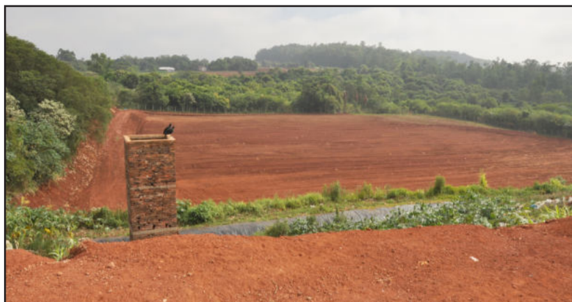
Nova célula do Aterro Sanitário terá 13 mil metros cúbicos de capacidade