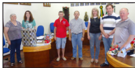
Comissão que fiscalizou o sorteio