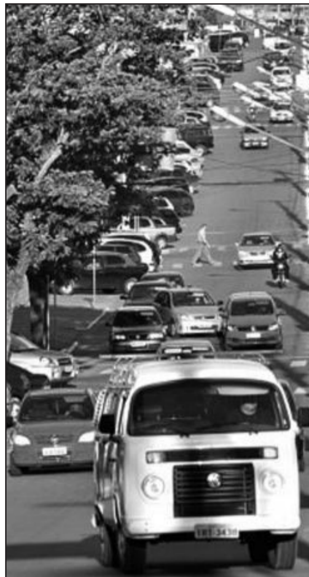
Rek Parking vence concorrência para estacionamento rotativo pago

Estarão isentos da tarifa, os casos previstos na legislação municipal.