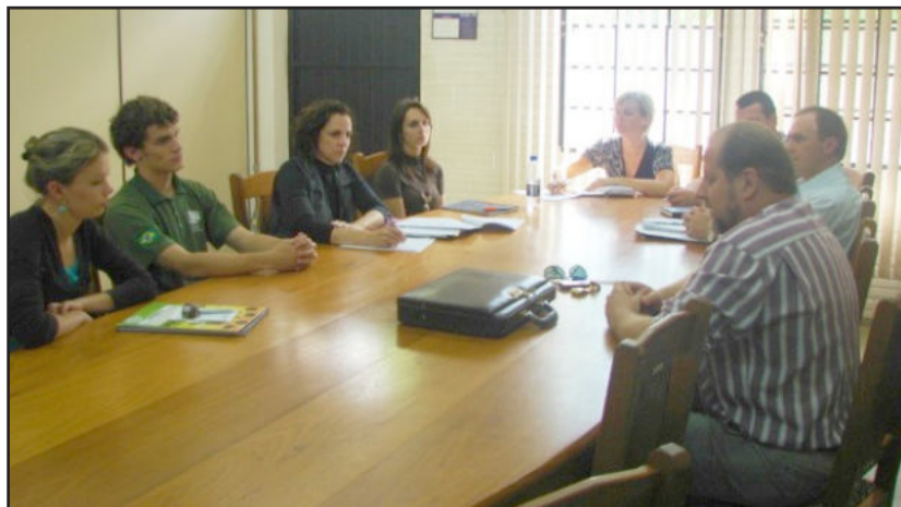
Encontros estão abertos para debater inserção do jovem nas comunidades

dialogar sobre suas ações e políticas públicas; implantação do Conselho Municipal da Juventude; criação de espaços de comunicação direcionado ao público jovem e dialogando com essa faixa etária; desenvolver boletins informativos, fôlders, entre outros materiais; realizar seminários e fóruns municipais de debates oportunizando aos jovens teutonienses a participação e exposição de ideias.