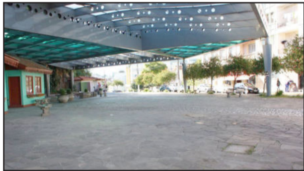
Praça Loureiro da Silva