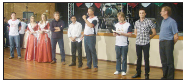
Na abertura, lideranças destacaram a cultura musical de Teutônia