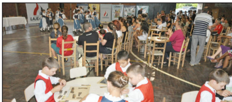
Diálogos Comunitários no Jardim do Cedro contou com apresentação de danças e jogos educativos para as crianças