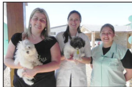
Clientes satisfeitos com atendimento aos bichinhos

Quem tem um animalzinho de estimação sabe da importância que é tratá-lo com cuidados e bons tratos. Se você é uma dessas pessoas que se preocupa com o bem-estar do seu melhor amigo, venha conhecer o CenterVet - Centro Clínico Veterinário.