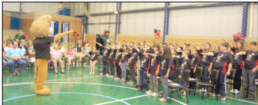
O mascote do Proerd e o juramento dos formandos