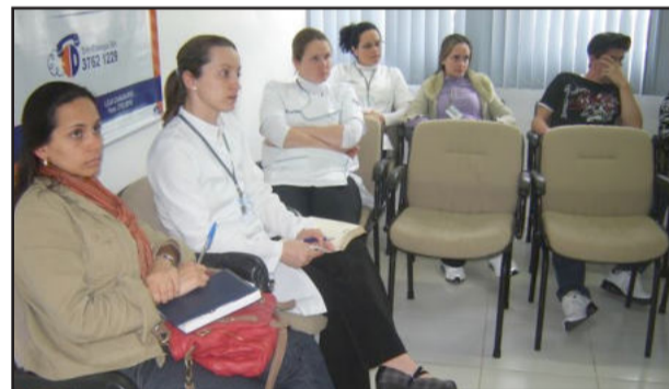
Coordenador da Vigilância Sanitária de Teutônia palestrou para colaboradores do SND do hospital

A formação revisou importantes rotinas realizadas durante o preparo e a distribuição das refeições, com foco em formas de estocagem de produtos, micro-organismos causadores de DTAs (Doenças Transmitidas por Alimentos), BPF (Boas Práticas de Fabricação), POPs (Procedimentos Operacionais Padrão), higiene do ambiente (instalações, equipamentos, móveis e utensílios), controle de pragas, gerenciamento de resíduos, controle de temperaturas, EPIs (Equipamentos de Proteção Individual) e APPCC (Análise de Perigos e Pontos Críticos de Controle), entre outros.