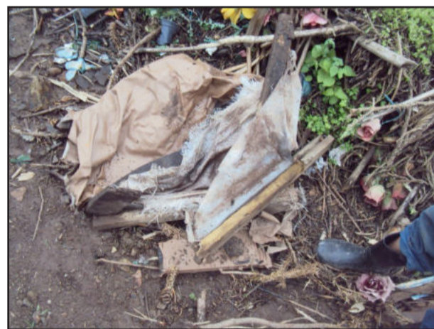
Diferentes tipos de lixo