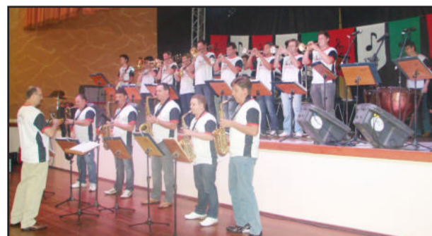
Orquestra Municipal de Teutônia também participou