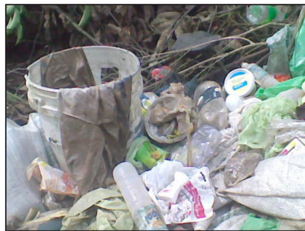
Sacos, latas e embalagens plásticas