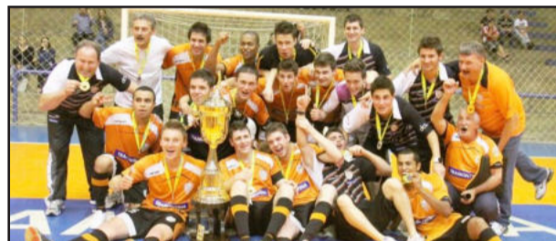
Juvenil da ACBF chega ao tricampeonato Gaúcho de Futsal