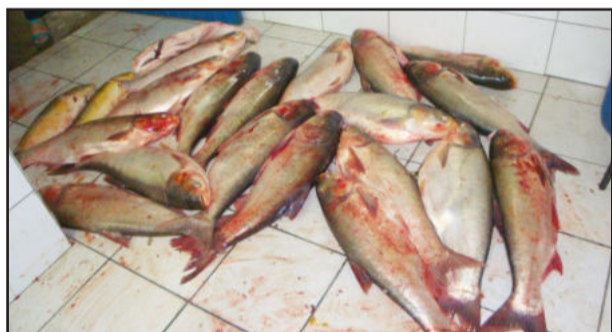
Peixes serão encaminhados à empresa de Cruzeiro do Sul

cal e constatou que o pescado era impróprio para o consumo. De acordo com ele, os peixes serão entregues para uma empresa de Cruzeiro do Sul, que fará o reaproveitamento da carne para outra finalidade.