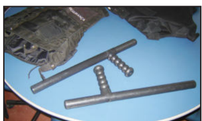
Polícia Federal apreendeu equipamentos de segurança

O nome da Operação Soteria, deflagrada pela Polícia Federal de Santa Cruz do Sul, é uma referência à mitologia grega, onde Soteria é a deusa da segurança, da libertação e da preservação do dano. Presume-se que Soteria seja filha de Zeus, o Rei dos Deuses gregos, ou Dionísio, deus do vinho.