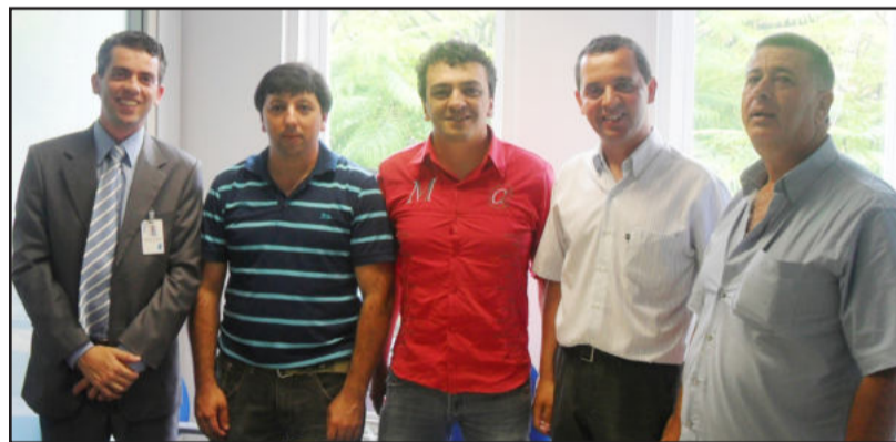
Vereadores de Fazenda Vilanova receberam notícias otimistas da Vivo