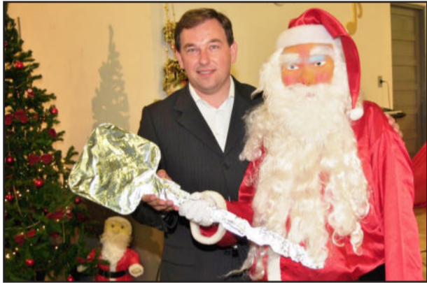
Prefeito e Papai Noel

A praça já está especialmente decorada para o Natal. Da mesma forma, as ruas da cidade estão enfeitadas para despertar o espírito de Natal na comunidade e, assim, incentivar esta a também ornamentar seus pátios e residências.