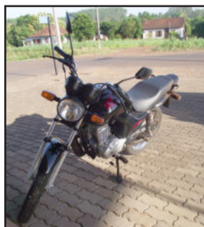
Moto também teve pequenas avarias