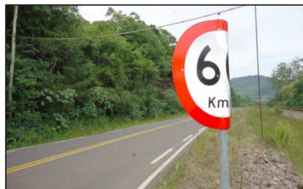
Placas novas foram danificadas