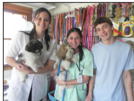
Atendimento com carinho e dedicação