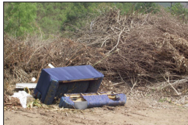
Sofá e entulhos orgânicos

Outro morador alega que está sendo aterrado o local, onde foi tirado terra e saibro para fazer estradas. O proprietário teria cedido a terra para este fim e que a ideia seria o depósito apenas de entulhos orgânicos. Enquanto a situação está em debate, os envolvidos buscam encontrar uma solução para o problema.