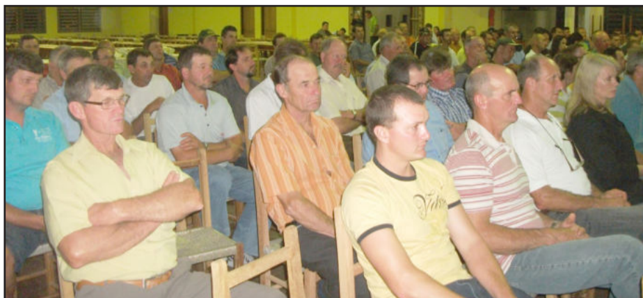
Em torno de 300 pessoas participaram do encontro

Na noite desta quinta-feira, dia 24, tendo por local o pavilhão evangélico de Novo Paraíso, em Estrela, ocorreu o anúncio público da parceria firmada entre a Cooperativa Agroindustrial São Jacó Ltda (Cooperagri) e a empresa Dow Agrosiences. Com isso, a Cooperagri passa a ser distribuidora exclusiva das sementes Dow Agrosiences em toda a parte leste do Vale do Taquari.