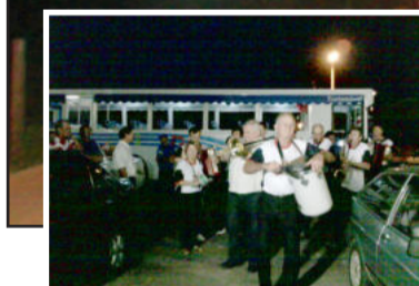
Ônibus, vans e veículos de bandas fizeram carreata (foto acima). Após, festa teve sequência na Associação da Água (foto ao lado)