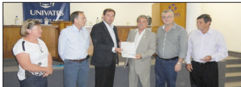
Encontro ocorreu na Univates

luz é tão fraca que uma pessoa sequer consegue tomar um banho. "Chegamos a ficar 56 horas sem energia elétrica por total inoperância da Aes Sul" ressaltou o prefeito. Ainda destacou que a região está perdendo grandes investimentos de indústrias que estão indo para outros lugares por falta do insumo básico, que é a energia elétrica. "Ou a Aes Sul faz os investimentos necessários para atender a demanda ou solicitaremos ao Governo do Estado a rescisão do contrato de concessão", finalizou o prefeito de Colinas.