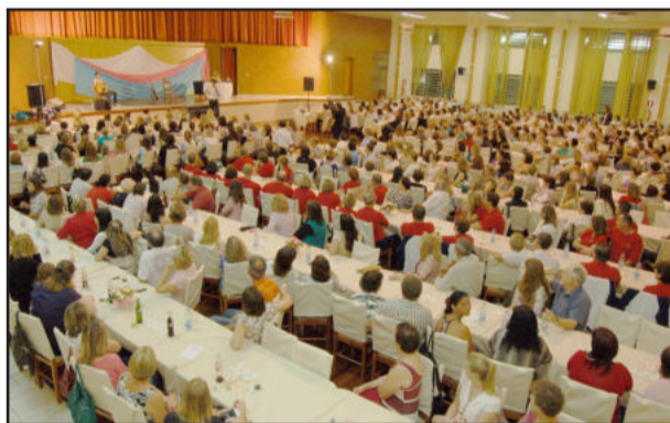
Dependências da Associação estiveram lotadas