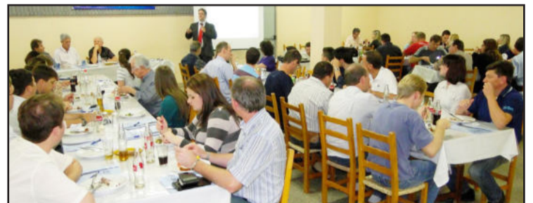
Evento realizado no Restaurante Paladar contou com a presença de cerca de 80 pessoas

acreditam que a oferta de crédito deverá continuar em expansão, mesmo que em um ritmo mais moderado.