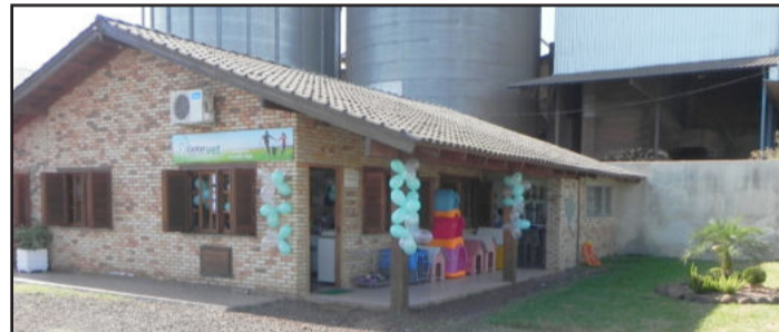
Clínica com nova identidade visual