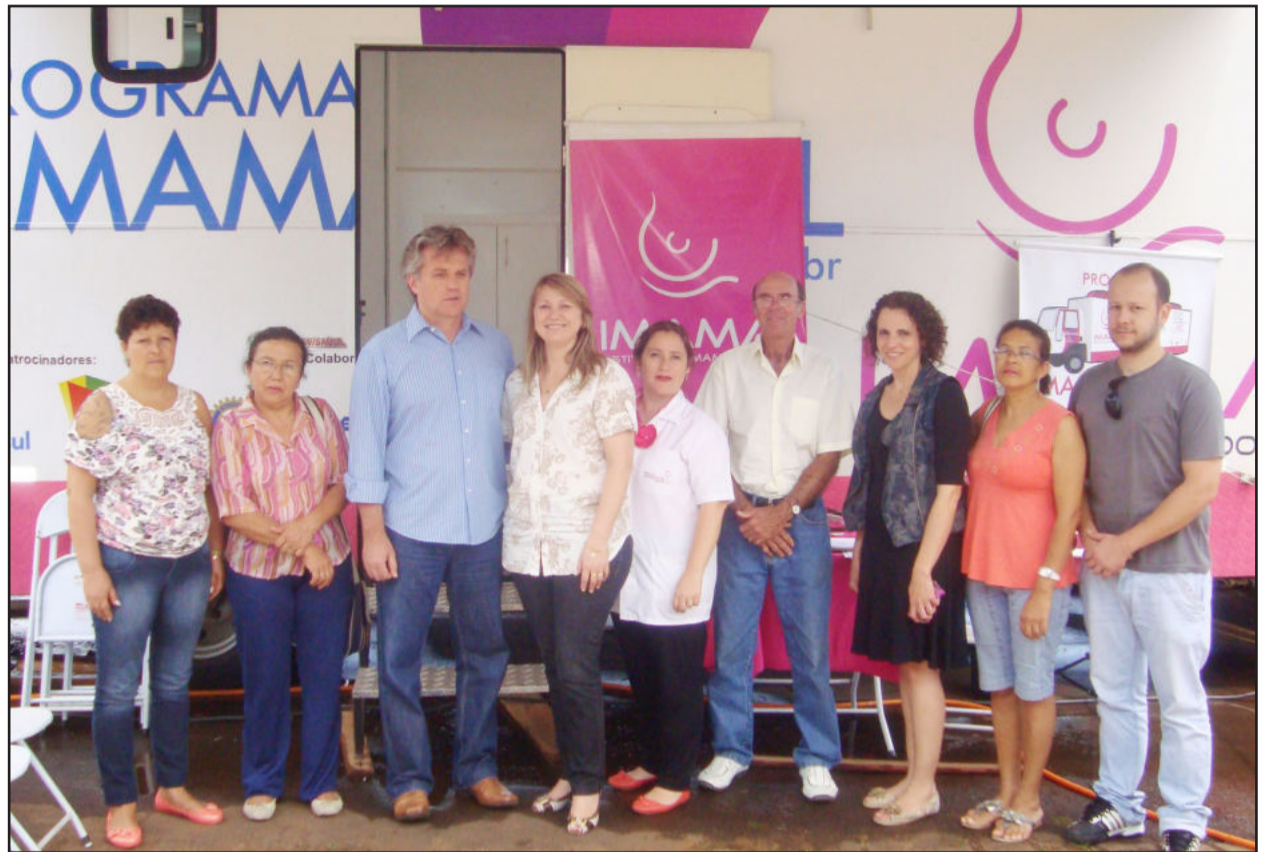
Mamamóvel atuou em Teutônia e atendeu a região, com estrutura oferecida pelo Município

Atendidas mais de 160 mulheres da região que aguardavam na fila do SUS