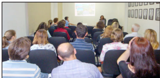
Encontro em Estrela foi o último do ano