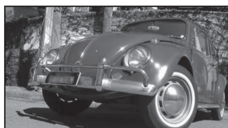
Fuscas são alvo de ladrões que alimentam o mercado negro de peças

estacionado na mesma rua, nas proximidades do Banrisul de Garibaldi. Nenhum dos veículos foi localizado.