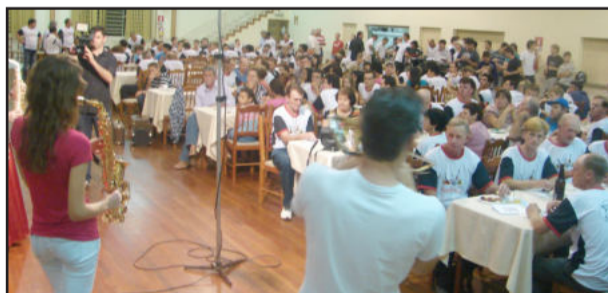
Músicos atentos as apresentações na Associação da Água