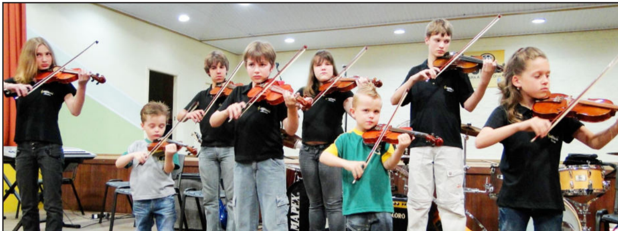
Crianças a partir dos quatro anos de idade já participam das oficinas de violino

O evento teve início com apresentação das oficinas de flauta