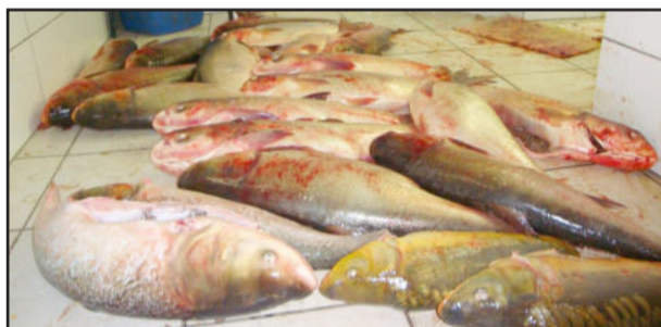
Cerca de 150 quilos de peixes foram abatidos de forma clandestina em Estrela