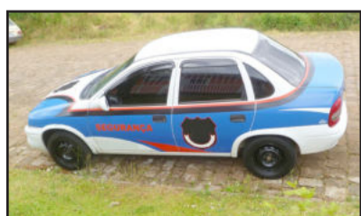
Polícia Federal também averiguou viatura de empresa de segurança