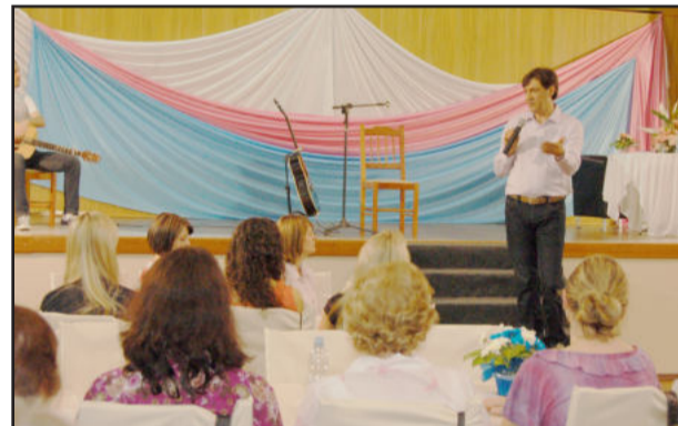
Palestrante despertou público para reflexão