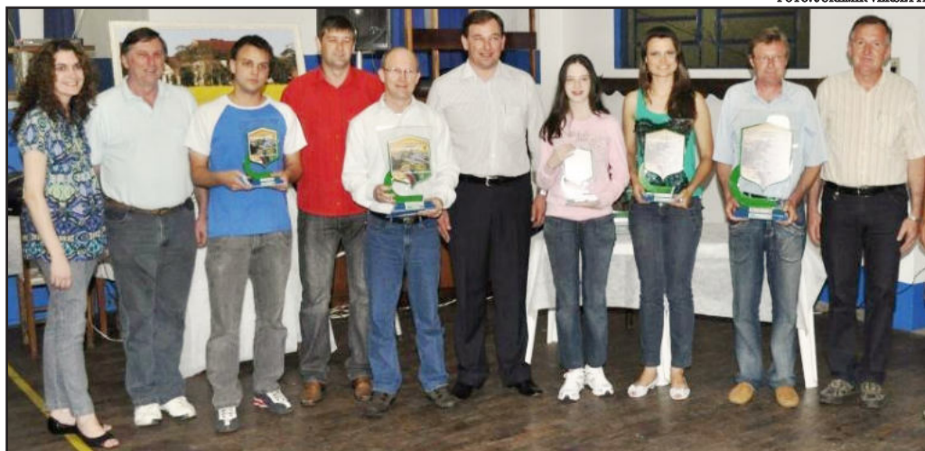
Vencedores do Concurso Fotográfico em 2010