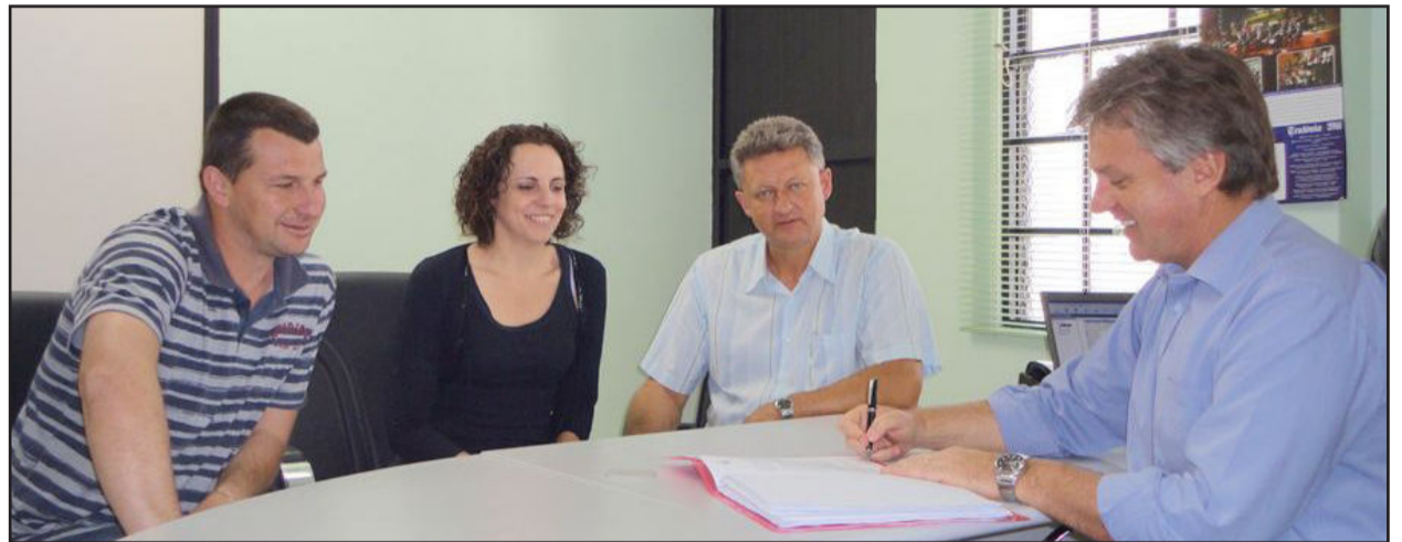
Administração Municipal deu início à licitação do Posto de Saúde do Bairro Boa Vista