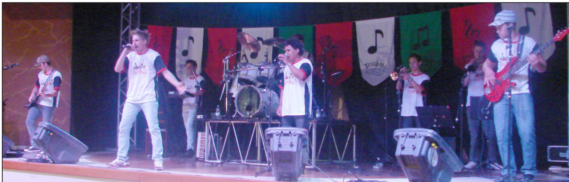
Bandas tiveram a oportunidade de fazer suas apresentações