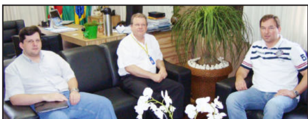
Reunião ocorreu no gabinete do prefeito

O Banco do Brasil, com uma oferta de 2,3 bilhões, foi o vencedor do leilão e irá administrar o serviço por 5 anos, a começar em 2012. Atualmente o serviço pertence ao banco Bradesco. O BB venceu uma disputa acirrada, onde concorreu com os bancos Bradesco e Caixa Econômica Federal.