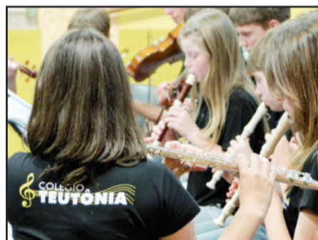
Música integra currículo do Maternal à 8ª série do Ensino Fundamental