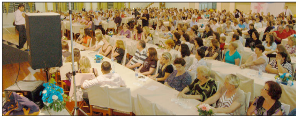
Comunidade apoia causa da Liga

A Liga Feminina de Combate ao Câncer tem sua sede junto ao Sindicato dos Trabalhadores Rurais de Teutônia e Westfália, em Languiru. O atendimento é de segundas a sextas, das 14 às 18 horas. Telefone de contato: 9160-2788 (no horário de atendimento). A entidade também aceita doações da comunidade, o que pode ser feito através de depósito bancário, desconto em conta de luz e diretamente com as voluntárias da entidade.