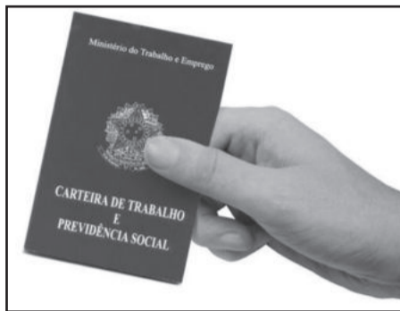
Barbosa lança programas de inserção de jovens no mercado de trabalho

Cada programa abrirá até 50 vagas, direcionadas a jovens dentro da respectiva faixa etária, matriculados na educação básica e