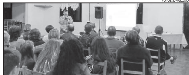
Conferência será na Casa da OASE

Uma audiência temática sobre o plano foi realizada no dia 12 de maio. Estiveram envolvidos na elaboração a Secretaria Municipal de Educação, Cultura, Turismo e Desporto de Westfália, junto de uma Comissão Organizadora. O Plano Municipal de Educação, que terá validade de dez anos, estabelece metas para que a garantia do direito à educação de qualidade avance no Município.