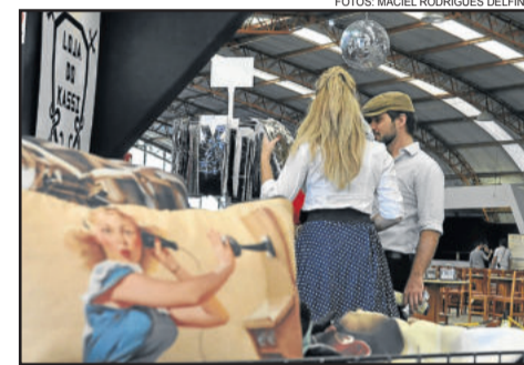
Um festival para recordar o passado