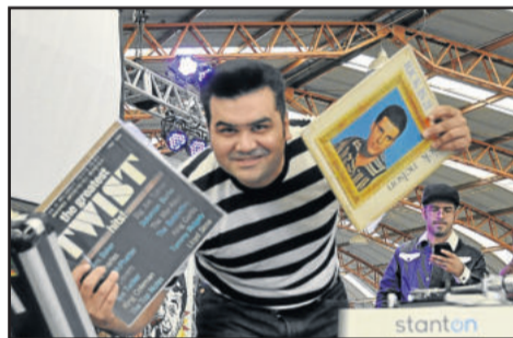
Nas pick ups, nada de cd e sim o bom e velho disco

músico foi convidado para tocar com sua banda em um festival americano no ano de 2010 e trouxe a ideia para o Sul do Brasil. A primeira edição aconteceu em Bento Gonçalves e a segunda, em Garibaldi. "Existem pessoas que já gostam disso, que já vivem disso, que já curtem a vibe dos anos 50 e 60 há vários anos. Queremos despertar novos,