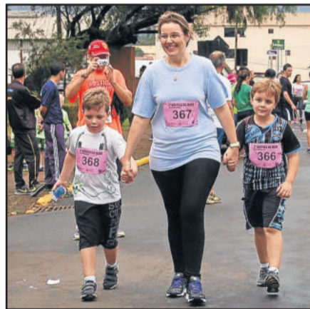
Muitos optaram pela caminhada