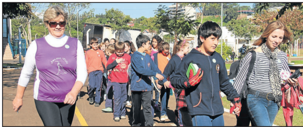
Em 2014, Estrela realizou o desafio no Parque Princea do Vale