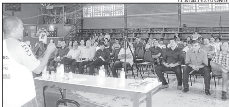
Encontro reuniu vereadores, prefeitos e comunidade em Fazenda Vilanova

“Estamos trabalhando para preparar as crianças para a vida”, assinalou o palestrante. Para participar, a criança deve, obrigatoriamente, estar estudando. E o desempenho escolar é acompanhado de perto. É um trabalho voluntário, sem apoio do poder público, que sobrevive com a venda de camisetas e doações. “Pro-