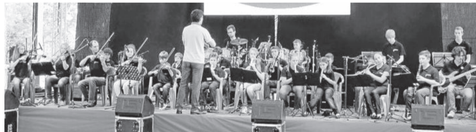
Conjunto Instrumental do Colégio Teutônia