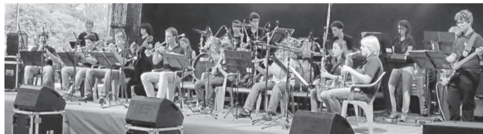
Orquestra Municipal Infanto-Juvenil 25 de Julho