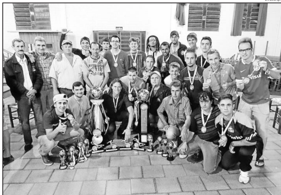
Internacional de Santa Manoela teve supremacia nos destaques