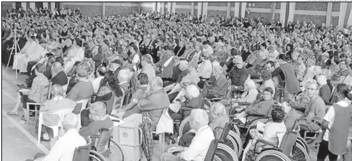
Cerca de 2 mil fiéis lotaram o ginásio da Associação Beneficente Pella Bethânia