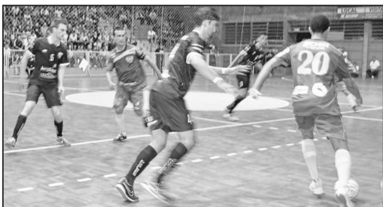
Teutônia não fez gols na pior defesa e sofreu 4 do melhor ataque