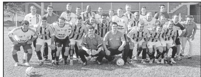
Depois do encontro, houve futebol sete entre ex-atas do Grêmio e equipe da Avat

Depois da palestra houve um jogo de futebol sete entre equipe de ex-atas do Grêmio e vereadores do Vale do Taquari.