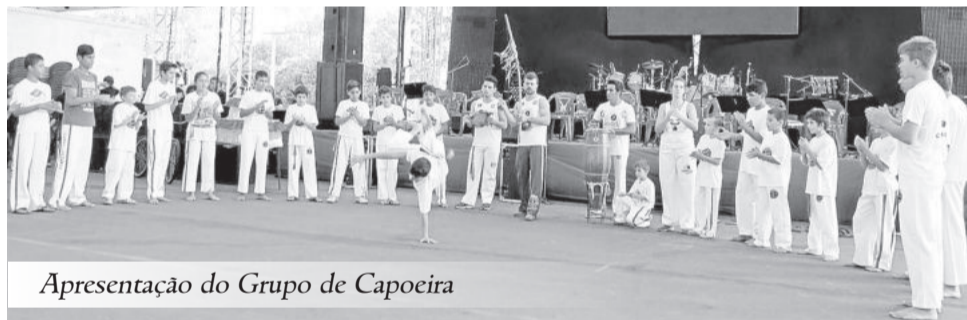
Apresentação do Grupo de Capoeira