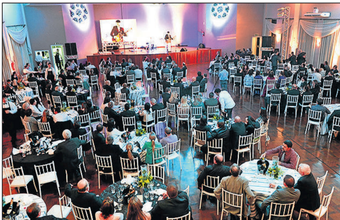
Mais de 300 pessoas participaram do jantar organizado pela CIC

aqui reunido, podendo avaliar a realidade e suas circunstâncias. Somos um município diferenciado, pois temos verdadeira união em nossas entidades, porque entendem que este é o caminho. O desenvolvimento, o trabalho e a dignidade deste povo se traduz pelas oportunidades que são criadas a partir deste entendimento”.