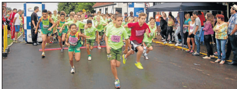
Largada para a corrida de 2 Km