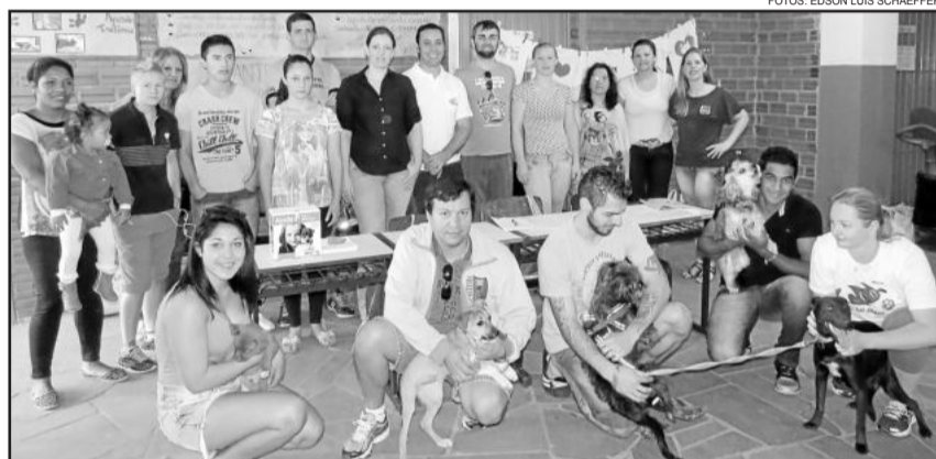
Alunos da Eja abraçaram a causa da Apante, repassando à entidade R$ 1 mil oriundos de venda de rifa

A programação do Dia da Solidariedade da Escola Reynaldo Affonso Augustin foi marcada ainda por muitas outras atividades, como: apresentações da Banda da Escola, da Orquestra do Sesi e do grupo de danças do educandário; demonstração e explanação sobre primeiros socorros pelo Corpo de Bombeiros Voluntários de Teutônia; mobilização pelo Maio Amarelo, parceria com CFC Reichert; roda de chimarrão; participação do Hospital Ouro Branco; troca-troca de livros; corte de cabelo e manicure gratuitos; aeróbica; oficina de