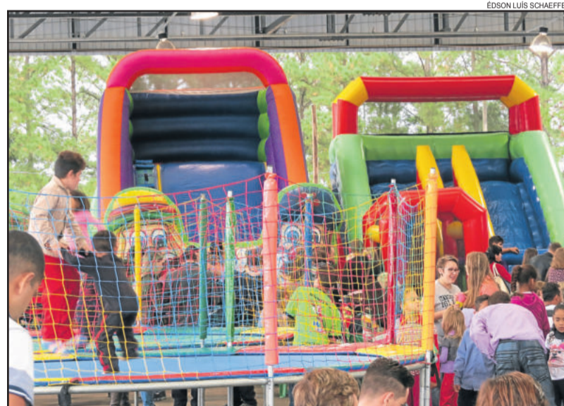
Crianças puderam se divertir com os brinquedos da Mega Park