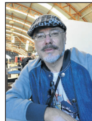
Darwin Billy Boy trouxe a ideia do festival dos Estados Unidos