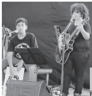
Maninho e Banda