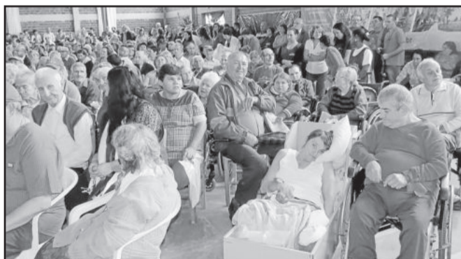
Residentes da Pella Bethânia acompanharam a celebração