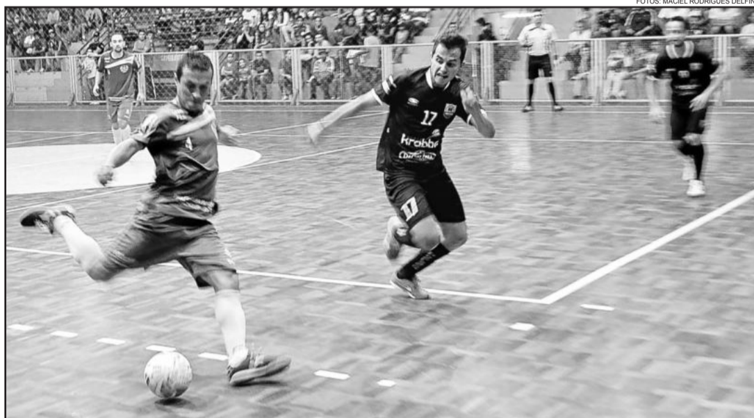
Após desperdiçar oportunidades, Teutônia Futsal foi goleada

No segundo período de jogo, a Teutônia Futsal permaneceu melhor. Encurralava o adversário em sua quadra defensiva, mas começou a apresentar falhas na marcação. Em dois lances, a bola foi lançada em diagonal, alta, nas costas do marcador, dentro da área. Nas duas oportunidades, prevaleceu a defesa de Bilica. No