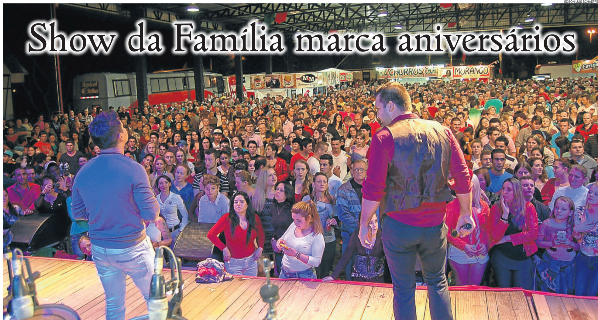
Público lotou o Pavilhão Multiuso

TEUTÔNIA ▶ 34 ANOS DE TEUTÔNIA E 26 ANOS DA POPULAR