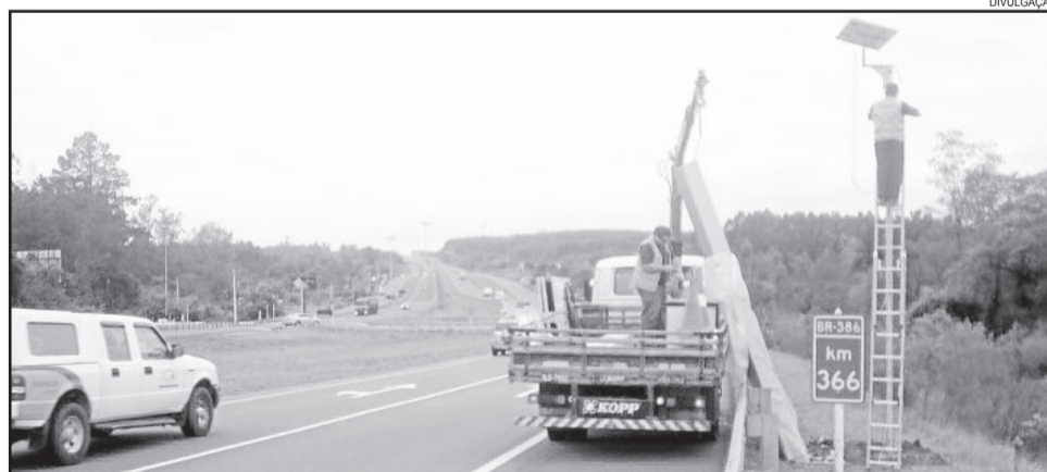
DNIT iniciou a instalação de lombada eletrônica na BR-386, no entroncamento com a Via Láctea

se contentam e argumentam que a medida ainda é paliativa. Entendem que deve ocorrer uma completa transformação do trevo/rótula para permitir um trânsito mais seguro e não comprometer o fluxo da BR-386, duplicada justamente para dar vazão ao grande tráfego diário de veículos.