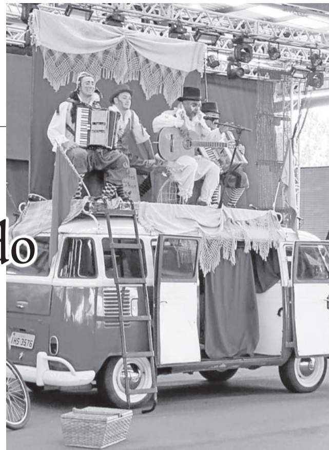
Espetáculo La Kombita