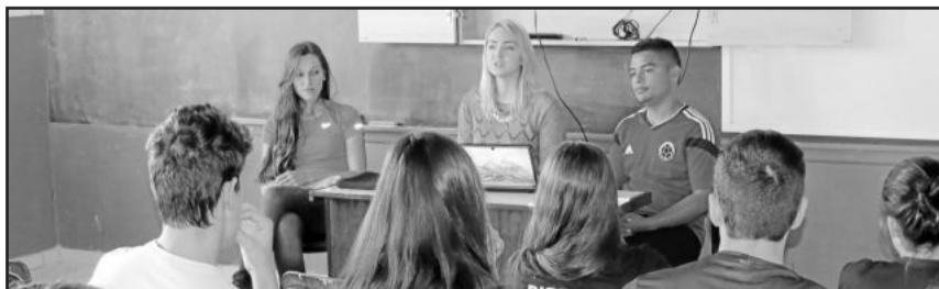
Intercambistas falaram de suas experiências no exterior