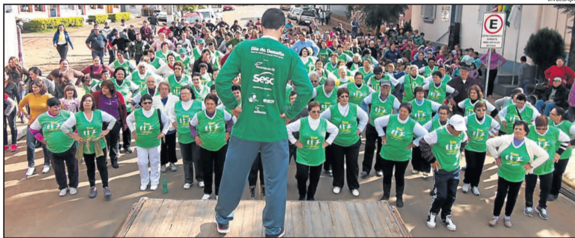
No ano passado, Paverama mobilizou 3.645 pessoas, totalizando 45% da população

Em Imigrante a atividade inicia às 8h30min em frente ao mercado Redefort, localizado no Centro da cidade. A proposta é a realização de uma atividade física e após uma caminhada pelas ruas do Centro. E administração convida todos a participar. O município competirá com a cidade colombiana de La Peña.