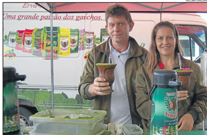
Erva-Mate esteve garantida com a Ximango