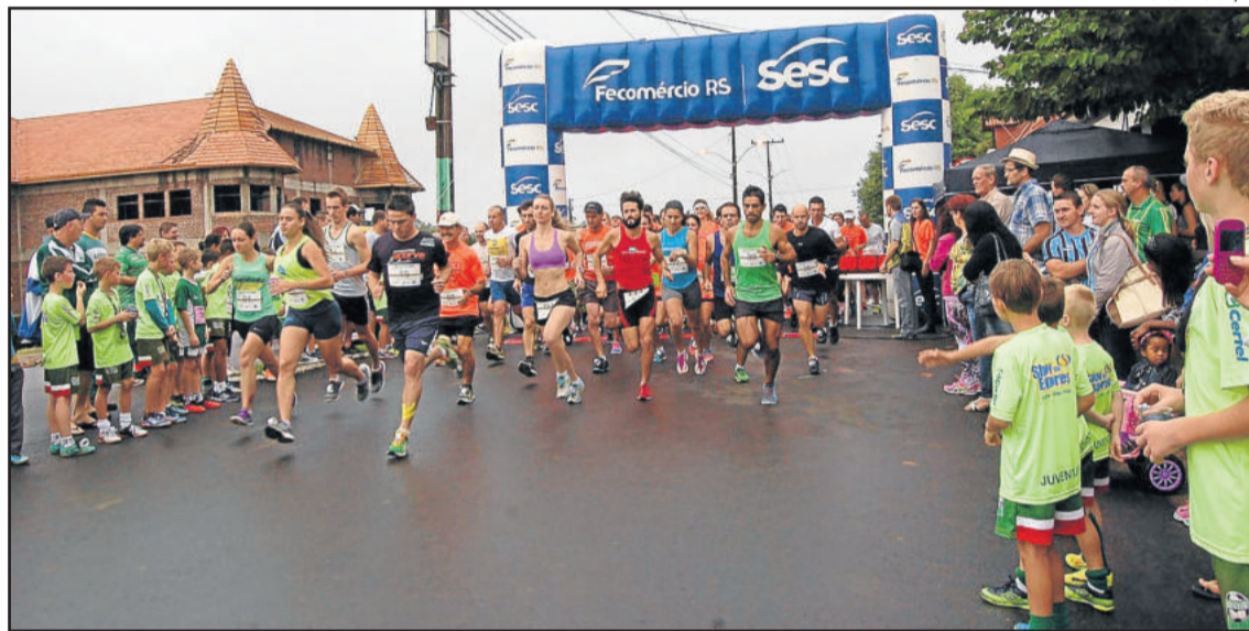
Largada para a corrida de 5 Km