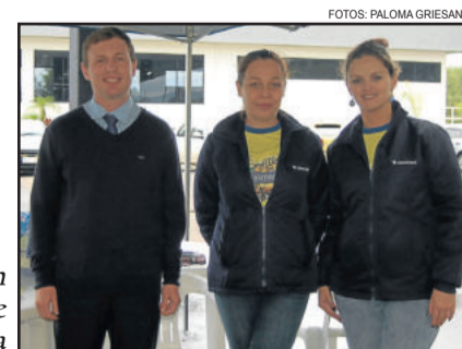
Equipe do Diersmann Assistência Familiar esteve presente no Show da Família