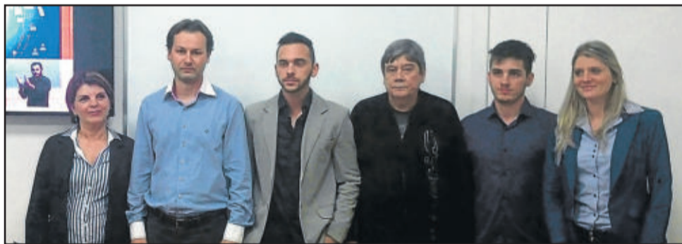
Diretores Unopar Polo Lajeado

Para os interessados em cursar uma graduação, a partir de 5 outubro abre o processo seletivo de verão 2016\1. Maiores informações pelo site unoparead.com.br ou pelo fone 3709-3145.