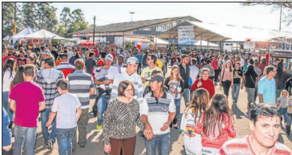
Durante quatro dias, mais de 30 mil pessoas circularam na 4ª Estrela Multifeira