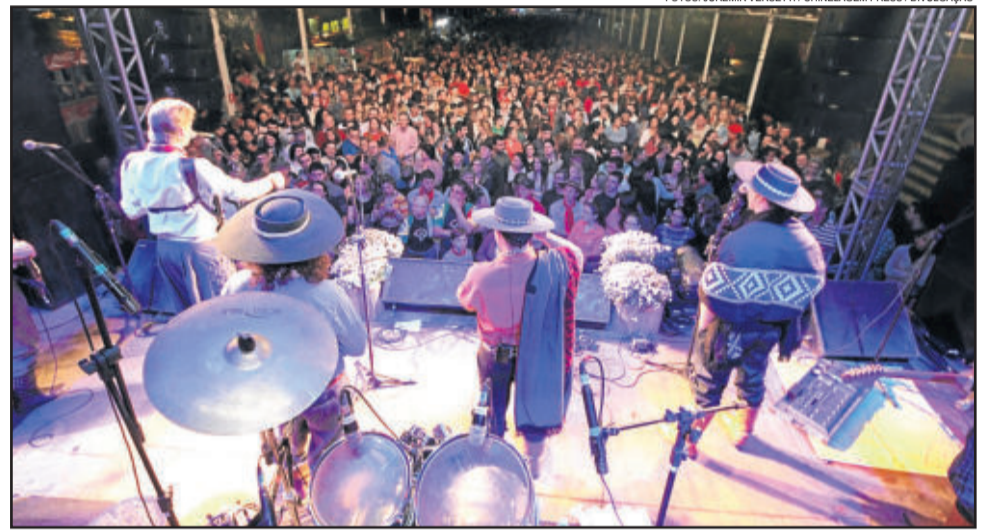
Shows nativistas reuniram grande público