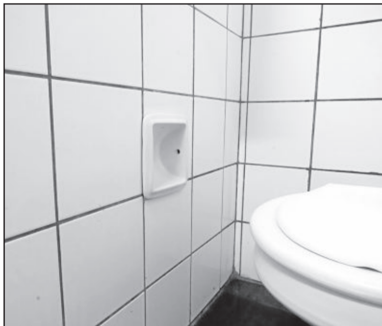
Nos banheiros da escola Reynaldo Affonso Augustin é possível ver a falta de materiais de higiene

Uma notícia no dia de ontem, sexta-feira, trouxe certo alívio para hospitais, prefeituras, fornecedores e órgãos do próprio Estado. A Secretaria da Fazenda confirmou o pagamento de parte das pendências, algumas com atraso há mais de dois meses. É o caso da verba para autonomia financeira das escolas, que terá o repasse de R$ 8,6 milhões referentes a julho. A Fazenda decidiu igualmente quitar R$ 22 milhões da parcela de agosto da chamada dívida interna e reservou outros R$ 18 milhões para fornecedores diversos. Ao todo, serão pagas despesas que, somadas, alcançam R$ 75 milhões.