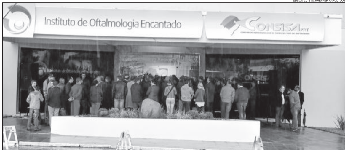
Maior parte do valor é referente a repasse para o Centro Oftalmológico em Encantado, reinaugurado no ano passado