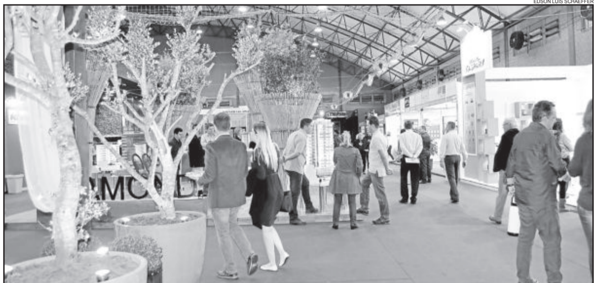
Construmóbil 2015 foi aberta oficialmente na noite de terça-feira

As propostas dos arquitetos e seus parceiros na Mostra Arquitetura & Design da Construmóbil 2015 surpreendem os visitantes. O espaço localizado no