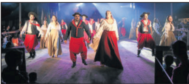
Grupos demonstraram o amor pela cultura gaúcha através da dança