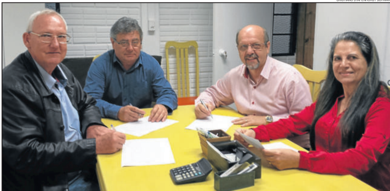
Parceria entre Languiru e Westfália foi registrada em cartório