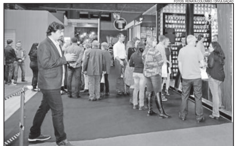
Construmóbil segue até amanhã