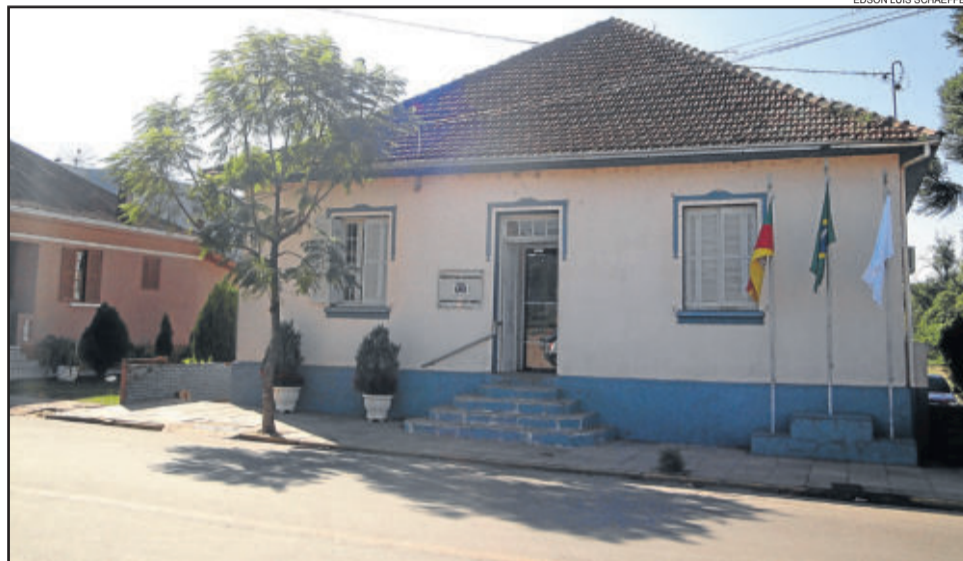
Em Paverama, Prefeitura anuncia exoneração de 11 CC's

O prefeito não citou quais CC's serão exonerados. Ao que tudo indica, os ocupantes desses cargos devem ser informados primeiramente da decisão do Executivo. Além disso, a Administração Municipal já vem trabalhando, há algum tempo, somente com três secretários: Educação, Saúde e Administração. "O vice-prefeito está coordenando a Secretaria de Agricultura, para não deixar esta pasta desassistida", afirmou.