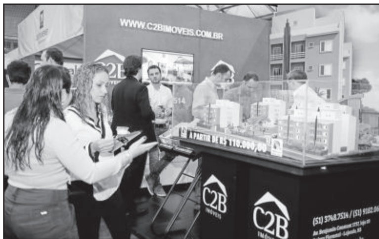
Mostra Arquitetura & Design exhibe tendências em decoração de interiores

E ontem, sexta-feira, um dos eventos técnicos teve como tema "Como a Arquitetura Sustentável pode mudar o Mercado de Imóveis". A atividade ocorreu das 14 horas às 15h30min, no Salão de Eventos da ACIL. Depois, outro evento foi realizado no mesmo local. A programação teve como tema "Decoração de Interiores em um Programa de TV".