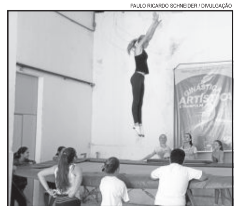
Ginástica de trampolim é um dos projetos sociais da secretaria