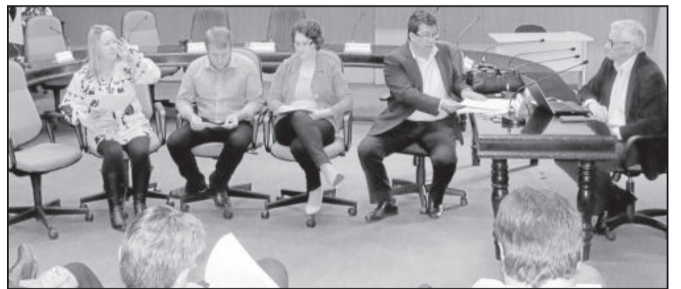
Um dos assuntos da reunião do Corepe foi a Via Láctea

O Corepe lamentou que as afirmações feitas na reunião, bem como as do primeiro encontro do ano com a atual gestão, foram de forma oral e não documentada. “Via Láctea, para nós, era um tema resolvido no ano passado, com tudo encaminhado. Vimos na rodovia um conceito de região, por ser