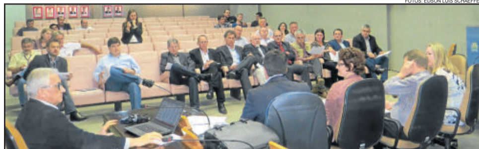
Reunião do Corepe ocorreu em Lajeado nesta quarta-feira

creditada com obras no local. Hoje, toda a população de Muçum e da região agradece por este investimento. A travessia ficou muito mais segura", salientou.