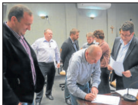
Obras em Encantado também foram autorizadas