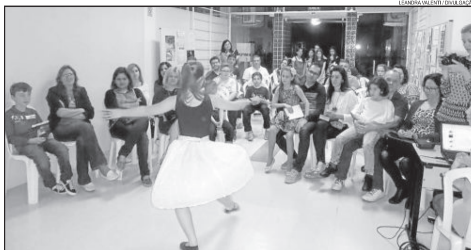
Sarau Literário contou com apresentações de canto, dança e poesia

Para o próximo ano, a comissão organizadora pretende manter a Semana da Biblioteca em setembro, junto ao aniversário da Biblioteca. A ideia é unir as duas celebrações. "Pensamos em, agora, sempre dar segmento, procurando unir com o dia 26, senão antes, depois ou durante, conforme as possibilidades, para que a gente possa, além de fazer toda a programação da Biblioteca para a comunidade, também estar comemorando o aniversário da Instituição", su-