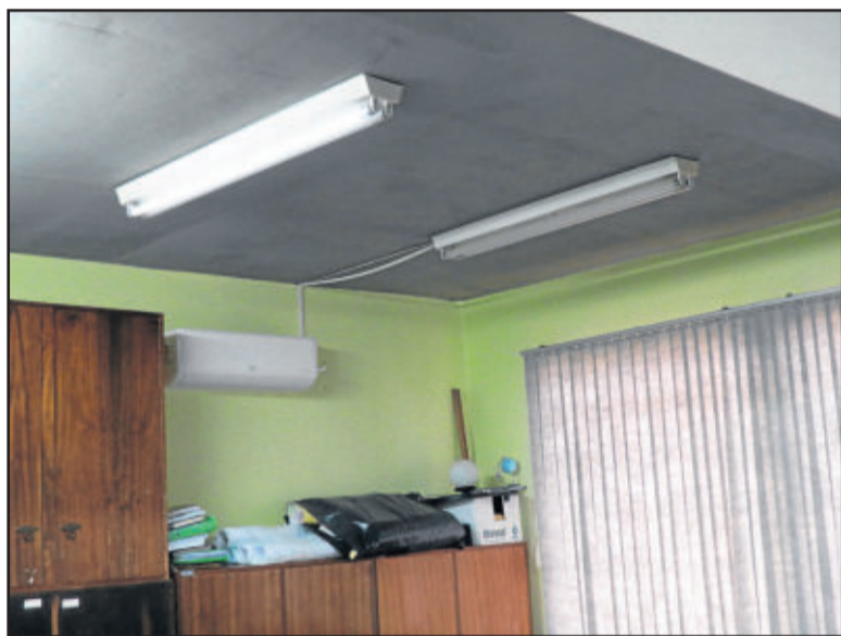
Lâmpadas queimadas na escola aguardam verbas do governo para serem trocadas

Todavia, na EEEM Reynaldo Affonso Augustin, a dificuldade continua e este mês não resolve os problemas. A realidade assusta a direção, os alunos e os professores. Mesmo com o depósito feito nesta semana, a escola