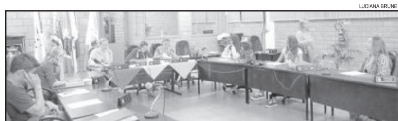
Câmara Mirim realizou encontro ordinário