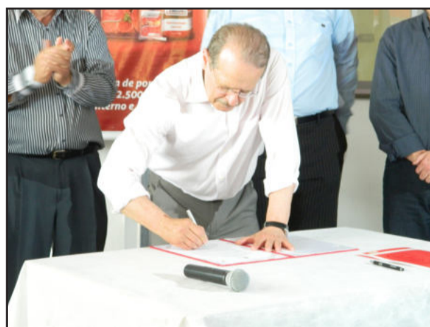
Tarso Genro assinou o documento de empréstimo entre o BRDE e a Cooperativa Languiru

Após a visita ao frigorífico, Tarso Genro e sua comitiva seguiram a Arroio do Meio, onde o governador conheceu o mais novo empreendimento da Cooperativa Cosuel, Dália Alimentos, inaugurado há cerca de 2 meses. É a fábrica de leite em pó da cooperativa.