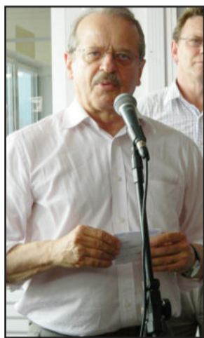
Governador do Estado, Tarso Genro, visitou ontem o Vale