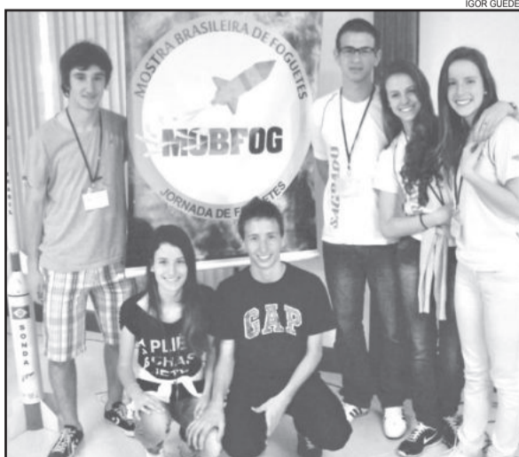
Alunos participaram da IV Mostra de Foguetes