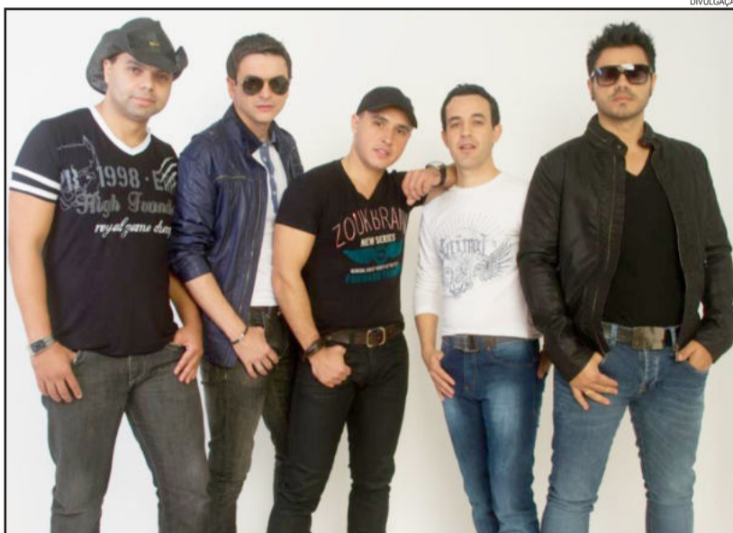
Tchê Garotos se apresenta na noite do dia 16 de novembro

O show é mais uma atração confirmada para o evento que tem início no dia 9 de novembro e se estende até o dia 18. Além do Tchê Garotos, estarão na multifeira Raça Negra, Patati Patatá e Família Lima. Ainda acontecerá a gravação do Galpão Crioulo e o Festival de Música da Univates. A comissão organizadora deve divulgar nos próximos dias mais dois shows.