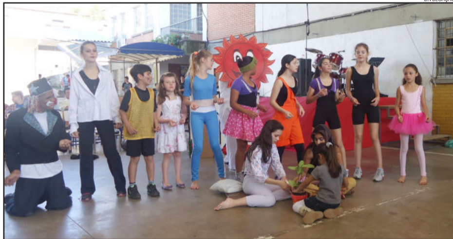
O teatro foi encenado no dia 20 de outubro na EEEM Reynaldo Affonso Augustin em Teutônia, na Feira do Livro

Às 16 horas, no Memorial do Rio Grande do Sul - térreo, na Feira do Livro de Porto Alegre, inicia a