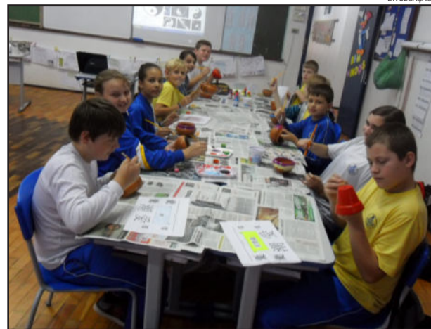
O objetivo é valorizar os trabalhos dos alunos