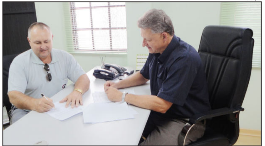
Município assinou contrato com empresa para construir novo Posto de Saúde no Bairro Teutônia

terá 193,15 metros quadrados, com estrutura de qualidade semelhante às construídas pelo governo no Loteamento 8 e no Bairro Boa Vista. Haverá rampa de acesso a deficientes, sala de espera, recep-