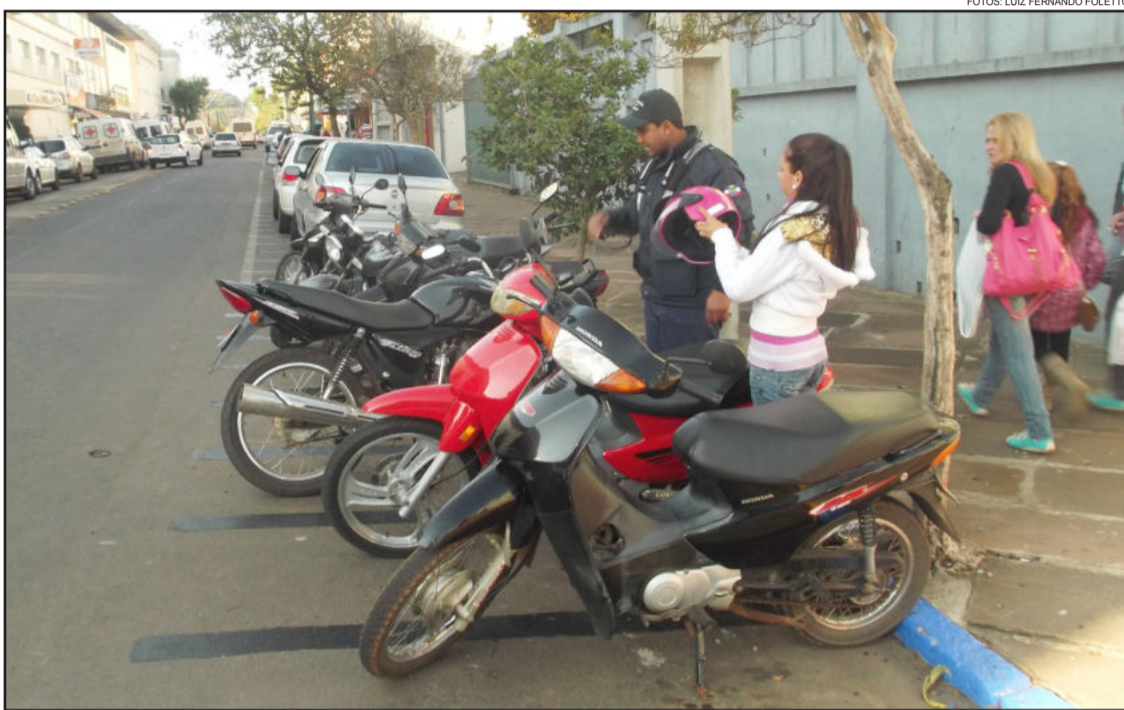
Motocicletas foram os veículos mais furtados no último mês em Lajeado

A maioria dos furtos e roubos que aconteceram em Lajeado no último mês foi de motocicletas. Um dos motivos, segundo o delegado, é que esse tipo de veículo é mais fácil de ser furtado em relação aos outros. Outro indício é que esses veículos são utilizados para fazer trilhas, onde o primeiro passo do criminoso é raspar o