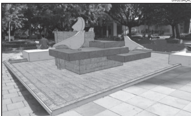
Simulação - Cooperativa homenageada com a instalação de uma fonte d'água na Praça

Ainda não há data definida para a entrega da obra, mas a expectativa é que até o final do ano a fonte esteja em funcionamento.