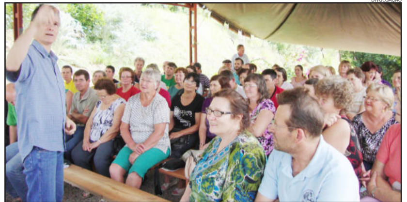
Durante a tarde foram realizadas palestras

O evento foi organizado pela equipe da Emater/RS Ascar de Imigrante, com o apoio do Banrisul e Sicredi.