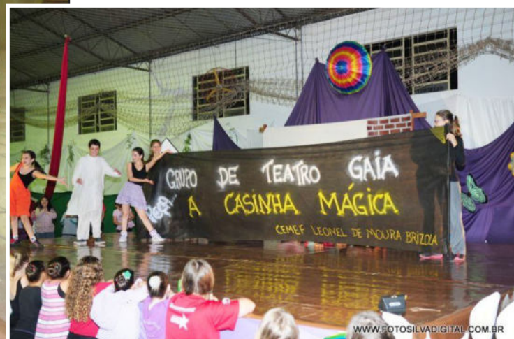
Painel do Grupo de Teatro Gaia