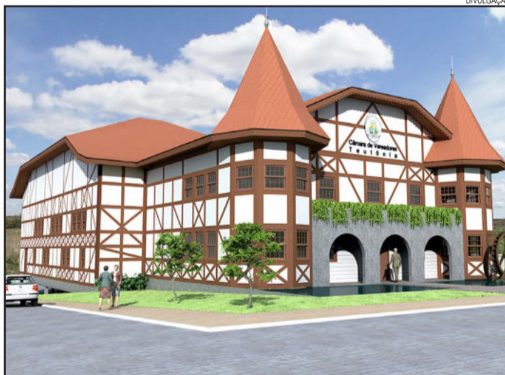
Projeto da futura Câmara de Vereadores de Teutônia

Apesar do estilo enxaimel, a arquitetura moderna estará presente respeitando questões ambientais, por meio do reaproveitamento de água das chuvas. O plenário será em forma de arena e haverá estacionamento subterrâneo, disponibilizado aos funcionários públicos a fim de liberar espaço no Centro Administrativo. Com a construção da sede própria, o Legislativo devolverá ao Executivo as três salas atualmente utilizadas das dependências do Centro Administrativo.