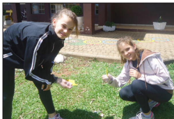
Recolhendo lixo no pátio do Cemef