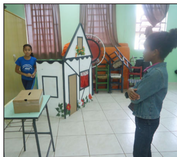
Eleições Grêmio Estudantil do Cemef