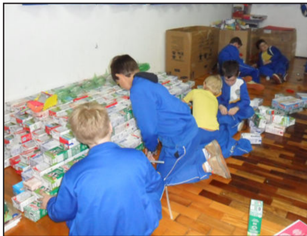
Alunos realizam 3ª Mostra de Trabalhos

Neste sábado, dia 27, a feira abre às 8h30min e poderá ser visitada até às 11 horas. A Mostra apresenta trabalhos variados dos alunos do jardim até 8ª série. Durante a Mostra também será escolhido o aluno destaque de cada matéria.