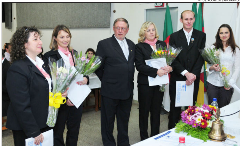
Novos membros foram recebidos com alegria

A homenageada com o Prêmio Lions Educação foi a professora, doutora em Educação,