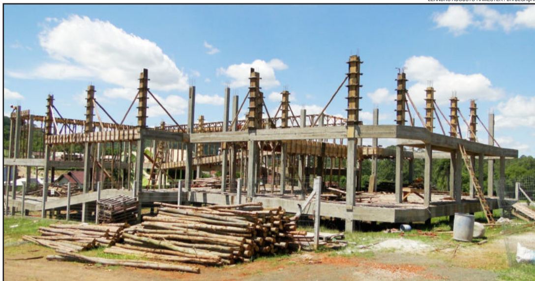
Segunda etapa das obras foi iniciada no final do mês de junho

A pós a retomada no mês de junho, seguem as obras de construção da nova sede da Câmara de Vereadores de Teutônia. Nesta segunda etapa serão executadas as escadas internas e externas, a estrutura total da edificação, exceto fundação.