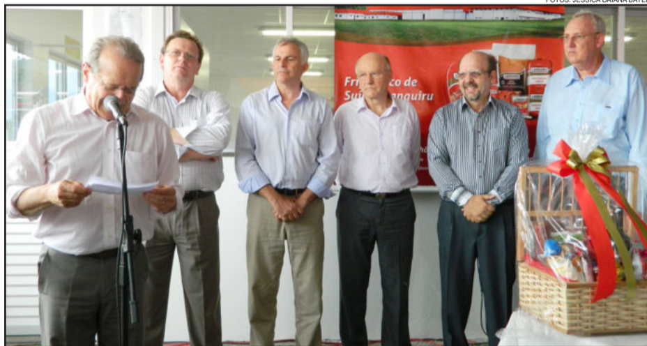
Tarso acompanhado de sua comitiva visitou o Frigorífico de Suínos da Languiru

Para o governador do Estado, a visita tinha um propósito de agradecimento. "Na verdade, venho aqui também para agradecer. Agradecer ao trabalho prestado nas pequenas propriedades rurais por esta cooperativa, que é modelo de trabalho no Rio Grande do Sul", salientou Tarso Genro. Ele ainda aproveitou o momento para dizer o quão impressionado estava com a toda a estrutura do frigorífico. "Represento neste ato todo o povo gaúcho e quero manifestar meu agradecimento e reconhecimento pelo trabalho realizado pela Languiru. Trago aqui também minha admiração pela direção da Cooperativa Languiru, a qual é exemplo em nosso Estado e que compõe um molde de organização", ressaltou o go-