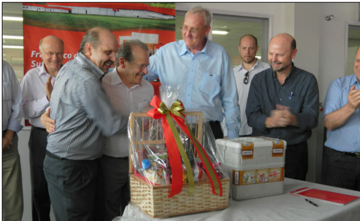
O governador do Estado recebeu da direção da Languiru os produtos fabricados pela cooperativa