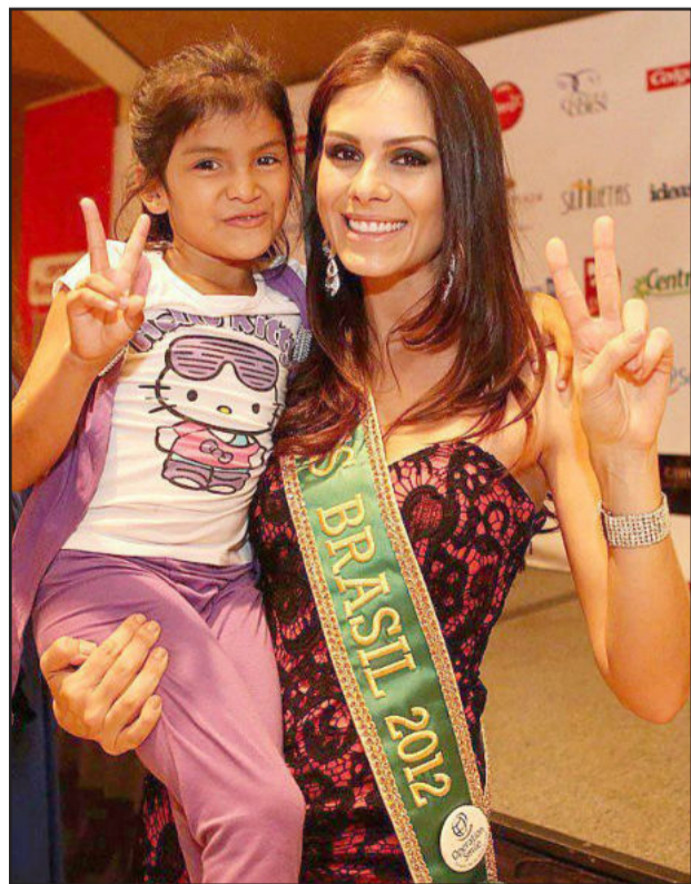
A oportunidade de interagir com as crianças