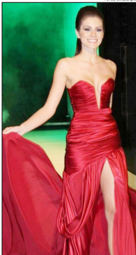
A Miss Brasil na passarela