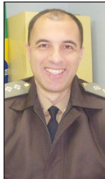
Urquia destaca que a violência é uma realidade e que a população deve adotar práticas que inibam ações de criminosos