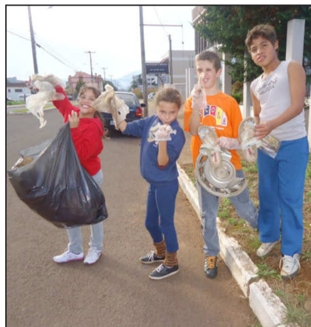
Recolhendo lixo na avenida em Teutônia

Mensagem final: Pense que aqui na escola você tem a sua comida de graça, coisa que muitas crianças não têm acesso e que muitas delas gostariam de ter.