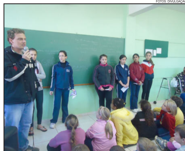
Assembleia para o GEC

Relato: o GEC surgiu da necessidade que os alunos estavam apresentando. O grupo pertence a turma de 6ª a 8ª série do turno inverso do Cemef. Ele está sob a coordenação de dois professores. Primeiramente houve um estudo, na internet, de organização do Grêmio, bem como todas as suas diretrizes, de todos os integrantes. Segundo, houve assembleia com toda a comunidade escolar informando as questões do Grêmio. E em terceiro momento, aconteceu a votação das chapas 1 e 2, sendo a chapa de nº 1 a vencedora. Como estamos em fase inicial de atuação, as áreas cultural, social e de imprensa são as que mais estão em atuação. O Teatro "A Casinha Mágica" está no auge de suas apresentações, difundindo as questões ambientais e sociais.