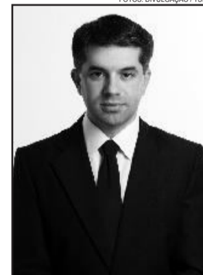
Prefeito Emanuel Hassen de Jesus, o Maneco