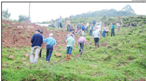
Foi realizada uma tarde de campo