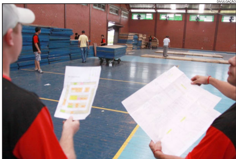
Estados começam a ser montados no parque do Imigrante

A Expovale acontece no Parque do Imigrante, em Lajeado, entre os dias 9 e 18 de novembro de 2012. Tem patrocínio da Vonpar e Unimed VTRP, e conta com o apoio do Banrisul, Randon, Caixa Econômica Federal, Banco do Brasil, Corsan e Distribuidora de Produtos de Petróleo Charrua.