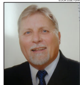
Prefeito de Estrela Celso Brönstrup

Os vereadores estiveram reunidos em sessão ordinária na noite da quinta-feira, dia 18 de outubro, quando aprovaram os seguintes projetos de lei do Executivo: que institui o Programa de Recuperação de Créditos (Refis Municipal), decorrentes de pessoas físicas e jurídicas, constituídas ou não, inscritas ou não em dívida ativa, ajuizados ou a ajuizar, com exigibilidade suspensa ou não, inclusive os já parcelados, vencidos até 31 de dezembro de 2011, decorrentes IPTU, ISS, Contribuição de Melhoria ou Tarifas; que autoriza a celebração de contrato de mútua parceria com a Sociedade Esportiva União para promoção de eventos nas dependências do Ginásio de Esportes Júlio César Redecker, de Boa Esperança; que autoriza a suplementação de recursos por redução de verba, no valor de R$ 84,7 mil; e que autoriza criar contas de despesa e suplementar recursos, no valor de R$ 8 mil para Secretaria de Saúde e Assistência Social. A próxima sessão ordinária da Câmara de Vereadores de Paverama ocorrerá 1º de novembro, a partir das 19 horas.