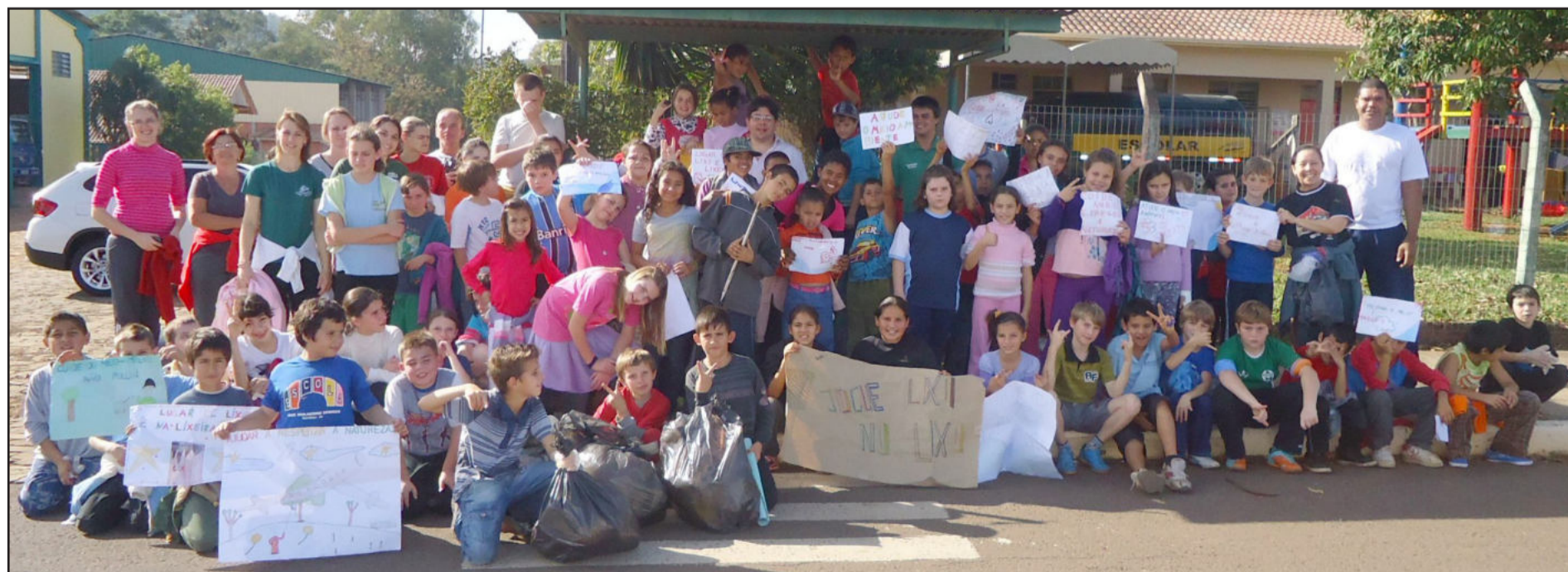
Cemef e Apae na caminhada meio ambiente