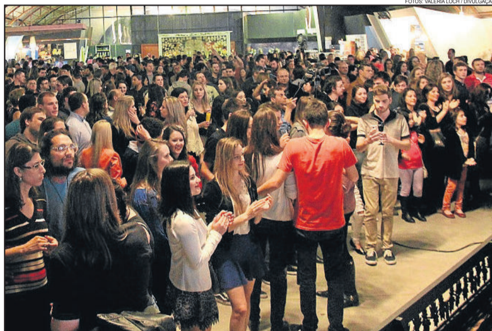
Público lotou o Parque da Fenachamp na sexta-feira

Realizado no dia 3, primeiro sábado da Fenachamp, o sabrage reuniu 365 participantes, que realizaram com sucesso a degola de 349 garrafas de espumante, ultrapassando a marca de 277 degolas registrada na última edição da festa.