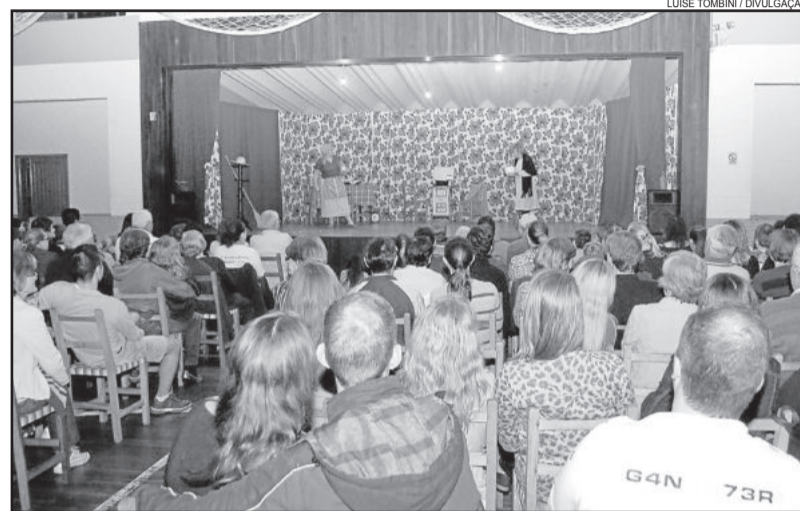
Estreia foi na noite de sexta-feira

O grupo se apresentará na festa dos servidores de Boa Vista do Sul na próxima quinta-feira, dia 29, e no dia 6 de novembro, às 20 horas, junto à Feira do Livro de Imigrante. A direção do espetáculo é de Marcelo Brentano.