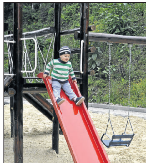
Crianças já aproveitavam o parquinho antes mesmo da inauguração

Ainda no sábado, duas inaugurações marcarão as festividades de aniversário: pavimentações asfálticas nas ruas Antônio Grigoletto e João Prancutti. Já no domingo, dia 25, houve a inauguração da primeira ciclovia de Garibaldi. A programação do aniversário de Garibaldi segue até o próximo sábado, dia 31, data em que o Município celebra, de fato, seus 115 anos de história.