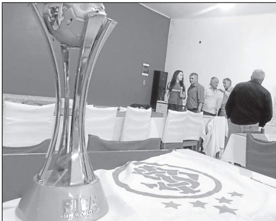
A réplica da Taça do Mundial Fifa foi levada ao evento