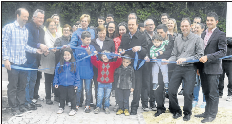
Autoridades e comunidade participaram do ato inaugural, na manhã de sábado