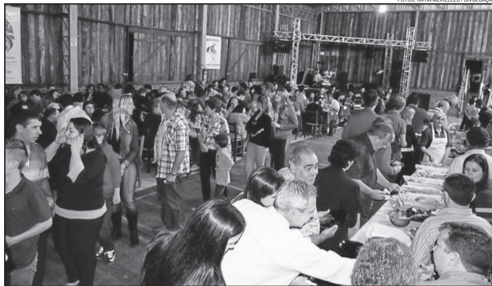
O salão do CTG ficou lotado de apreciadores do produto

O jantar baile faz parte de uma das ações do Projeto “Tem Peixe na Fazenda”, da Administração Municipal com a Emater. O programa, criado em 2013, busca diversificar a produção nas pequenas propriedades rurais, a partir do incentivo à criação de peixes. A intenção é promover a oferta de um produto de qualidade, capaz de agregar valor para os produtores do Município. “Hoje, são comercializadas cerca de 50 toneladas de pescados por ano,