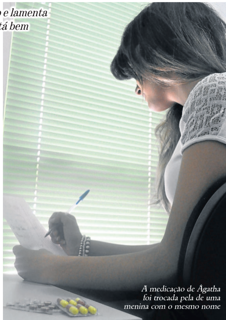
A medicação de Ágatha foi trocada pela de uma menina com o mesmo nome

Lagemann finaliza dizendo que é lamentável, mas situações do gênero ocorrem em nível internacional. "Isso faz com que surja a necessidade de criar novas comissões e normas de segurança", finaliza.