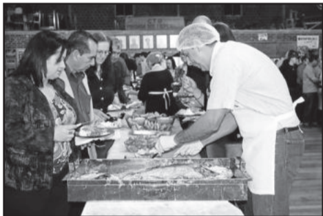
Cardápio variado foi elogiado pelo público

Cerca de 400 pessoas foram atraídas para o evento, que teve como objetivo incentivar