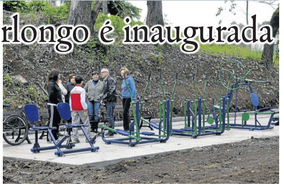
Academia de ginástica ao ar livre é outro atrativo para a comunidade

Cettolin observou que comunidades que pedem por obras demonstram que querem construir algo, fazer mais pelo Município. “Não vamos parar de lutar. Acreditamos que é possível. Aos poucos vamos construindo”, ressaltou o prefeito. O chefe do Executivo solicitou empenho da comunidade do Bairro Peterlongo para que todos cuidem do novo ambiente. “Queremos que as crianças e os adultos usufruam deste espaço e, assim como eu, sintam orgulho de morar em Garibaldi”, pontuou.