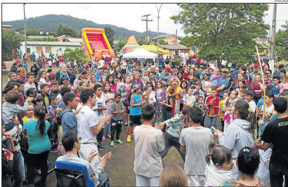
Evento reuniu centenas de crianças e adultos

O evento teve o apoio de Rotary, Lions, Apante, Liga Feminina de Combate ao Câncer, Apae, CRAS, PIM, Grupo Oxósse de Capoeira, Juventus, ASTF, Biglu e Jéssica, Bombeiros Voluntários, Orquestra 25 de Julho, CEMEF, escolas municipais, Grupo Escoteiros Desbravadores, Univates, Balas Florestal, Mercado Center, Super Link, Ximango e Liquigás.