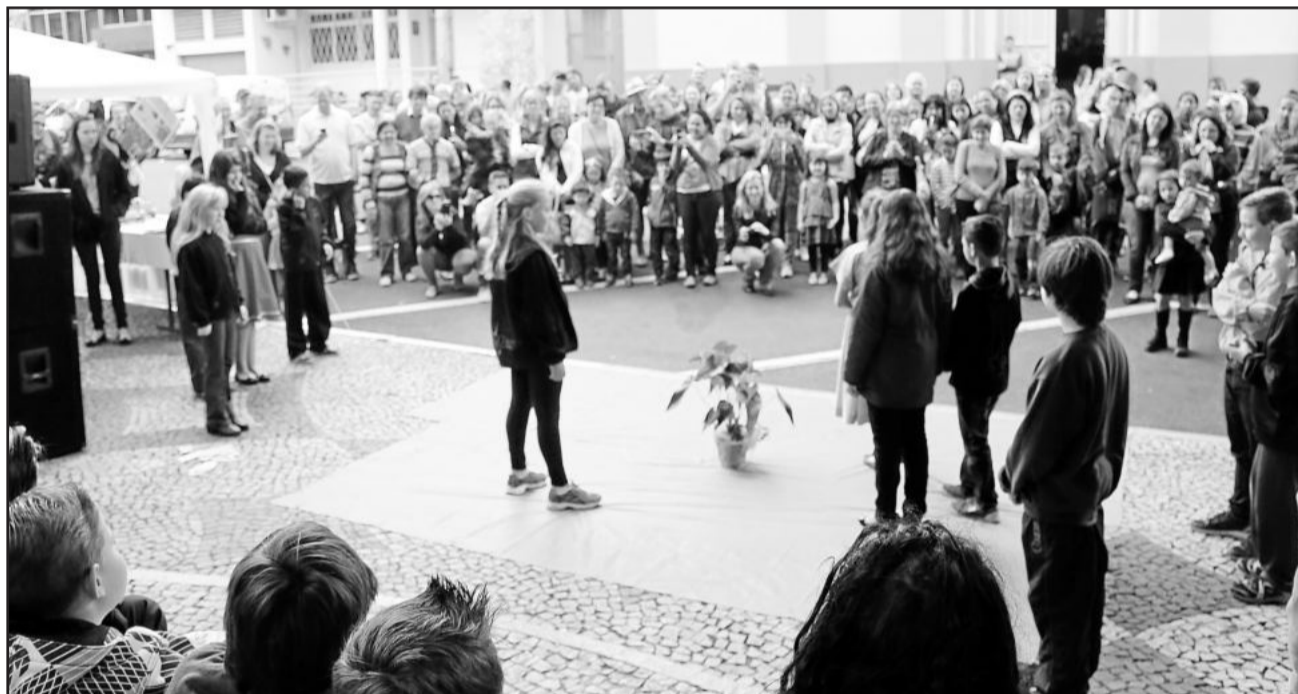
Abertura do evento contou com apresentações artísticas

Além disso, o Educação na Praça foi complementado com vivências pedagógicas pelas escolas, como a EMEF Leo Joas, EMEF José Bonifácio, EMEF Arnaldo J. Diehl, EMEF Cônego Hugo Wolkmer e EMEF Pinheiros. A turma do Sítio do Pica-Pau Amarelo contou histórias para as crianças, que também puderam fazer pinturas. Houve pintura no rosto, violão e gaita, rodas cantadas, tapete das histórias e “Vale um Abraço”. No espaço da Biblioteca Pública Municipal, jogos e livros infantis foram colocados à disposição dos baixinhos, assim como o “Biblioteca ao Seu Lado”, iniciativa pela qual as pessoas podem levar para casa obras dos mais diferentes gêneros literários.