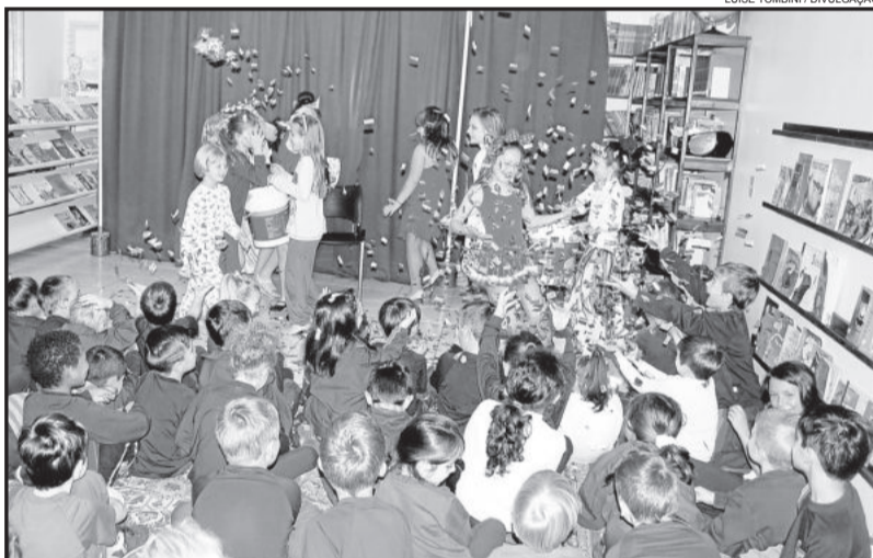
Grupo Teatral interagiu com as crianças da escola

Formado por crianças de sete a dez anos, o Façarte Jr ensaia semanalmente e faz parte dos grupos da Associação Cultural de Imigrante.