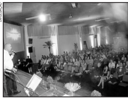
Edição deste ano do Reload Sindilojas reuniu cerca de 500 pessoas

Um dos principais eventos de capacitação regional já tem sua programação definida para a edição de 2016. O Reload Sindilojas, que chega a sua quarta edição, vai ocorrer no dia 7 de abril no Clube Tiro e Caça, em Lajeado. Um novo formato, mais dinâmico e com ainda mais informações